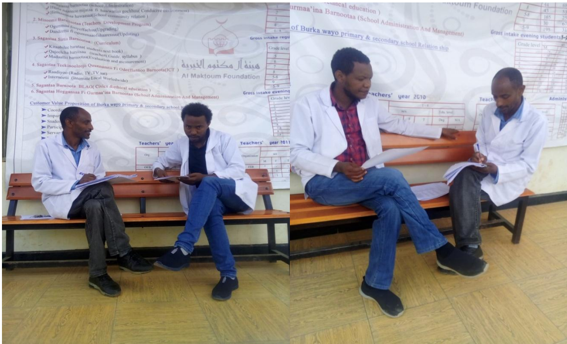
Suura 2: Gaafa guyyaa 9/09/2011 af-gaaffii barsiisota Afaan Oromoo: Guutamaa Dheeressaa Fi Biraanuu Jibaat waliin af-gaaffii taasifame.

6. Barattoonni barreeffama Afaan Oromoo hubannoon dubbisuufi gilgaalota dubbisa wajjiin walqabatan hojjechuurratti kaka'umsa akkmii qabu? Gaaffii jedhuuf, barattoonni gilgaalota dubbisaa hojjechuuf baay'een isaanii kaka'umsa guddaa qabu jechuudhaan deebisan. Tarsiimoowwan dubbisuu gara garaatti fayyadamuudhaan hubannaan dubbisuurratti baay'een isaanii hir'ina akka qabanitti yaada isaanii ibsan. Barattoonni murtaa'aan garuu muuxannoo hubannoon dubbisuu, gargaarsa barsiisotaa iddoowwan duraan turaniifi deeggarsa maatii isaanii gargaaramuun Afaan Oromoos qixa barbaadameen dubbisanii kan hubatanis jiraachuu barattootaa heeruu barsiisotaarraa hubatameera. Irra caalaatti barattoonni hedduun kaka'umsa keessoo qabaachuun isaaniin waggoota 1-2 gidduutti barreeffama Afaan Oromoo hubannaan dubbisanii hubachuu danda'uu isaanii yaada barsiisonni kennaniifi qormaata isaan hojjetan irraa hubachuun danda'ameera. Fedhiifi kaka'umsi keessoo barachuu barattootaaf murteessaadha.