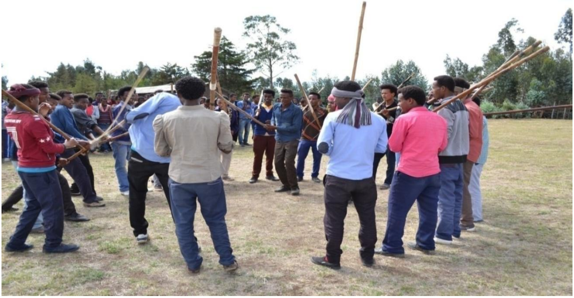
Suura 3- Rukkuttaa shimalaa jalaa ol gaggeeffamu

B.Rukuttaa Shimalaa Irraa Gadi Gaggeeffamu-Dhiichisa keessatti shimalli irraa gadi akkasumas humnaan guutamee akka rukutamu hineeeyyamamu.Qaamni irraa gadi ta'ee human fayyadamuun shimala rukute yoo shimala rukute cabsuu baatellee itti gaafatama.Kanaafuu dargaggoonni dhiichisa taphaaf gaggeessan keessatti shimala irraa gadi hinrukutan.Garuu walitti bu'iinsi gidduu isaanii jira yoo ta'e shimala irraa gadi rukutuun lolaaf qophaa'uu isaanii walakeekkachiisu.Walakeekkachiisuu qofas osoo hintaane shimalaan hanga walreebuuttis gahuu malu.Kanaafuu rukuttaan shimalaa irraa gadiifi humnaan guuttame walittibu'iinsi gidduu hirmaattota faaruu shimalaa yoo jiraate qofa gaggeeffama. (Madda:Obbo Damissee Muummichaa 21/03/09fi Obbo Baqqalaa Fayyisaa 19/04/09 waliin afgaaffii taasifameefi daawwannaa 11/05/09 taasifame gaggeeffame)