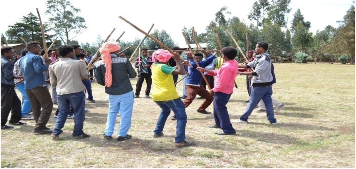
Suura 4- Rukkuttaa shimalaa irraa gadi gaggeeffamu

Akka ragaan afgaaffiifi daawwannaan taasifame ibsutti,dhiichisa keessatti rukutta shimalaa kan jalaa oliifi suuta gaggeeffame akkasumas kan irraa gadiifi human dabalachuun gaggeeffame jedhanii adeemsa ramaduu keessatti rukuttaan shimalaa jalaa oliifi suuta gaggeeffame ergaa taphaa/walii galtee kan dhaamu yoo ta’u rukuttaan shimalaa irraa gadiifi human dabalatee dhiyaate ergaa walitti bu’iinsi jira jedhu kan akeeku ta’uu yaada olitti kennamerraa hubachuun nidanda’ama.