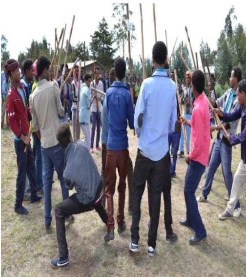
Suura 2- Akkaataa qabannaa shimalaa wayita shimalli rukkutamu