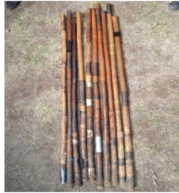
Suura 5- Shimala Toleefi shiboon irra marame