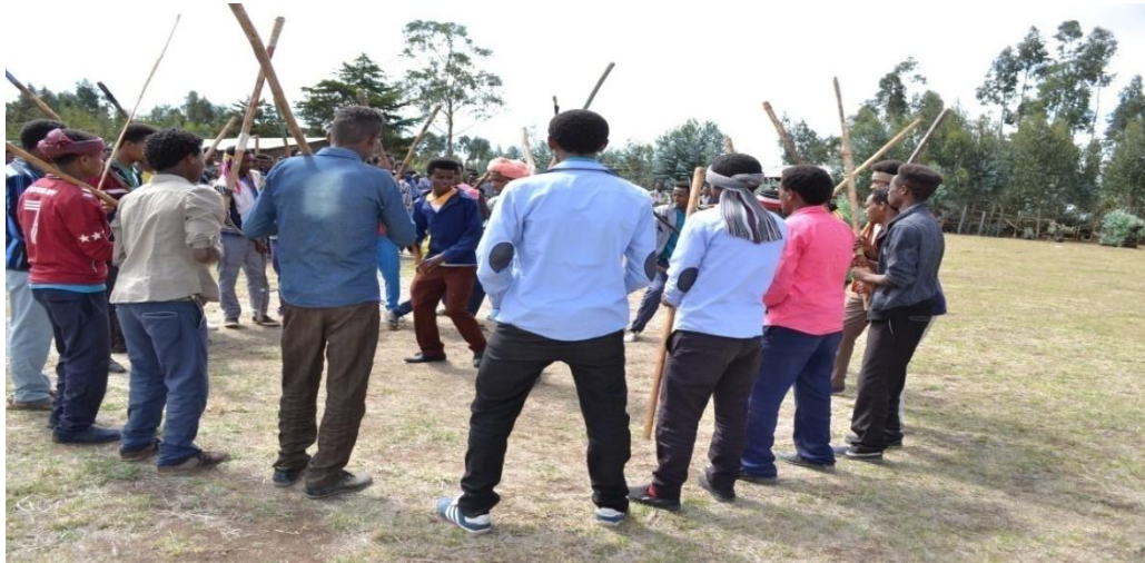
Suura 6- Amala geengoon dhiyaachuu faaruu shimalaa dhiichisaan

Akka yaada iddattoota oliirraa hubatamutti faaruu shimalaa bifa dhiichisaan dhiyaatu dhuunfaan ykn cimdiin baasuun kan danda'amu yoo ta'u,adeemsa cimdiin baasuu keessatti qaamoleen waliin baasuu barbaadan iddoo adda addaa dhaabbachuun inni tokko baasuu yoo eegalu inni waliin baasuu barbaade itti deemuun walqabatanii baastota dhiichisaa ta'u.