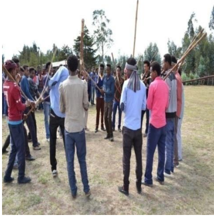
Suura 4- Rukkuttaa shimalaa jalaa ol gaggeeffamu