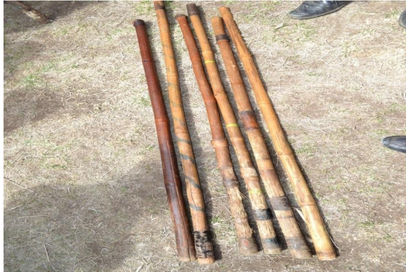
Suura 9 – Shimala haanxa’aa

Gama hawaasummaan is afwalaloon “Yaa dargoo walirraa tamarraa”jedhu,qeerroon adee msa jiruufi jireenya isaanii gaggeessuu keessatti hojiilee adda addaa haadhaafi abbaarraa qofa kan baratu osoo hintaane adeemsa waliin hawaasomuu keessatti dabaree dabareen waldhaalchisaa kan deemu ta’uu agarsiisa.