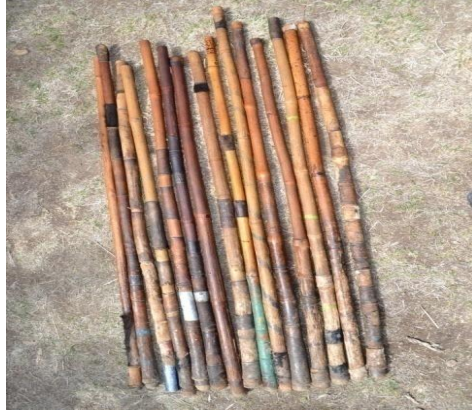
Suuraa 1- shimaloota

Suuraalee Keessa Qorannootti Argaman Waan Isaan Agarsiisa Waliin