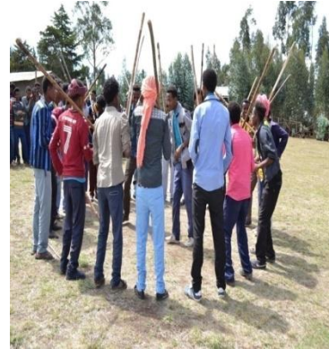
Suuraa 7-Hirmaattota faaruu Shimalaa