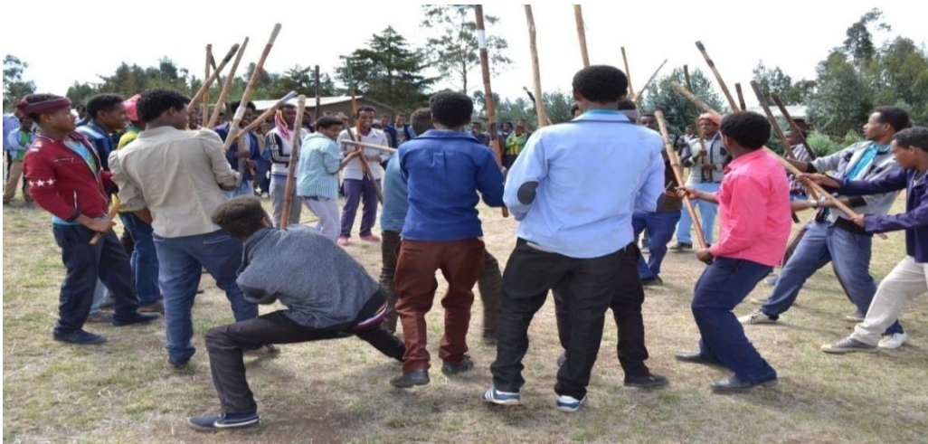
Suura 2- Akkaataa qabannaa shimalaa wayita shimalli rukkutamu

Akka yaanni iddattoonni bifa afgaaffiin olitti kennan agarsiisutti raawwii dhiichisaa keessatti shimalli haala ittiin qabatamu kan qabu yoo ta'u, namni tokko tokko haala qabannaa kana wallaaluun kan miidhamaa ta'a.