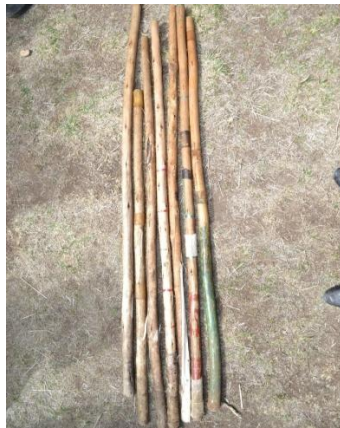
Suura 8- Ulee Shimalli Ittiin Bakka Bu'aa Jiru