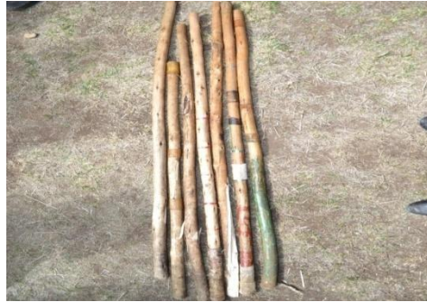
Suura 8- Ulee shimalli ittiin bakka bu'aa jiru

Akka yaanni iddattoonni olitti kennan ibsutti, dhiichisaan shimala faarsuun akkasumas shimalli sadarkaa duriirraa laafaa kan jiruudha. Kanaafis akka sababaatti kan ka'e qaamni seera kabachiisu yeroo adda addaatti dargaggeessarraa shimala guuranii gubuu, lallaba abbootii amantaafi ammayyummaa hordofuurraa kan ka'e fedhiin dargaggoonni akka dhuunfatti qaban laafaa ta'uudha.