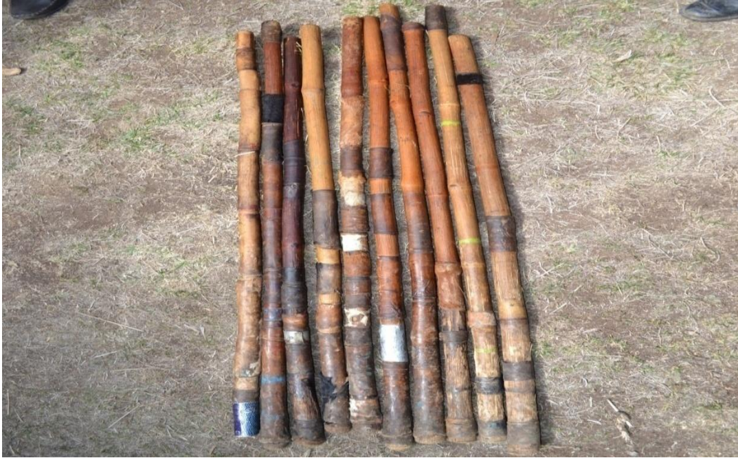
Suura 5- Shimala Toleefi shiboon irra maramē

Akka yaanni iddattoonni olitti kennan hubachiisutti, dargaggoonni akkuma mataa isaaniif kunuunsa adda addaa taasisan shimala isaaniifis kunuunsa garagaraa taasisuun balaa adda addaarraa oolchu. Kunuunsa dargaggoonni shimalaaf taasisan keessaa adda dureen tolee irra maruu, shiboo itti maruufi dibata adda addaan faayuudha.