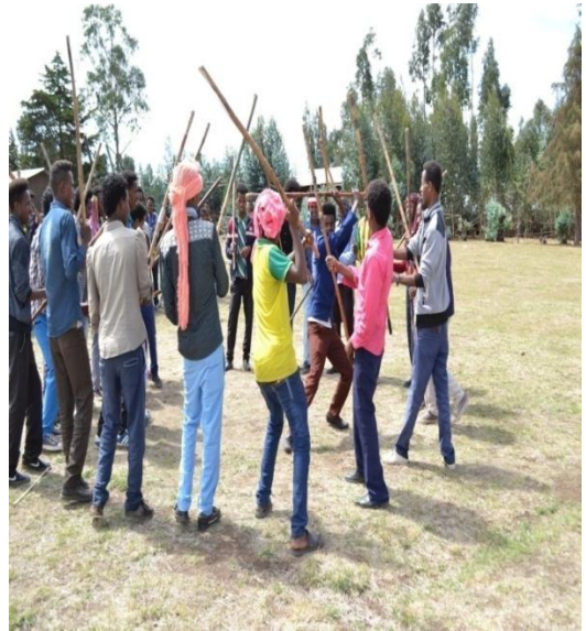
Suuraa 3-Rukuttaa shimalaa irraa gadi taasifamu