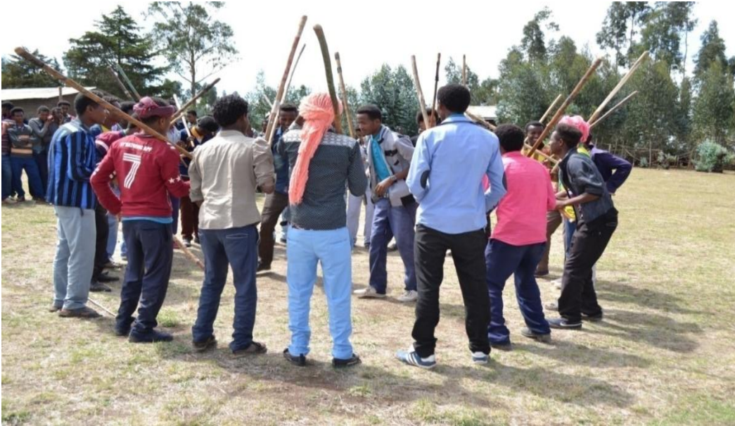
Suura 7- Hirmaattota faaruu shimala

Gama ija siyaasaanis dhiichisni “Yaa yartuu nyaadhu boqqoolloo” jedhu namni aadaa, see naafi duudhaan hawaasa isaa osoo cabuu wantan har’a nyaadhee bulu argadheera jedhee callisu kan jiru ta’uu kan agarsiisuufi dhiichisni “Yoon siif jedhee du’e maalii?” jedhu qaamni aadaa, safuufi duudhaan hawaasa kiyaa osoo cabuu ilaaluurra lubbuu koo wareeguun aadaa, safuufi duudhaa ganamaa dhala itti aanuuf dabarsuun filatamaadha jedhee yaadu kan jiru ta’uu hubachiisa.