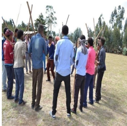
Suuraa 6- Amala geengoon dhiyaachuu faaruu shimalaa dhiichisaan