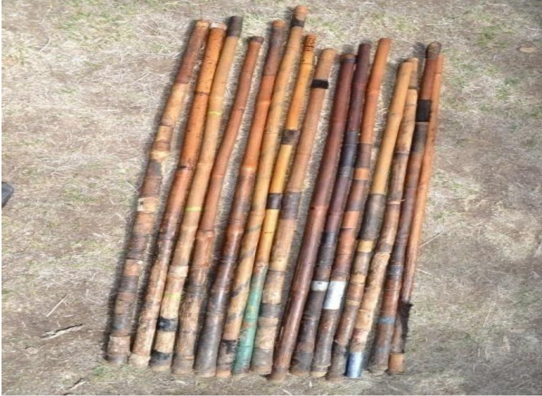
Suura 1- shimala

Akka waliigalaatti dhiichisa keessatti qoonni shimalli qabu xiqqaafi akka salphaatti ilaallamuu kan hindandeenye ta'uu yaanni iddattoonni shimalaafi faayidaa shimalaarratti kennan haala gaariin hubachiisa.