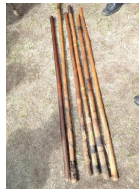
Suura 9-Shimala haanxa'aa