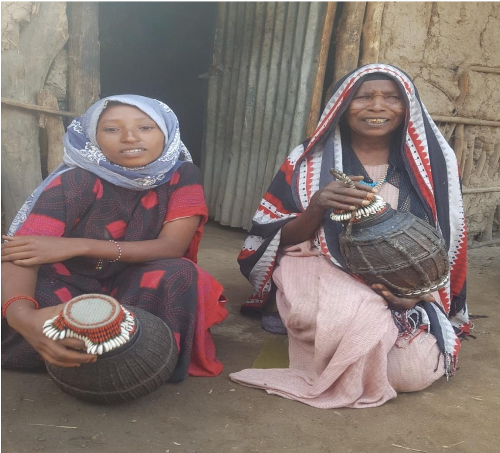
Suuraa 4 weedduu aannan raasuu goota faarsu. (Guyyee Roobaafi Kamisaa Libaano, 8/9/2014 Haroo Huubaa).

(maqaa lafaati) gadi buusee qaraa (sodaachisaa), saayyoo (loon) horaa loon jabbii camaraa (bifa adii) jechuun lafa kaa'ameera. Kana jechuun goonni gootummaa isarraa kan ka'e loon jabbiin isaanii bifaan akka malee camara(bifaan adaadii) ta'an kan fagoorraa diinni ilaalee argu lafa lolaa Calalaqaa jedhamu bobbaasuudhaan akka tikse kan agarsiisuudha. Kunis, bifni adiin halaalaa waan mul'atuuf, gootichi diinni halaalaa loon kana argee na lola jedhee osoo hinsodaatiin loon camaraa lala lolaa geessee tiksaa jiraachuusaa agarsiisa. Kun immoo, sodaa tokkollee akka hinqabne ibsa. Kanaafuu, weedduun aannan raasuu olii kun gootummaa nama tokkoo ibsuuf yookaan goota faarsuuf weeddifama jechuudha.