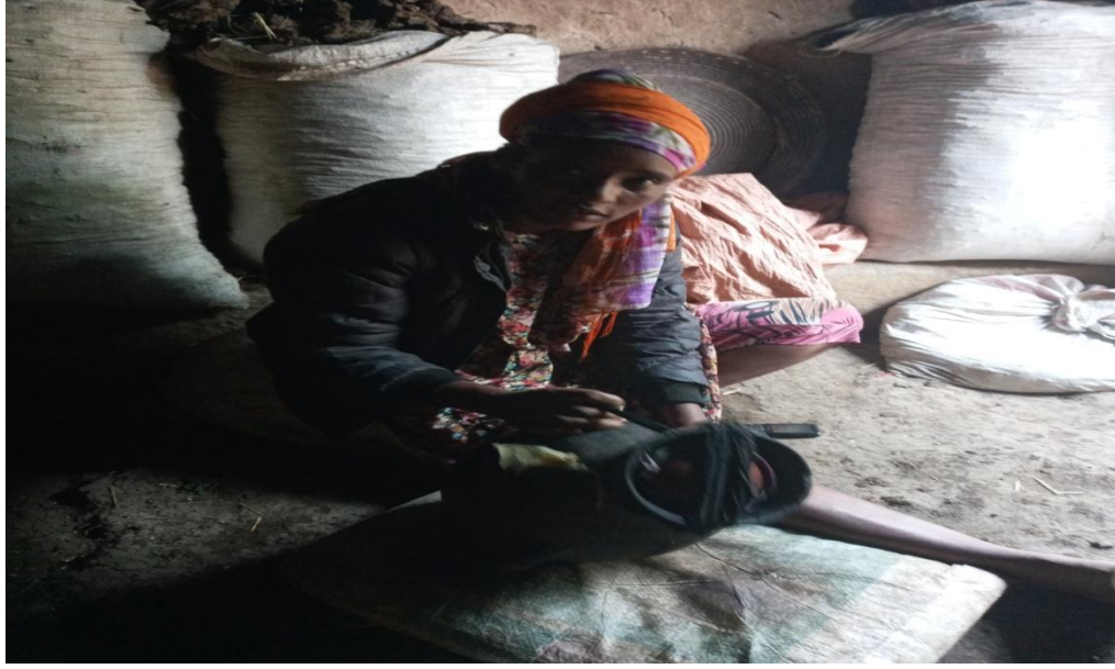
Suuraa 2 weedduu aannan raasuu bu'aa loonii faarsu (Kamisaa Wadaay, 4/3/2012 Dheebittii)