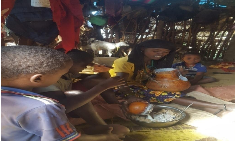
Suuraa1: Weedduu aannan raasuu bu'aa aannanii faarsu agarsiisu (Haawaa Waaqoo, 5/3/2012 Dheebittii)