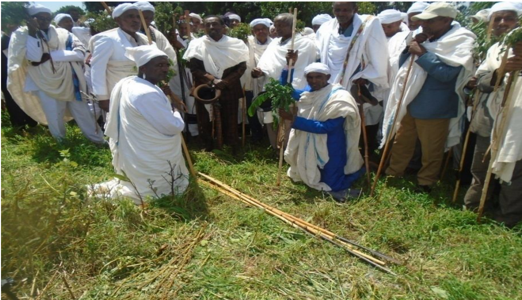
Suuraa 2: seerri tumaa caffee araddaa jilaa Goodaa Qunniitti yemmu tumamu agarsiisa

Yeroo haala kanaan eebbifachuun seerri tumamu, ulaagaan ni dhaabbataa, Caffeen ni dhiyaata, birbirsii ni dhaabbata, lammii lammii isaaniitiin walqoodanii garaagaraa ciisuu. Guyyaa shan achi bulan keessatti guyyaa sadaffaatti tuman tumama.