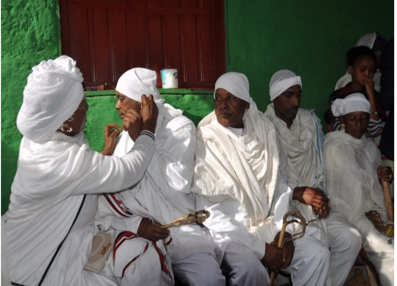
Suuraa 3: Yeroo obboleettiin lubaa gurra uruun dhugoo gurraa gootuuf agarsiisa.

Yeroo Abbaan buttaa gurra uratee ukoo hidhatu Foolleen akkas jedhanii sirbaa dhiichisu.