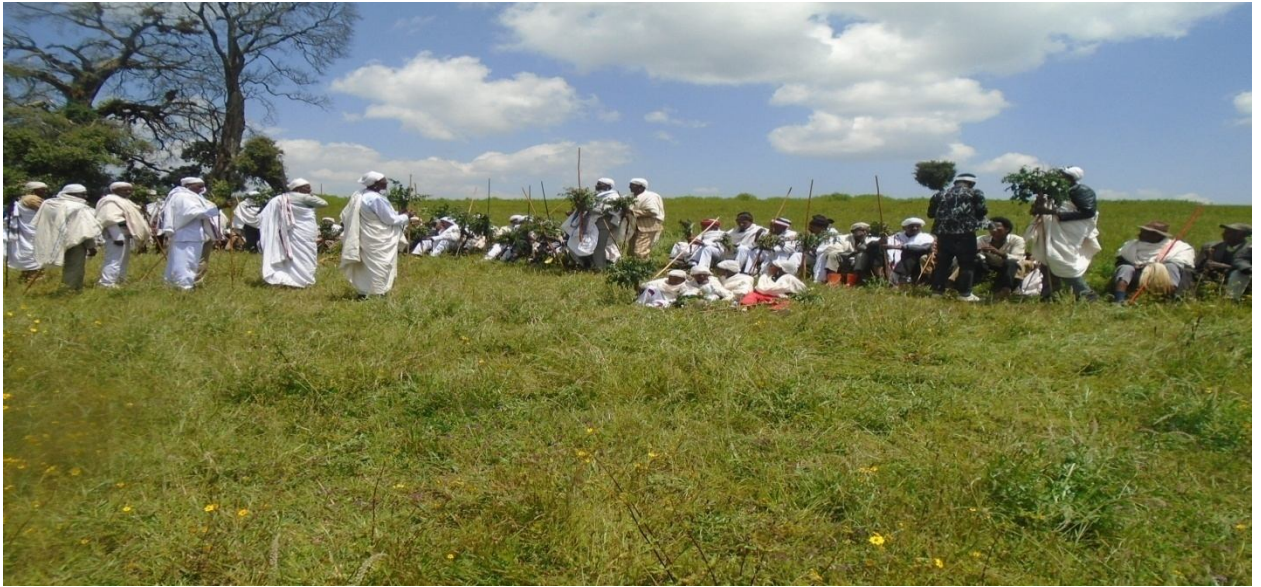
Suuraa 8: yeroo miseensi Gadaa Roobalee Gadaa Birmajiif aangoo dabarsu.

fudhadheera fudhadheera eeyyee eeyyee eeyyee eeyyee eeyyee eeyyee miila yoo dhabe, ija yoo dhabe nan beeka