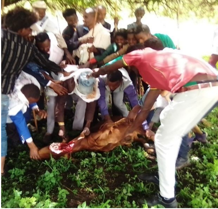
Suuraa 7: korma abbaan buttaa baafatu barii ka'ee qalu agarsiisa.

Foolleen korma buttaa gara mirgaatti kuffisu. Lubichi albee korma qaluuf qophaa'een korma buttaa morma buusa.