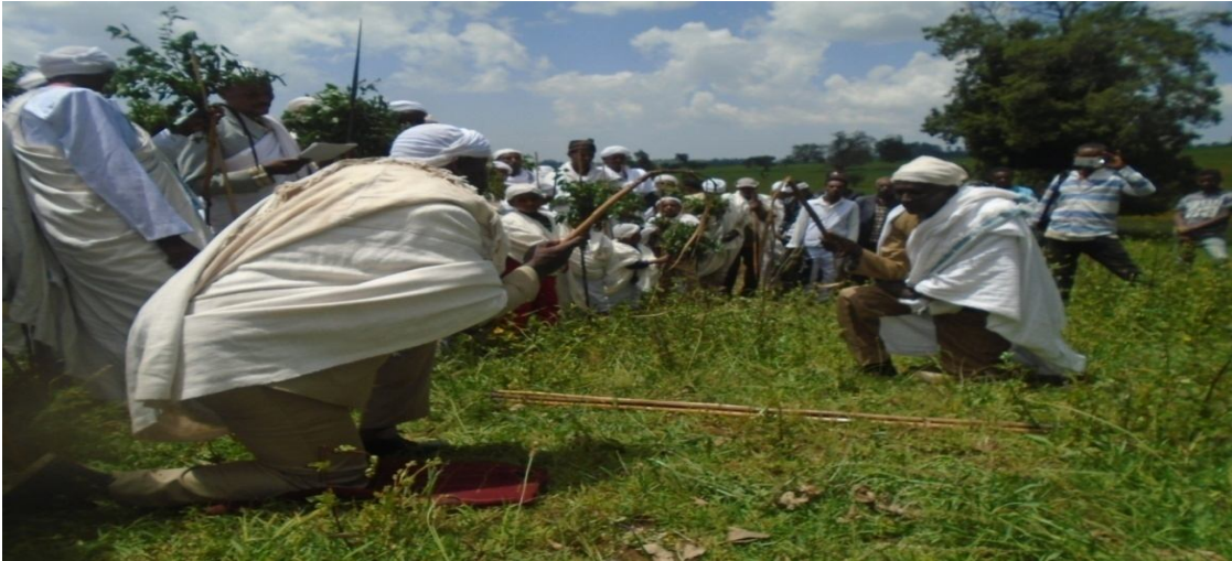
Suuraa 9: Araddaa jilaa goodaa Qunniitti seera guyyaa ballisii tumame agarsiisu

Kanatti aansuun seera waaqaa, safuu waaqaaf nama gidduu jiru kanneen amantiilee waliin walqabatan, seera lafaaf lubbu qabeeyyii, seera namaa tumu.