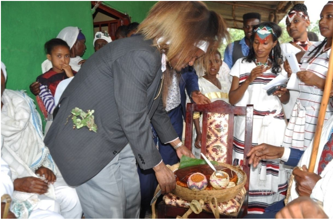
Suura 6: jifuu Foolleef kenname agarsiisa

Oofkali wayyaa luba koo-----oofkali Oofkali bara Gadaa-----oofkali Oofkali barakataa-----oofkali Oofkali barri Gadaa-----oofkali Ammas dammaa-----oofkali jechuun bara Gadaa isaanii ibsu.