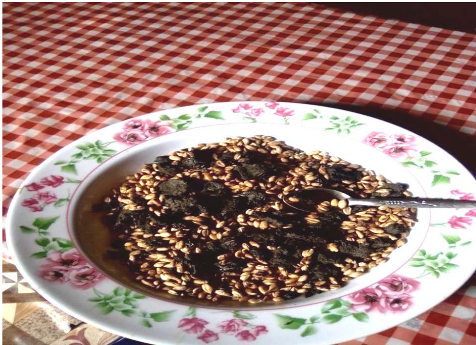
Suur (2) Akaayii Koshoofi Tumaa Nuugii argisiisu

Tumaan nuugii kabaja sirna Jaarii Kosiif iddoo guddaa qaba. Nyaanni aadaa kun akaayii garbuu koshoo jedhamu waliin walitti makamee nyaatawwan aadaa kanneen biroo waliin kabaja sirna Jaarii Kosiif dhiyaata. Kabaja Jaarii Kosii kanarratti tumaan nuugii akaayii koshoo waliin, akkasumas immoo, nyaatawwan aadaa garaagaraafi dhugaatii aadaa garaagaraa kanneen akka daddarbaafi akka dhibaayyuutti nama tajaajilanitti fayyadamuun yommu sagadatan, waaqxi uumaa isaanii ta'e sun utaalloo hamaa, qufaa hamaa, qakkee hamaa, dhukkuboota daddarboo ta'aniifi kaneen biroo akka isaan bira dabarsuufidha nyaata aadaa kanatti fayyadamu. Kana malees, tumaan nuugii kun kabaja sirna jaarii kosiif fayyaduorra darbee, akka qoricha aadaattis yeroo tajaajilu ni jira. Fakkeenyaaf, nama dhullaan ykn dhiitoo qabate, yoo tumaa nuugii nyaachisan, ilkeen dhullaa sanaa ykn dhiitoo sanaa salphaatti waan bahuuf, namni dhukkubichaan qabamee tumaa nuugii kanaa nyaatee fayyu, lammata dhukkubichaan hinqabamu waan jedhamuuf, uummatichi akka qoricha aadaatti itti tajaajilamaa tureera (Aad/ Baatuu Hirphaa, 26/03/2011).