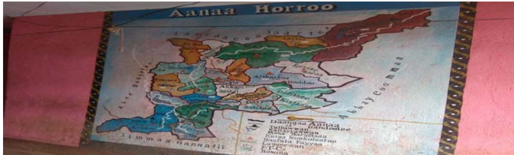
Kaartaa Aanaa Horroo