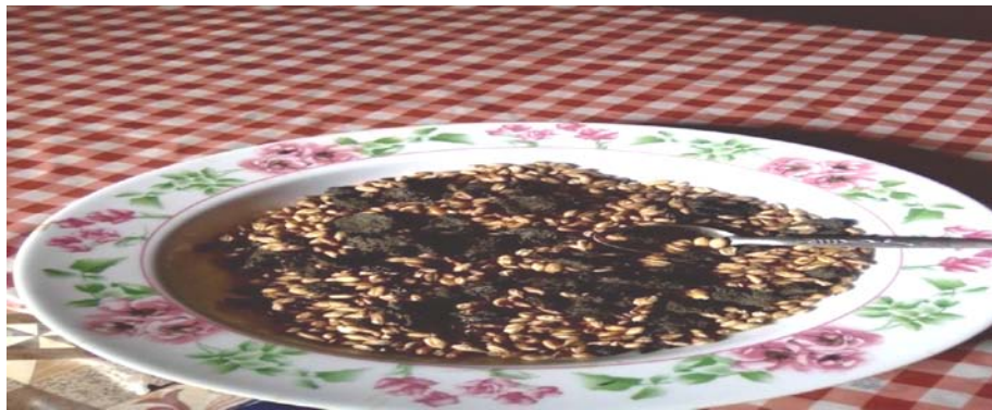
Akaayii Koshoosfi Tumaa Nuugii