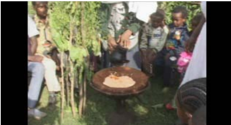
Cororsaa guyyaa ayyaana Taaboree