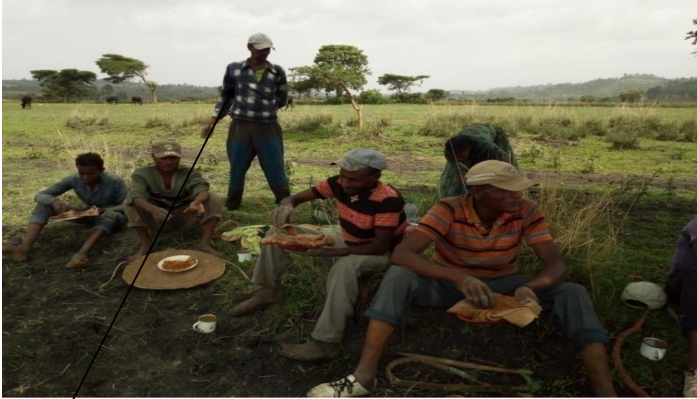
Suura5. Gahee waasii agarsiisuu