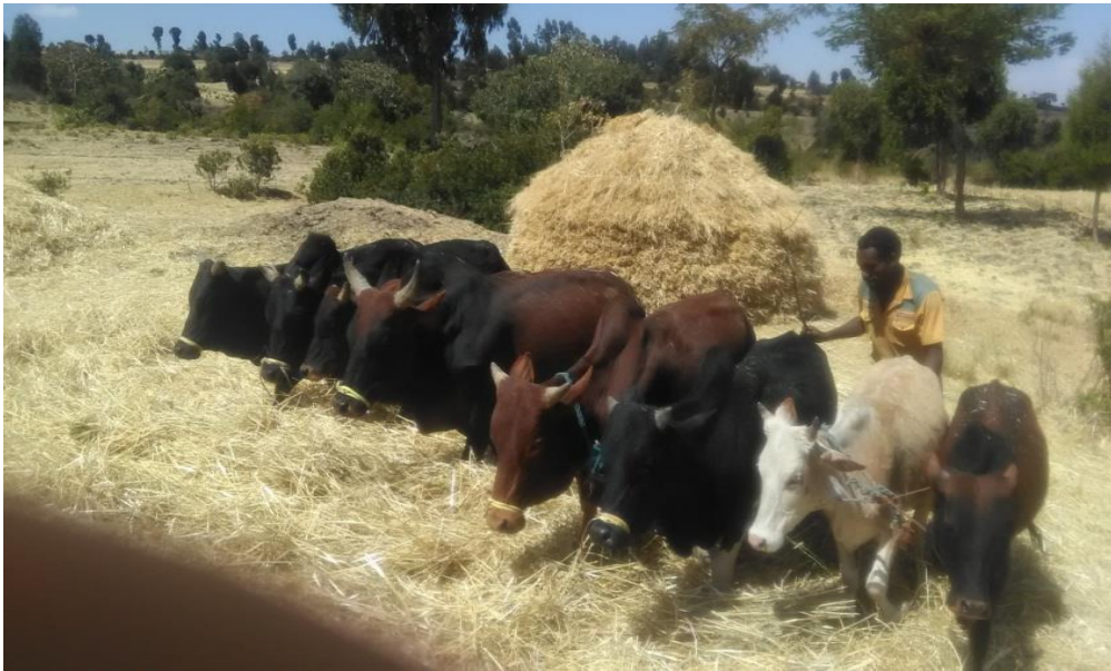
Suura6. Yeroo midhaan dhahinsaa