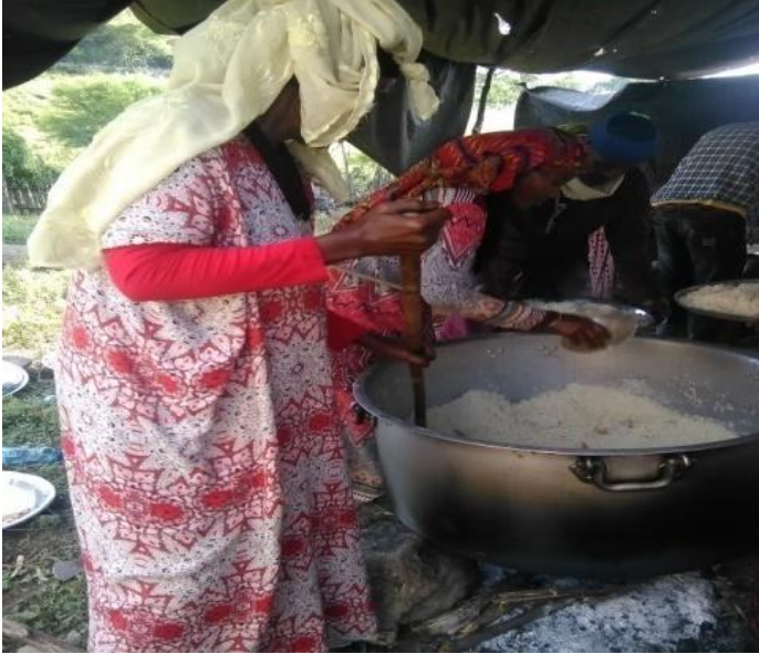
Fakii. 13 Yeroo Haati Gurbaafi Niitiin Abbeeraasaa Nyaata Araaraa Tolchani (Onkoloolessa 28/2/2010 kan qorattuutiin kaafame)