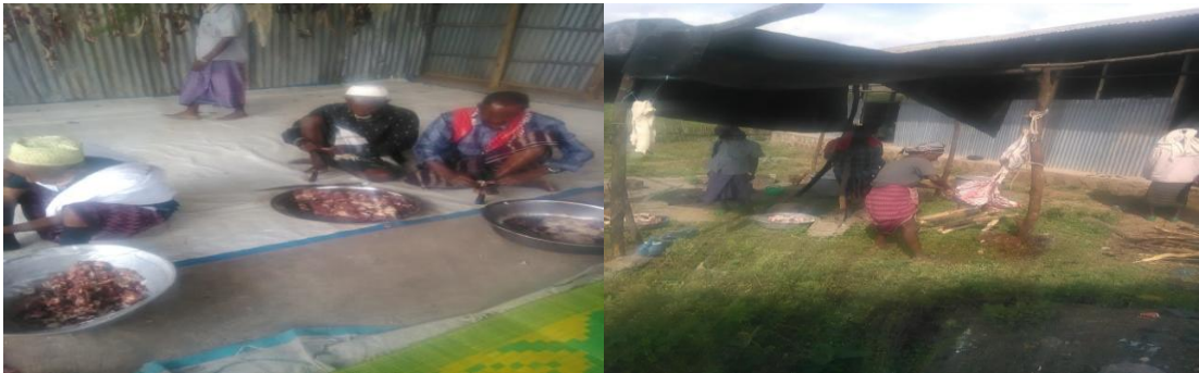
Fakii 9 Yeroo foon qalame uummata araaraaf dhiyaateef qopheessan(Onkoloolessa 28/2/2010 kan qorattuutiin kaafame).

Foon re'oota qalamanii erga lafeen cinaachaa tokko keessaa fuudhamee booda namayyoon namicha nama ajjeesee haaduu quba miillaan qabatanii kukkutuun nyaata araaraaf qopheessu.Itti aansuun foon kukkutame kun dubartoota lama haadha gurbaa ajjeeseefi jaartii abbeeraasaa qofaan ittoon isaa tolfamuun ruuza affeelanii faajjiif (gosa lamaan waldhaban) niif qopheessan