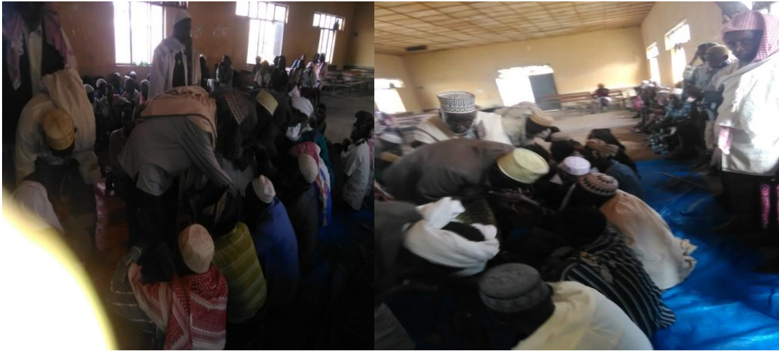
Fakii 11. Yeroo gosni warra ajjeese warra jalaa du'e harka fuudhan(Onkooloolessa 28/2/2010 kan qorattuun kaafame).

Itti aansuun gosti ajjeeseefi warri jalaa ajjeefame galma keessatti walitti makamuun warri gurbaan jalaa du'e diriirfatani taa'uun gosti ajjeese immoo ka'anii dhaabbachuun dabareen irra naanna'anii harka fuudhuun rabbi isin duuba haa kaa'u (isin haa hirraanfachiisu) jedhanii dhiifama gaafatan; manduggoonni sirna kana raawwachiisan gamaa gamana dhaabbachuun hordofantu ta'a. Inni kun kan inni mul'isu isin balleessaa hin qabdan kanaaf taa'aa kabajamaa gurbaa isin duraa du'e rabbi isin haa hirraanfachiisu kan jedhudha. Akkasumas warri balleessaa hin qabne niitaa'a; kan badii dalage dhaabatee balleessaasaaf dhiifama gaafata jechuudha.