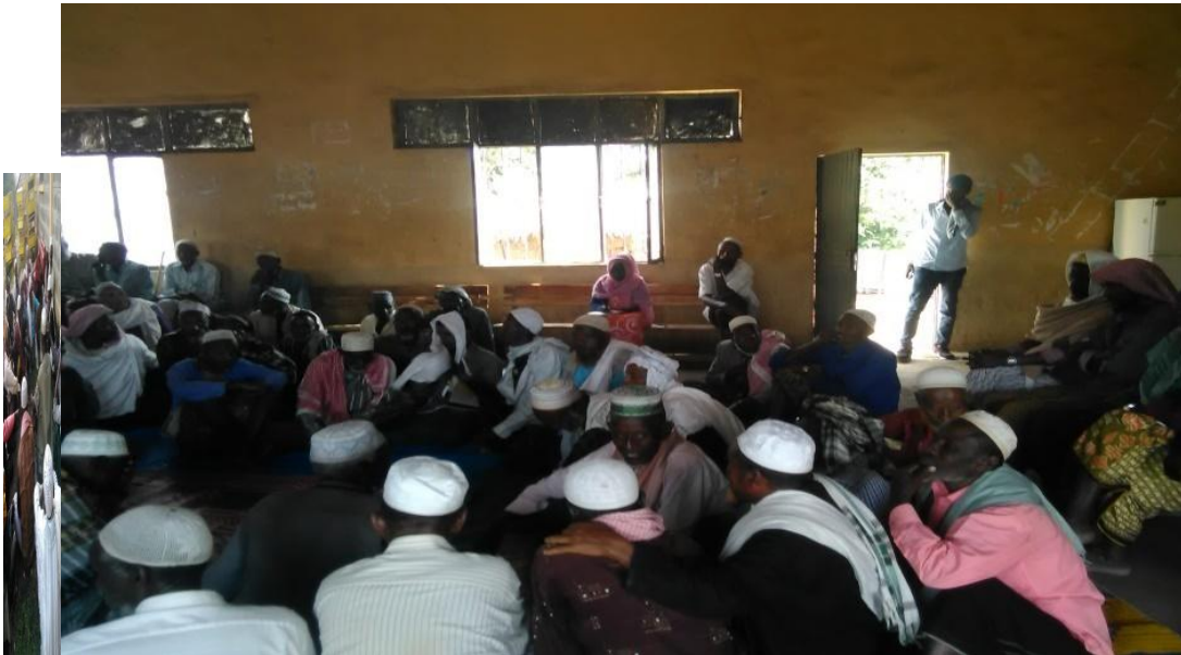
Fakii 5 Yeroo manguddoonni mana warra jalaa du'etii deebi'an (Onkoloolessa 22/2/2010 kan qorattuun kaafame).

Itti fufuun yeroo sadii deddeebi'uun yakka keenya beekneerra gaabbineerra jedhaniiru waanta'eef "Balleessaa biraa" akka hin raawwatamneef jedhee altakkaatti tole jedhee yaada hinkennu. Nutis hayya namni nama keenya dhiiga isaa barbaadu gosa keenya hunda waanta'eef ni mariyanna jechuun maalirra akka jiran ni himu. Galuu isaanii akkas jechuun ibsatu gosti nama ajjeefamee mariyataniiru yeroo sadii deddeebanii kadhachuu isaanii ilaalcha keessa galchuun maal goona erga manduggoon biyyaa nukadhatee" tole; qabamneerra; dhaabbanneerra. Isinis akka aadaa biyyaatti waan jettan jedhaa" jechuun deebiikennu. Kana jechuun nutis biyyuma waliin jiraanna nu araarsaa jechuudha.