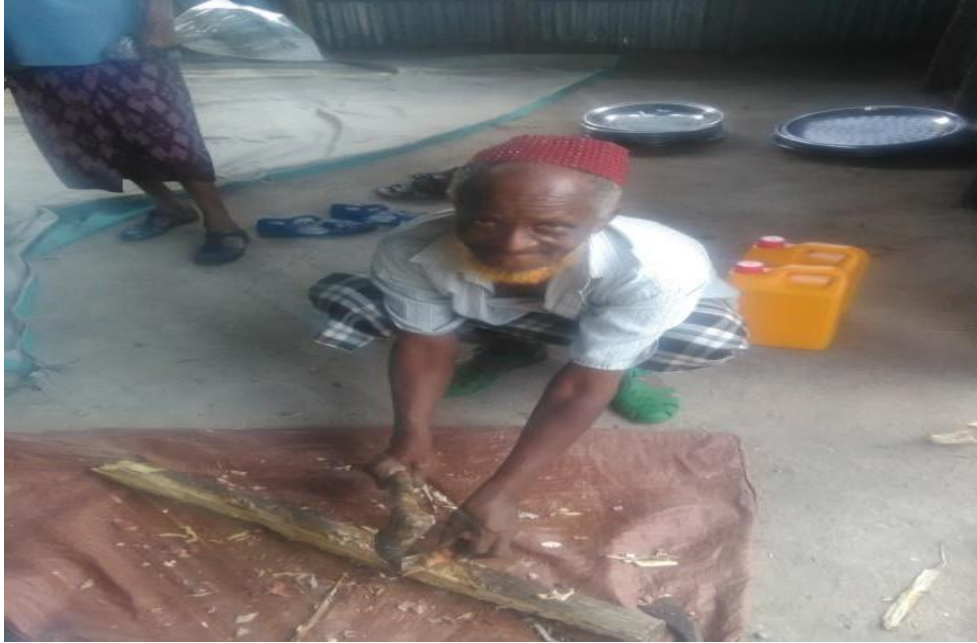
Fakii 8 Yeroo Abbaan gurbaa nama ajjeesee lafee cinaachaa caccabsuun Balleessu (Onkoloolessa 28/2/2010 kan qorattuutiin kenname).

haree boollatti naqa.Lafee caccabe haranii boollatti naquun kun ammo hiddi dubbii lubbuu namaa balleessu nugidduudhaa haa owwaalamu jechuudha.