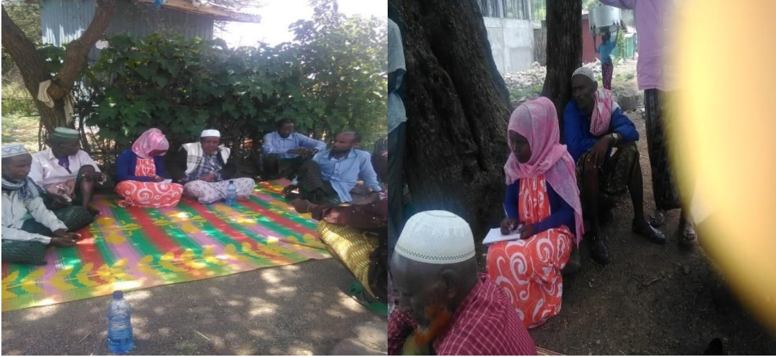
Fakii 4 Yeroo manduggoonni sadaffaaf warra jalaa du’etti deebi’ani (Onkoloolessa 16/2/2010 kan qorattuun kaafame).

nadaamne”Asuujiirti achuujiirti du’aan garana waajirti” jechuun mammaaku.Kan a jechuun ajjeechaan tasaa har’a nurratti mul’ate boor isiniin illee mudachuu danda’a jechuudha.Isaanis gadda garaasaanii fixatanii dhiisuuf firoonni walitti dhaamanii wal gahuun maalgoona jedhanii wal mariyatani yada garaa isaanii hiru.