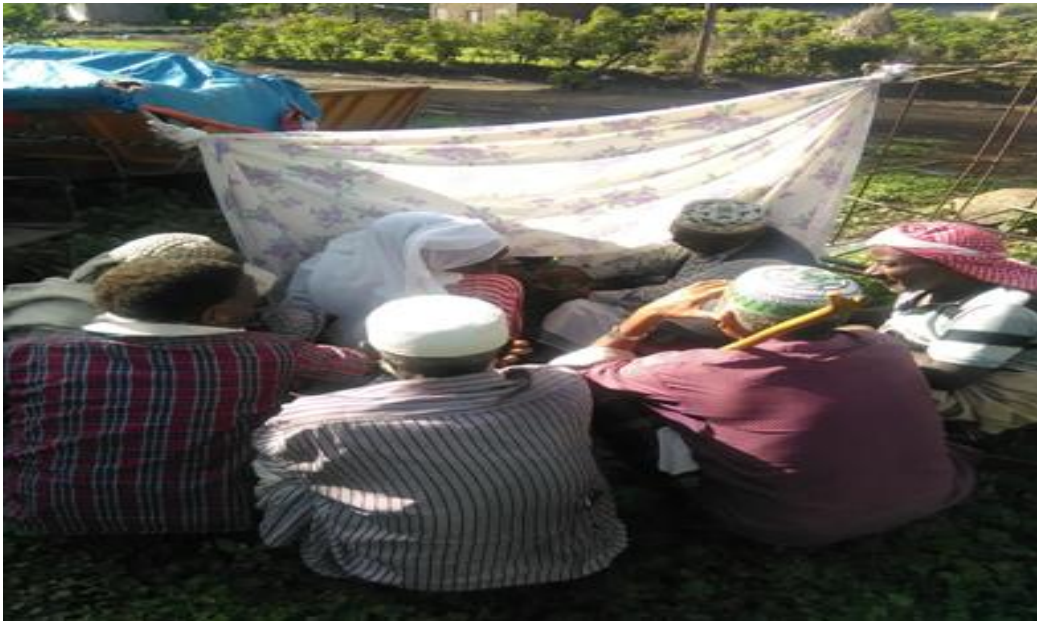
Fakii10 Yeroo sirni harka rigaa raawwatu (Onkoloolessa 28/2/2010 kan qorattuutiin kaafame).

Harka rigaanis gurbaan ajjeese namoota fira isaa amanamoo ta'an lama waliin dhokfamee dhufuu dhaan akka isaan warra jalaa du'e wajjin wal hin arginetti golgaan bifaan burree ta'e gidduutti fanni famuun akka suuraa irratti mul'a tutti namoota waliin dhufeen bitaafi mirgaan fuulli isaa dhokfamee bakka harka rigaa sanatti namoota isa waliin dhufan dursee barruu harka isaa gombisuun isaan lamaan ammoo harka lamman saanii ol garagachanii akka wal hin agarretti gadi taa'anii sirna harka rigaa raawwatan. Dabalataan suuraa namichaafi kan isa fidanii kaasuu dhabuun naamusa qorannichaa keessatti dhorkaa waanta'eefi.