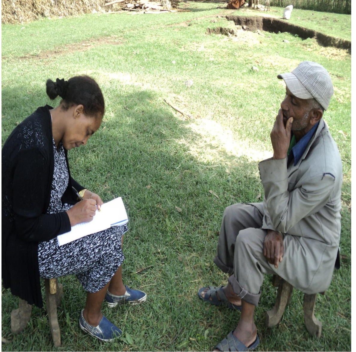
Suura(1) Gaafa 24/8/2010 Yeroo Obboo Dajanee Biiftuu faanaYeroo Af- gaaffiin adeemsiifamuu,