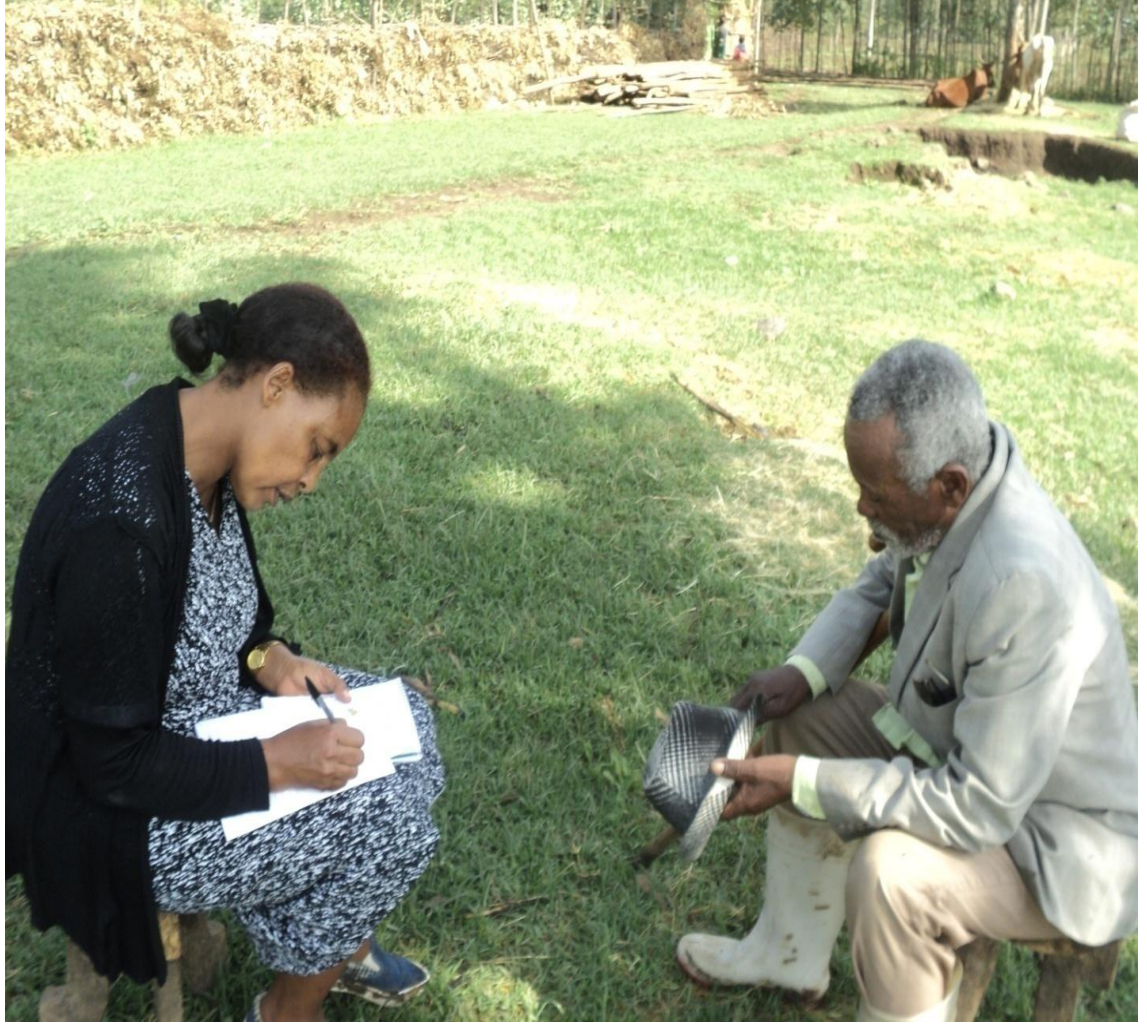
Suura (4) Obboo Kumalaa Dhaabaa faana gaafa 24/8/2010 gaaffii Af- gaaffii adeemsifamee