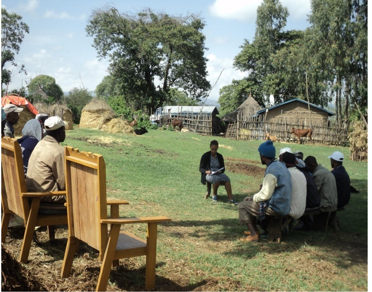
Suura (10) yeroo garee bal'aa faanamarii garee gaafa guyyaa 24/8/2010 adeemsifamee