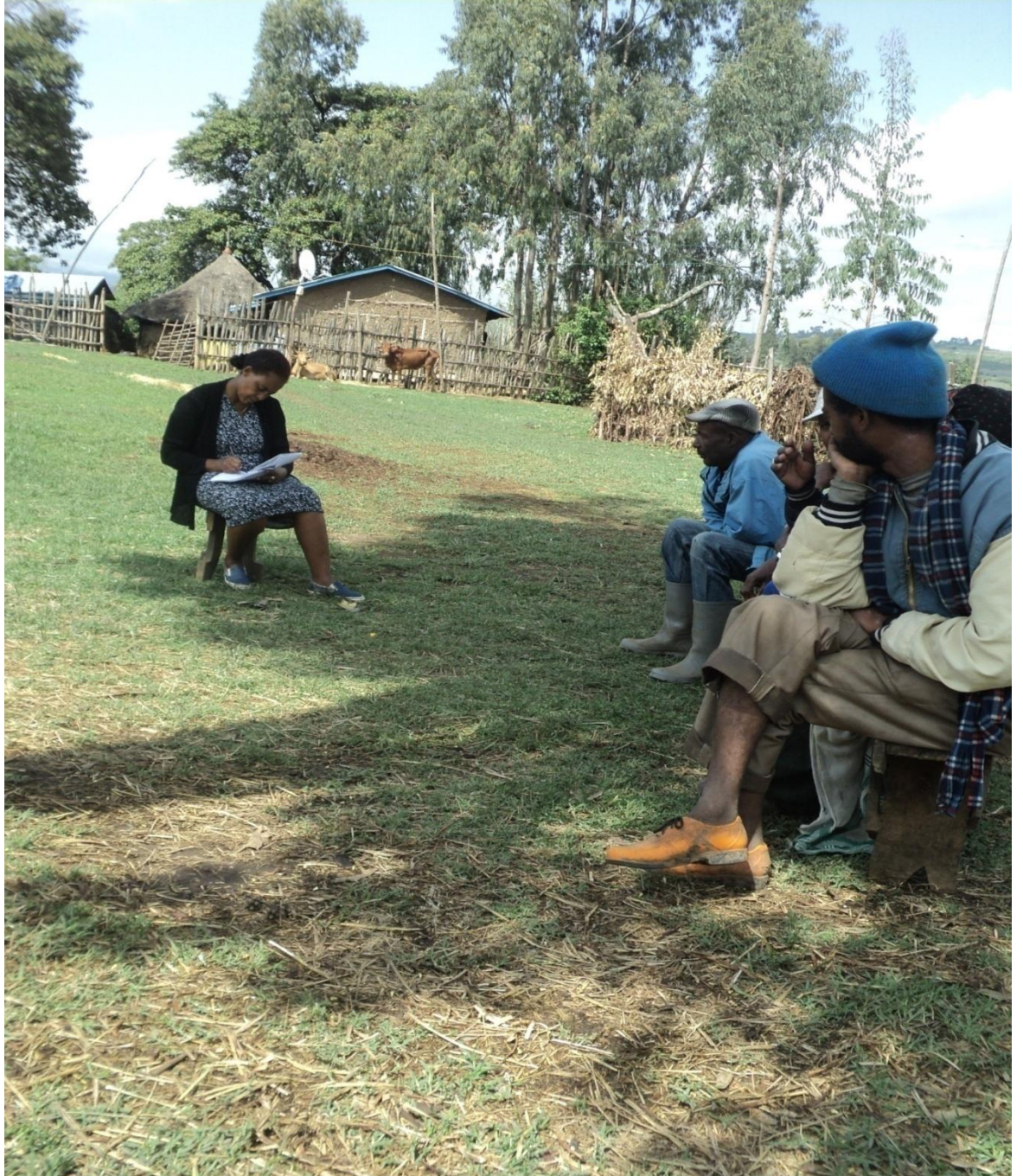
Suura(9) Yeroo ga'eessoota faana marii garee gaafa guyyaa 24/8/2010 adeemsifamee