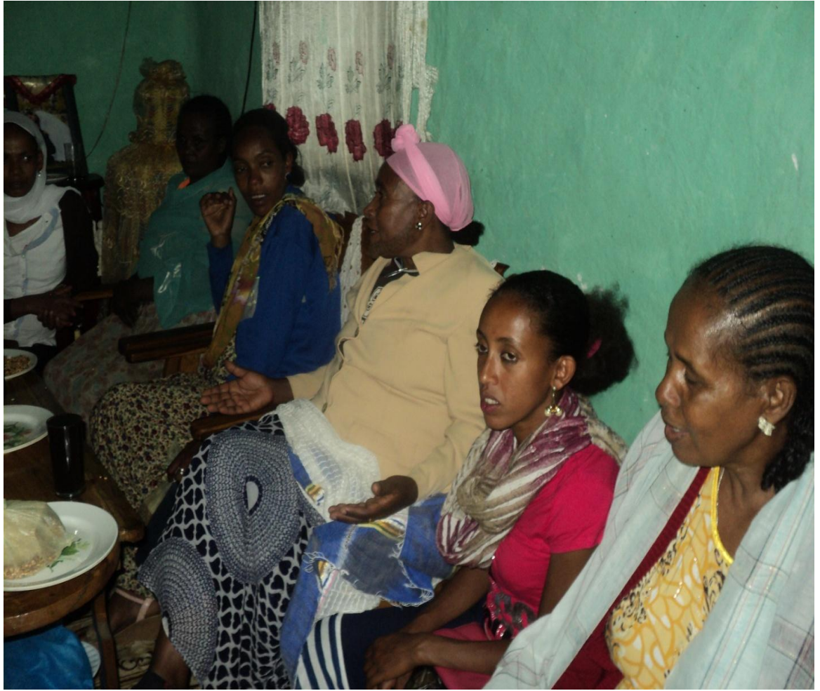
Suura (7) Yeroo garee xiqqaa faana gaaffilee marii garee gaafa guyyaa 1/9/2010 adeemsifamee