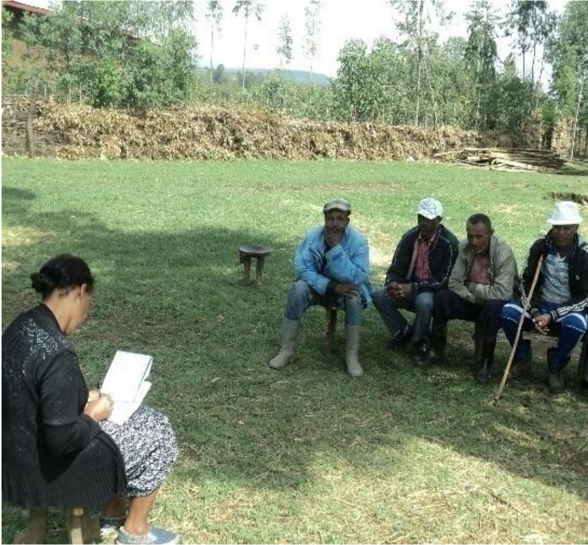
Suura(11) Yeroo marii garee xiqqaa faanahaafa guyyaa 24/8/2010 adeemsifamee