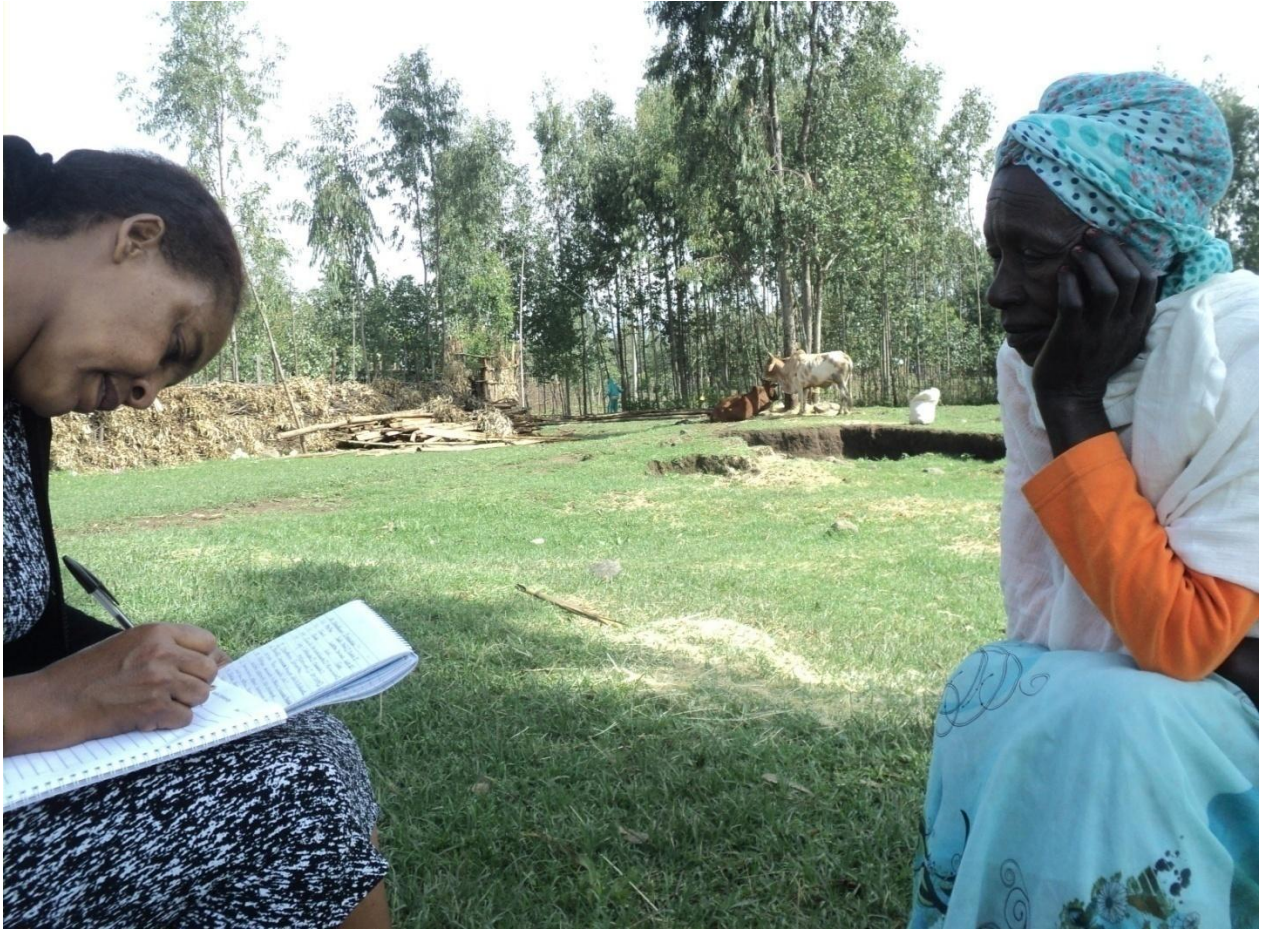
Suura( 3) Addee Daadhoo Fakkansaa faana gaafa guyyaa 24/8/2010 gaafii Af-gaaffii adeemsifame