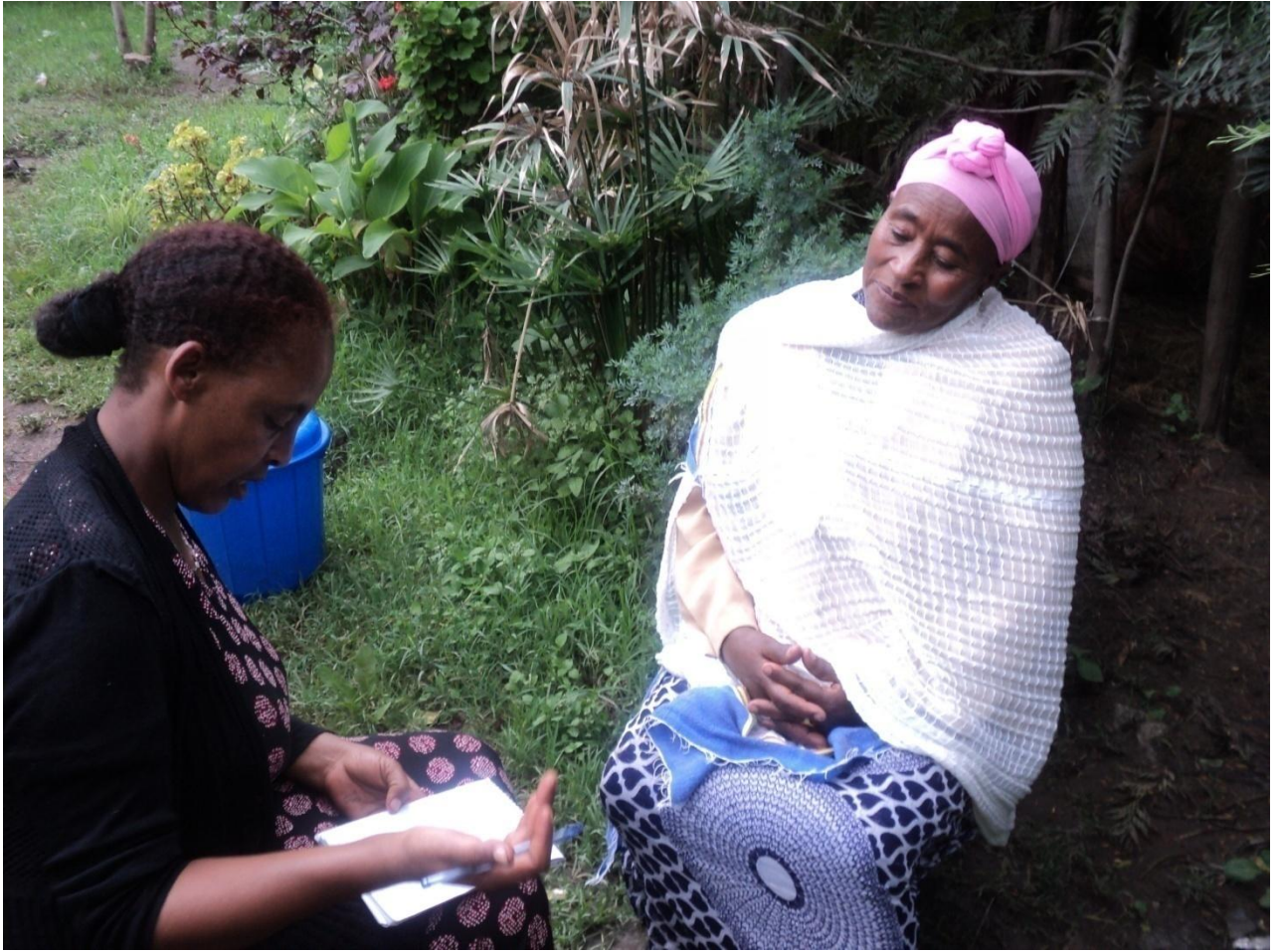
Suura(6) Addee Abbabach Midhagsaa faana af-gaaffiiigaafa guyyaa 1/9/2010 taasifame