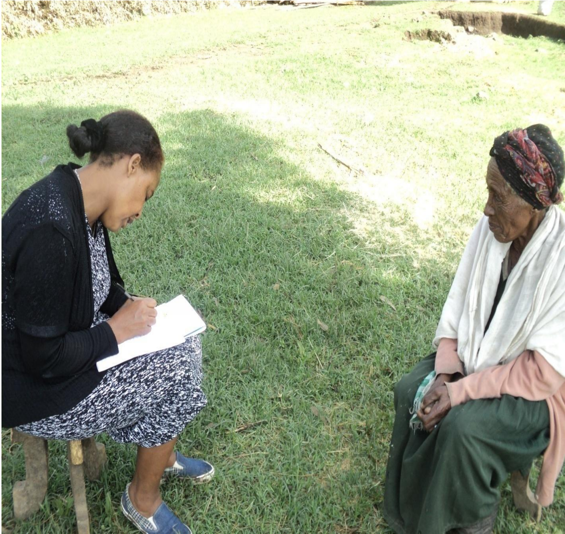
Suura(2) Addee Zannabach Baqqalaa faana Gaafa Guyyaa 24/8/2010 Af- gaaffiin adeemsifamee