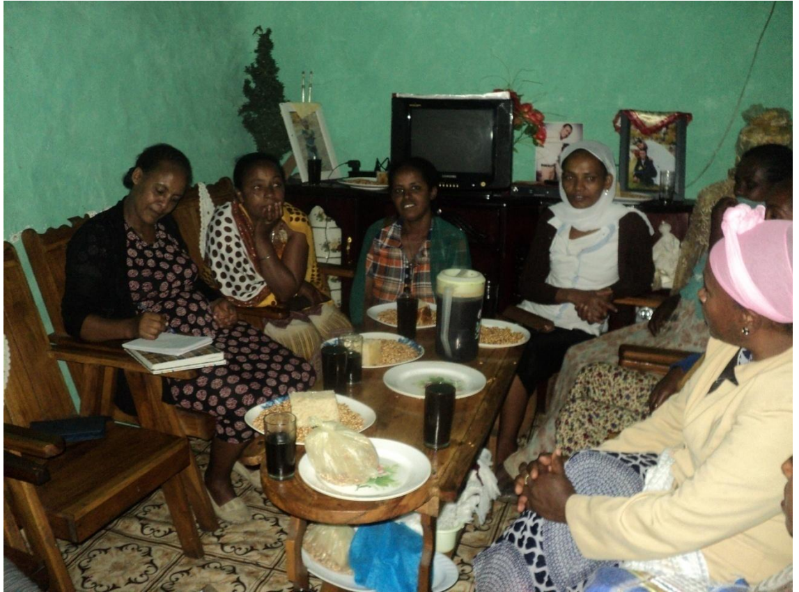
Suura(8) Yeroo dubartoota faana marii gareegaafa guyyaa 1/9/2010 adeemsifamee