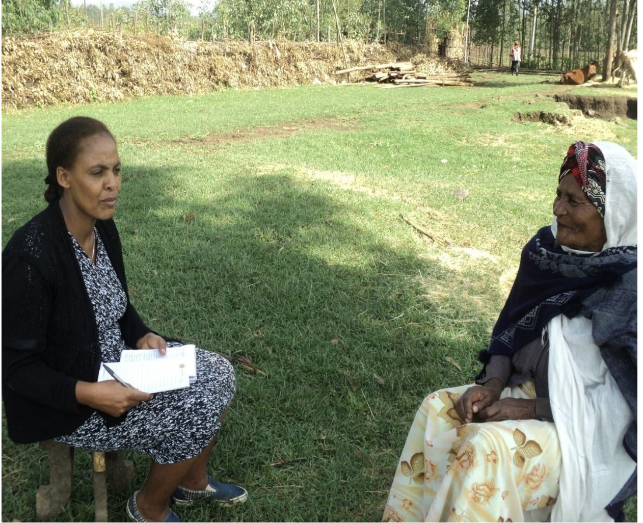
Suura (5) Addee Dasii Araarsoo faana gaafa guuyaa 24/8/2010 gaafii Af-gaafii adeemsifamee