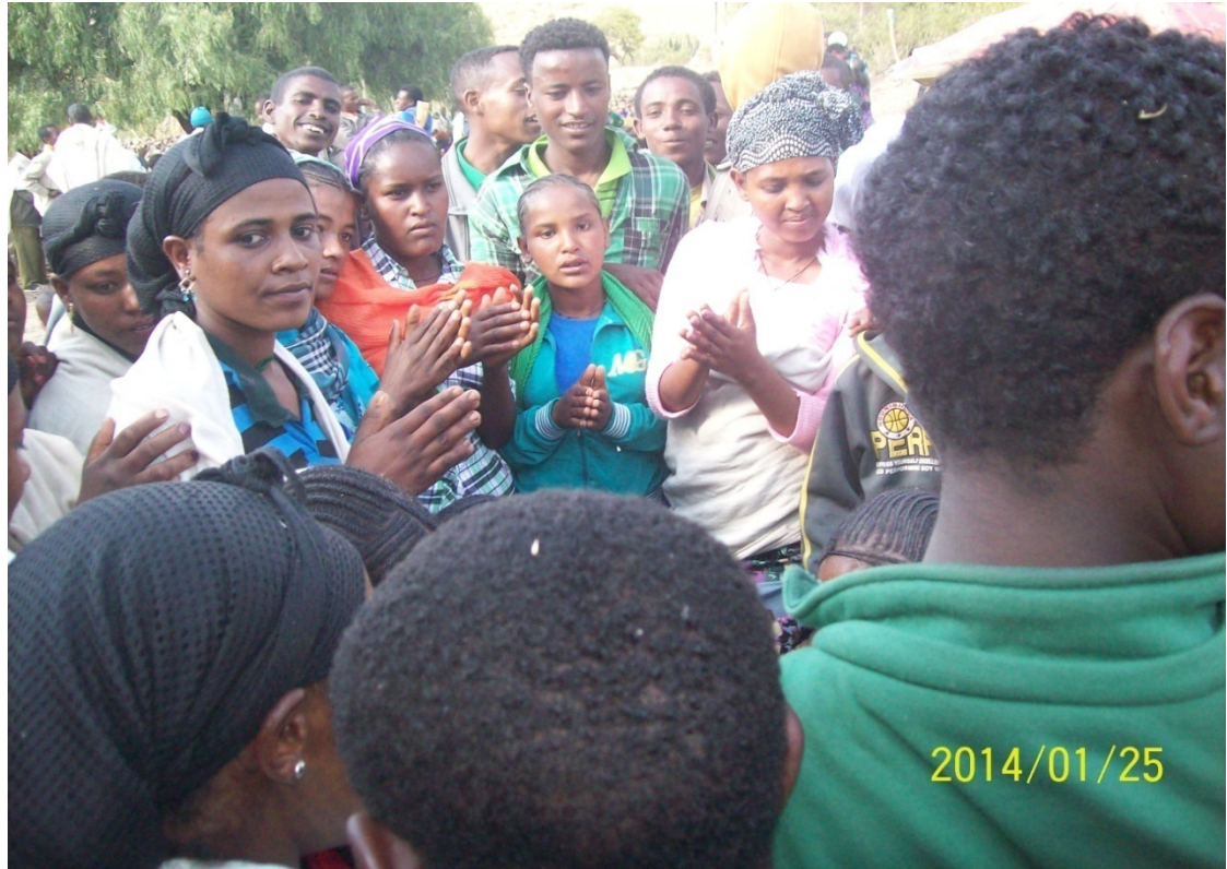
የአበሹቴና የጽኑይቦሌ ጨዋታዎች ከመጀመራቸው በፊት የማሟሟቂያ ዘፈን ሲዜም