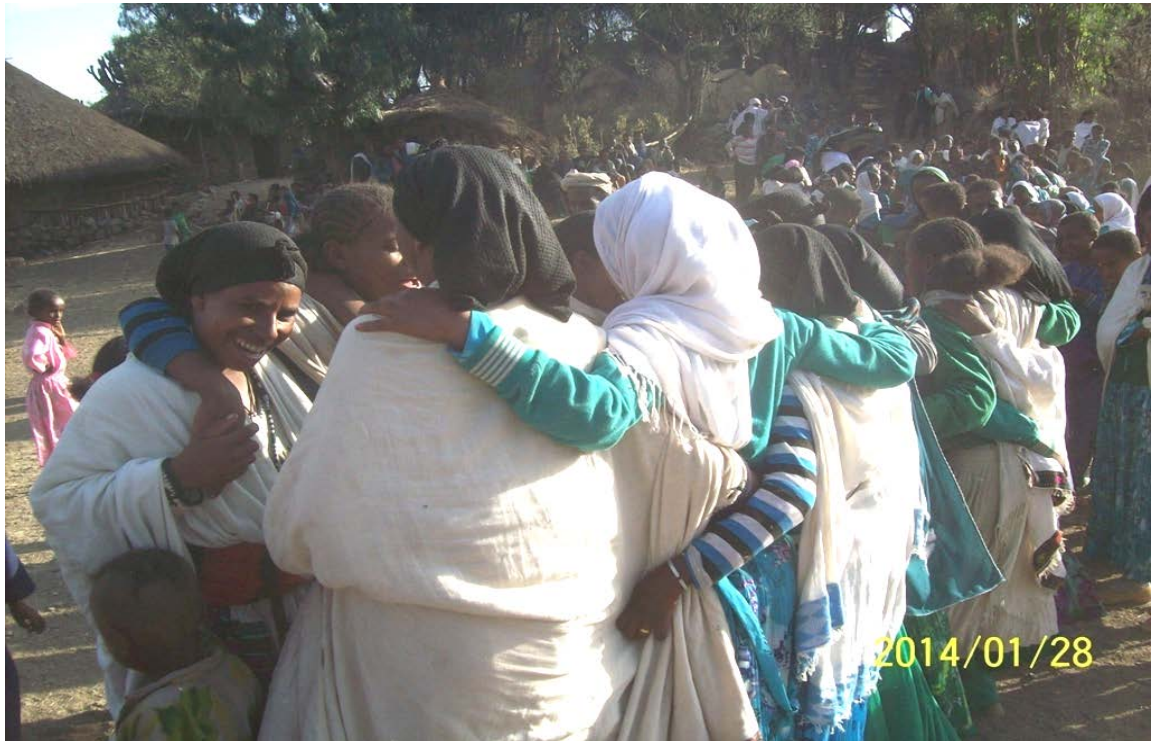
የአበሹቴ ጨዋታ በሁለት ቡድን ተከፍለው ሲጫወቱ

ዜማውን ተከትለው በስልት እየረገጡ አንዴ ወደ ኋላ በማፈገፈግ ቀጥሎ በመቀራረብ ቃል ግጥሞቹን እየተቀባበሉ ተራ በተራ ያዜማሉ።