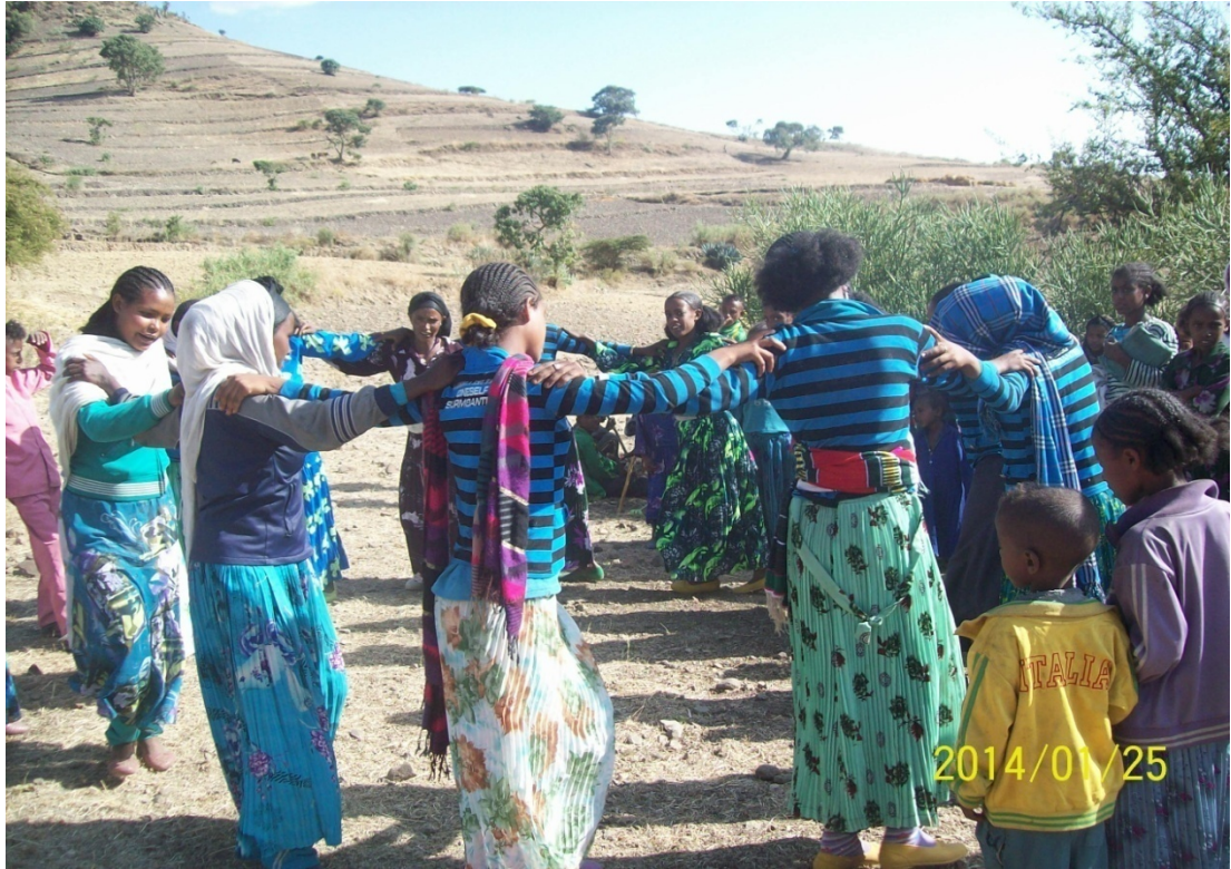
የጽኑይቦሌ ጨዋታ በወጣት ሴቶች ሲከወን

የጽኑይቦሌ ጨዋታዎች ከአንድ ሰዓት እስከ ሁለት ሰዓት የሚሆን የጊዜ እርዝማኔ ከተጫወቱ በኋላ ቀጣይ ጨዋታ ወደ ሆነው የአበሹቴ ጨዋታ ይሸጋገራሉ።