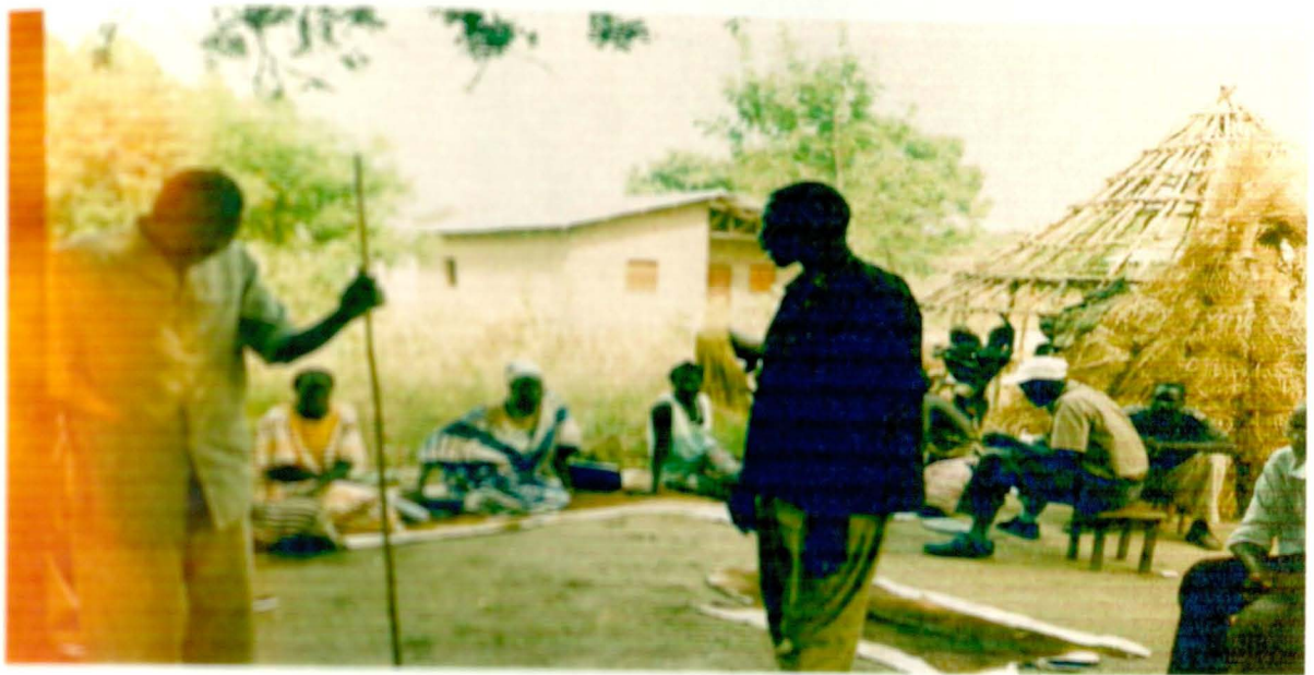
ገጠና ለግጥማ ለሰጠው ግጥም ለሰጠው ሰጠው