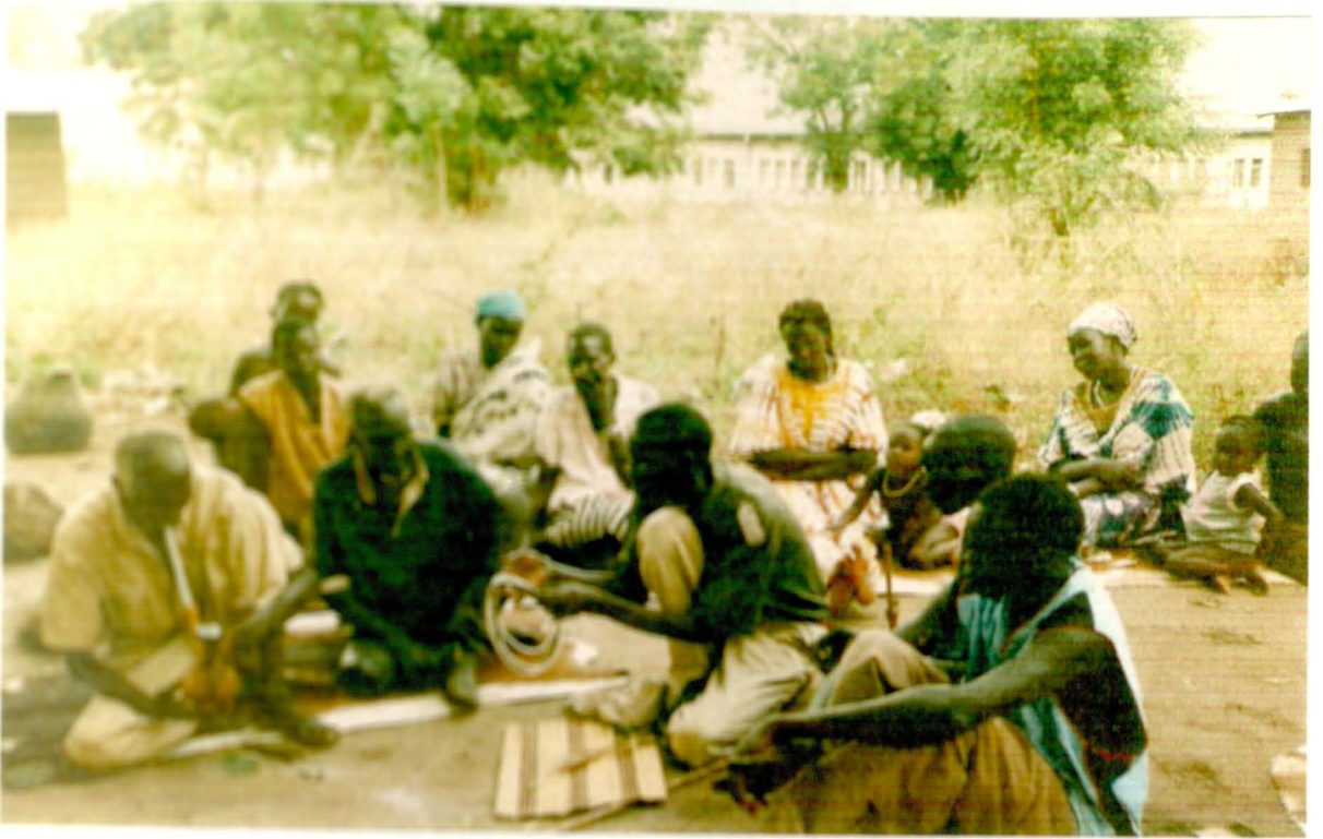
ዕለድ ቅጥጥሮች ሲት የሳ ክፍያ ሲፈጸም

እንደ ወንጀሉ የአፈጻጸም ሁኔታ (ታስቦበትና ሳይታሰብ የተፈጸመ ግድያ ሊሆን ይችላል) ክፍያ ዝቅ ቢልም ግዥ ወንድ ከሆነ እስከ 12 የሚደርሱ ከብቶች፣ ፍየል ለርቢ በሆኑ ለካቢዎች ደግሞ ፍየሎች፣ ጦር፣ ጋር (በጭፈራ ጊዜ እግር ላይ የጊታሰሩ ታጭቶች)፣ ለሉደ (ከተጭኔ ጭራ የሚሰራ በጭፈራ ጊዜ በክንድ ላይ የጊታሰር)፣ ግዥ ለጻኝ ከሆነ ደግሞ የንብር ቆዳ ካሳ ይከፈላል። ግዥ ሲት ከሆነች ግን የሳ ክፍያው ለወንድ ከሚከፈለው ዝቅ ያለ ነው። በአሁኑ ጊዜ ራቅ ካሉ የገጠር ለካቢዎች በስተቀር የሳ ክፍያው በገንዘብ እየተቀየረ በመሄድ ላይ እንደሚገኝ አቶ ኡጉታ ለዲው ነገረውኛል። በገንዘብ የሚከፈል የሳ ክፍያ እስከ 15,000 ብር ይደርሳል። በአካባቢዎች የሳ ለክፋፈል ደንብ መሰረት የተወሰነበትን ካሳ መክፈል ያልቻለ (ግዥ ወንድ ከሆነ) ሲት ልጁን፣ ሲት ልጅ ከሌለው ወንድ ልጁን፣ ልጅ ከሌለው ደግሞ እራሱን ለላይ ለግዥ ወገን መስጠት አለበት። እራሱንና ወንድ ልጁን በካሳ ሙሉክ ለላይ የሰጠ ለግዥ ወገን በሉሊነት ያገለግላል። ሲት ልጅ ከሆነች ደግሞ ለግዥ ወንድም ወይም ዘመድ ትጻራለች። ግዥና ገዳይ ዝምድና ካላቸውና ጋብቻ