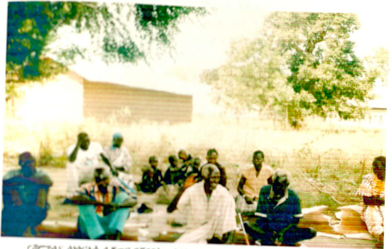
ገጠማዊ ሰነድ ለጽሑፍ የጽናገው ሰነድ ስለተፈጠረው ሁኔታ ለተጻፈው ማሰራረያ ሲሰጡ