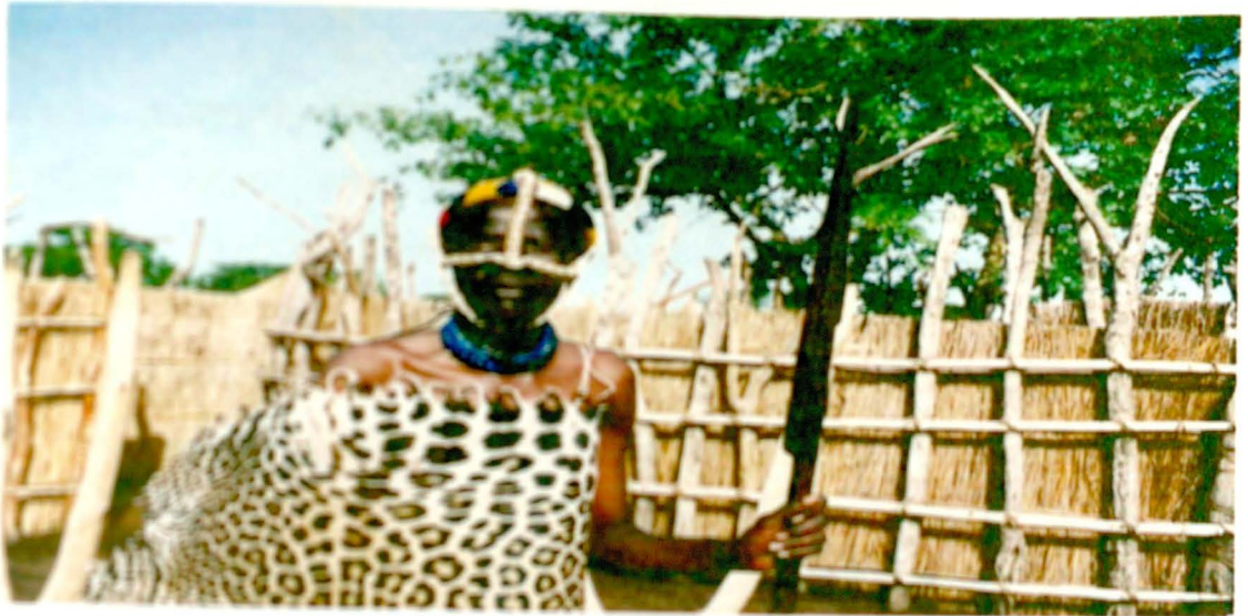
በ1995 እ.አ.አ የገበሬ ለጎገ ለገገ ጽዮን ሆኖ ተባብሮ ሲሾም የተነሳ ፎቶግራፍ።

እጩው ሆኖ ለልባሳትና ጌጣጣቸውን አሟልቶ ማድረጉን የእናቱ ወንድሞች ካረጋገጡ በኋላ ለቆየውት ወደ ጻቶሩ ይመጣሉ። በዚህ ጊዜ የእጩው ሆኖ ሚስቶች፣ እንጆራ እናቶችና የቅርብ ዘመድ የሆኑ ሴቶች ተንበርክከው "አግዋጋ" የሚባል ስሜት ቀስቃሽ የገገና ዘፈን ይዘገቡናሉ። ዘፈኑ እንደተጀመረ እጩው ሆኖ በእናቱ ወንድሞች ታጅቦ "ጽዮን" እና "ጽዮን" የሚባሉ ሁለት ጦርች በግራና ቀኝ ይዞ እየሰበቀና እየፎከረ ወደ ጻቶሩ ይመጣል። በዚህ ጊዜ አንድ ሰው ትንሽ ከበሮ ከብብቱ ስር ታቅፎ ድም ... ድም...ድም... በሚል ረጋ ያለ ምት እየመታ የሆነውን እንቅስቃሴ አብሮ ያጅባል። ከጥቂት ቆይታ በኋላ ዘፈኑ ይቆምና ምሉ ላይ የመቀመጥ ሥንሰርዓት ይከናወናል። ምሉ ላይ የመቀመጥ ስንሰርዓት ሲከናወን ከእጃቢዎች በስተቀር ስንሰርዓቱን በጥምና ከመኪታተል ባለፈ ለግንጥ ሰው መቆምና መንቀሳቀስ አይፈቀድም። እጩው ሆኖ በምሉ ላይ ምንጥ ላይፈራ፣ ላይርበተበትና ላይገንገገድ የመቀመጥ ግዴታ አለበት። ከተገንገገደ፣ ከፈራና ከወደቀ የሆኑ ልጅ እይደለም ስለሚባል ወዲያው በእጃቢዎቹ