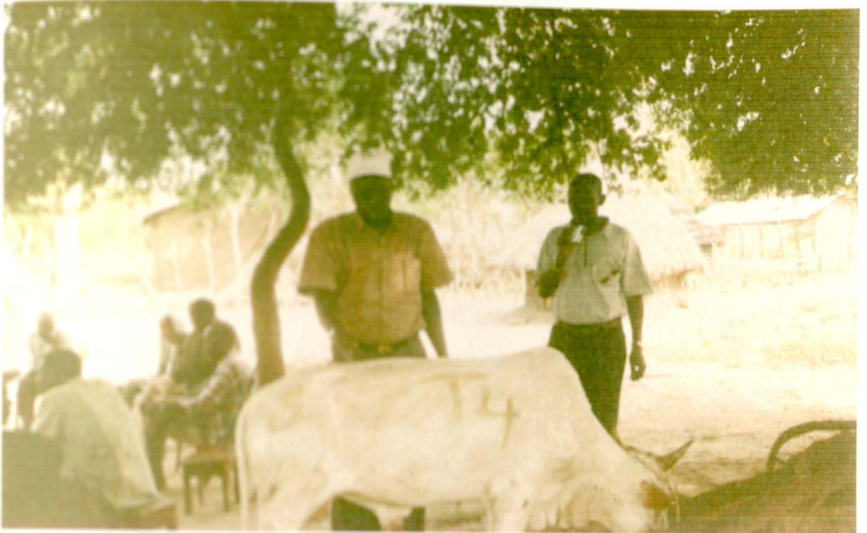
በአዲስ አበባ የፍጥነት ማረጋገጫ ማዕከል የተከሰተውን በሬ በዳቱ ደርባውን እያሳሱ ዳግም ሙሉ ግጥተ ለጸሐፊው ሙሉ የሆነ መሆኑን ለማረጋገጥ ሲሳሰሩ