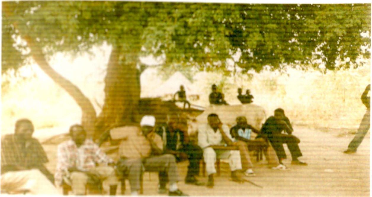
የሽማግሌና ልሳኝ ስርዓት የሚከናወነው ካርታክ ይህንን በመሰለ የዛፍ ጥላ ስር ነው።

መኖር ተቋማት መጠሪያ ሲሆን እንደ ግጭቶች አይነትና መጠን በተለያዩ ደረጃዎች የተቋቋሙ የካርታክ አይነቶችም አሉ። ዝርዝሩ እንደሚከተለው ቀርቦአል።