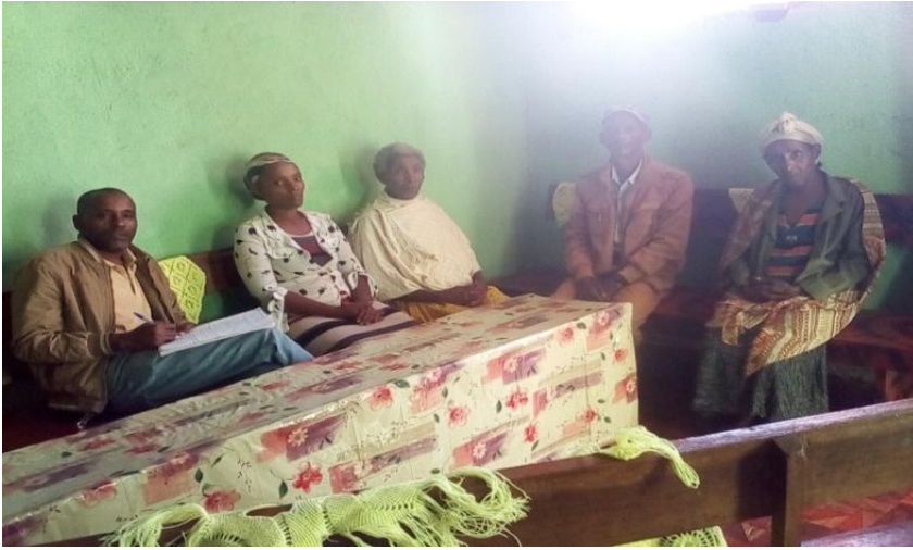
Suura od-himtoota marii garee 05 /07/2011