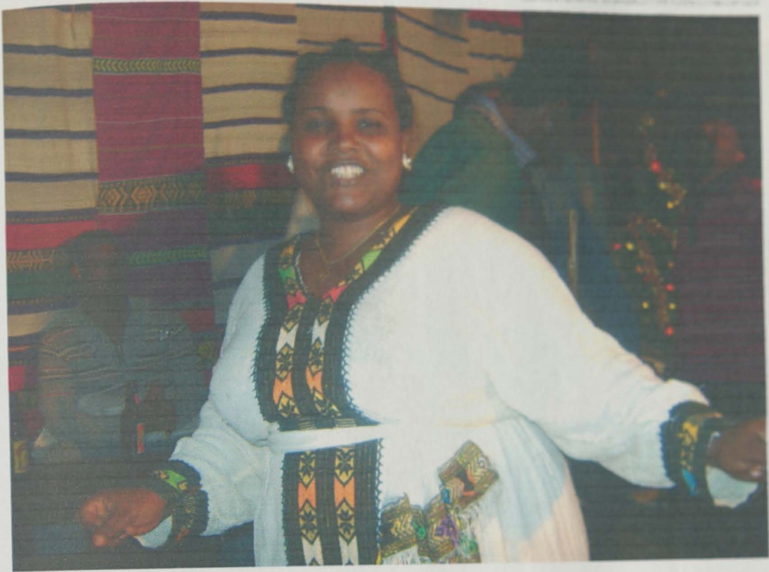
አዝማሪ ምግብ ግድ የለጡ