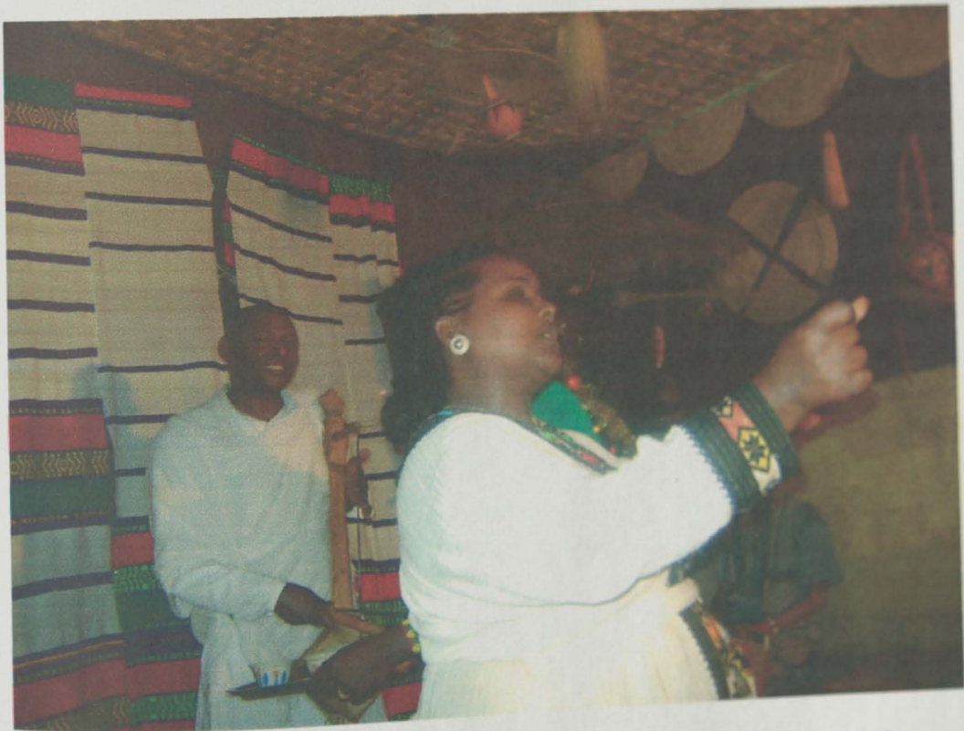
የአዝማሪ ወርቁ እና የአዝማሪ ምግብ ግድ የለው ክዋኔ እና አውዳዊ ሁኔታ