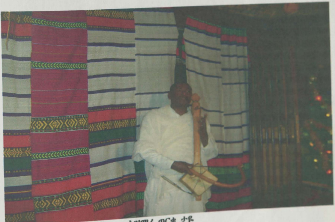
አዝማሪ ወርቁ ታዩ