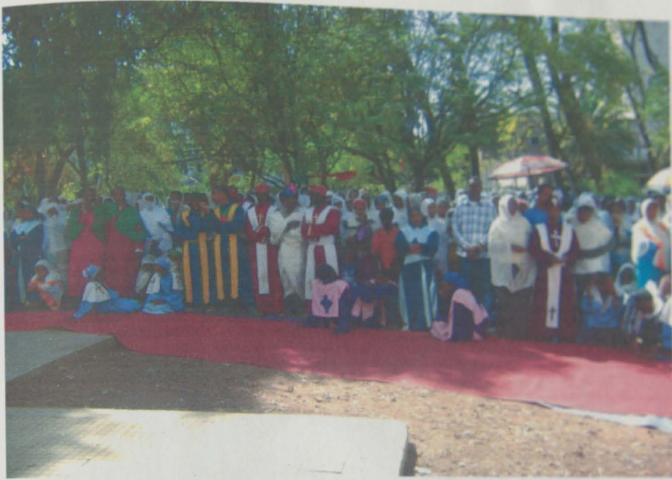
የጊዮርጊስ ሰባሩ ጥምቀት አውጭ ክብረ በክል