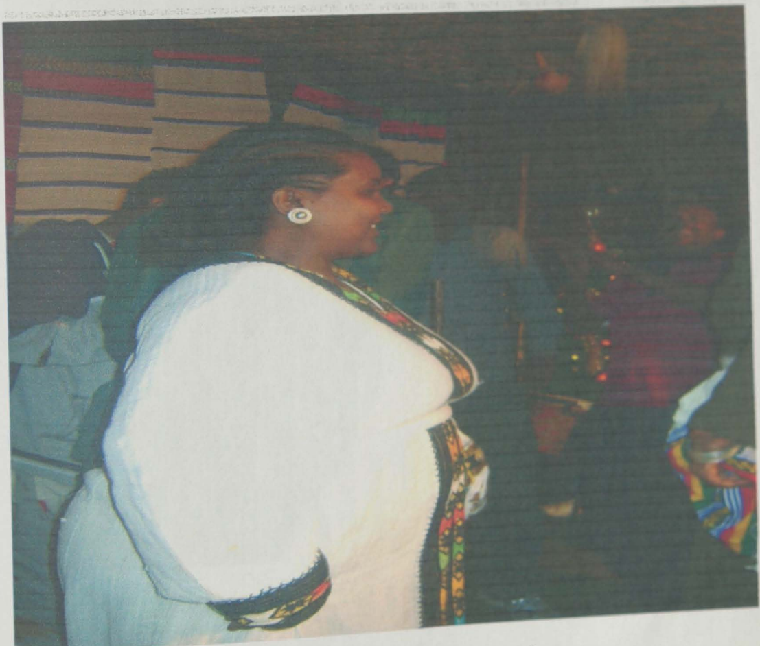
አዝማሪ ምግብ ግድ የለው በክፍና ወትት