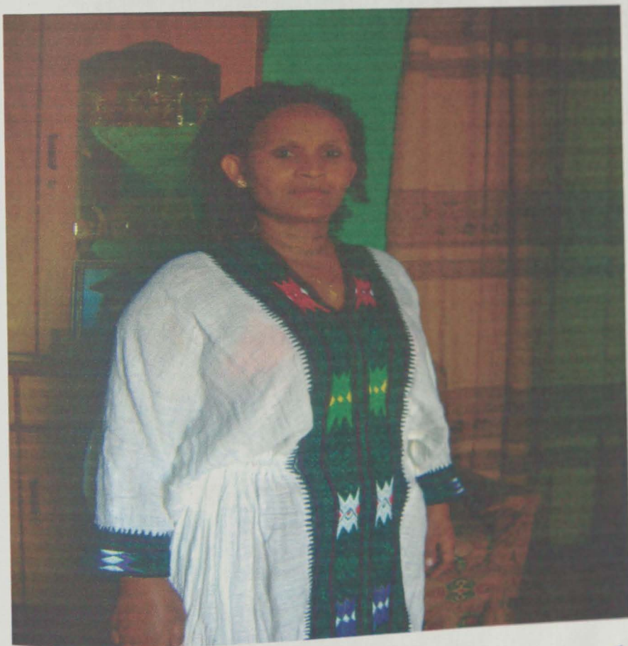
አዝማሪ ማሽ ፋንታዬ