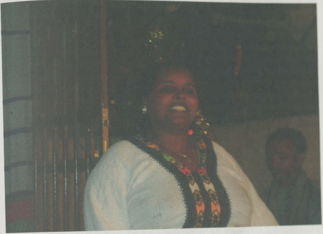
አዝማሪ ምግብ ግድ የለው