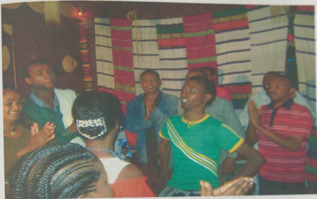
የዳምት ባህል ምሽት ቤት አውዳዊ ክዋኔ