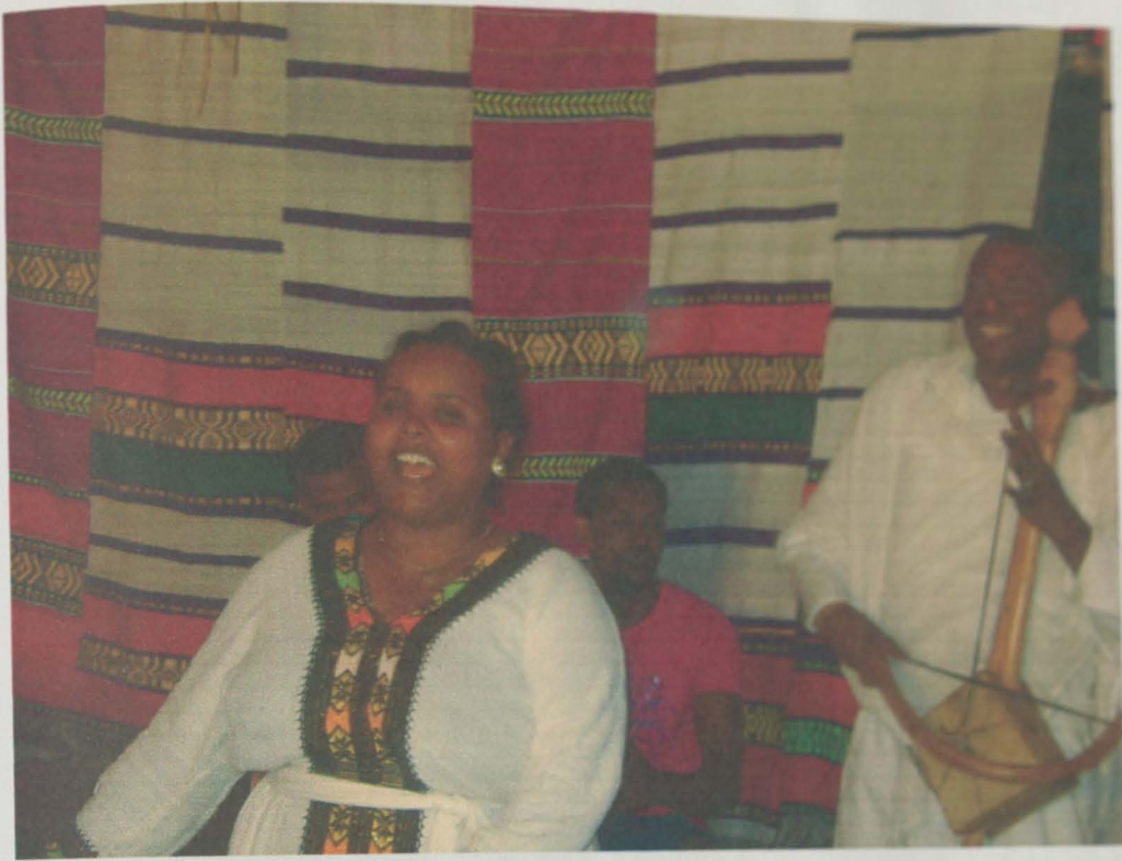
አዝማሪ ምግብ ግድ የለው እና አዝማሪ ወርቁ ታዩ በዳሞት ምሽት ቤት ክዋና ወትት