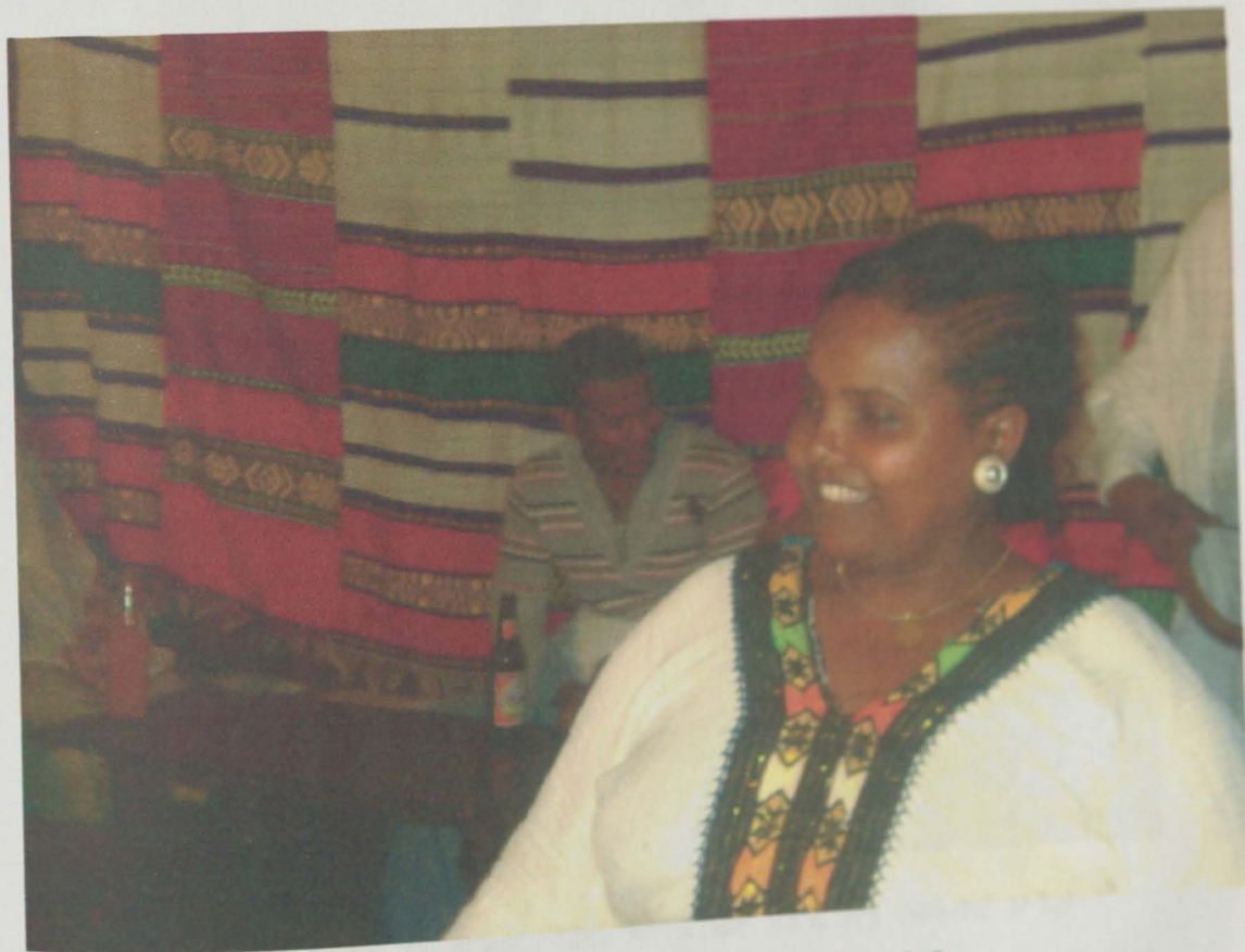
አዝማሪ ምግብ ገድ የለው በባህል ምሽት ቤት ውስጥ