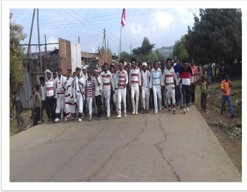
Suura-11: Yeroo dhaloonni gara Galmaatti Ayyaana Yaadannoo Warra Abbaa Oromoo kabajuuf dhiichisaa deemu gaafa guyyaa 30/03/2012 Magaalaa Ejereetti