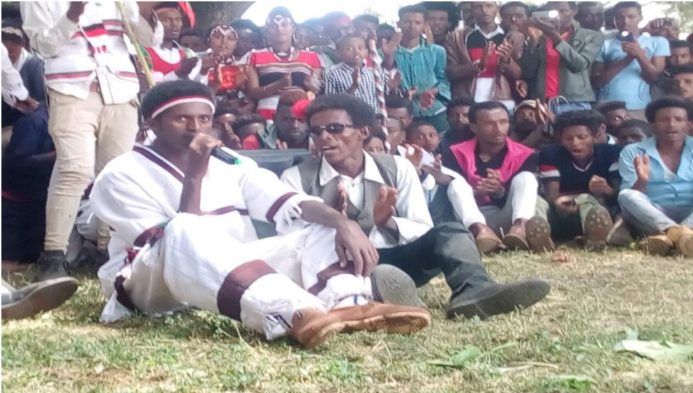
Suuraa-5: Hirmaattonni AYWAO yeroo jeekkarani mul’isu

Jeekkarsi kun jeekkarsa galgala yeroo dhaloonni Galmatti walgahee jeekkaramuudha. Innis, “Yaa Waaq nagaan ooltee?” jechuun kan eegaluufi humna Waaqaatiin dhaloonni ooluu isaaf Waaqaaf galatoo galchuuf kan dhaloonni Galmatti jeekkaruudha. Waaqni beekaa, waa hunda kan namaa taasisu, waan hunda kan namaaf kennuu danda’u ta’uu isaafi guddummaa Waaqaa ibsuuf jeekkarsa jeekkaramuudha.