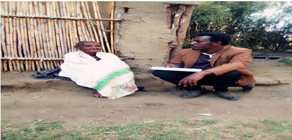
Suura-1: Af-gaaffii gaafa 23/05/2012 Boggee Gaarii waliin taasifame.

Akka gaaffiifi deebii 23/05/2012 Boggee Gaarii waliin taasifame irraa odeeffannoon argame mul'isutti(hubachuun danda'ametti), maalummaa Ayyaana Yaadannoo yeroo ibsan, Ayyaana dhaloota darbe yaadachuuf geggeeffamu ta'ee, dhaloota darbeef yaadannoon akka ta'u, dhaloota jiruuf immoo ayyaantummaan akka cimuu, qananiin akka jiraatu, dhaloonni akka ofta'ee akka walta'uuf akkasumas, abbaa waan ofii akka ta'uuf, Ayyaana Galmatti Oromoon waliin geggeeffataa tureefi har'as hamma tokko geggeeffachaa jiru keessaa isa tokko akka ta'eedha.