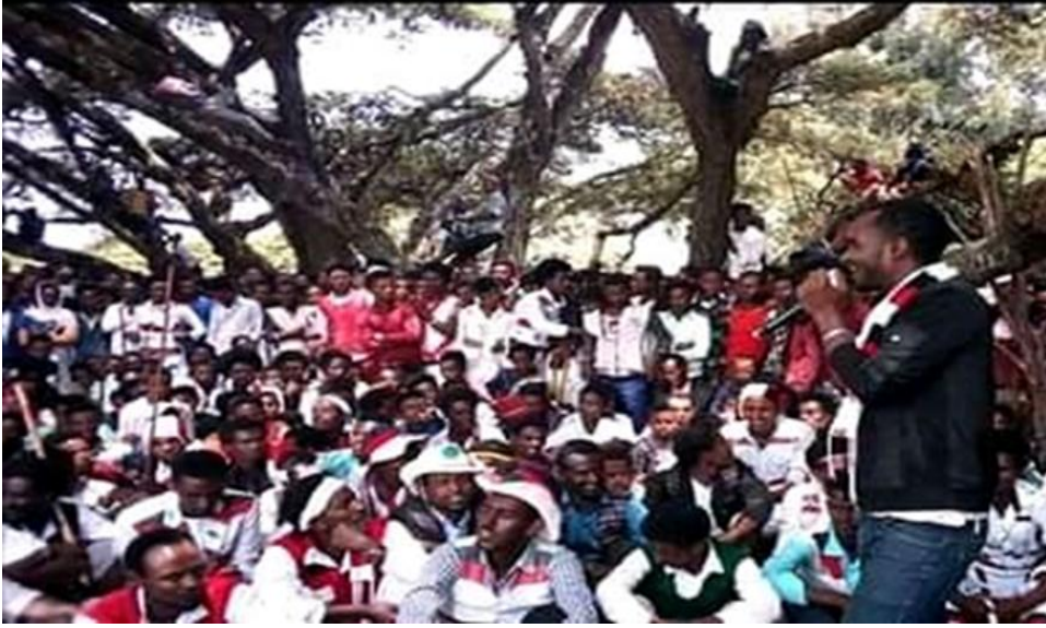
Suuraa-4: Hirmaattota Ayyaana Yaadannoo Warra Abbaa Oromoo guyyaa 08/06/2012 Galma Hundee Ganamaatti