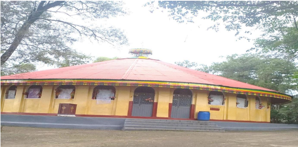
(መንበረ መንግሥት መድኅኔዓለም የአንድምታው ጉባኤ ቤት የሚገኝበት 2011)

በግቢው ውስጥ ከሚገኙት አብያተ ነገሥታት ግንቦች መካከል አንዱና ዋናው የዐፄ ፋሲል ቤተ መንግሥት ነው። በመቀጠል የዐፄ ዮሐንስ ቤተ መንግሥት፣ የዐፄ ኢያሱ አድያም ሰገድ ቤተ መንግሥት፣ የዐፄ ዳዊት ቤተ መንግሥት፣ የዐፄ በካፋ ቤተ መንግሥት፣ የእቴጌ ምንትዋብ ቤተ መንግሥት እና የኢያሱ (ቋረኛው) ቤተ መንግሥት ሕንጻዎች ተጠቃሾች ናቸው። ፊት አቦ፣ ፊት ሚካኤል፣ አደባባይ ኢያሱስ፣ ግምጃቤት ማርያም፣ እልፍኝ ጊዮርጊስ፣ መንበረ መንግሥት መድኅኔዓለም እና ደብረ ምሕረት አቡን ቤት ቅዱስ ገብርኤል ዐፄ ፋሲል በዋናነት ያሠሯቸው አብያተ ክርስቲያናት ናቸው። ንጉሡ በመጨረሻ ማንኪት ከሚባለው ቦታ ላይ የጥምቀተ ባሕር መከበሪያውን ቤተ መቅደስ አሠርተዋል (ለቀ ሊቃውንት ዕዝራ ሐዲስ 2011 ቃ.መ)።