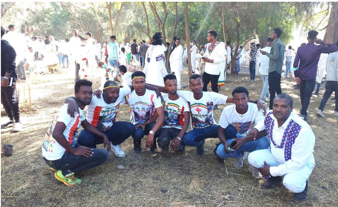
(በጽዋ ማኅበር የተደራጁ ወጣቶች በጎንደር ጥምቀት ከአጥኚው ጋራ 2013 ዓ. ም)

የጎንደር ጥምቀት ትልቅ የግብረ ገብ ትምህርት ቤት መሆኑን መረጃው ያረጋግጣል። ወጣቶች ዝቅ ብለው ምንጣፍ በማንጠፍ፣ መንገድ በመጥረግ፣ ሽማግሌዎችን በመደገፍ፣ ሕጻናትን በማቀፍ፣ እንግዶችን በመቀበል፣ ጸጥታውን በመጠበቅ የተለያዩ በጎ ተግባራትን ሲፈጽሙ ይስተዋላል። በጎ ተግባራትን የሚደርጉት በተናጠል ሳይሆን በአብዛኛው በጽዋ ማኅበር የተደራጁ ናቸው።