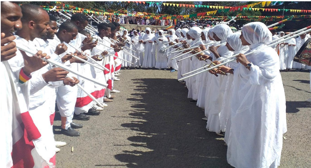
(በጎንደር ጥምቀት የሰንበት ዘማርያን/ት በፒያሳ መስቀለ አደባባይ ሲያስረገጡ 2013 ዓ.ም)

የሰንበት ዘማሪዎች በዝማሬ ደረጃ ጸናጽል፣ መቋሚያ፣ ከበሮ እና ቃለ እግዚአብሔሩን በመሳተፍ እኩል በቅብብሎሽ ወይም በተራ ያስኬዳሉ። ወንዶቹ ዘማሪዎች ከሴቶቹ በተለየ ወይም በተሻለ መልኩ የሚዘምሩት፣ የሚወርቡት፣ የሚቸባኝቡት እና የሚያስረገጡት ክዋኔ የለም። እጅግ እኩል በሆነ መልኩ የጸናጽል፣ የመቋሚያ፣ የሽብሻቦ እና የወረብ ክዋኔ በአየተራ ያቀርባሉ። በጎንደር ጥምቀት በወንድና ሴት ዘማሪዎች የሚከወን የሰንበት ዘማሪዎች እንቅስቃሴ ቀልብን እጅግ ይስባል። በዕለተ ጥምቀቱ የሰንበት ዘማርያን እንደ ካህናቱና ሊቃውንቱ ኹሉ የራሳቸው የቦታ አደረጃጀት አላቸው። ደረጃቸው ከታቦቱ፣ ከቀሳውስቱ እና ከሊቃውንቱ ቀጥሎ በምእመኑና በሊቃውንቱ መካከል ያለውን ቦታ ይሸፍናል።