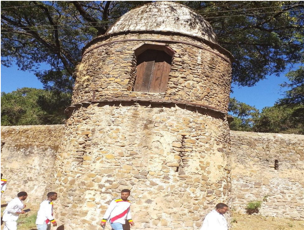
(የባሕረ ጥምቀቱን ዙሪያ ገባ አጥር የሚያሳይ ፎቶ ግራፍ 2013)

ተከትሎ የሚሔድ ሳይሆን ከማንኪት እስከ መስቀል አደባባይ ፒያሳ ድረስ ያለው ቦታ ጥምቀት የሚከበርበት ነው። ሁሉም ቦታ ጭፍራ ሁሉምቦታ ዝማሬ፣ እና ሁሉም ቦታ ሆታ ይታያል። ይህ ሁሉ ጥምቀቱን እየታደመ የፋሲልን ግንቦች የሚመለከተው ሰው በርካታ ነው። የሕንጻ አሰራሮቹ በአሁኑ ዘመን የሚታዩ ባለመሆናቸው የእንግዳን ቀልብ የመሳብ እና የመማረክ አቅም አላቸው። በተለምዶ ፋሲል ግንብ ይባላል እንጂ በጎንደር ጥምቀት ማክበሪያ ከባሕረ ጥምቀቱ ውጭ ያሉ አጥር ዙሪያ ገባው እና አካባቢው ሁሉ በማራኪ ግንቦች የተሞላ ነው።