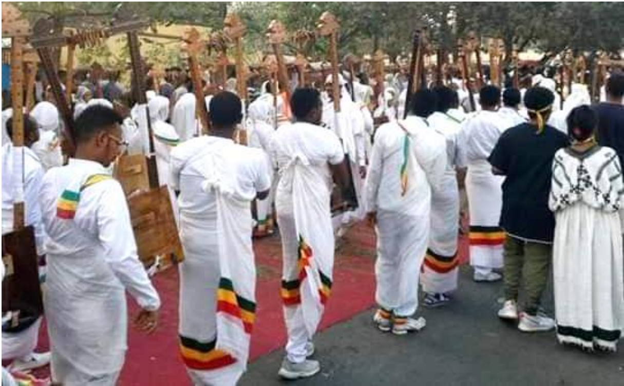
(በጎንደር ጥምቀት ክብረ በዓል የበገና ቅኝትና ክዋኔ 2011)

ሌላው የጎንደር ጥምቀት ባህላዊ ዕሴቶችና ዕውቀቶች ከነ አካቴው 113 እንዳይጠፉ እና እንዳረሱ የማድረግ መጠነኛ አስተዋጽኦ አለው። በጥምቀቱ ዕለት የጥምቀቱ ማክበሪያ የሆኑት እንደ ማሲንቆ፣ ዋሽንት፣ በገና ከበሮና መሰል መገልገያ መሳሪያዎች ብቻ ሳይሁን የበገናው ቅኝት፣ የከበሮ አመታት፣ የዋሽንት አነፋፍ፣ የማሲንቆ አመታት ዕውቀቶች እንዲቀጥሉ ያደርጋል። የምቀት ክብረ በዓል እየጠፋ እና እየተረሳ ያለውን የበገና ቅኝት እንደ መከወኛ ሰብብ በመኾን መጠኑ እንዲታወስ እና እንዲቀጥል የማድረግ አስተዋጽኦ አለው (አየለ ቴዎድሮስ፣ 2013 .መ)።