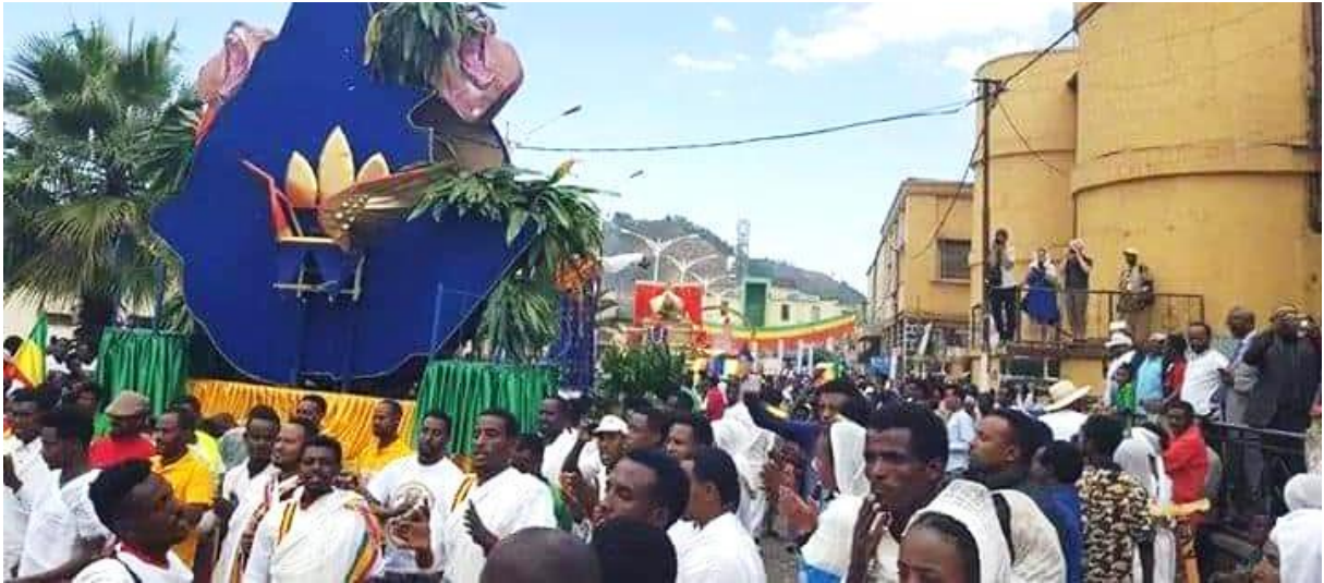
(የኢትዮጵያ ካርታ እና ሠንደቅ ዓላማ በጎንደር ጥምቀት ክብረ በዓል 2011)

በጥምቀት ዕለት የኢትዮጵያ ምስልና፣ ሰንደቅ ዓላማ የሚወጡት ጎንደር ማንነት ከጎንደር ዐልፎ ኢትዮጵያዊ መሆኑን የሚያዘክር ነው። የሰንደቅ ዓላማ እና የኢትዮጵያ ካርታ በጥምቀቱ ላይ ወጥተው መታየታቸው የጎንደር አካባቢ ሕፃናት እና ወጣቶች በቀላል መንገድ ማንነታቸውን እያወቁ እንዲመጡ የማስቻል ዐቅም አለው።