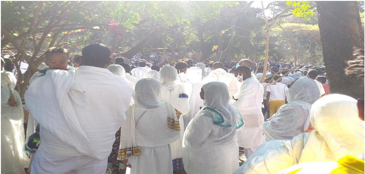
(የጸበል ርጭት ሥርዐት በጎንደር ጥምቀት 2013)

በጎንደር ጥምቀተ ባሕር ከመፈወስ ጋራ በተያያዘ ጳጳሱ ከባሕርትና ከተረጨ በኋላ ከዛፍ ላይ እየዘለሉ ወደ ጥምቀተ ባሕር ገንዳ ይገባሉ። የተጠማቂው ቁጥርና የዋናተኛው ቁጥር በውል ስለማይታወቅ አንዳንድ ጊዜ በመዋኛው ገንዳ ውስጥ የመጨናነቅ እና የመታፈን ኹኔታዎች ያጋጥማሉ።