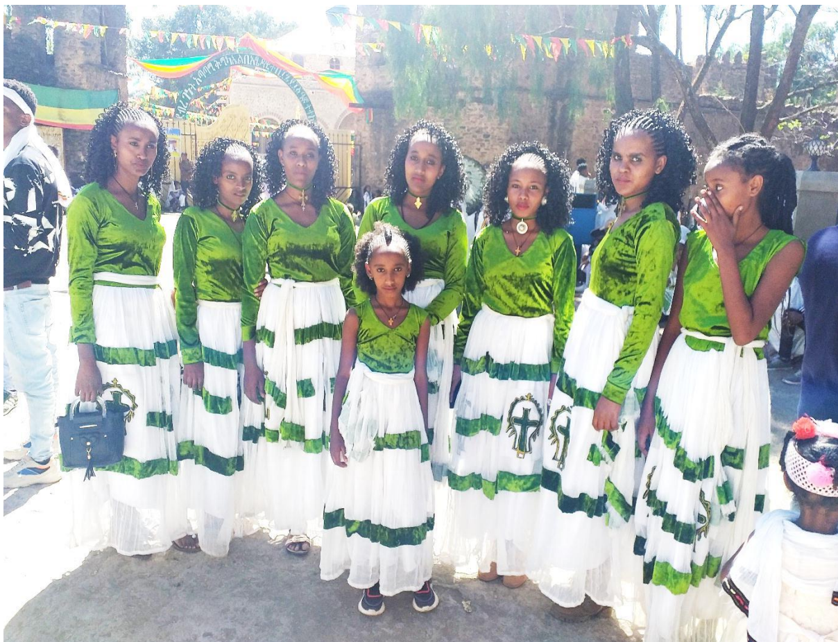
(በጎንደር ጥምቀት ክብረ በዓል በቀኝ በኩል ደመቄ እና ባልንጀሮቿ አለባበስ እና አጊያጊያጥ 2013 ዓ.ም)

ሌላው በካህናቱና ሊቃውንቱ በጥምቀተ ባሕሩ ዋዜማ፣ በባሕረ ጥምቀቱና በጥምቀቱ ጉዞ ላይ አንዳቸው ለሌላቸው ክብር በመስጠት አዲስ እንግዳ ካህን ሲመጣ ከወገብ ሸብረክ ብለው እጅ ሲነሳሱና ምርፋቅ ቅደሚያ በመስጠት የተለየ ፍቅር ሲያሳዩ በ2011 ዓ.ም በነበረው የጥምቀት ክብረ በዓል ምልክታዬ አረጋግጫለሁ።