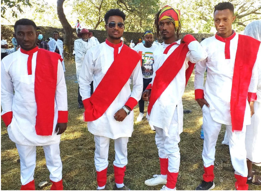
(የጎንደር ወጣቶች ጃኖ በመልበስ የጥምቀትን በዓል ሲያከብሩ የሚሳይ 2013 ዓ.ም.)

በሌላ መልኩ እነዚህ ቀለማት መንፈሳዊ አንድምታም አላቸው። ቀዩ የኢየሱስ ክርስቶስ በቀራንዮ አደባባይ ተሰቅሎ ለሰው ልጆች ድኅነት የሰጠውን እና የከፈለውን ዋጋ የሚያመለክት ነው። ነጩ ልብስ ደግሞ የውሐ የጥምቀት ምሳሌ ተደርጎ ይወሰዳል። ሊቀ ሊቃውንት ዕዝራ ቀይ፣ ቢጫ፣ አረንጓዴና ቀይ የአራቱ ባሕርያት ሥጋ ምሳሌዎች እንደሆኑ ያስረዳሉ። በመኾኑም በጥምቀት ዕለት የሚለበሱት የቀለማት ኅብር የጎንደርን ማኅበረሰብ አንድነት እምነት፣ ዕሴት እና ፍልስፍና የሚያሳዩ ማኅበራዊ ፋይዳዎች አሏቸው (ሊቀ ሊቃውንት ዕዝራ ሐዲስ፣ 15/11/2011 ቃ.መ፣ እማሆይ ጠጋ ደጀን 03/13/11 ቃ.መ)።