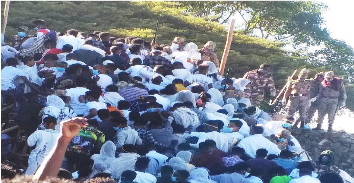
(ወደ ባሕረ ጥምቀቱ ለመባረክ እና ጸበል ለመረጨት የሚደረግ የርብራብ ላይ ጉዞ 2013 ዓ.ም)

በትግሥት እና በመቻቻል ግፊውን ተቋቁሞ እየተረገጠ እና እየወደቀ በርብራብ ላይ ዐልፎ በረከቱን ይካፈላል።