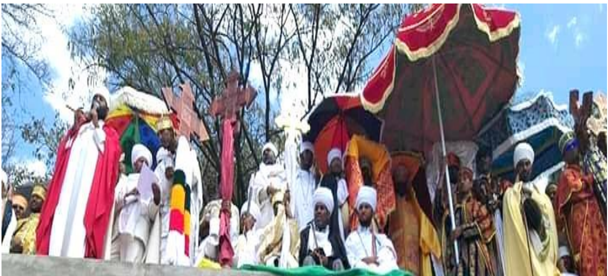
(ታቦታቱና ቀላውስቱ በማንኪት ታቦት ማደሪያ 2011)

ቀላውስቱ በጎንደር ጥምቀት ተሳትፏቸው መንፈሳዊነት ያለው ኹኖ ከከበሮና ከጸናጽል፣ ከሽብሻቦና ከመረግድ ይልቅ በቅዳሴና በሰዓታት ላይ ያተኮሩ ናቸው። አለባበሳቸው እጅግ የማረና በኅብረ ቀለም ያሸበረቀ ነው።