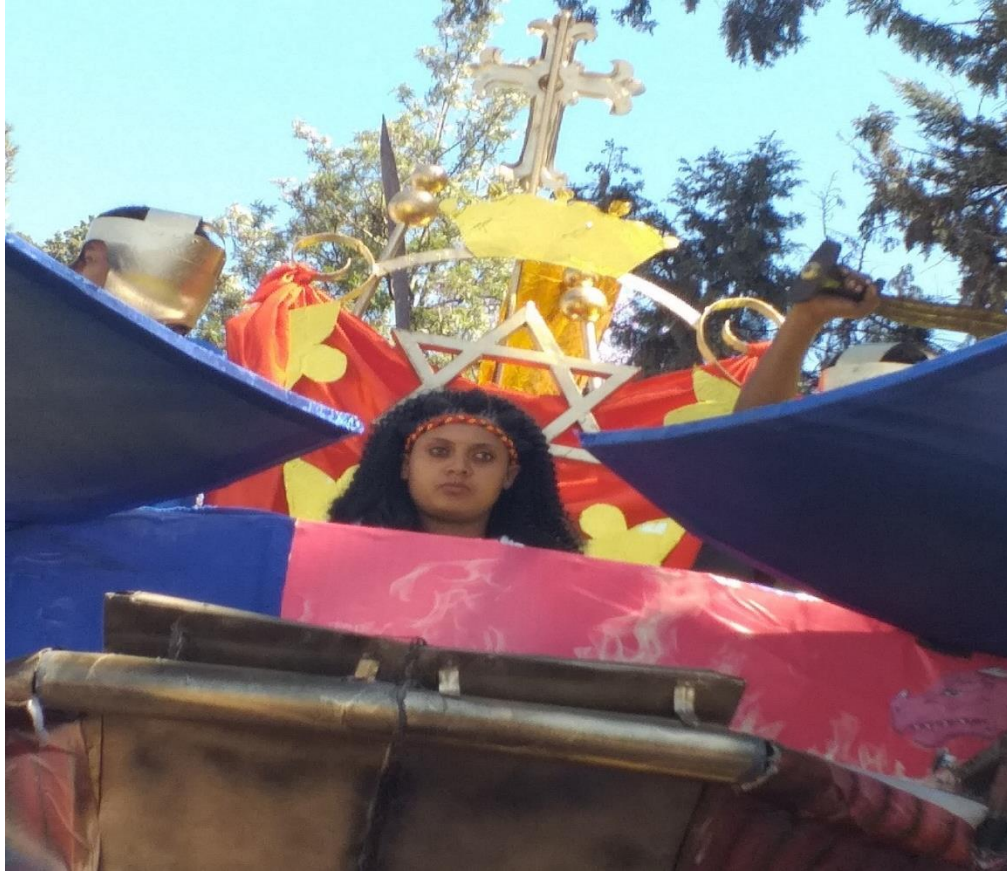
(ጎንደርን የወክሎች ባለደንበኞች ወይዘሮ በጥምቀት ክብረ በዓል በመርከብ ላይ 2013 ዓ.ም)

ሌላው የጎንደር ልጃ ገረድ የጎንደርን ጥልፍ ቀሚስ ለብሳ መንጥቅ የሚባለውን እስክስታ ስትመታና እንደ እንዘርት ስትበር ያላት ቅልጥፍና እና ቅርጽ ከንስር አሞራ ጋራ ይፈካከራል። በምልከታዬ ያረጋገጥኩትን የጎንደር አቀንቃኝ ልጃ ገረድ የንስር አሞራ ቅርጽ እና ፍጥነት ማሳበረሰባዊ አንድማታ እና ተምሳሌት አለው። አንድም ንስር አሞራ የጀግንነት፣ የአሸናፊነት ተምሳሌት ነው፤ አንድም ንስር አሞራ የየፍጥነት እና የባላንጣ ቀጭነት ተምሳሌት ነው፤ ይህ ደግሞ የጎንደር ማሳበረሰብ አገራቸውን ሊደፍር ከመጣው ምሁዲስት እና ጣሊያንና ጋራ ያደረጉትን ተጋድሎና ድል አድራጊነት ያሳያል። በመኾኑም ንስር አሞራ የሚመስለው መንጥቅ እስክስታ የጎንደር ጀግንነት ተምሳሌት ተደርጎ ይወሰዳል። ሌላው ንስር አሞራ “ገጸ ሰብ ወ ገጸ እንስሳ፣ ገጸ ንስር ወገጸ አንበሳ” ከሚባሉት ከዐራቱ ጸወርተ መንበር ኪሩቤል መካካል አንዱ ነው። በመኾኑም ንስር አሞራ ቅርጽ ያለው መንጥቅ እስክስታ ከጀግንነት መገለጫ በተጨማሪ የጎንደር ማሳበረሰብ ሃይማኖት መገለጫም ነው (አባ ገብረ ሥላሴ 03/ 06/11 ቃ.መ)። ስለሆነም የጎንደር ቀሚስ፣ መቀነት