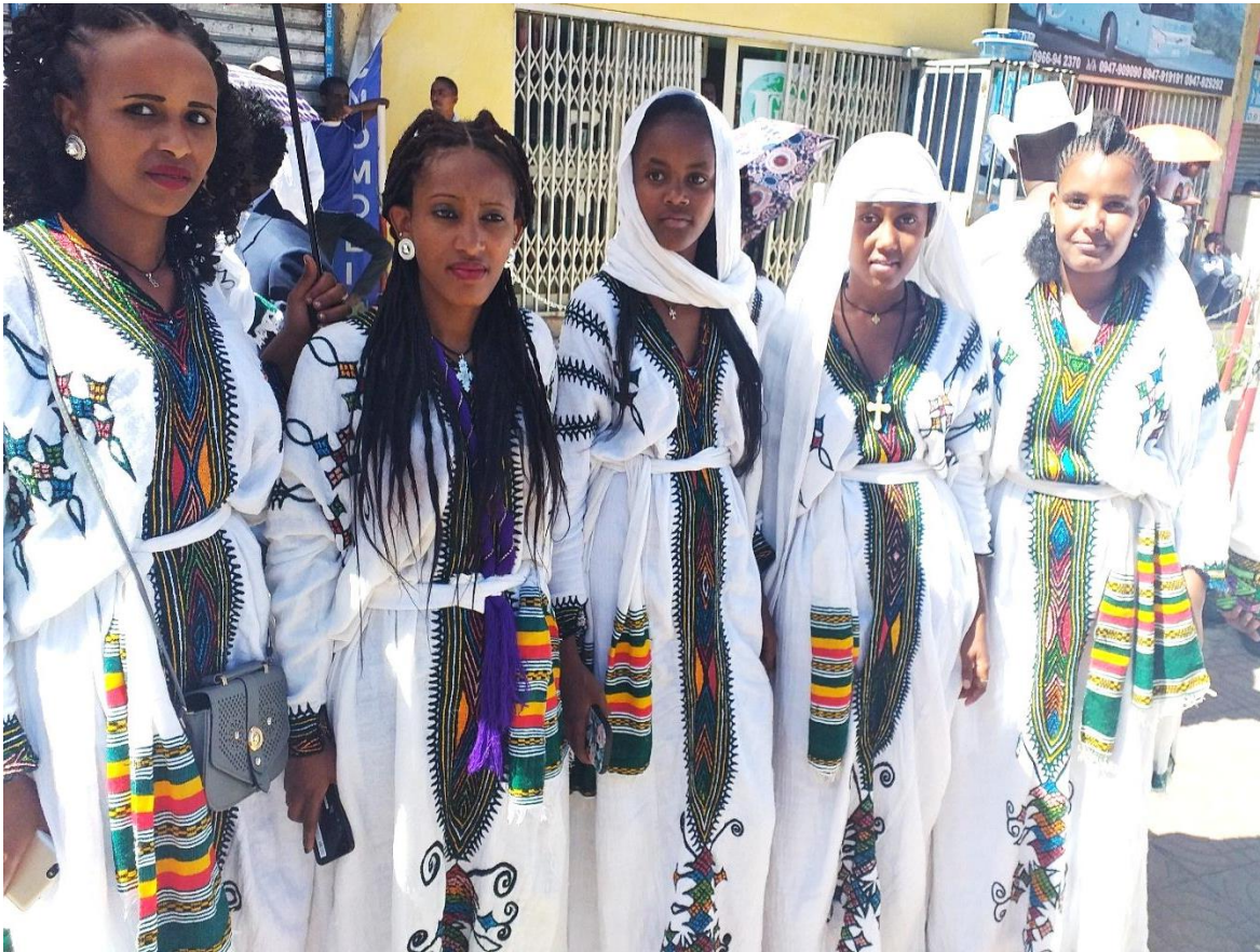
(የጎንደር ጥልፍ ቀሚስ እና መቀነት አለባበስ በጥምቀት ክብረ በዓል 2013)

ይህ የጎንደር ጥልፍ ቀሚስና መቀነት የራሱ የሆነ ሰባዊ እና ማኅበረሰባዊ አንድምታ አለው። ጥልፍ ቀሚሱ ንጹሕ እና ዐዲስ መሆኑ በጥምቀት ክብረ በዓል ሰዎች ራሳቸውን ከሚያሰሩባቸውና ከሚያሳስባቸው ነገሮች ወጥተው በደስታ እና በንፁሕ ህሊና የማክበራቸው ተምሳሌት ነው (ህይወት ገብሩ፣ መልሽው ጌጡ እና የኛነሽ መለሰ 2013 ቃ.መ)።