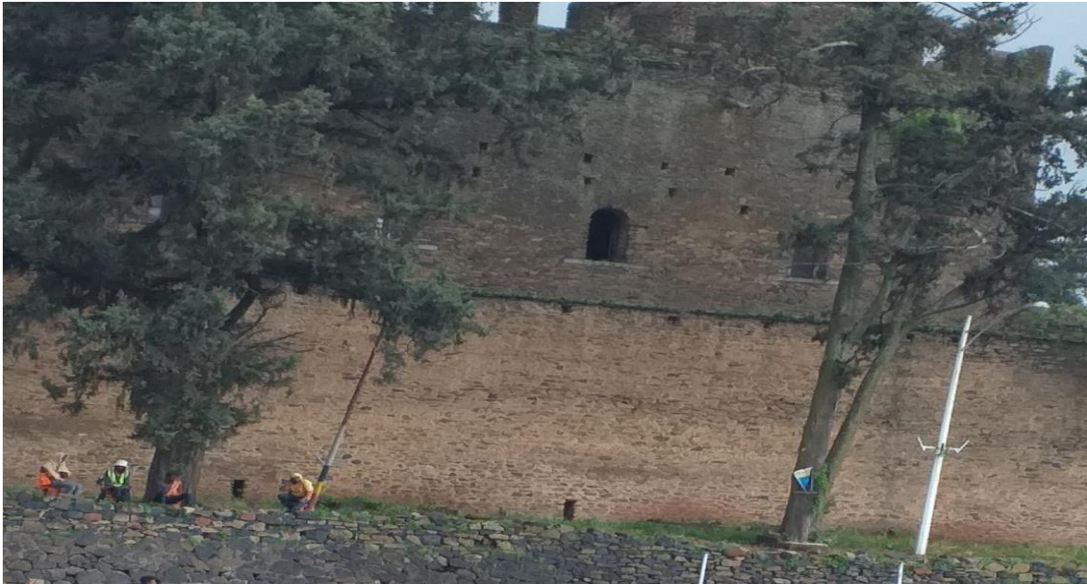
(የዐፄ ፋሲል ግንብ 2011 በአጥኝው የተነሣ ፎቶ ግራፍ)

ይህ ግንብ በጎንደር ከተማ ውስጥ የሚገኝ የከተማዋ አውራ ምልክት ነው። ግንቡ ከጎንደር ከተማ ዐልፎ ለሀገራችን በቅርስነቱ እና በቱሪስት መስሕብነቱ ትልቅ ድርሻ አለው። የዐፄ ፋሲል ግንብ 70,000 ካሬ ሜትር እና 900 ሜትር እርዝመት አለው። የዐፄ ፋሲል ግቢ ዐሥራ ኹለት በሮች፣ ሦስት አብያተ ክርስቲያናት፣ ስድስት አብያተ መንግሥታት እና ሌሎች ቀደምት ሕንጻዎችን አካቶ የያዘ ነው (የቱ.ሀ.መ. መ. ቅጽ 6 ቁ. 9፣ 2010፣3)።