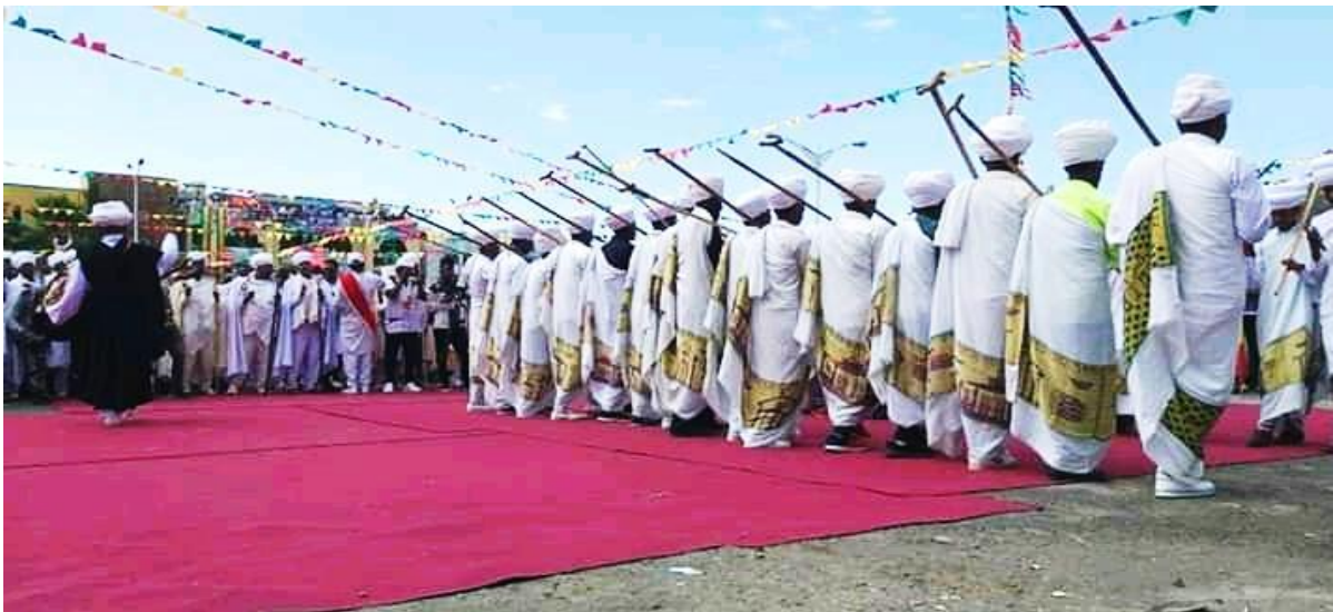
(በጎንደር ጥምቀት ሊቃውንቱ በሥርዓተ ቁመት ላይ ሲያስረግጡ 2012 በአጥኝው የተነሣ ፎቶ ግራፍ)

ሌላው ሊቃውንቱ በጸናጽል እና መቋሚያ አያያዞች የየራሳቸው ሥርዓት እና ጥበብ አላቸው። በጸናጽል ጊዜ የጎንደራው አቋቋም በመሪነት የሚወስድ ሲኾን በዘንግ ጊዜ ደግሞ የተክሌው አቋቋም ከቀኝ ወደ ግራ፣ ከግራ ወደ ቀኝ፣ ከፊት ወደ ኋላ፣ ከኋላ ወደ ፊት፣ ከላይ ወደ ታች እና ከታች ወደ ላይ የሚለውን የመቋሚያ ወይም የዘንግ ሥራ በበላይነት የተክሌ አቋቋም ይመራዋል። የጸናጽሉን የበላይነት ደግሞ የጎንደራ አቋቋም ሊቃውንት ይከውኑታል።