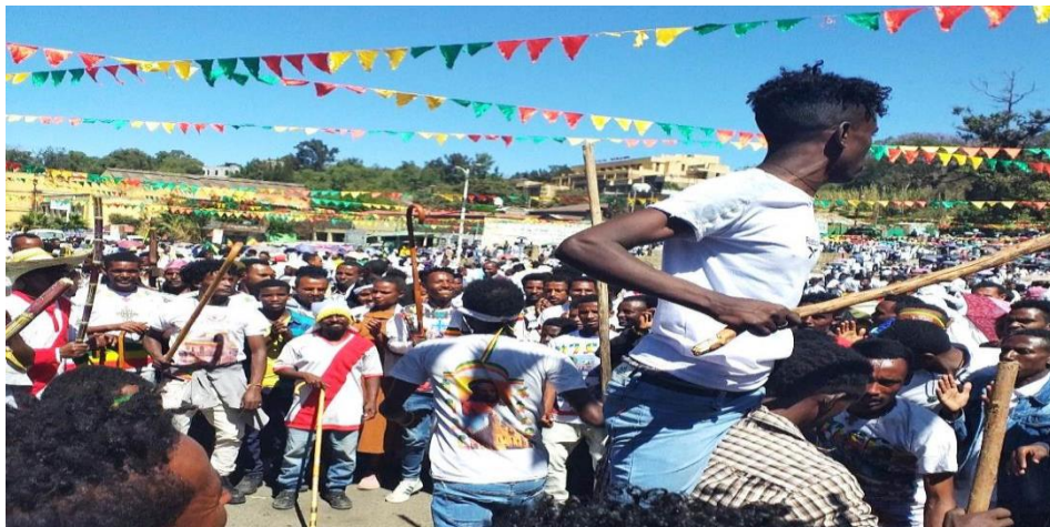
(ወጣቶች በአይብላሆመኔ ሆታ ላይ 2013)