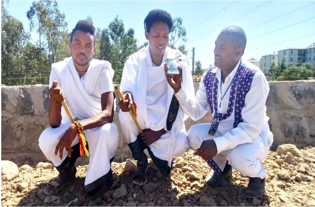
(ዘውዱ ይርጋ እና ይታያል ደመወዝ ከአጥኚው ከግራ ወደ ቀኝ በቃለ መጠይቅ ላይ 2013 ዓ.ም)

በዚህ ዕለት የሚታየው ለሰው ልጅ የሚሰጠው ፍቅር ሰላማዊ እና ትሕትና የተሞላበት ነው። ሰውን የመጥላት ዕሳቤ ተወግዶ በምትኩ በዚህ ቀን የአካባቢው ማኅበረሰብ ለሰው ልጅ አምላክ የሰጠውን ፍቅር በማስታወስ እና ልብ በማለት ራሱን የሚያስገዛበት ዕለት ነው። የጎንደር ጥምቀት ሕግ የተሠራው ከአምላክ ነው የሚለውን መነሻ በመያዝ በማኅበረሰቡ ውስጥ ከትውልድ ትውልድ እየተላለፈ መጥቶ አሁንም ድረስ የፍቅር በዓል መሆኑ ቀጥሏል (አባ ገብረ ሥላሴ 03/ 06/11 ቃ.መ)።