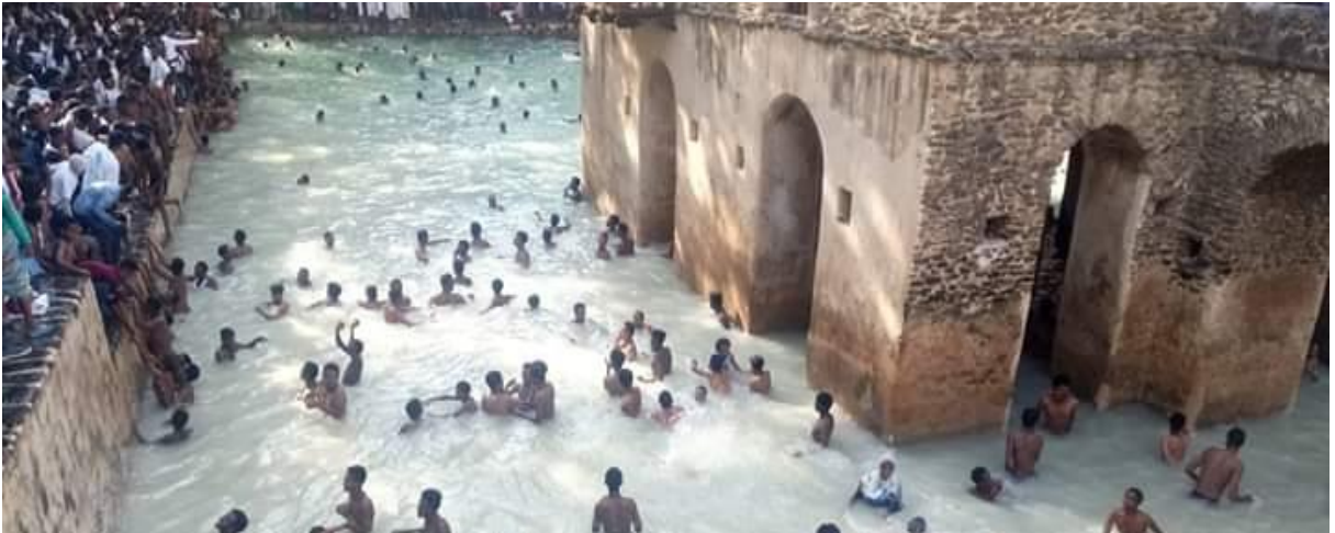
(የጥምቀተ ባሕር ግንብ 2011 በአጥኝው የተነሣ ፎቶ ግራፍ)

የጎንደር ከተማ ከዐፄ ፋሲል በኋላ በነገሡ የተለያዩ ነገሥታት የተገነቡ የ#4ቱ አድባራት ባለቤት ናት። ከእነዚህ መካከል በጎንደር ከተማ ታሪካዊና ከ#4ቱ አድባራት የሚመደበው አንዱ ደብረ ብርሃን ሥላሴ ነው። ደብረ ብርሃን ሥላሴ በ1674 ዓ.ም በአዐፄ ኢያሱ አድያም ሰገድ ዘመነ መንግሥት የተሠራ ታሪካዊ ደብር ነው። የቤተ ክርስቲያኑ ሕንጻ አሠራር፣ የቅዱሳን ሥዕላት አሣሣልና የቤተ ክርስቲያኑን ቅጽር ግቢ በአስተውሎት ሲመለከቱት መንፈስን እና ቀልብን የመሳብ ኅይሉ ከፍተኛ ነው። ቤተ ክርስቲያኑ በ1880ቹ ዓ.ም በድርቡሾች ወረራ ጊዜ ለማቃጠል ያደረጉት ሙከራ በታቦቱ ታምረኛነት ሳይሳካ መቅረቱ ይነገራል (የቱ.ሀ.መ. መ.፣ 6 ቁ. 9 2009፣4፣ 20010፣6)።