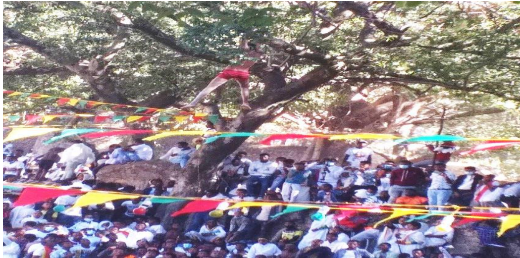
(በጎንደር ጥምቀት ክብረ በዓል ወጣቶች ወደ ባሕረ ጥምቀቱ ሲወረወሩ የሚያሳይ ፎቶ ግራፍ በአጥኝው የተነሳ 2013)

በባሕረ ጥምቀቱ ቦታ ከዋዜማው ጀምሮ የሚገኘው የሕዝብ ቁጥር በጣም በርካታ ነው። ይህ በቡድን፣ በቡድን ሁኖ በየ ፈርጁ የሚገኘው የሰው ድባብም፣ የተለያዩ ዘውጎች ክዋኔ ቱሪስቶቹን የሚስባቸው ይመስላል። ከጸበል ርጭት ጀምሮ የጥምቀት ባሕሩን ክዋኔ ደስታቸውን በሚያሳይ ስሜት በካሜራና በመቅረጸ ድምጽ ሲቀርጹ ይስተዋላል። በተለይ በባሕረ ጥምቀቱ ወጣቶች ከዛፍ ላይ ወጥተው ቁልቁል ወደ ባሕረ ጥምቀቱ የሚያደርጉት መወርወር ቀልብን ስቦ የሚያስቀር ነው። የዚህ ዓይነቱን የጥምቀት ባሕር ሥርዓት ቱሪስቶቹን የመሳብ ዐቅም ስላለው ቱሪስቶቹ ከአጠገብ አይጠፉም። ይህም የጎንደርን ማኅበረሰብ የመውጣት መውረድ፣ የማጣት፣ የማግኘት እና የመሾም መሻር የሕይወት ዑደት ያዘክራል (ሊቀ ሊቃውንት ዕዝራ ሐዲስ 15/11/2011 ቃ.መ እና ዲያቆን ፍስሐ መሥፍን 12/05/13/ ቃ.መ.)።