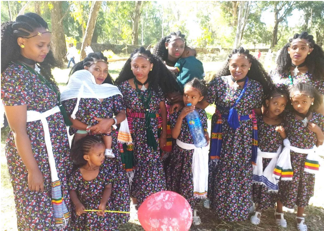
(በጎንደር ጥምቀት ክብረ በዓል ላይ ዝምድናን መሠረት ያደረገ አለባበስ እና አገራዊ ጥምቀት 2013)

ተመሳሳይ የሆነ ዐዲስ 112 ልብስ የለበሱት ልጃ ገረዶች የጥምቀት ተሳትፏቸው ተመሳሳይ ነው። አንደኛዋ ከጭፈራው ሌላኛዋ ከሆታው አይቀላውጡም። ከቡድኑ አባላት መካከል አንድ ብስል እንድ ጥሬ አይታይም። እነዚህ ልጃ ገረዶች ከዐዲሱ ልብስ ጋራ የራስ ሥሬታቸው፣ ጫማቸው እና እርባናቸውም ተመሳሳይ ነው። በዚህ መልኩ በጥምቀት ክብረ በዓል ዐዳዲስ አልባላት መፈጠር እና መምጣት በከፍተኛ ሁኔታ ይታያል። ይህ የሚያሳየው የጎንደር ጥምቀት የቆውን ባህል አልባላት መጠበቅ ብቻ ሳይሆን ዐዳዲስ ሀገር በቀል ዕውቀቶችን መሠረት ያደረጉ አልባላትም እንዲፈጠሩ እያደረገ መሆኑን አረጋጋጭ ነው። እነዚህ አዲስ የሚመጡት አልባላት ለአሁኑ ባህል ናቸው ባንልም እየተለመዱ እና በማጎበረሰቡ ዘንድ ተቀባይነት እያገኙ ሲመጡ ባህላዊ አልባላት ወደ መሆን የመሄድ እድል ይኖራቸዋል። እነዚህን አዳዲስ አልባላት የሚጠቀሙ ወጣቶቹ የዕድሜ መቀራረብ፣ የጾታ ተመሳሳሎ፣ የፍላጎት መስማማት እና የቤተሰብ ዝምድና የሚታይባቸው ናቸው (አየለ ቴዎድሮስ 10/05/2013 ቃ.መ.)።