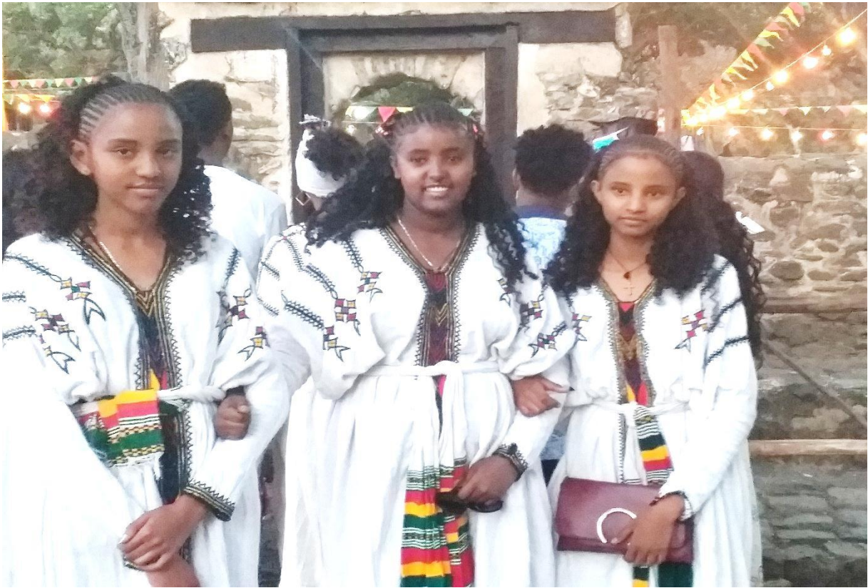
(በጥምቀት ክብረ በዓል ልጃ ገረዶች አበባ መሰል ጥልፍ ቀሚስ ለብሰው ሲያክብሩ 2013)

መረጃ ሰጭዬ እንደሚያስረዱት እና አጥኚው በምልክታ እንዳረጋገጠው ያላገቡ ልጃ ገረዶች ሙሉ እጅጌ ያለው የጎንደር ቀሚስና አበባ መሰል ጌጥ የበዛበት ጥልፍ ቀሚስ ከተዋበ መቀነት ጋራ ይሰብሳሉ። ይህ ጌጣጌጥ የበዛበት አለባበስ የወጣትነት፣ የማማር እና የመዋብ ተምሳሌት ተደርጎ ይወሰዳል። አበባ ገና ለፍሬ ያልበቃ በቀለማቱና በመዓዛው ንቦችን እና ቢራቢሮዎችን እንደሚሰብ ኹሉ ወጣት ሴቶችም ተመልካቾቻቸውን ይማርካሉ። የልጃ ገረዶቹ ጌጥ መብዛት አበባነትን፣ እንቡጥነትንና ዐዲስነትን የሚያዘክር ነው። በዚህ መልኩ ልጃ ገረዶችና አበባ ተመሳሳሎ አላቸው (ልዕልና ኅይለ መስቀል 12/12/2011 ቃ.መ)።