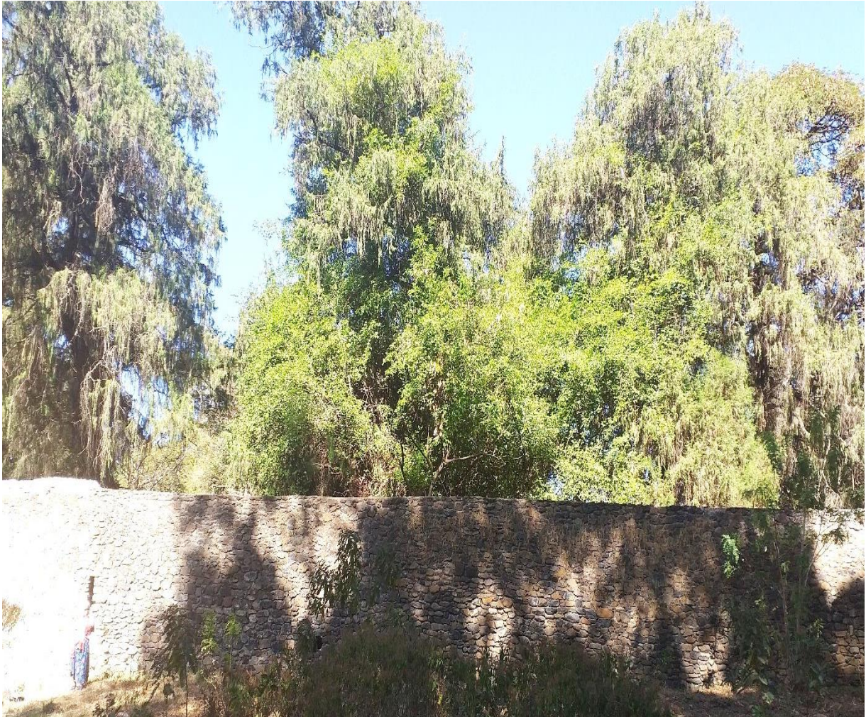
(የባሕረ ጥምቀቱ ተፈጥሮ ሀብት ከውጭ ሲታይ 2013)

እየተረጨላቸው ውሐ እየተቀዳላቸው ምግባቸውን ሲሰጡ ተመልክቻለኹ። በዚህ መልኩ በጎንደር ጥምቀት ባሕር ዙሪያ አእዋፍ እና በግንቡ ላይ ተጠምጥመው ለበቀሉት ዛፎች በተደረገላቸው እንክብካቤ እና ጥበቃ ምክንያት የተመልካችን ልብ እና ቀልብ ማርከው የሚያያስቀሩ ናቸው (መ/ር ፍቃድ ቀለመወርቅ፣ 15/06/2012 ቃ.መ.)። ስለሆነም የጎንደር ጥምቀት የአካባቢውን ሥነ ምህዳር ከመጠበቅ አኳያ ክፍ ያለ ፋይዳ አለው።