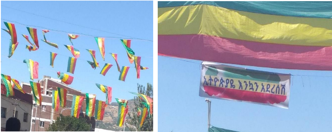
(ኢትዮጵያን የሚዘክሩ ባንዲራዎች በጎንደር ጥምቀት 2013 ዓ.ም)

በጥምቀት ሰሞን “እንኳን ምድሩ ሰማይ ይጠራል” የሚለው ብሂል ሥጋዊና መንፈሳዊ ሐሜትን የሚያረጋግጥ ነው። የምድሩ መጥራት አንድምታ ዕርቀ ሰላሙን፣ ደስታውን፣ ፌስታውን እና የጥምቀት ድባብ የሚፈጥረውን ማኅበረሰባዊ እና ሰባዊ ሐሜት ያሳያል። በጎንደር ጥምቀት ሰሞን አካባቢው እና አደባባይው ሁሉ በሀገር ባንዲራ የተዋበ እና የተሸቆጠቆጠ ነው። ይህም ጥምቀትን ከሃይማኖታዊው ዕሳቤው ዐልፎ ሀገራዊ እና ማኅበረሰባዊ መገለጫ መሆኑን አመላካች ነው።