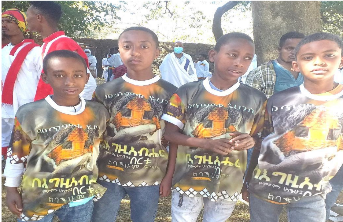
(በጎንደር ጥምቀት ክብረ በዓል ላይ የመጥምቁ የሐንሰ አካባቢ ልጆች ዕድሜን መሰረት ያደረገ አለባበስ 2013)

የጥምቀት ክብረ በዓል አልባሳትን መጠበቅ እና መፍጠር እንዳለ ሁኖ የአልባሳቱ ጽሑፍ የማሳበረሰቡን እሳቤ ፍልስፍና እና ምኞት የሚገልጹ ናቸው። በጎንደር ጥምቀት የአንድ ቡድን አባላት የሆኑ በአካባቢ፣ በዕድሜ፣ በሥራ፣ በፍላጎት ተመሳሳሎ ያላቸው ወጣት ወንዶች አንድ ዓይነት አልባሳት ለብሰው ይታደማሉ። የቡድኑ አባላት ቁጥር በትንሹ ከአምስት እስከ ሹለት መቶ ሊዘልቅ ይችላል። እነዚህ ቡድኖች በጥምቀቱ ተሳትፎ ውስጥ በሥራቸው እና ግብራቸውም በብዛት ተመሳሳሎ ይታያል (አየለ ቴዎድሮስ፣ 10/05/2013 ቃ.መ.)።