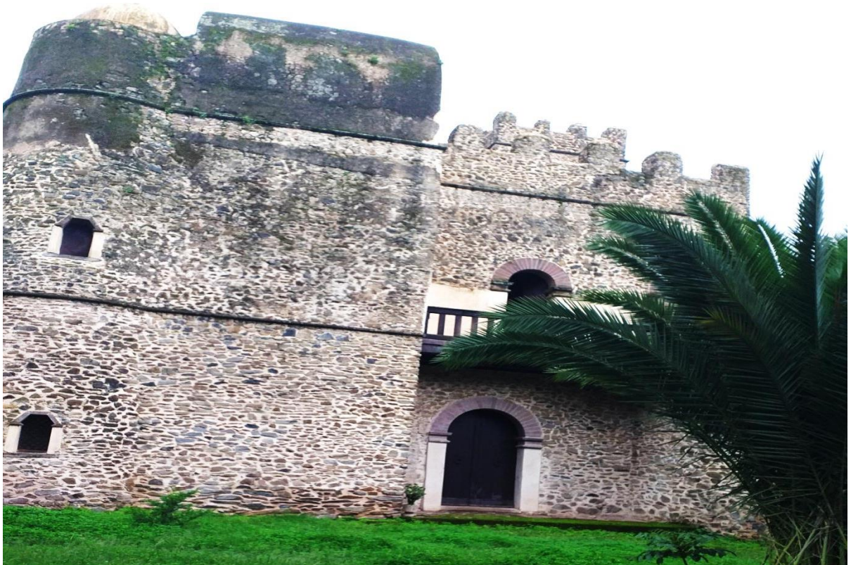
(ራስ ግንብ በ2011 በአጥኚው የተነሳ ፎቶ ግራፍ)

አገልግሏል። በጎንደር እና አካባቢው የሚገኙ ታሪካዊ እና ባህላዊ ቅርሶችን ወደ አንድ በማሰባሰብ ግንቡን ወደ ሙዚየም ለማምጣት በአሁኑ ሰዓት እየተሠራ ነው (መስሐብ ቅጽ 6 ቁ. 9፣ 2009፣ 6)።