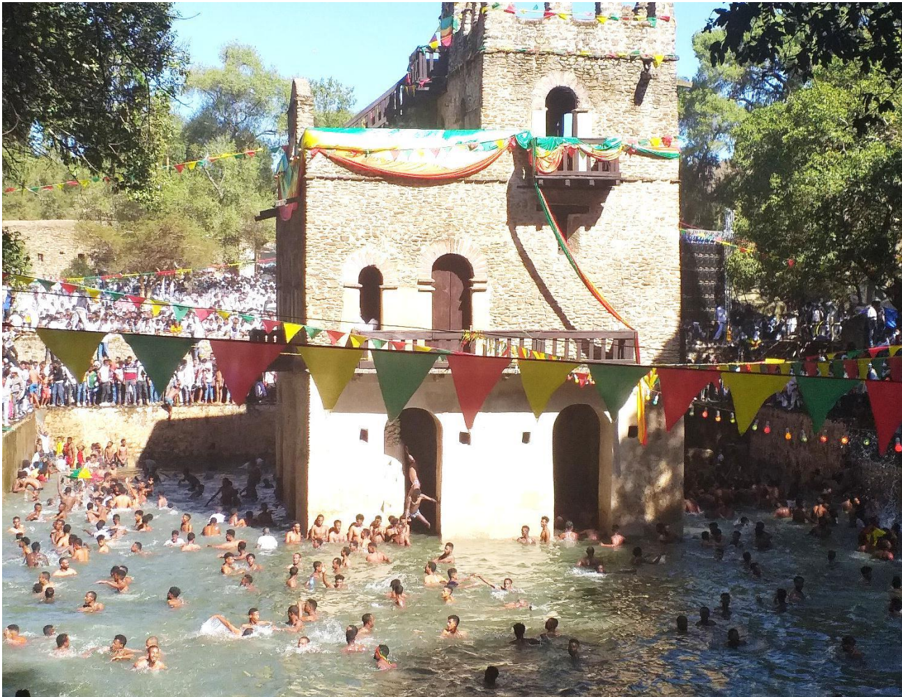
(በዕለተ ጥምቀት የጎንደር ባሕረ ጥምቀት ደባብ በአጥኝው የተነሳ ፎቶ ግራፍ 2013)

ከፍታቸው ደግሞ ማኅበረሰቡ ቅርሶቹን ተገዶ ሳይሆን ወዶ፣ ስምቶ ሳይሆን ዐይቶ፣ ርቆ ሳይሆን ቀርቦ እንዲወዳቸው እና እንዲጠብቃቸው ሁኗል። የጎንደር አብያተ ነገሥታት የቅድስና ቦታ እንዲይዙ ያደረጋቸው በዋናነት የጥምቀት ክብረ በዓል ነው። በተለይ የጥምቀተ ባሕር ማክበሪያው ቅድስና ዘመናትን የዘለቀ በየ ዓመቱ በጥምቀት በዓል በሚደረገው ሥርዓት ነው። የጎንደርን ጥምቀት ከሌላው አካባቢ በተለየ ሁኔታ በደመቀ መልኩ እንዲከበር ከሚያደርጉት መካከል አብያተ ነገሥታቱ ተጠቃሾች ናቸው። አብያተ ነገሥታቱ እና አብያተ ክርስቲያኑ ጥምቀትን ባደመቁት ልክ እነሱም በጥምቀት ይከብራሉ። የጥምቀት ዕለት ወብታቸው ይጨምራል። የማጥመቂያው ግንብ በጥምቀት ዕለት በሰንደቅ አላማ፣ በውሃ ሙሊት፣ በሊቃውንቱ፣ በካህናቱ፣ በወጣቱ፣ በቱሪስትና በሰንበት መዘምራን ያሸበርቃል። በዚህ ምክንያት የጎንደር ማኅበረሰብ እየደጋገመ ይጠብቀዋል፣ ያከብረዋል።