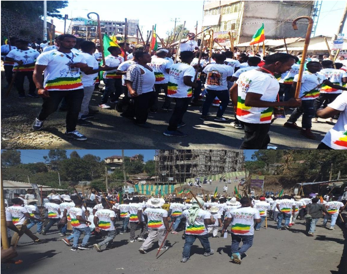
(የጥምቀት ሆተኛ በመምዘግዘግ ላይ ሲኾን ሌላው ገለል ሲል የሚሳይ ፎቶ)

የሚሉት እናቶች ይከተላሉ። በመቀጠል ልጃ ገረዶች እንደየ መጡበት አካባቢ በዘፈን እና በእስክስታ ያከብሩታል። ከእነሱ በመቀጠል ወጣት ወንዶች በሆታ ወይም በዘፈን ጥምቀቱን ያደምቃሉ። ሆተኞቹ አንዳንድ ጊዜ የግፊያ እና የጉልበት ሃይል የተቀላቀለበት ባህሪ ያሳያሉ። በዚህ ጊዜ ልጃ ገረዶቹም ክብ ሰርተው የሚያቀነቅኑትም፣ መንገድ ገብተው የሚጓዙትም ሆነ ተመልካቾች ገለል በማለት የሆተኛውን አፎት ያሳልፋሉ።