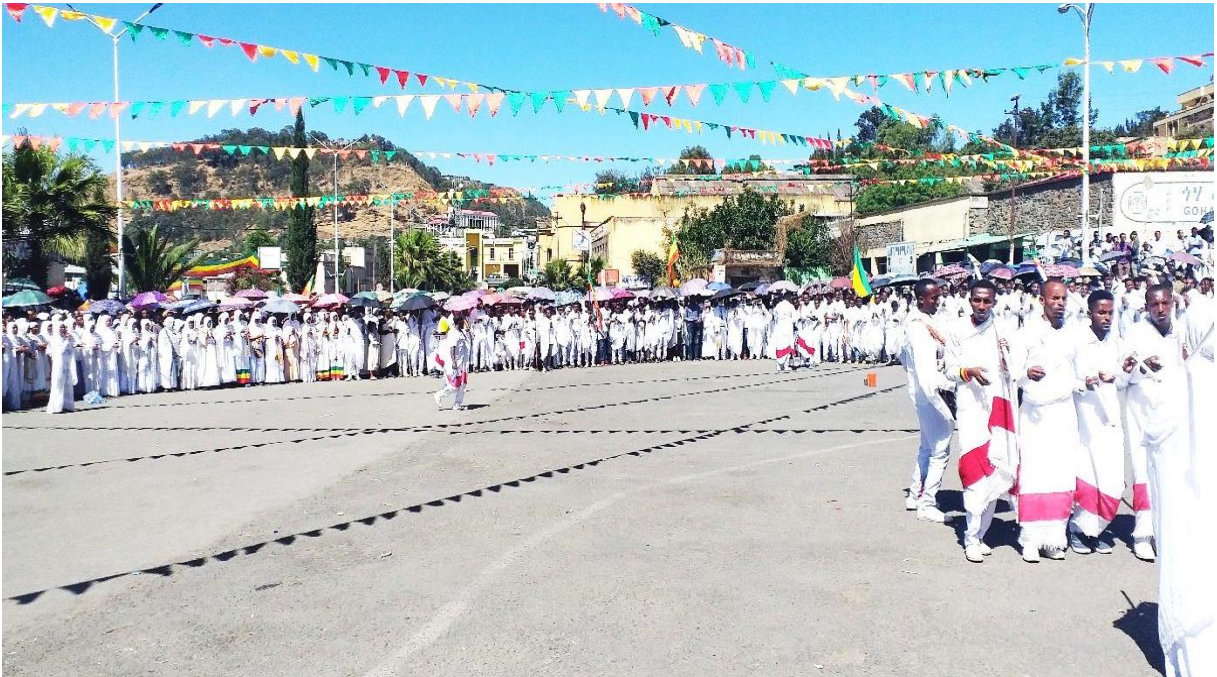
(የጎንደር ጥምቀት ማስረገጫ ቦታ ስፋት እና ሥርዓት በፒያሳ 2013)

ምክንያት ታቦታቱንና ካህናቱን የማስቀደም ሥራ ይሠራሉ። በዚህ በታቦታቱና በምእመኑ መካከል ያለው ቦታ ሰፊ ነው። ሰፊ የሆነበት ምክንያት ለታቦታቱ ካለው ክብር የሚመነጭ ነው። ሌላው የጎንደር ማኅበረሰብ የሊቃውንት ሀገር ከመሆኑ ጋራ ተያይዞ ለዕውቀት ትልቅ የሆነ ቦታ አለው።