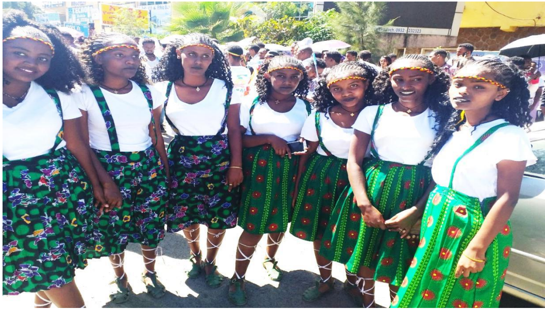
(የጎንደር ልጃ ገረዶች በጥምቀት ሰምን አለባበስ እና አጊያጊያጥ 2013)

ሌላው የጥምቀት ቅድመ መድረሻ ድባብ የሚታወቀው በነጋዴዎች እንቅስቃሴ ነው። የጎንደር ጥምቀት ሽታ ነጋዴዎችን የሚያነቃቃ ነው። ነጋዴዎች ሱቆቻቸው አልበቃቸው ብሎ በረንዳ ላይ አልባሳት የሚሸጡበት፣ ልብስ ሰፊዎች በወረፋ የሚጨናነቁበት፣ ሸማኔዎችና ጥበብ ሠሪዎች ፋታ የሚያጡበት ጊዜ ነው። የአራዳ፣ የአዘዞ እና የፒያሳ የገበያ አደራሾች፣ የገበያ መካዘኖች፣ ቡቲክ ቤቶች፣ በሰው ይጨናነቃሉ። ሌላው የጎንደር ጥምቀት መቃረብ የሚታወቀው በከተማዋ ውስጥ የሚታየው ደማቅ ድባብ ነው። ጥምቀት ቀረብረብ ሲል በጎንደር ከተማዋ ውስጥ ከዘወትሩ የተለየ ድምቀት ይስተዋላል። ይህን በተመለከተ ልዕልና ኅይለ መስቀል ተከታዩን መረጃ ሰጥተውኛል።