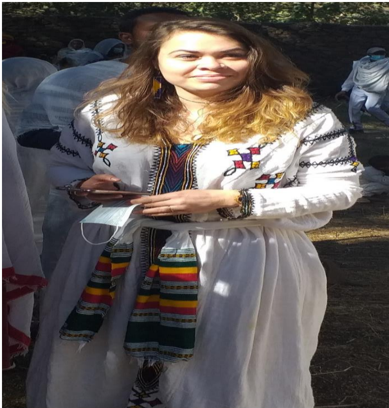
(በጎንደር ጥልፍ ቀሚስና መቀነት ያጌጡ ቱሪስት 108 የሚያሳይ ፎቶ ግራፍ 2013)

ማለት ነው። ወደው ነው ልብሱን የሚገቡት ተገደው አይደለም። ሁለንተናቸው። ጭራውን ይይዛሉ። ወንዶቹ መቋሚያውን በትሩን ይገዛሉ። ሴቶቹ አገልግሉን ይገዛሉ ያገዛሉ። ቅቤቅል ይይዛሉ (ሲቀ ሊቃውንት ዕገራ ሐዘዲስ 15/11/2011 ቃ.መ.)።