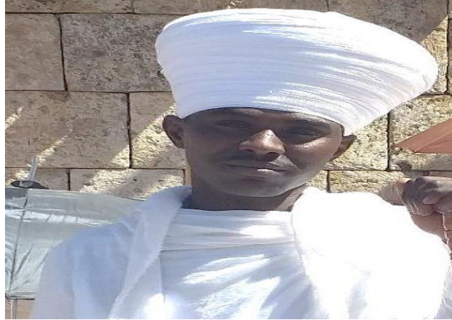
(የጎንደር ሊቃውንትን አጠማጠም የሚያሳይ ፎቶ 2013 ዓ.ም)

ሌላው ሊቃውንቱ በጸናጽል እና መቋሚያ አያያዞች የየራሳቸው ሥርዓት እና ጥበብ አላቸው። በጸናጽል ጊዜ የጎንደራው አቋቋም በመሪነት የሚወስድ ሲኾን በዘንግ ጊዜ ደግሞ የተክሌው አቋቋም ከቀኝ ወደ ግራ፣ ከግራ ወደ ቀኝ፣ ከፊት ወደ ኋላ፣ ከኋላ ወደ ፊት፣ ከላይ ወደ ታች እና ከታች ወደ ላይ የሚለውን የመቋሚያ ወይም የዘንግ ሥራ በበላይነት የተክሌ አቋቋም ይመራዋል። የጸናጽሉን የበላይነት ደግሞ የጎንደራ አቋቋም ሊቃውንት ይከውኑታል።