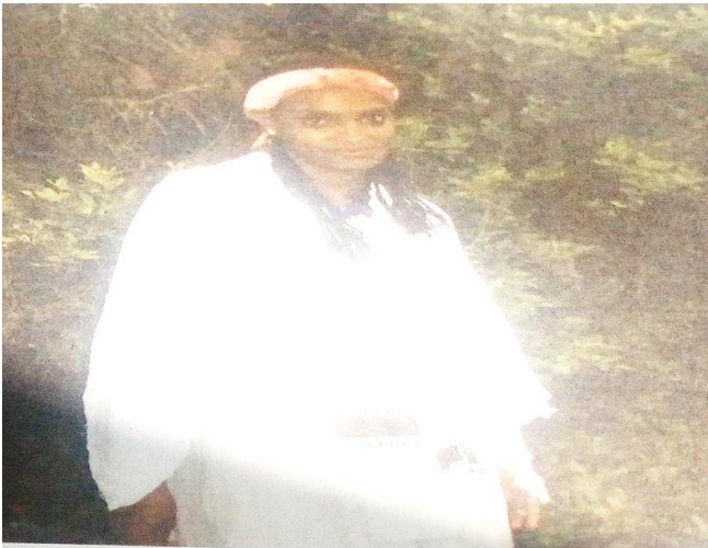
“suura 3” Guyyaa Qaammee (Hawwii Kumaa,06\13\2013)