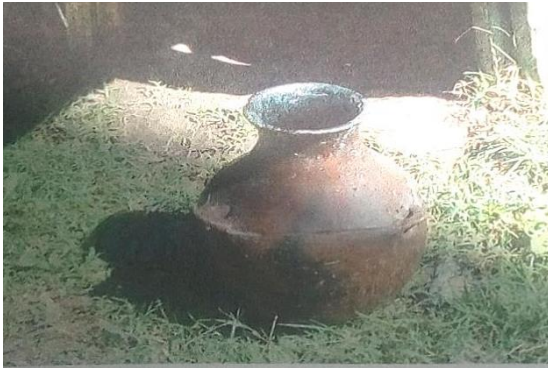
“Fakkii 4” Okkotee

Meeshaan kun suphee irraa namoota naannoo ogummaa suphee dhahuu qabaniin kan hojjetamtu ta’ee, guddinni ishees giddu galeessadha. Okkotee kanatti dhugaatii geeshoo malee naqamutu shamarran Ingiccaa hiituuf qophaa’a. dhugaatiin kun bordee /buqqurii jedhama. Shamarran Ingiccaa hiitee afaan duwwaa hin baatu amantii jedhu waan qabaniifi yeroo Ingiccaa hidhanii ka’an dhugaatii kana unsiisu yaada jedhu odeeffattoo afgaariifi mare garee akkasumas ragaan daawwannaan irraa hubatameera.