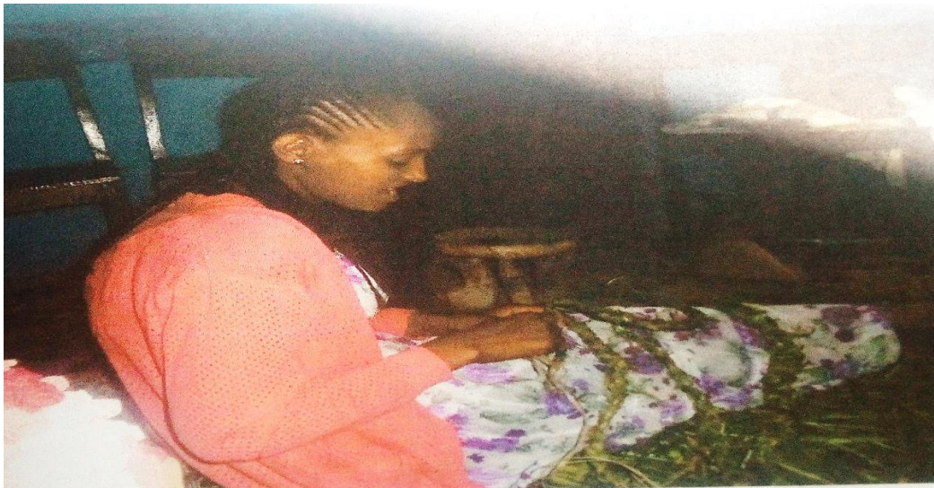
Suura 1 Guyyaa ayyaanichaa (Toltuu Kabbadaa 05\12\2013)