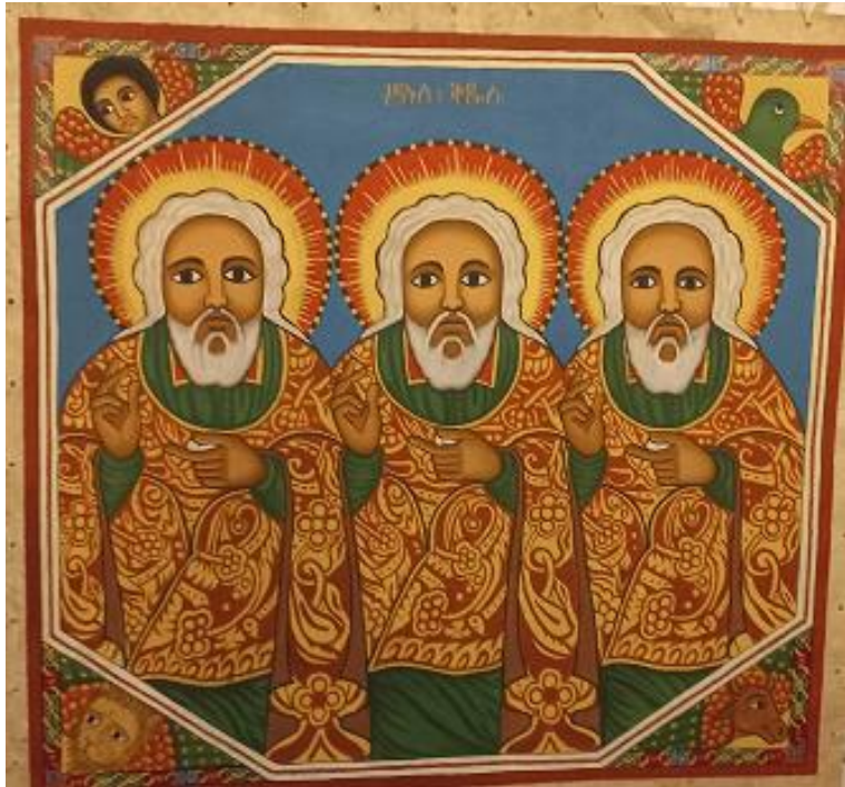
ሥዕል ፩. የቅድስት ሥላሴ ሥዕል

የዓለማችን ፈጣሪም መጀመሪያውም ፍጻሜውም የማይታወቅ የሕያው እግዚአብሔር ምስጢር ነው። በሥላሴ ሥዕል ራስ ላይ እግረ ፀሐይ ይሣላል። የብርሃን ክብብ ነው። ብርሃኑ መንፈስ ቅዱስ ነው። አካሉ ደግሞ ወልድ ነው። ሥላሴ አንድም፣ ሦስትም ስለሆኑ በተመሳሳይ መንገድ ይሣላሉ። በተመሳሳይ መንገድ መሣላቸው ደግሞ የፍጹም አንድነታቸው ማሳያ ነው። ሥላሴ ሲሣሉ ከግራም፣ ቀኝም፣ ከላይም፣ ከታችም እኩል መደረግ አለበት።