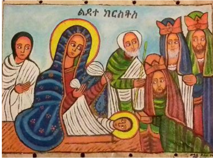
ሥዕል ፩ የክርስቶስ ልደት

ሲገብሩ ይሣላል (ኃይለማርያም 2007፣87) ::«በሬ ገዢውን፣ አክያም ጋጣውን ዐወቀ» (ኢ.ሳ.1፣1-3 ማቴ 2. ፡12፣ሉቃ 2:15-20)