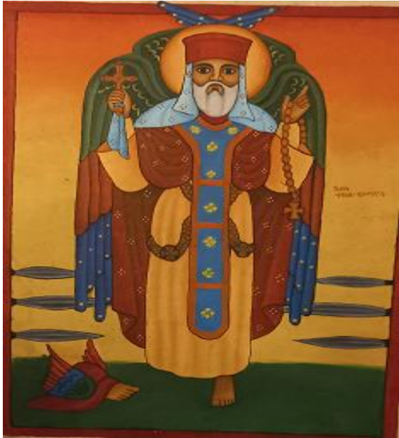
ሥዕል ፲ወ፩. ጻድቁ ተክለ ሃይማኖት

ቅዱስ ያሬድ:- በዎፎች ተመስለው የመጡ ሦስቱ መላእክት በዛፍ ላይ ኾነው፣ርሱም መቋሚያና ጽናጽል በእጁ ይዞ፣ጥንግ ድርብ ለብሶ፣ሲዘምር ይሣላል።ሌሎችም ቅዱሳን ጻድቃን ከመጽሐፍ ቅዱስ ወይም ከገድላቸው በመነሣት ይሣላሉ (ኃይለማርያም፣2007፣105) ።