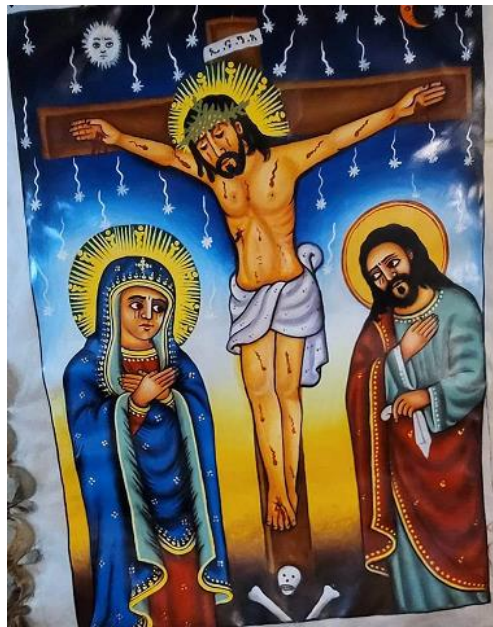
ሥዕል ፪ የክርስቶስ ስቅለት

በሥዕለ ስቅለት ላይ ኹልጊዜ ጌታችን ራሱን ወደቀኝ እንዳዘነበለ ይሣላል (ለቀ ሥልጣናት ሀብተማርያም፣375) ::