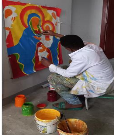
በመረጃ ስብስብ ጊዜ በመሳል ላይ የነበረ ሥዕል