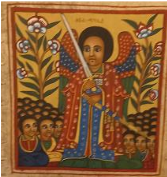
ሥዕል ፯. ቅዱስ ሚካኤል

ጸሎት በማዕጠንታቸው እንደሚሰሩት፣ እንደሚባሉትም ሥልጣናቸውን የሚያመለክት ነው። መስቀል ይዘው ይሳሉ። መስቀል ለምሕረት የሚለኩ መኾናቸውን ይጠይቃል። አበባ ይዘው ይሳሉ። አበባ የሚወክለው የገነት መግዛና የገነት አበቦችን ይጠይቃል። ከዚህ በተጨማሪ አበባ የሚሰጠው ቅዱስ ትርጉምም ሊኖረው ይችላል። ለምሳሌ የምስለ ፍቁር ወልዳ ሥዕል ላይ ቅዱስ ሚካኤልና ቅዱስ ገብርኤል አበባ ይዘው ይሳሉ። በዚህ ወቅት ቅዱስ ሚካኤል የሚይዘው አበባ ምሳሌነቱ የእመቤታችን ቅድስና የሚያሳየውን የሱፍ አበባ፣ አንድም ከእሴይ ስር የወጣሽ መግዛሽ ያማረ አበባ እንዲል ማር ቅዱስ ኤፍሬም ይኸንን ለማመልከት ቅዱስ ሚካኤል አበባ ይዞ ሲሆን ይችላል። «በዙፋኑ ሌላ መልአክም መጣ።... ለቅዱሳን ኸሉ ጸሎት እንዲያሰርገው ብዙ ዕጣን ተሰጠው። የዕጣኑ ጠስም ከቅዱሳን ጸሎት ጋራ ከመልአኩ እጅ ወደ እግዚአብሔር ፊት ዐረገ» (ራእይ 8:3 ዘፍ:48:16: መሳ13:20) ቅዱስ ሚካኤል ሲሆን በዙፋኑ ላይ ተቀምጦ (ይኸም ሊቀ መላእክትነቱን ያሳያል፣) ወይም ቆሞ፣ በእጁ ሰይፍ እና በትረ መስቀል ይዞ ዲያብሎስን በገሃነመ እሳት ሲቀጣው ሰራዊተ መላእክት አጅበውት ይሳላል። ሕዝብ እስራኤልን እየመራ ከግብጽ ባርነት እንዳወጣ እና አፎምያንም ከዲያብሎስ እጅ ሲያድናት... ወዘተ እንዲያሳይ ተደርጎ ይሳላል።