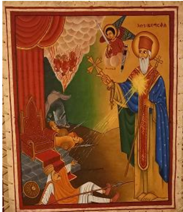
አቡነ ዜና ማርቆስ