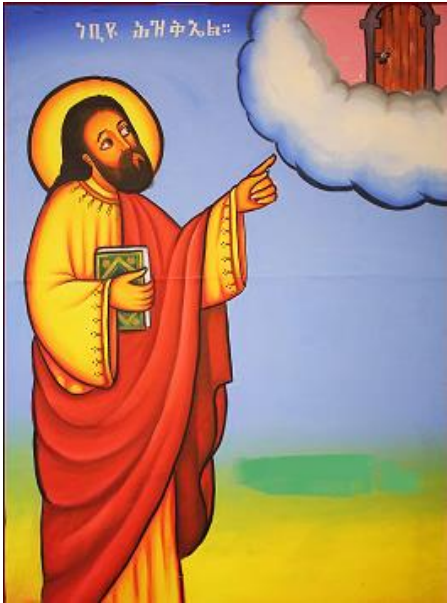
ሥዕል ፰ የሕዝቅኤል ሥዕል

ሙሴ፡-እስራኤልን ሲመራ፣ ሲከፍል፣ በሲና ዐሥርቱ ትእዛዛት የተጻፉበትን ጽላት ከእግዚአብሔር ጋራ ሲቀበል፣ ኤልያስ፡-በእሳት ሠረገላ ሲያርግ፣ ኢሳይያስ፡-በመጋዝ ሲተረተር፣ እጁን ወደ ምስለ ፍቁር ወልዳ ሥዕል እያመለከተ ድንግል በድንግልና ትፀንሳለች ያልኳት ድንግል ርሷ ናት ሲል ነቢዩ ሕዝቅኤል፡- ስለ ድንግል ማርያም ድንቅ በሆነ ታላቅ ቁልፍ የተዘጋች ደጅ በምሥራቅ አየሁ ሲል ዳንኤል፡-ለአናብስት ሲጣልና መልአኩ ከአናብስቱ አፍ ሲያድነው ተደርገው ይሣላሉ (ኃይለ ማርያም፣ 2007፣ 102) ።