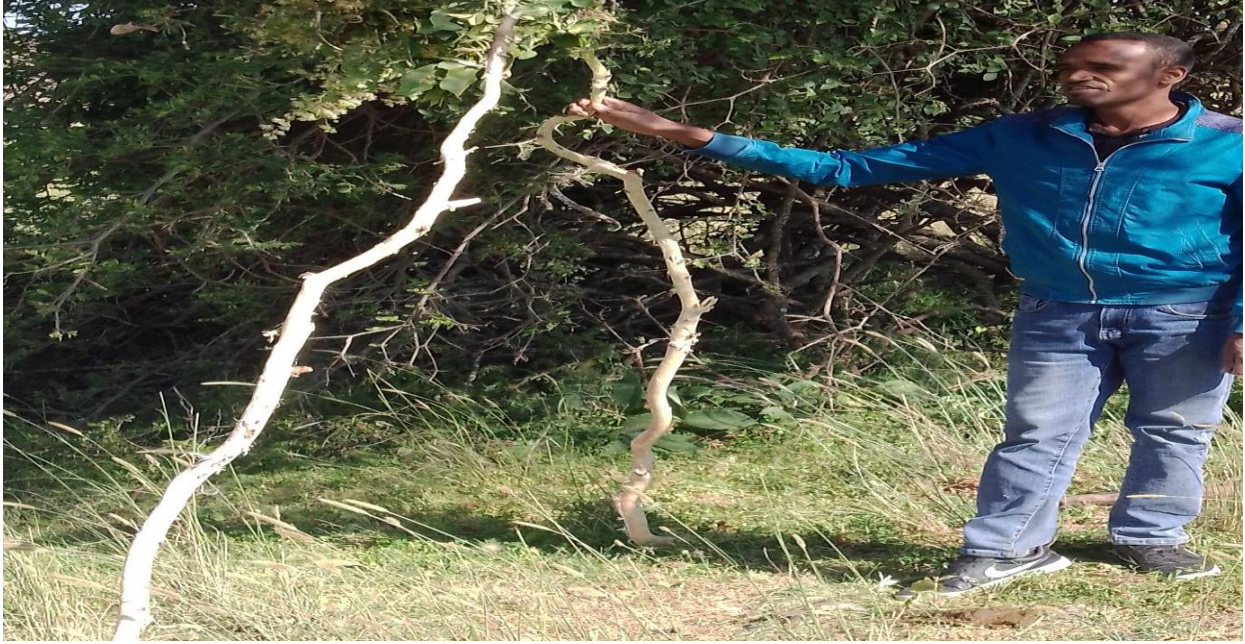
Suura-2 muka Raawwii sirna hulluuqqoof qophaa'e

Itti aansuun, erga sirni muka hulluuqqoo dhaabuufi meeshaaleen sirna kana waliin wal qabatan hundi dhiyaachuun sirni hulluuqqoo itti eegala. Akka mukni hulluuqqoo dhaabbateen hirmaattonni ayyaanichaa walitti himuun karra/loon isaaniifi maatii isaanii hunda meeshaalee itti fayyadaman kan akka eeboo, kooraa fardaa, gaachanaafi kanneen biroo qabachuun bakka jilaa sanatti dhiyaatu. Jiruufi jireenya ummata tokkoo olaantummaan kan hoogganu, qajeelchu, raaju, to'atu amantaafi amantiidha. Sababni isaas, karaa amantii yoo ilaalame Waaqayyo isa hundumaa uumeta hundumaa hojjata; Ohojjachiisa. Amantiitti aanee waa'ee jiruufi jireenya Oromoo ,badii kanaan duraa irraa of eeguufi dogoggora hojjatamee darbe irraa baarachuuf, abdi Oromoon qabu, gara fuula duraa raaguufi raajuu keessatti waan qabuuf (Filee 2016, f. 44).