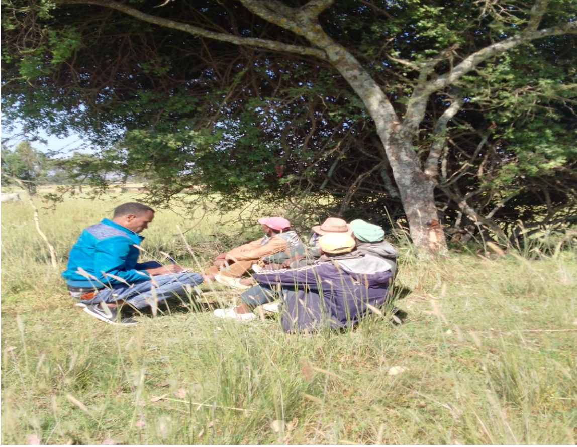
Fakkii - 6 Marii garee waa'ee yoomessa hulluuqqoorratti namoota afur waliin taasifame