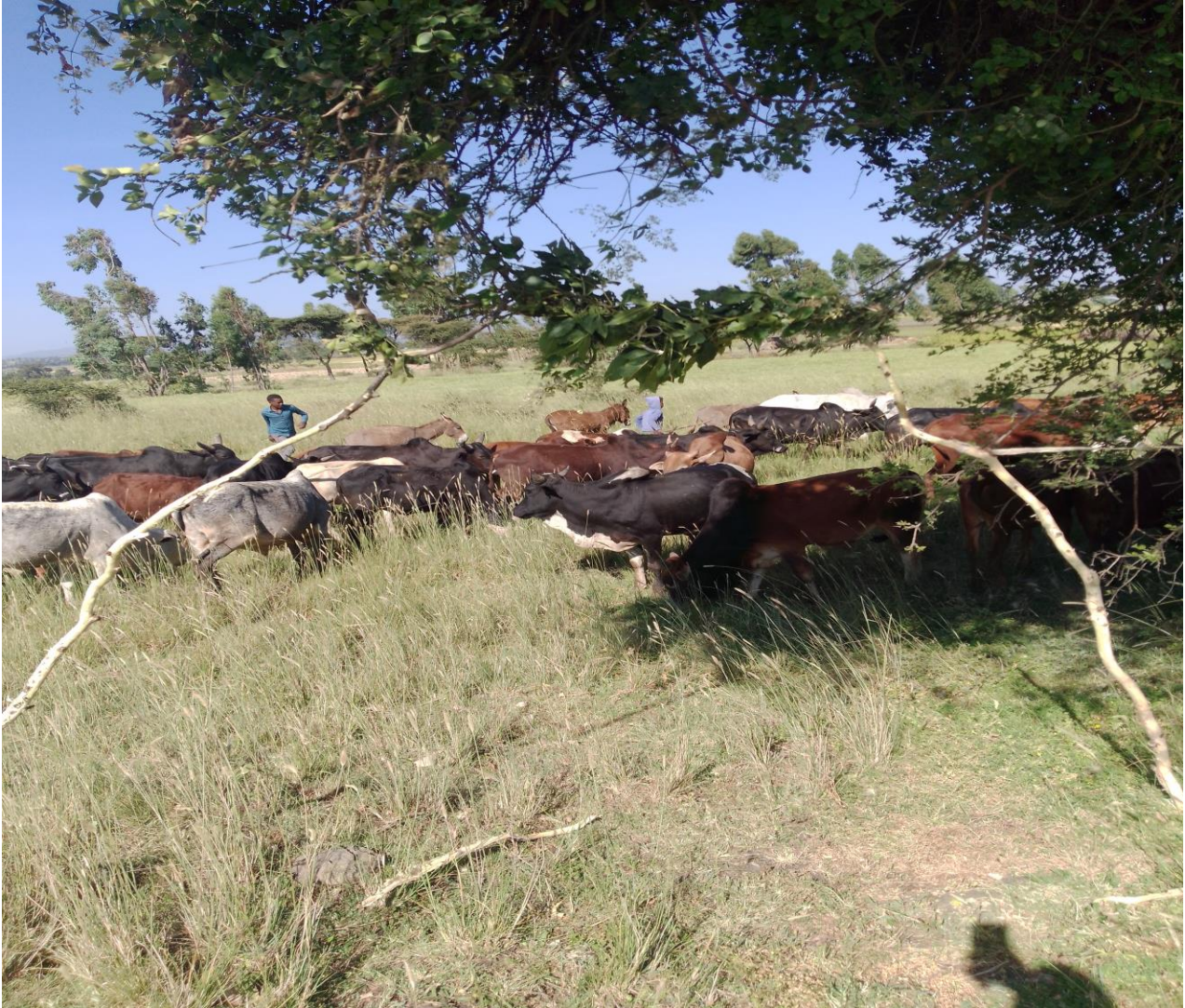
Suura - 4 loon hulluuqqof yeroo dhiyaatan

kunneen hundi ergaafi akeeka mataa isaanii qabaachuu irratti walii galu. Daawwannaa (15/01/2016) toora daqiiqaa 20` f ture irraa argame.