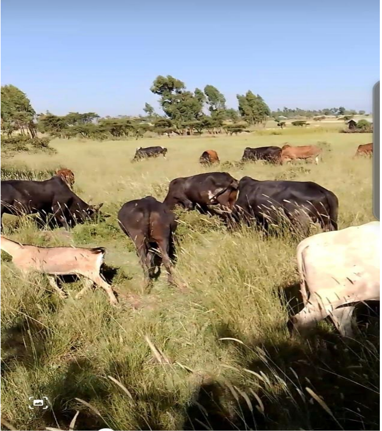
Fakkii – 4 loo waaree tiksuu

kanaan loon dheedanii quufanii akka galaniifi. Guyyaa kanarraa eegalee loon quufa malee beelli, akka hin jirreefi akka ilaalchaatti sa'aa namni guyyaa kana quufe, barahamaa, bona cimaa jail bahuu nidanda'a