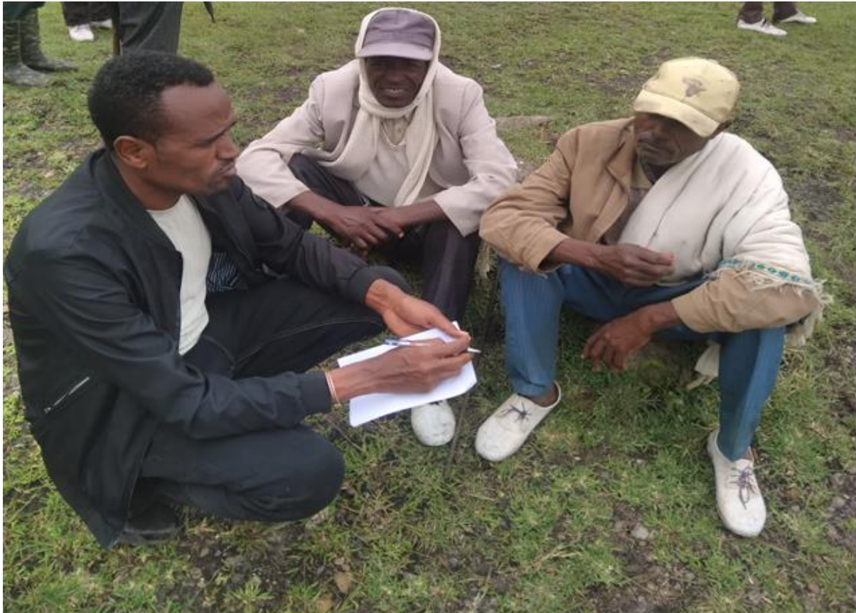
Fakkii marii sirna hulluuqqoo irratti taasifame