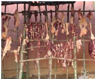
ለመመቀቅል ተቆራረጠ ስጋ

ለቀስተኞች እየተሰበሰቡ ሲሄዱ እና ሲበረክቱ የሚችሉ ጎረቤቶችና የቅርብ ዘመዶች አስከሬን መሸኛ የሚሆን ምግብ ያዘጋጃሉ። በተለይ በባላባት ሞት ጊዜ እርድ ስለማይጠፋ ስጋው በብዛት ይቀቀላል። አምቆም አንዲሁ ይዘጋጃል። ለባላባቱ ሞት ቀድሞ የተዘጋጀ ቦርዴ ካለም ይበጠበጣል። ሁሉም በልቶ ጠጥቶ መሄድ አለበት። በምግብ ዝግጅቱ ወቅት ስጋው የሚቀቀለው ተክትፎ ሳይሆን ከፍ ከፍ ተደርጎ ነው። ይንንም የሚያደርጉት ጊዜ ለመቆጠብና ለለቀስተኞች ለማደል እንዲያመች ታስቦ ነው።