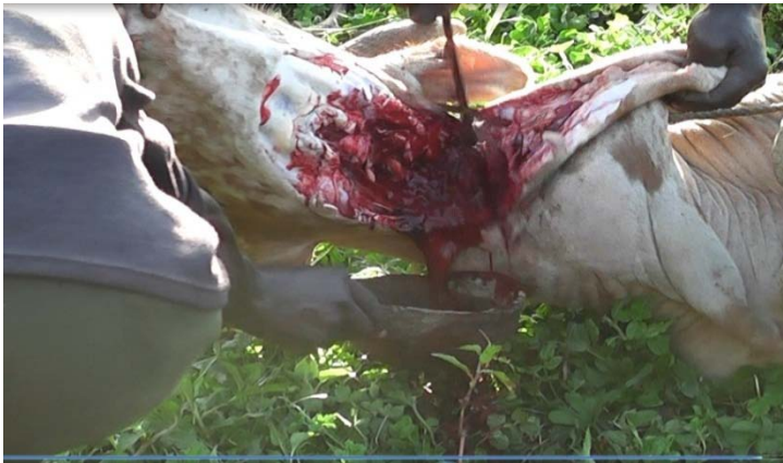
ፎቶግራፍ 17 ለታል ማስፈጸሚያ የታረደው ከብት ደም በሾርቃ ሲቀዳ

ታል ዘፋኞችና ሌሎች ሰዎች ከጊቢ ውጪ ይሆናሉ። ታል ይዞ የሄደው ልጅ ከአንድ ሌላ ሰው ጋር በመሆን አራት ጊዜ ወደ ጊቢው ገባ ወጣ በማለት ይመለሳል። ይህ ስርዓትም “ኮል ኦፕም” ይባላል። ምርቃት ሊመረቅ ወይም በረከት ሊቀበል ነው ማለት ነው። ከአራተኛው ዙር በኋላ ከአጃቢዎች ጋር በመሆን ወደ ጊቢው ይገባል። የቤቱ ደጃፍም ላይ ይቆማል። “ቤስን” የተባለው ሰው ከቤት ውስጥ ይወጣና ውሀ ይረጫቸዋል። ብዙ ተባዙ ብሎ ይመርቃቸዋል። የምርቃት ስርዓቱ ከተፈጸመ በኋላ ከብቱን በድንጋይም ሆነ በጦር መትቶ በቢለዋ በማረድ ደሙን በእንጨት ጡርንባ፣ በሾርቃ አሊያም በእጁ ቀድቶ ለወራሹ አራት ጊዜ ይሰጠዋል።