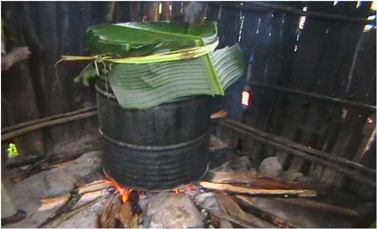
ፎቶ ግራፍ 18 ለተስካር ማውጫ የሚሆን ቦርዴ ሲቀቀል

ወራሹ የሚችን ተስካር ለማውጣት ይዘጋጃል። ሚች ሴት ከሆኑ ደግሞ ባል ተስካር ያወጣሉ። ባል ከሌሉ ደግሞ ልጆች ተስካሩን ያወጣሉ። ተስካሩ የሚደረገው ለእድሜ ባለጸጎችና ለጎልማሶች/ትዳር/ ላላቸው ነው። ተስካሩ የሚወጣበት ጊዜ ሚች ከሞተ በአርባኛው ቀን ወይም በሰማንያኛው ቀን ነው። የተስካሩን ጊዜ የሚወስነው ተስካር አውጪው ባለው አቅም የሚወሰን ነው። በአብዛኛው በአርባኛው ቀን ተስካር ያወጣሉ። ለተስካሩ የሚያስፈልገው ቦርዴ የተባለውን መጠጥ ማዘጋጀት ብቻ ነው። ነገር ግን በብዛት መዘጋጀት አለበት። የሚመጣው ሰው ስለማይታወቅ ነው። በብሄረበቡ ዘንድ ቦርዴ የተባለው መጠጥ እንደ ምግብ የሚያገለግል ነው።