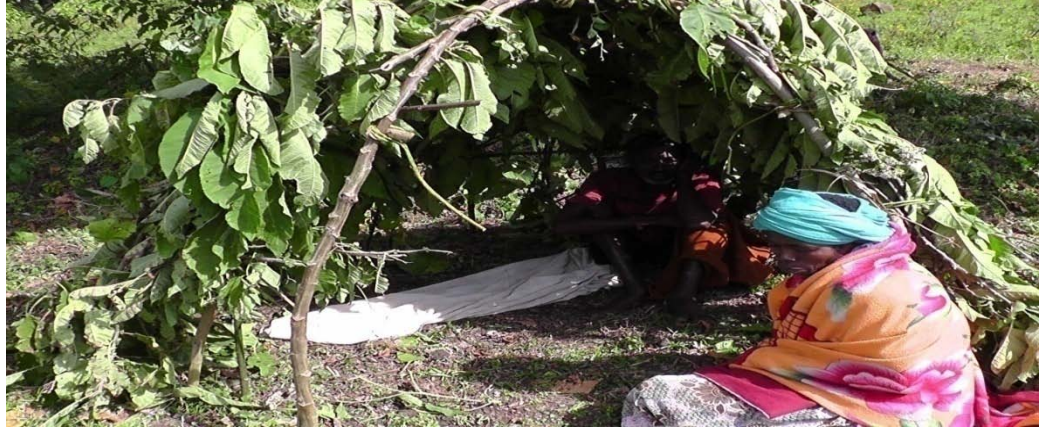
ፎቶግራፍ 11 አዲስ የለቅሶ ቤት “ይሰክ”

ለቀስተኞች እየተሰበሰቡ ሲሄዱ እና ሲበረክቱ የሚችሉ ጎረቤቶችና የቅርብ ዘመዶች አስከሬን መሸኛ የሚሆን ምግብ ያዘጋጃሉ። በተለይ በባላባት ሞት ጊዜ እርድ ስለማይጠፋ ስጋው በብዛት ይቀቀላል። አምቆም አንዲሁ ይዘጋጃል። ለባላባቱ ሞት ቀድሞ የተዘጋጀ ቦርዴ ካለም ይበጠበጣል። ሁሉም በልቶ ጠጥቶ መሄድ አለበት። በምግብ ዝግጅቱ ወቅት ስጋው የሚቀቀለው ተክትፎ ሳይሆን ከፍ ከፍ ተደርጎ ነው። ይንንም የሚያደርጉት ጊዜ ለመቆጠብና ለለቀስተኞች ለማደል እንዲያመች ታስቦ ነው።