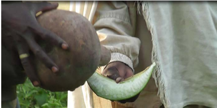
ፎቶግራፍ 7 የውሃ መርጨት ስርዓት

ይህ ስርዓት ከላይ የቀረቡት የውርስ ደንቦች ተከናውነው ካለቁና ወራሹ ከተገኘ በኋላ የሚከወን ነው። በአዲስ ቅል ውስጥ የተዘጋጀ ውሃ በቆሞ ላይ ኮባ ላይ በመጨመር አስከሬኑ ያለበትን ቤትና የጭፈራ ቦታ ፣ አካባቢውን በሙሉ እንዲሁም ለለቅሶ የታደሙትን ሰዎች በተደጋጋሚ ይረጫሉ። ይህ የውሃ መርጨት ስርዓት የሚከናወነው አዲስ ባላባት መተካቱን ለማመልከት፣ የአዲሱ ባላባት ዘመን እርጥብ ፣ ለምለም፣ አረንጓዴና ሰላም እንዲሆን ለመመኘት፣ በሽታና ችግር እንዲጠፋ ለማድረግ እንደሆነ በቡድን ውይይት ጊዜ ለማወቅ ተችሏል። ይህ ስርዓት በውሃ የሚፈጸምበትን ምክንያት አቶ ባልኩ ኩሙ “ ውሀ የሁሉ ነገር መድሀኒት ነው። ንጹሁ ነገር ነው። የቆሽሽ ነገር ያጸዳል። በሽታ ያጠፋል። እኛም የምንጠቀመው በአካባቢያችን የመጣውን ሞት ለማጥፋት እና ለማራቅ ነው። ሁሉ ነገር መልካም የሚሆነው ውሃ ሲኖር ነው።” ( ቃለ መጠይቅ፡11/06/06)