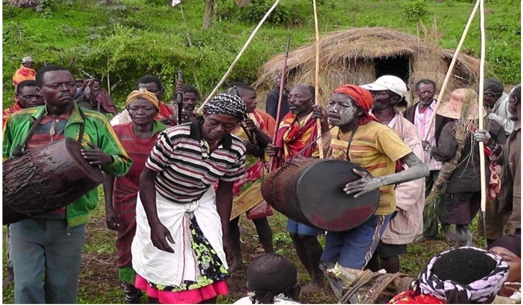
ፎቶግራፍ 9 የሚችሉ ቤተሰቦች ከበር፣ ክራር እና ጦር ይዘው እየጨፈሩ

ለቅሶው በሙዚቃ መሳርያዎች በመታጀብ የሚቀርብ ሲሆን ሚችሎች ባላባትን ለማወደስ ደግሞ ቃል ግጥሞችን ይገጥማሉ። ይህን ቃል ግጥም የሚያቀርቡት የባላባቱ ዘመዶች ሲሆኑ ቃል ግጥሞቹ የባላባቱን ደግነት፣ ጀግንነት፣ እንዲሁም መልካም አስተዳዳሪነት የሚገልጹ ናቸው። በለቅሶው ጭፈራ ሁሉም ሰው ተሳታፊ ይሆናል። ከዚህም በተጨማሪ የባላባቱን የዘር ግንድ አመጣጥ እንዲሁም ባላባቱ ያስተዳደረባቸውን እና ድል ያደረገባቸውን ቦታዎች በመጥቀስ ውዳሴውን ያቀርባሉ። ከዚህ በታች የሶስት ባላባቶች የውዳሴ ቃል ግጥሞች ይቀርባሉ።