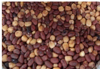
የበቆሎ፣ የማሽላ፣ የነቆሎና የደንጎሎ እሽት ተቀቅሎ