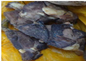
ለአንድ ለቀስተኛ የሚታደል ስጋ በቃጫ ታስሮ፤