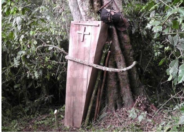
ፎቶግራፍ 16 የኦር የባላባት ቀብር

“ላይ ኪያዝ” የተባለው ባላባት ደግሞ የሚቀበረው አስከሬኑን በከብት ቆዳ በመጠቅለል በንብ ቀፎ ውስጥ ተደርጎ በትልቅ ዛፍ ላይ በማስቀመጥ ነው። ይህ የሆነበትን ምክንያት በቡድን ውይይት ወቅት እንደገለጹልኝ በአካባቢው የንብ ምርት በብዛት እንዳለና ለንብ ከፍተኛ ክብር ስላላቸው ቀብራቸውን በንብ ቀፎ ውስጥ አድርገዋል ይላሉ።