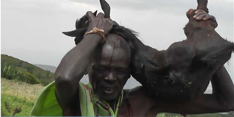
ፎቶግራፍ 4 ለውርስ ደንብ በታረደው ፍየል ደም ወራሹ ሲታጠብ

እዲሽከም እና በደም የመታጠብ የመንጸት ስርዓት እንዲፈጽም ይደረጋል። ይህም የወራሹ ልብ ንጹህ እንዲሆን እንዲሁም ሰላማዊ አስተዳደር እንዲገኘው ታስቦ መሆኑን አቶ ታደመ ኮሞሩት በቃለ መጠይቅ ጊዜ ገልጸዋል።