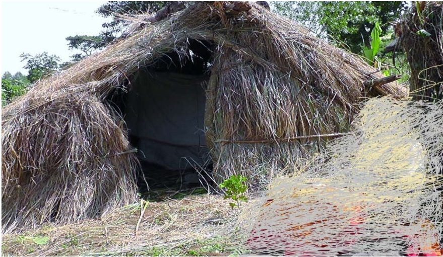
ፎቶግራፍ 2 የአስከሬን ማረፊያ ቤት “ዲርሙ”

ከላይ የቀረቡት ክዋኔዎች እስከሚከናወኑ ድረስ አስከሬኑ በአስከሬን ማቆያ ቤት ይቆያል። ባላባት ሲሞት አስከሬኑ በመኖርያ ቤት ብዙ ቀን መቆየት ስለማይችል አዲስ ያስከሬን ማረፊያ ቤት ይዘጋጃል። ይህ ያስከሬን ማቆያ ስፍራ “ዲርሙ” ሲባል አስከሬኑ እስኪቀበር ድረስ የሚቀመጥበት ጎጆ ቤት ነው። ይህን ጎጆ ቤት የሚያዘጋጁት ገይማ የተባሉት የባላባቱ አገልጋዮች ሲሆኑ ቤቱም አስከሬኑን ለማስቀመጥ ብቻ ሳይሆን ደንብ ሰሪዎች እና የአስከሬኑ ጠባቂዎች እንዲቀመጡበት ሰፊ ተደርጎ ይሰራል።