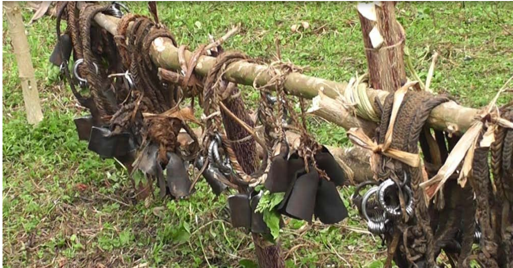
ፎቶግራፍ 8 የከብት ቃጭል (ካሽ)

የጉሎ እንጨት የተመረጠበት ዋናው ምክንያት የጉሎ ዛፍ በቀላሉ መብቀል እና መስፋፋት ስለሚችል የባላባት ዘር እንዲበዛ እንዲሁም እንዲስፋፋና ስርዓቱ ቀጣይነት እንዲኖረው ታስቦ መሆኑን አቶ ዘለቀ ገሩ ገልጸውልኛል።