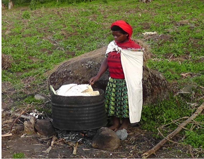
ፎቶግራፍ 19 ለለቀስተኛ መመለሻ የሚሆን አምቆ ሲዘጋጅ

ሁሉም ዘመዶች ከተሰበሰቡ በኋላ የሚችን ደግነት እና መልካም ተግባሮች እያነሱ በአንድነት በጊቢው ወስጥ ያለቅሳሉ። መጮህ ፊት መቧጠጥ፣ በደረት መውደቅ የሃዘን መገለጫዎች ናቸው። በዚህ የለቅሶ ስርዓት ላይ እንደ ባላባቶችም ሆነ እንደ አዛውንቶች የሙዚቃ መሳርያዎችን መጠቀም እንዲሁም ግጥም መደርደር አይፈቀደም። ምክንያቱም ሚቶቹ ያለ ዕድሜያቸው የሞቱ በመሆናቸው ነው። ሃዘን ማብዛትም ሌላ ሃዘን ያስከትላል ተብሎ በመታሰብ ነው።