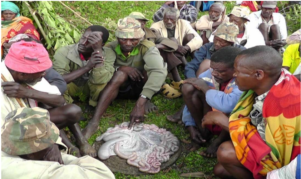
ፎቶ ግራፍ 5 አንጀት ማንበብ ስርዓት

ጊያዱ” 13 ወራሽ መውረስ እንደሚችልና እንደማይችል፣ የዝናብ ሁኔታን፣ የአዝመራ(የምርት ሁኔታ)፣ ቀጣይ ዘመን ጥጋብ ወይም ርሀብ እንደሆነ፣ ጦርነት ካለ የትና መቼ እንደሚከሰት፣ በቤተሰብ መካከል የሚከሰት ችግር (ሞት) ካለ፣ ወራሽ ምን ያህል አመት እንደሚኖር(እንደሚገዛ) ወ.ዘ.ተ የሚመለከቷቸው ጉዳዮች ናቸው።