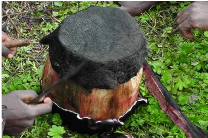
ፎቶግራፍ 13 ከበሮ ሲሰራ

መሲና ከብት የተመረጠበት ምክንያት መሲና ከብት መውለድ ስለማትችል የሚች ባላባቱም የአስተዳደር ዘመን ያበቃ መሆኑን ለማመልከት እንዲሁም ለወራሹ እና ለህዝቡ ሰላም ይሆናል በሚል ነው። በቆዳውም አስከሬኑ ለመጨረሻ ጊዜ እንዲጠቀለል ይደረጋል። ከዚህም በተጨማሪ በቆዳው ትንሽ ከበሮ ይሰራል። ይህ ከበሮም በቀብር ቦታው ላይ በትራስጌ በኩል ስለሚሰቀል ነው። ከበሮው የሚሰራበት ምክንያት ባላባቱ በህይወት ዘመናቸው በሙዚቃ መሳርያነቱ በብዛት ሲገለገሉበት የቆዩ መሆናቸው እና ከበሮና ክራር የዲዚ ብሄረሰብ የደስታም ሆነ የሃዘን ጊዜ መሳርያ መሆኑን ለመግለጽ ነው።