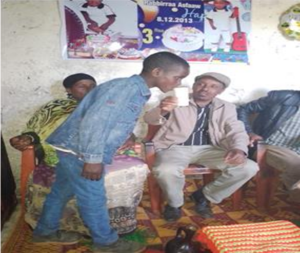
Suura[14]; Qophii yoomeessa akkeessuu gaafa (13/02/2014) irratti yeroo sirna raawwii harma hodhaa geggeessaan mucaa aannaan unachiisaan agarsiisu