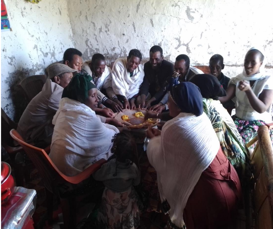
Suuraaf[10]: qophii yoomessa akkkeessuu (13/02/2014) harma hodhaa irratti maatiin lamaan maaddii waliin cabsatan kan agarsiisu.

Akka gochaa kanarra hubatamutti, nyaataa kana maaddii tokko irratti dhiyeeffataniin waliin nyaachuun immoo jaalalaafi gammachuu waliin qaban kan ibsudha. Akkasumas, firummaa dhufaniif sanaaf waadaa waliigaluudha. Akka aadaa Oromootti namni maaddii tokko irraa waliin nyaate wal hin ganu; hamaa walitti hin yaadu yaada jedhu kan bakka bu'udha. Namni waliin nyaate akka koodee tokkotti wal ilaala waan ta'eefi. Akkuma kana nyaata maatiin harma hodhaaf dhufan qabatanii dhufanis waliin qooddatanii kan nyaataniidha. Kun immoo walitti makamanii tokko ta'uu isaanii kan agarsiisuudha.