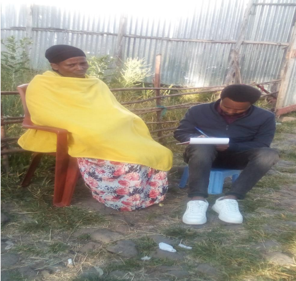
Suuraa[15] Yeroo qorataan gaafa (04/07/2013) odeeffannoo afgaaffiin funaanatu agarsiisu