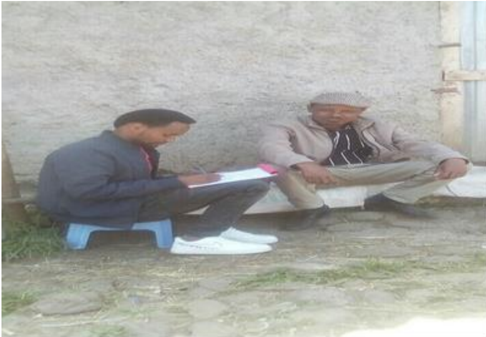
Suuraa [5]: Qorataan yeroo afaaffiin maanguddoo irraa gaafa (02/07/2013) odeeffatu kan agarsiisu.

Qophii kanaaf bu'ura ta'ee baay'ee barbaachisaa kan ta'e kan biraan damma. Dammi qophii kana keessaa hafuu kan hin dandeenyeefi waan safuufi hoodaati. Kun dursee qophaa'uun sirna sanaaf dirqama. Dammi qophaa'e gaafa guyyaa dhimmichi raawwatu namicha harma hodhuuf dhiyeessuun yeroo sirna raawwii harma hodhaa kan dhandhamsiisaniidha. Inni lammataa sirna kanaaf akka dirqamatti qophaa'uu qabu keessa tokko dhadhaadha. Dhadhaan immoo yeroo sirna sana raawwataan kan muudaadhaaf dhiyaatuudha.