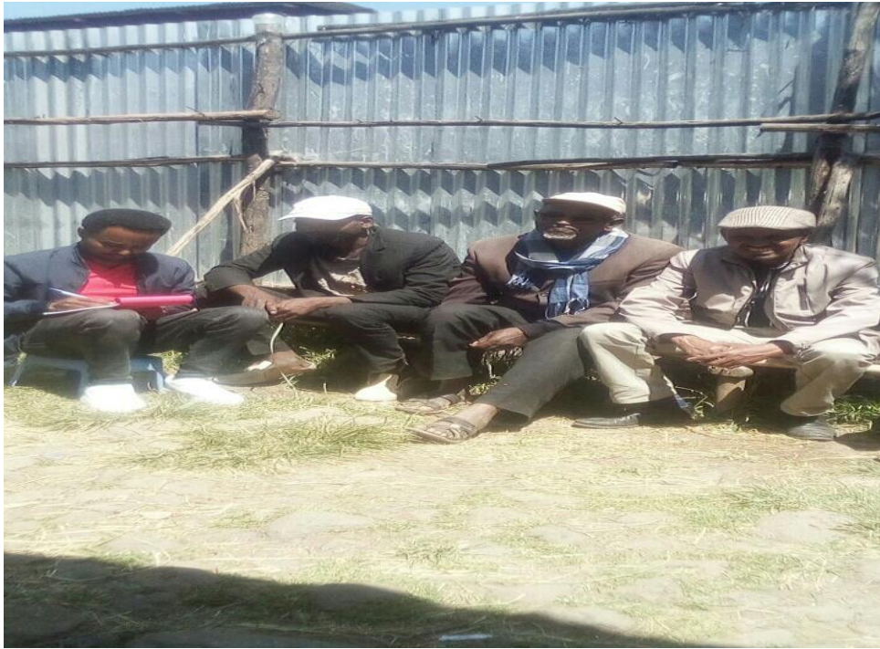
Suuraa [3]: Namoota afgaaffii garee “B” keessatti hirmaachuun gaafa (07/08/2013) oddeeffannoo kennan.

Akka odkennitonni mariin gareen ‘A’ (Dabalee Addunyaafi Galataa Tolaa 21/07/2013) jedhanitti, Harma hodhaa raawwachuuf adeemsi jalqabaa maatii harma hodhaan sana filachuudha jedhu. Akka hirmaattotni marii garee kanaa jedhanitti namoonni harma wal hodhuu barbaadan dursa amala maatii harma hodhuu barbaadan sana ulaagaa adda addaatiin qorachuun hawaasa naannoo isaa jiraatu biraatti hangam fudhatama akka qabu firootaniifi maatii isaatiin kan mar’atuudha. Akka odkennitoonni marii garee kunneen jedhanitti, sababni filannoo kanaa immoo firummaa barbaaddameef sanaf ooluu akka danda’uu addaan baafachuuf jechuun addeessuu. Akkasumas, sirna raawwii harma hodhaa irratti odeeffannoo qorataaf kennaniin maatiin ulaagaalee adda addaatiin madaalee nama harma hodhuuf deeman sana irratti erga waliigalanii booda maatii sanatti jaarsolii akka itti ergamu himu. Maatiin kun kan filataman maatii warra harma hoosisuu barbaaduutu waliin mar’atee filata. Maatii harmaa hodhaaf filataman kunis ulaagaalee adda addaa irratti hundaa’ee filatamuu danda’u jechuun lafa kaa’u.