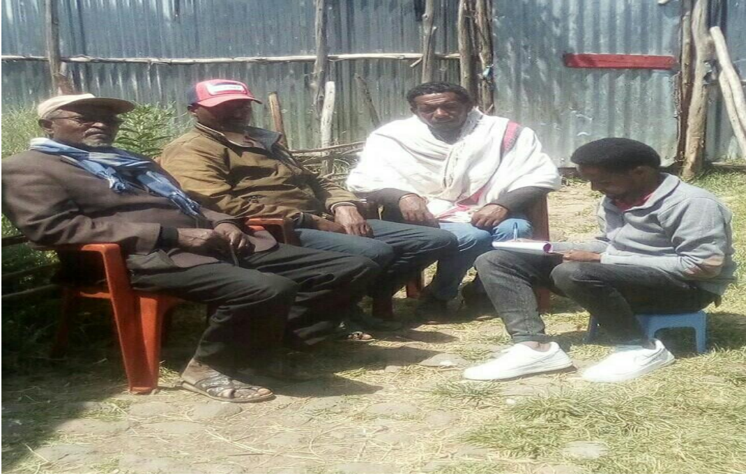
Suuraa [2]: Namoota afgaaffii garee ‘A’ keessatti hirmaachuun gaafa (21/07/2013) odeeffannoo kennan