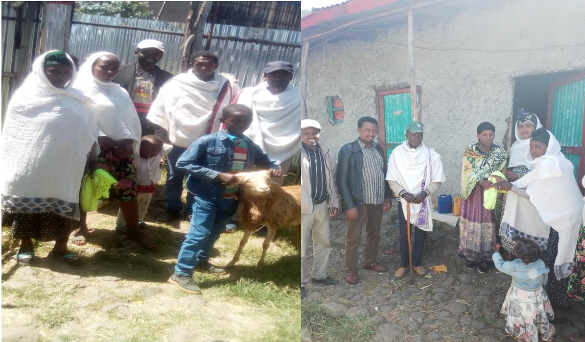
Suuraa [6]: Qophii yoomessa akkeessuun (13/02/2013) irratti yeroo keessummaan dhufuufi itti simataman kan agarsiisu.

Akkan gaafa (Dilbata 13/02/2013 Sa'aatii 8:00) yoomessa nam tolchee qophaa'e irrattii hirmaachuun argetti, qophiin dursu hundi xumuree yeroo maatiin harma hodhaaf dhufan, waan hoodaafi safuu kan ta'e wanti isaan qabatani dhufan ni jira. Yeroo gara mana sirna kanaaf qophaa'ee dhufanis wantootni sirna kanaaf barbaachisaa ta'ee qabatani dhufan ni jira. Guyyaa sirna kanaaf dhufan kana wantoota akka marga jiidhaa, daabboo, caccabsaa, araqeefi Re'ee yookiin Hoolaa keessaa tokko qabatani kan dhufaniidha. Wantoota barbaachisan kana erga qabatani mana warraa harma hodhaaf gahaniin booda jaarsoleefi maatiin sun itti gadii bahuun keessummaa dhufan simatu.