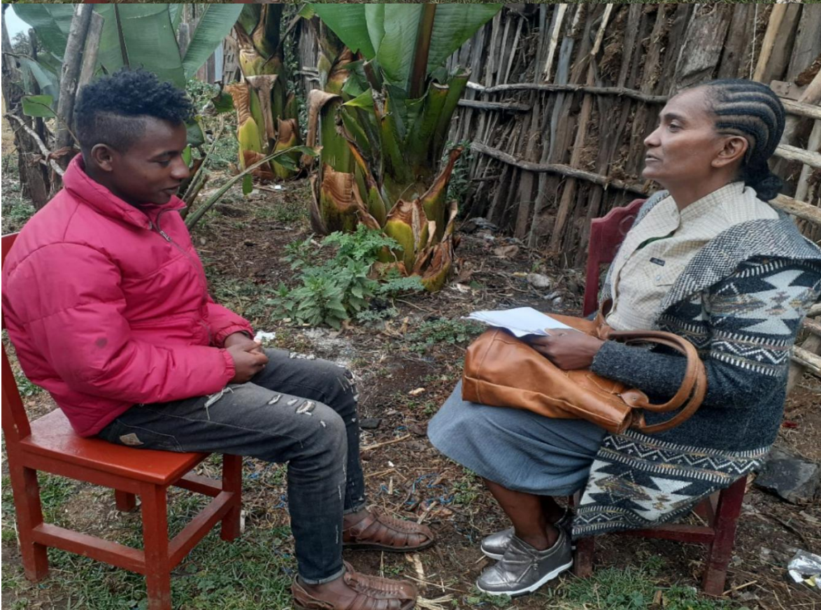
Fakkii: Aadde Kaamettii Qalbeessaa(23 /6 /12)fiDar.Adaanaa Warquu (27/6/12) mana mana isaanitti afgaaffii yeroo garagaratti yeroo qorattuun odeeffannoo irraa funaannachaa turte.