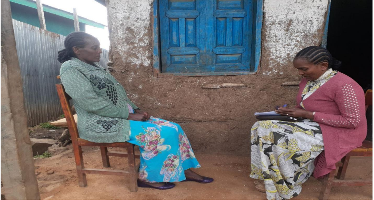
Fakkii: Aadde Mintuu Badhaadhii(28 /5 /12)fiWarqituu Fiqaaduu (15/7/12) mana mana isaanitti afgaaffiin yeroo garagaratti yeroo qorattuun odeeffannoo irraa funaannachaa turte.