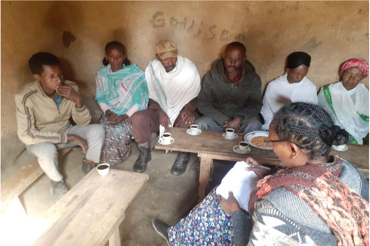
Fakkii: Namoota(25 /5 /12) gandoota garagaraa afur irraa ganda Osoolee,Siibbb Osolee, Falloofi Ilaala Waddeessaa marii garee 1 ffaan yeroo qorattuun odeeffannoo irraa funaannachaa turte.