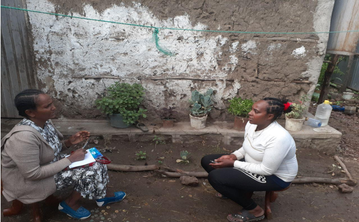
Fakkii: Dur.Daraartuu Daamxooo(4 /6 /12)fiDar.Baqqalaa Tolasaa (12 / 7 /12) mana mana isaanitti afgaaffiin yeroo garagaratti yeroo qorattuun odeeffannoo irraa funaannachaa turte.