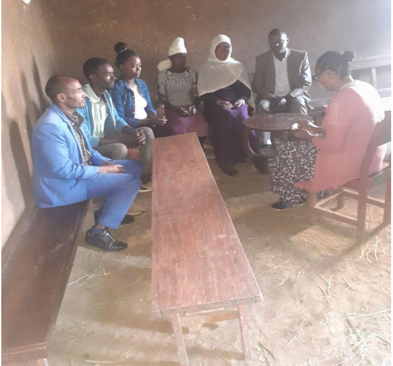
Fakkii: Namoota(16/6//12) ganda garagaraa irraa gandaSariitii, Goojjoo,Koluu Galaanfi Edeensa Galaan marii garee 2 ffaan yeroo qorattuun odeeffannoo irraa funaannachaa turte.