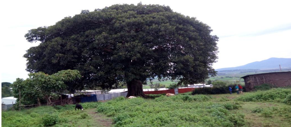
Fakkii.7.Zoonii Gaara Bushuu

Afseena Qilxuu Qarree ilaalchisee ,daawwannaa gaaafa guyyaa, 30/09/2011 taasifameerratti, Obbo Taammiruu Abboosee yaada isaanii yommuu kennan, iddoon kun kan Qilxuun guddaan tabba irratti kan argamu yoo ta'u, namoonni dur jalatti walgahii taa'u, afooshaa jalatti gaggeessuu fi namoota wal lolan jalatti araarsuu. Kanumarraa ka'uudhaan iddoon kun Zoonii Qilxuu Qarree akka jedhamu ibsaniiru.