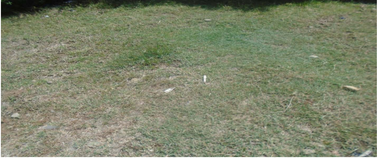
Suuraa Lafa bakkee araaraa agarsiisu