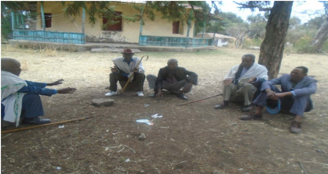
Suuraa yammuu jarsoliin Waaqa kadhatan agarsiisu

Sirni araraa kadhannaa Waaqatiin jalqaba. Kadhannaa keessatti jaarsoliin waantoota araara keessatti akka ta'u barbaadan kaasudhaan waaqa waammatu.