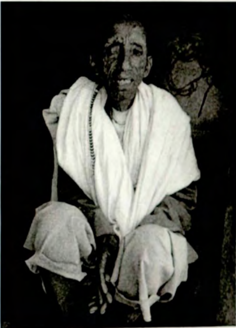
መምሬ ዘርአጽዮን 4/ማርያም