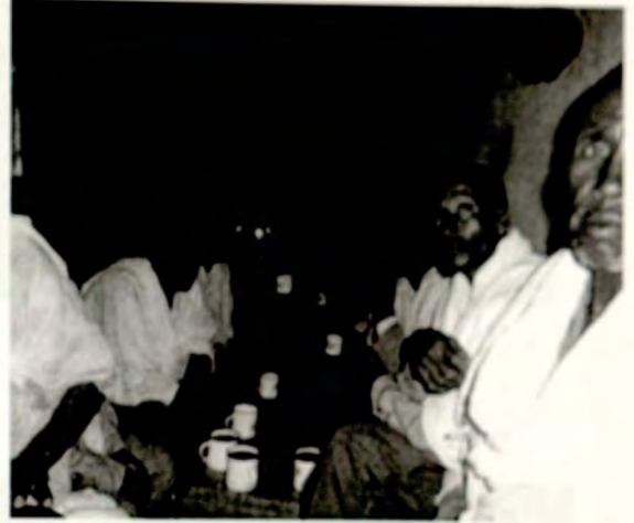
የማህበረሰቡ አባላት በጽዋ ማህበር ላይ