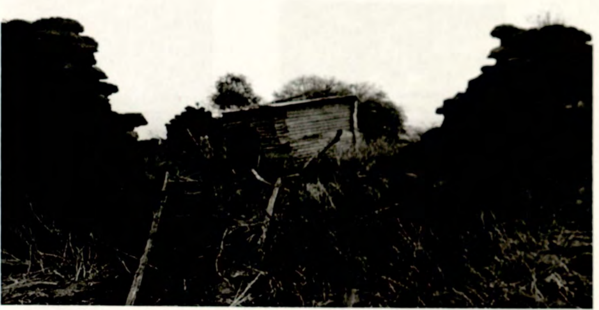
ታቦተ ጽዮን ለ40 አመታት የተቀመጠችበት ቦታ