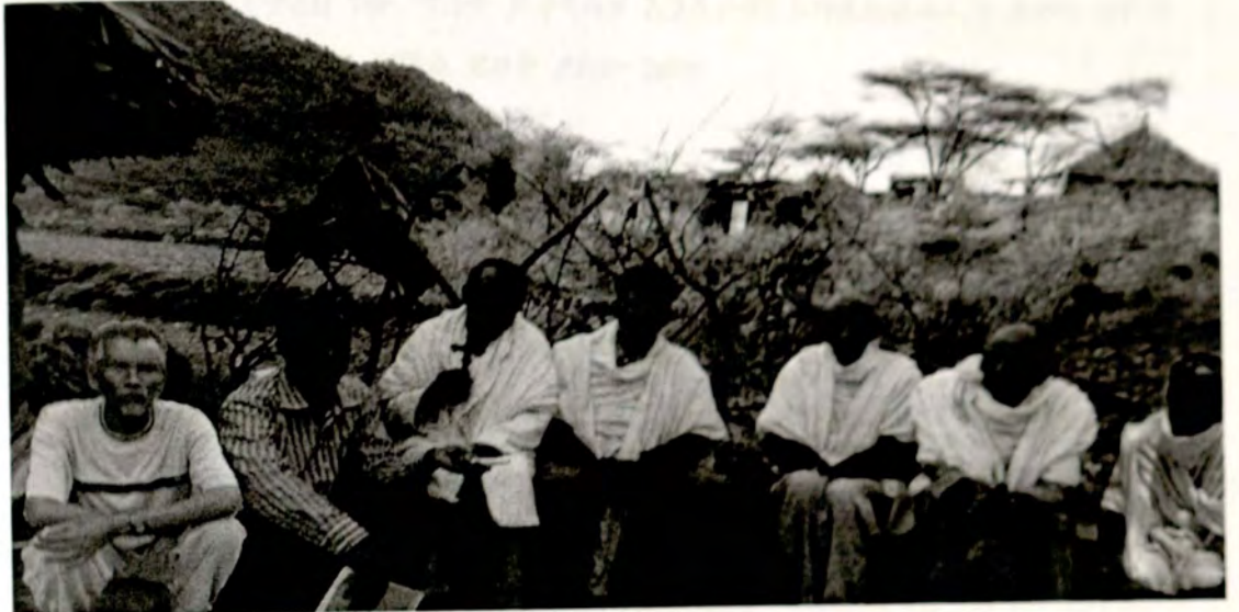
የቡድን ውይይት እየተካሄደ(መጋቢት 29 ቀን 2005 ዓ.ም፣ ደብረ ጽዮን ደሴት)

ከተረኩ እንደምንረዳው ቀደም ሲል በደሴቱ ውስጥ ያልነበሩት ጠጣና ከርከሮ የማህበረሰቡ አባላት ምክር አልሰማ በማለታቸው በእርግጥ ምክንያት መግባታቸውን ነው። በመሆኑም ተረኩ ትእዛዝ በማክበር ከቁጣ መዳን እንደሚቻልና የማህበረሰቡ አባላትም እርግጥን እንዲፈሩ ለማስተማር የቀረበ ነው። ከዚህ ሌላ አዲሱ ትውልድ የቅዱሳንን ቃል በማክበር ከእርግጥን እንዲጠበቅ በማድረግ ረገድ የራሱ ሚና አለው።