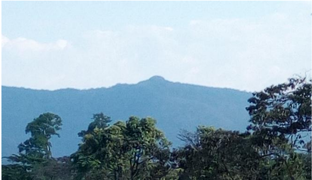
የሞኑ ተራራ ከፊል ገጽታ።

የሞኑን አስፈሪነትና ባለ ግርማነት በመግለጥ የአቶ ቦኒን ሀሳብ የሚያጠናክሩት የጉራ ፈርዳ ኗሪውና ሞኑን በርቀት የሚያውቁት አቶ ሾልዋ ናቸው። “እዚያ አካባቢ ሄጄ አውቃለሁ ወደ ተራራው ግን አልቀረብኩም። በርቀት ነው ያየሁት፡ ፡ ቦታው ዝም ብሎ የሚሄድበት አይደለም። እነሱ፤ ሟቾቹ የሚኖሩበት ነው።። ክብድ የሚልና የሚያስፈራ ቦታ ነው።” (ቃለ መጠይቅ፣ ግንቦት 2011 ዓ.ም ጉራ ፈርዳ)