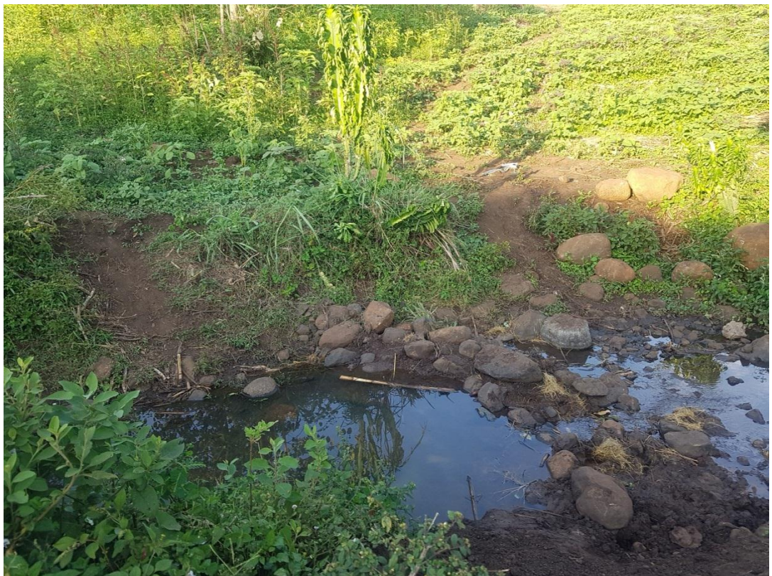
አዝናቢዋ ሌማው ጃና የታጠቡበት፣ ኮላይ ቀበሌ የሚገኘው ቆሊ ወንዝ፣ (ፎቶ በአጥኝው)

በመጀመሪያ ደሮ እናርዳለን አምጡ አሉ፡፡ ከዚያ ጥቁር ደሮ ተሰጠ፡፡ ረዳቱ አረደና ደሙን እሳቸው እግሮች ላይ ቀባ፡፡ ከዚያ እዚህ ቆሊ ወንዝ ገቡና የሆነ ነገር እያሉ ታጠቡ፡፡ እዚህ ድረስ አብሬያቸው መጥቻለሁ፡፡ ገዛኸኝ የተባለውም ፖሊስ አብሮኝ ነበር፡፡ ሴትየዋ እዚህ ታዋበው እንደወጡ ከወንዙ ሦስት ርምጃ እንደራቁ፣ ከባድ የሆነ ዝናብ ዘነበ፡፡ ከየት እንደመጣ ሁላችንም አላወቅንም፡፡ ከዚያም በኋላ ሕዝቡ ሴትየዋ በትክክል የዝናብ አምላክ ናቸው፡፡ ዝናብ ያስጠፋሉ ያስመጣሉም ብሎ ሲነጋገር ነበር፡፡(ቃለ መጠይቅ፣ ግንቦት 2011ዓ.ም፣ ቆሊ ወንዝ ዳር)