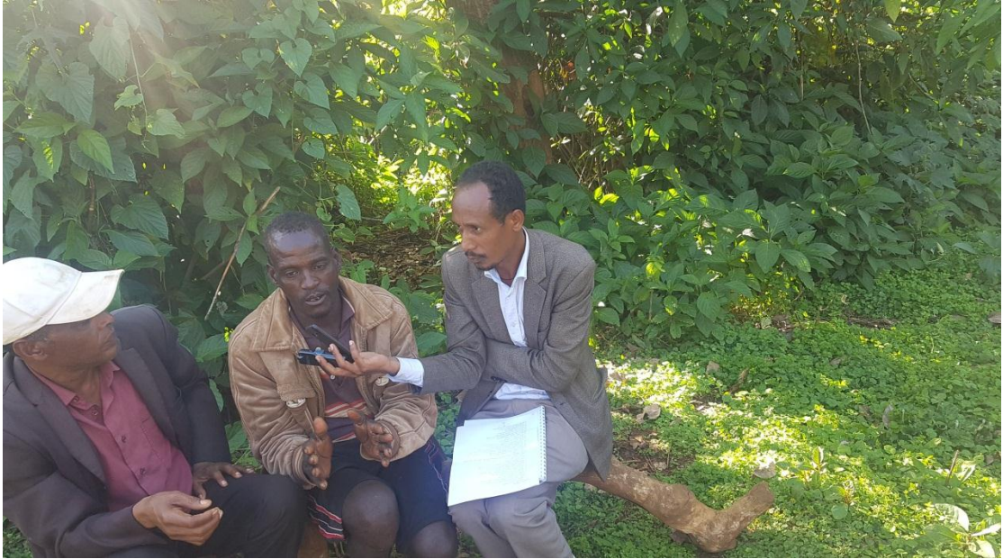
የዝንጆሮ ንጉሠ በቃለ መጠይቅ ወቅት፣ ጨበሬ።