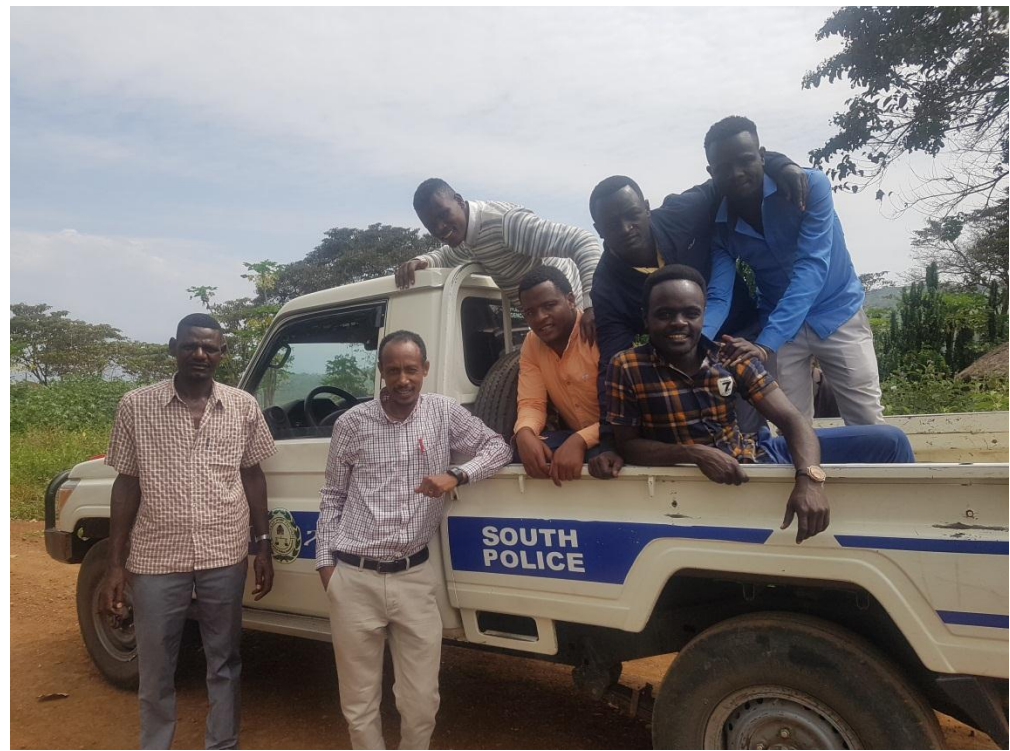
አጥኝው ወደ ያርጣ ቀበሌ ሲጓዝ፣ ።

በአጠቃላይ በያርጣ አካባቢ ያለው የወባ ንጉሥ ሕዝቡን ከወባ እየጠበቀ እንደሚኖር ይታመናል። በተፈጥሮ ወይም በአደጋ ሕይወቱ ሲያልፍ ከሱ ዘር የበኩር ልጅ ስልጣኑን ተረክቦ የወባ ንጉሥነቱን ይቀጥላል። በአምላክ ቱማ ፈቃድ በንጉሠ ቸርነት የያርጣና አካባቢው ሰው ሲያጠፋ በወባ እየተቀጣ፣ ደግ ሲሠራ ከወባ እየተጠበቀ እንደሚዘልቅ ዘመን የተሻገረው የአፈጣጠር ሚት ይተርካል።