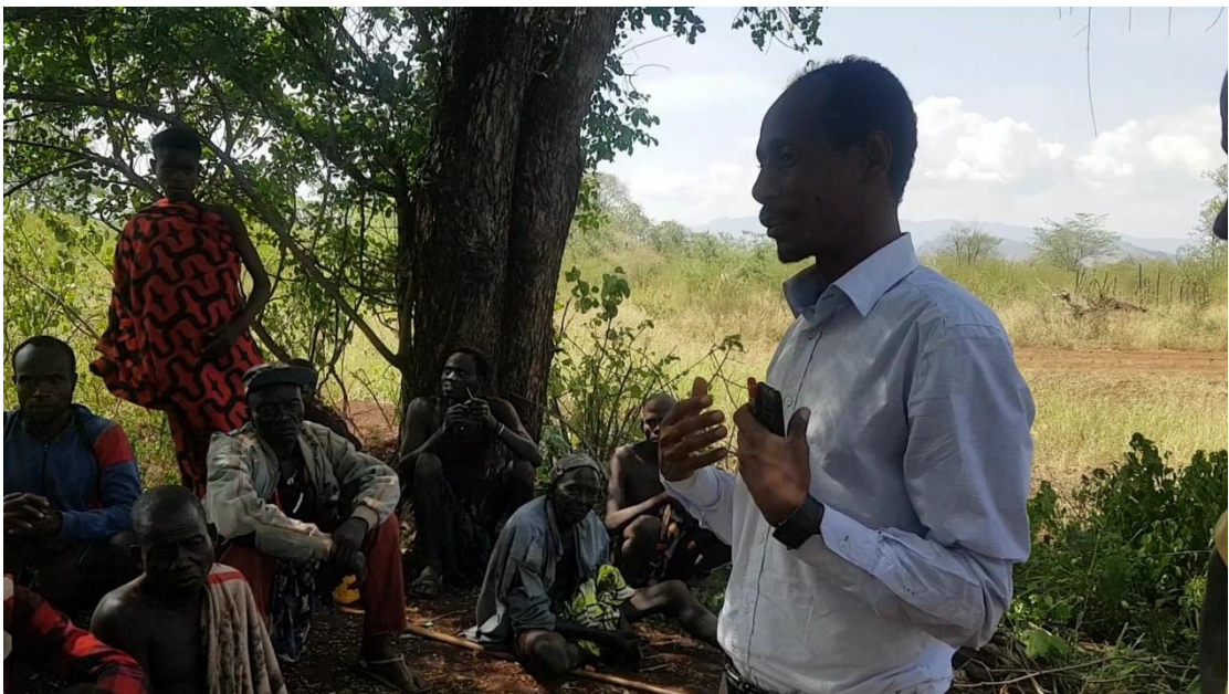
የካቲት 8 ቀን 2011 ዓ.ም. ከጧቱ 4:00 - 5:00፣ የያርጣ ቀበሌ፣ የቡድን ውይይት በተደረገበት ወቅት አጥኝው የመወያያ ጥያቄዎቹን ሲያቀርቡ።

ከአካባቢው ቆላነት የተነሳ ወባ የሚቀሰቀስበት ወራት እንዳለና በእነዚህ ወራት ሕዝቡን የሚጠብቁትና በወባ ከመርገፍ የሚታደጉት የወባ ንጉሣውያን እንደሆኑ