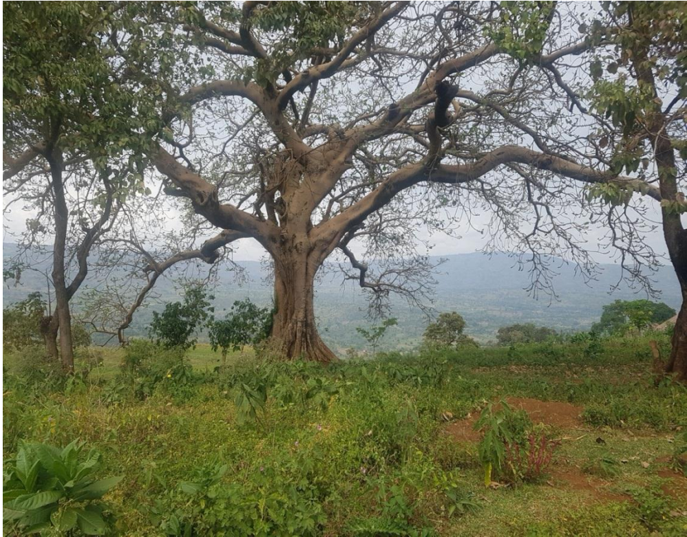
ባላባት በሆኑ ሰው መቃብር ላይ የበቀለ ዋርካ፣ (ፎቶ በአጥኝው)።

ሰው ሲሞት ዘመዶቹ በጠቅላላ ሥፍራውን ለቅቀው በመሄድ ሌላ ቦታ ላይ አዲስ ቤት ሠርተው ይኖራሉ። ሰውዬው በተቀበረበት ቦታ ላይም ሦስት ወራት የቆየውን ዳስ ሲያፈርሱ በቀብሩ ላይ ዋርካ ይተክላሉ። ዋርካ መትከል ግን ዛሬም ድረስ አለ” (አቶ አወቀ ፎሮሽዋ ህዳር፣ 2010ዓ.ም፣ ባቼማ)