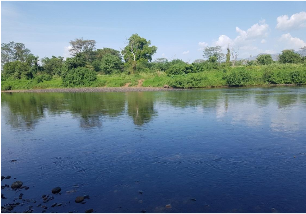
የሻርማ ወንዝ አንድ ገጽታ፣ ።