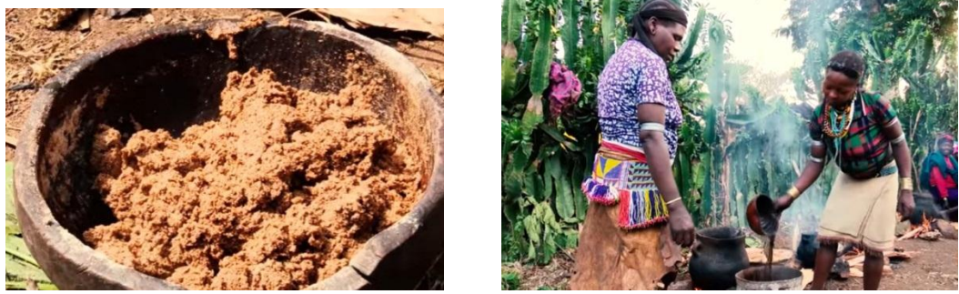
ከግራ ወደ ቀኝ፣ የመኤኒት ብሔረሰብ ባሕላዊ ምግብ ጳሩ/ገንፎ እና ቡንጡላ ወይም ጨሞ የተሰኘው ቡና (ፎቶ በአጥኝው)።

በመኤኒት ሌላው መደበኛው ምግብ “ጳሩ” ነው። ጳሩ ገንፎ ሲሆን የበቆሎ እና የማሽላ ገንፎ ለምግብነት በስፋት ይውላሉ። ሁለቱ የገንፎ ዓይነቶች ከለቅሶ እና ከግድያ እርቅ ሥርዓት ጋር ተያይዞ የተለያዩ ዓይነት ትርጉም እና ሥርዓት አላቸው። ሁለቱም የገንፎ ዓይነቶች ከ“ኮልፊ” ወይም “ኳይዛ” ጋር ሆነው ይቀርባሉ። እነዚህ ዓይነት የጎመን ዘሮች ብዙዎን ጊዜ ከደጅና ከጓሮ የማይጠፉ ሲሆን አንዳንዴ በበቀሉበት ቦታ ላይ ቀጥታ እየተቆረጡ ይላሉ።