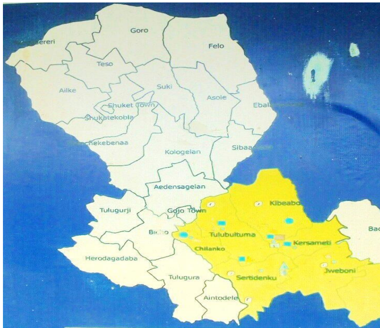
Fakkii Kaartaa Aanichaa (Maddi Waajira Bulchiinsa Lafaa Aanichaa

Diinagdeen uummata Aanaa Jalduu harki caalan qonnarratti kan hundaa'edha. Akka odeeffannoon barruu "Seenaa Aanaa Jalduu" (1980:3) mul'isuufi haala qabatamaa aanichaa irraa hubachuun danda'amutti, Uummata Aanichaa keessaa %2 hojjattoota mootummaafi kanneen biro haa jirataniyyuu malee %98 hojii qonnaarrattin bulu. .Qonna yoo jedhamu midhaan oomishuufi horii horsiisuu ofkeessatti hammata. Horsiiisni horii loon, bushaayee, kotteduudawwanfi lukkuuwwan. kan hammatu yoo ta'u, midhaanifi biqiloonni biroon aanicha keessatti oomishaman ammoo, midhaan agadaa mishingaa, boqqoolloo, midhaan biillaa qamadii, garbuu, ajjaa, midhaan dibataa ammoo nuugii, talbaa suufii akkasumas xaafiifi kkf. aanicha keessatti bal'inaan oomishamu. Fuduraafi muduraa keessaammoo moseen baay'inaan oomishama. (Madda Waajira Misoma Qannaa Aanaa Jalduu)