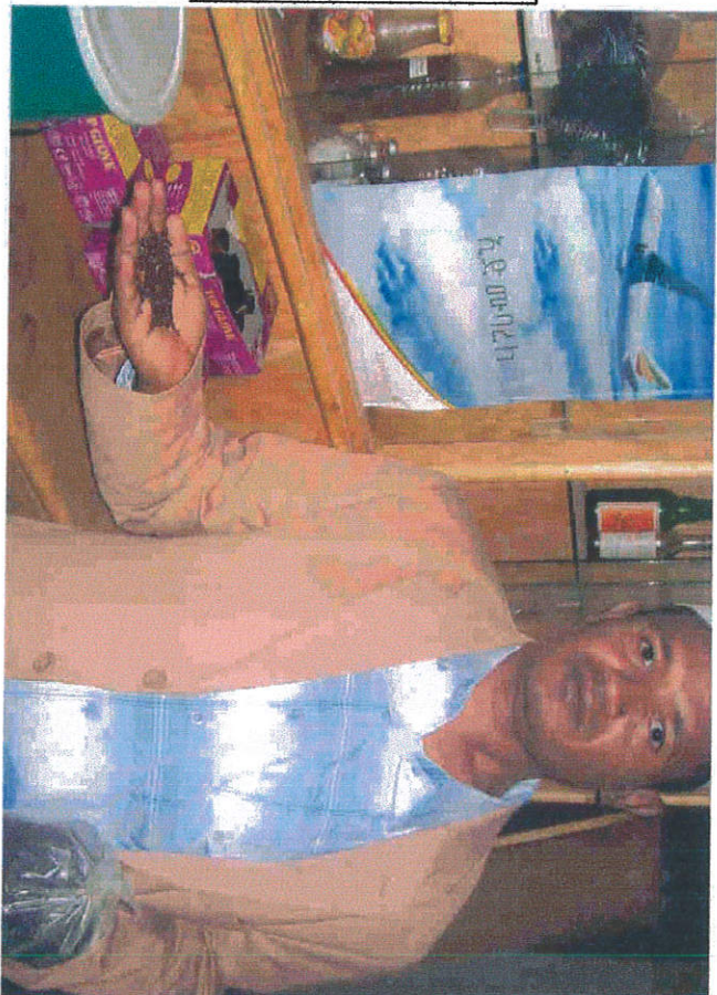
ህክምና ቤት ላይ ለህጻናት