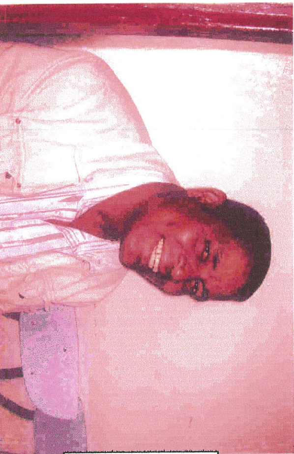
ሐዘም ጆሮ ሳብ