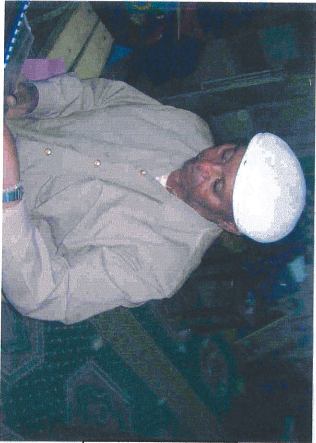
ህጻናት ልማት ሪፖርት