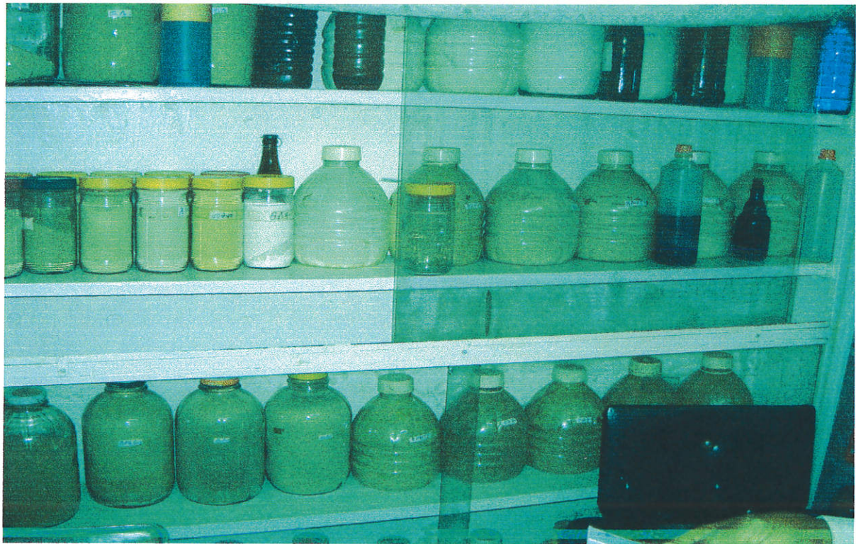
ለህክምና የተዘጋጁ መድሃኒቶች

ሃኪም ማሞ ኃይሌ ከ15 ዓመታቸው ጀምሮ የባህላዊ ህክምና አገልግሎት በመስጠት የገንነ ስምና እጅግ ቁጥሩ የበዛ ታካሚ አላቸው (በምልክታዮ ወቅት 150 ታካሚዎች ቆጥራዎለው) የመድሃኒት መቀመጫ መመሪያ 11 መጻሕፍት አሳይተውኛል። የተቀመሙ መድሃኒቶች ለምን አገልግሎት እንደሚውሉ ተጽፎባቸው ተደርድረዋል።