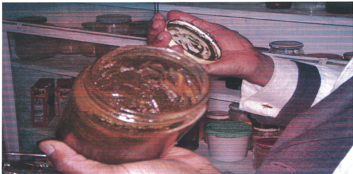
በቅባት መልክ የተዘጋጀ መድሃኒት

የጥናቱ አካል የሆኑ ሃኪሞች መድሃኒቶችን እንቀምማለን ይላሉ፣ የተቀመመ ከሌላ ወስደን በሽተኛ እንፈውሳለን የሚል አንድም አላጋጠመኝም። ስለዚህ ሁሉም ለሚሰጡት ህክምና እራሳቸው መድሃኒት ሰብሳቢ፣ ቀማሚ፣ መርማሪና መድሃኒት ሰጭ ናቸው። በጠቅላላው የመድሃኒት መቀመም ችሎታውም ሆነ የማከም ጥበቡን እያንዳንዳቸው ሃኪሞች ያከናውናሉ። ከባህል የተረከቡትን ባህሉን ጠብቆ በዚያው ልማድ እያከሙ መጓዝ የሚታይበት የህክምና ዘርፍ ነው፣ የባህላዊ መድሃኒት ህክምና አሰጣጥ።