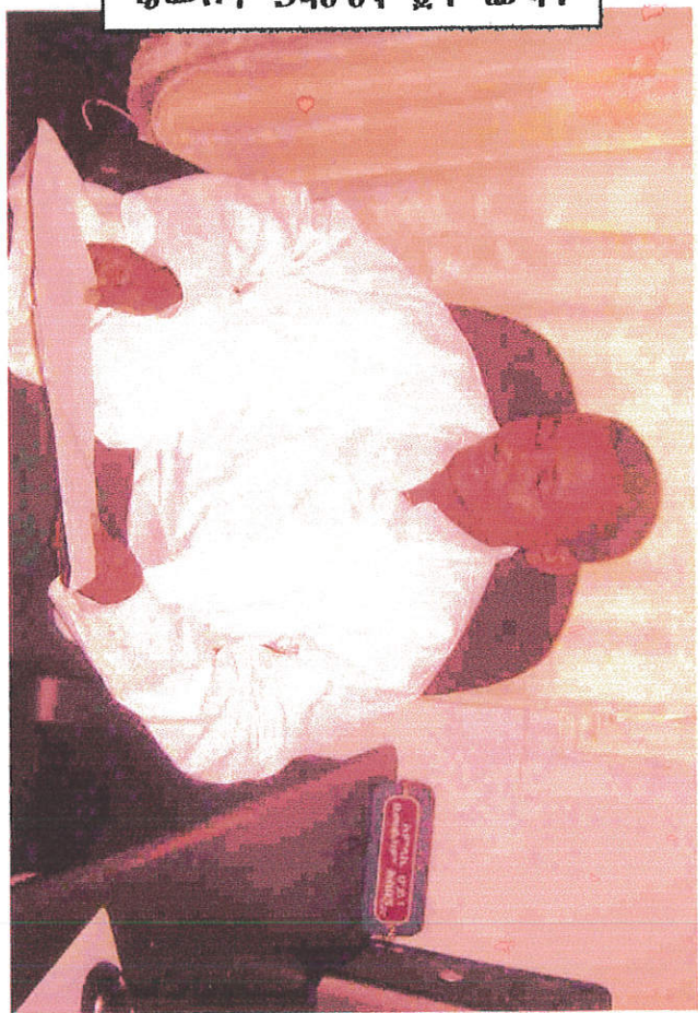
ሐዘም ፍቅረሰብ መኮንን