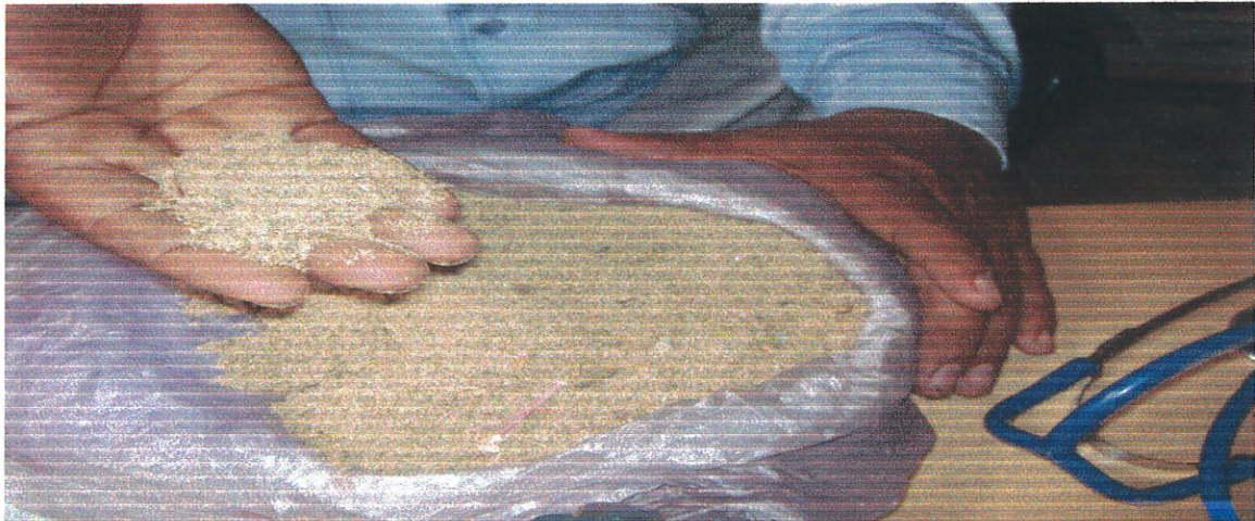
የመድሃኒት መቀመጫ ፍሬ

አብዛኛውን እጹን አንተ ማንገሥ አለብህ በፀሎት፣ በድሮው ከሆነ ግን ደምም አፍሰህ የምታደርገው ነገር አለ። አንተንም እንዳይጣላህ፣ የሚጣላህ ዕጅግ አለ። ያንን እንደገሰገስክ ሂደህ ብትቆርጠው ወይም አይንህን ያጠፋሃል ወይም ያሳብድሃል ወይ አንድ ነገር ያደርግሃል። ያ ነገር መድሃኒት ነውና ጠባቂ መልዓክ አለው። መድሃኒቶች ናቸው፣ ዕጅግቶች ናቸው እንደሰው ይታዘዛሉ። / ካሴት ቁ.1፣ ሚያዝያ 9/2000 ዓ.ም/