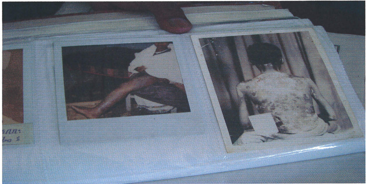
አካላቸው ላይ ቁስል ያለባቸው ታካሚዎች

ለጥናት በተመረጡ የባህላዊ ህክምና መስጫ ቦታዎች ሁሉ ያገኘኋቸው ታካሚዎች በአብዛኛው ከአስሩ ሰባቱ፣ በሚያቆስል በሽታ ታመው እርዳታ የሚፈልጉ ናቸው። ሃኪሞቹ፣ ከህክምና በፊትና በኋላ ፎቶ ግራፍ አንስተው ለመረጃ የያዟቸው ታካሚዎች ሰውነታቸው የቆሰለባቸው ናቸው።