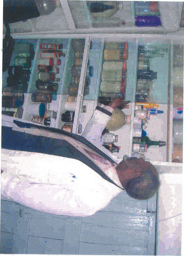
ህክምና ቤት ላይ ለህጻናት