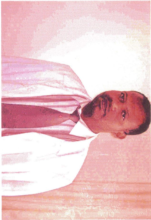
ሐዘም ሐጅ አብዛር ሐህመድ