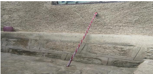
Suuraa 2 siinqee

Sinqeen meeshaalee aadaa Oromoo keessaa ishee tokkodha. Sinqeen ulee qal'oo dheertuu, qajeeltu, siimoftuu, mallattoo heerumaafi mirga dubartoonni Oromoo aadaadhaan qaban kan agarsiiftuudha. Akkasumas kabajaafi safuu guddaa qabaachuu isii irraa kan ka'e akka ulee kanneen biroo loon ittiin hin dhayan. Seeraafi wayyoomaaf qabatamti. Kunis aadaa fuudhaafi heerumaa keessatti guyyaa moggaasa maqaa misirroo kana keessatti dubartiin heerumaan dhufte tun kan qabatee dhufte yoo ta'u, guyyaa dhoofsisa san horii warri gurbaa isiif kennu san akkuma aadichaattitti dirra loon sanii tuquun ittiin kiyyoomfatti jechuudha. Akkasumas kan seerri dubartootaaf tumee ittiin kabajamuufi eenyummaan isaanii ittiin beekamuudha. Sinqee tanas bareechisuuf jecha callee bifa bareedaa ta'e itti diruun miidhagsuun ni danda'ama.