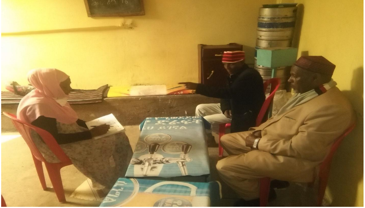
Suuraa 3 Maree garee xiqqaa qorattuun manguddoota waliin taasifte guyyaa 27/08/2010/2018 suuraa ibsu