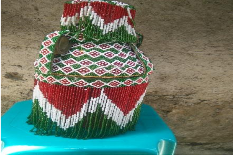
Suuraa 1 Qorii