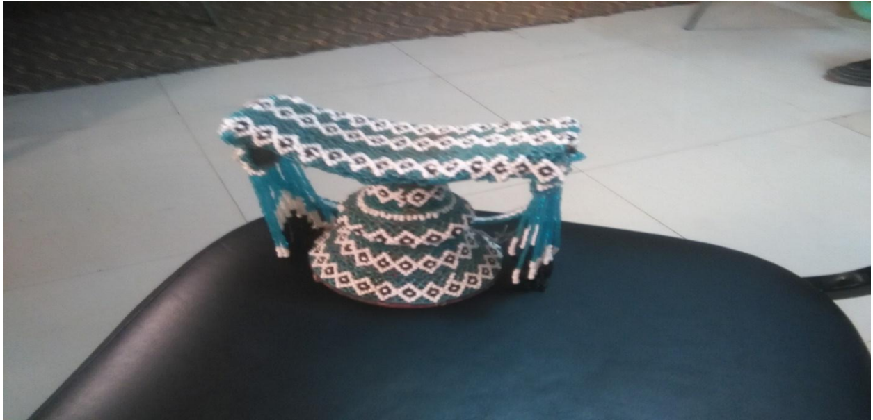
Suuraa 3 Boraatii