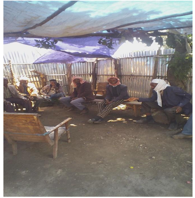
Suuraa 2 Maree garee guddaa qorattuun manguddoota waliin taasifte guyyaa 27/08/2012 suuraa ibsu