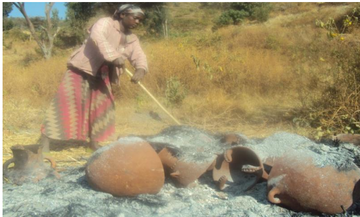
የሸክላ ቁሶች በቤ ሲተኮሱ