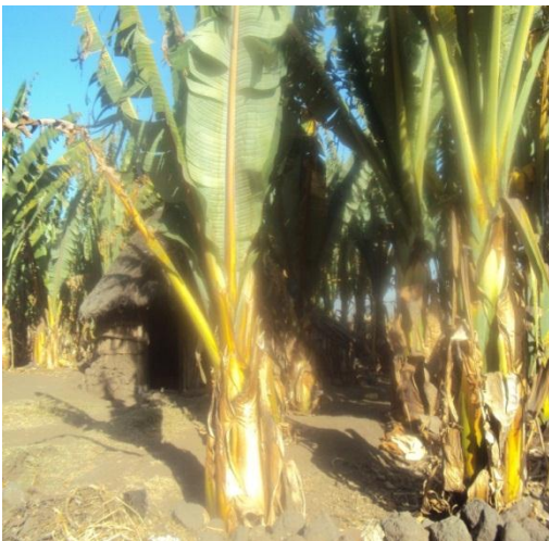
የሸክላ ባለሙያዎች ቤት