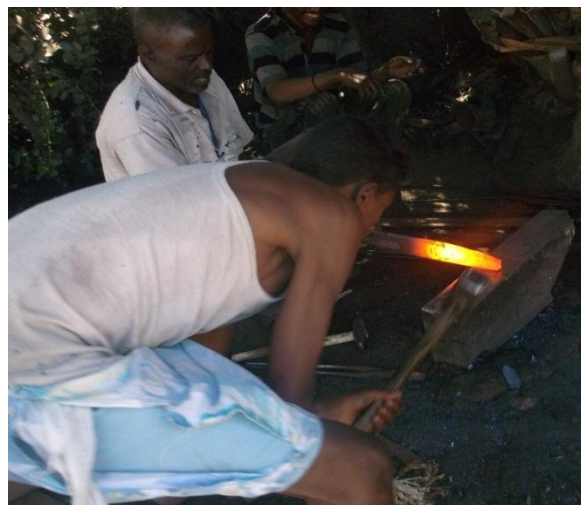
አንጥረኛ ባለሙያዎች በስራ ላይ