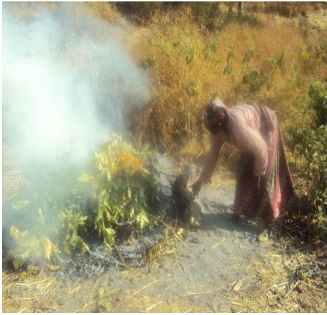
የሸክላ ቁሶች ሲተኮሱ