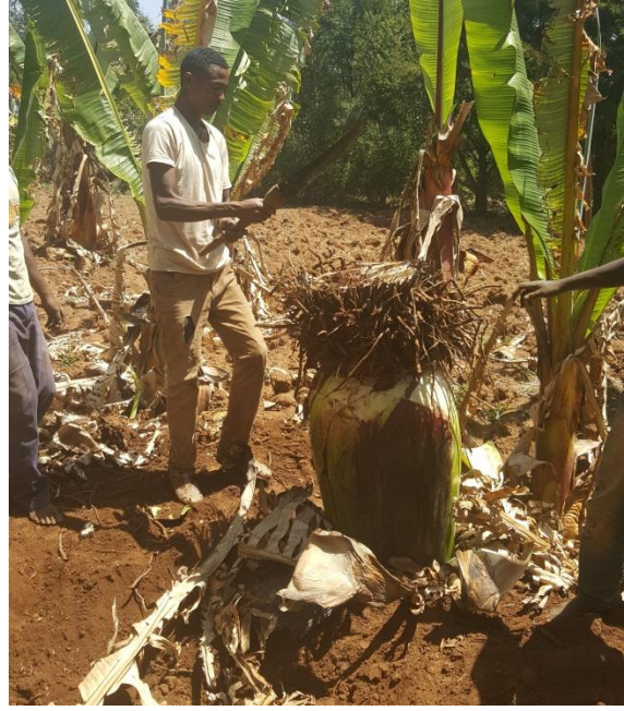
እንሱት በሰንዳ ቁስ ሲቆረጥ