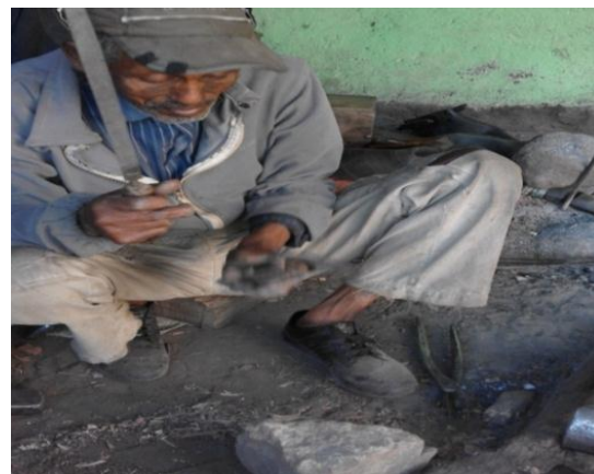
አንጥረኛ ባለሙያ በስራ ላይ