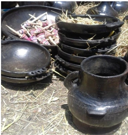
የቅቤ ማስቀመጫ ጥወና ደንጋሳ ቁሶች