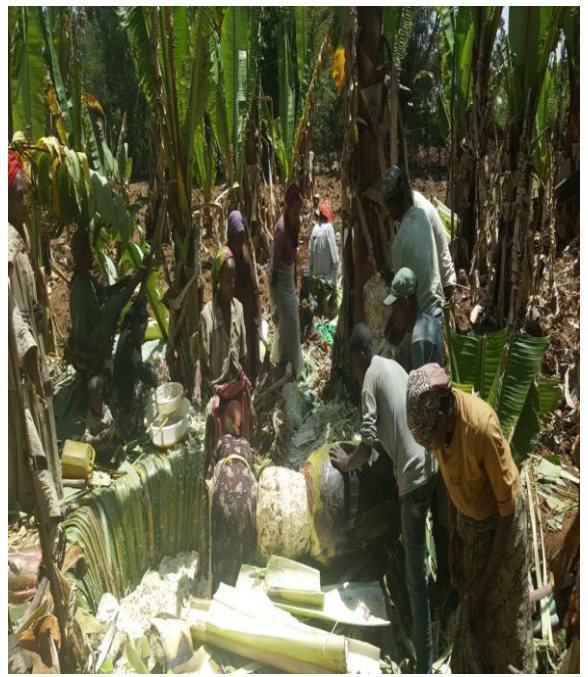
እንሱት በወለት ቁስ ሲነቀል