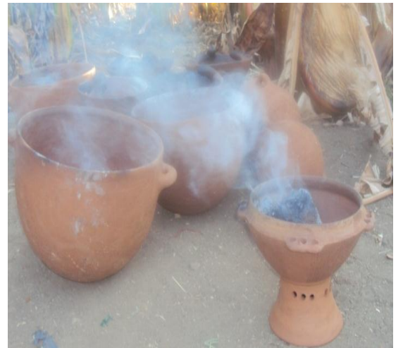
የሸክላ ቁሶች ሲተኮሱ