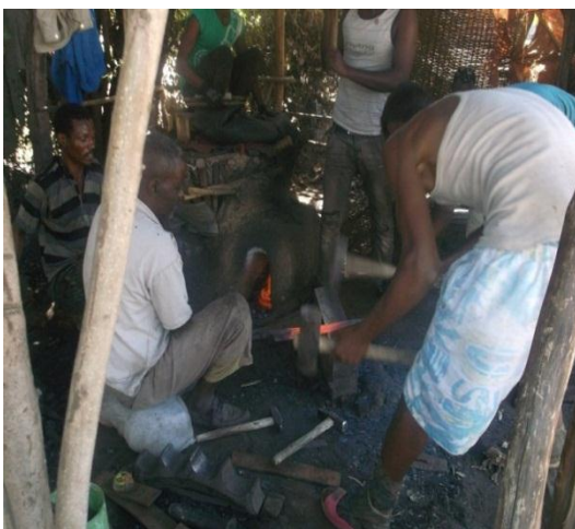
በመደሻ ብረት ሲቀጠቅጡ