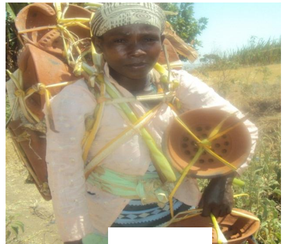
ወደ ገበያ ጉዞ