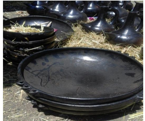
የወጩት፣ ደንጋሳና ባለ አንድ ጡት ጀቦና