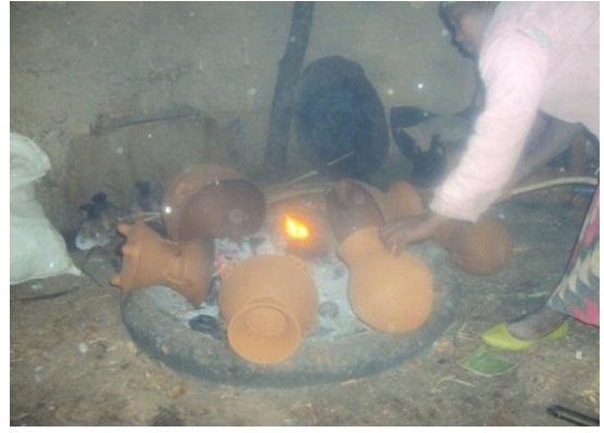
ወ/ሮ ምንጩ ረጋሳ ቁሶችን በመተኮስ ላይ