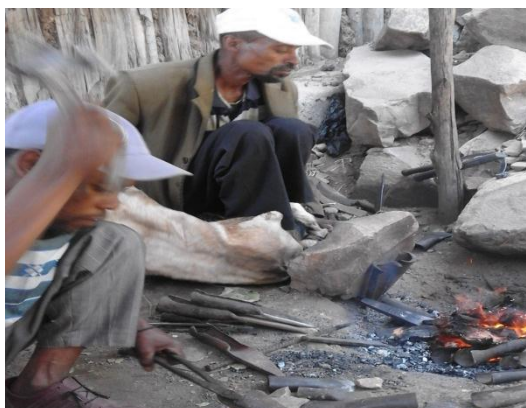
ባለሙያዎች ብረት ሲቀጠቅጡ