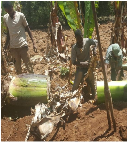
እንሰት በወለት ቁስ ሲነቀል