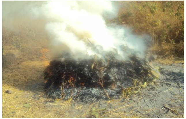
የሸክላ ቁሶች ሲተኮሱ