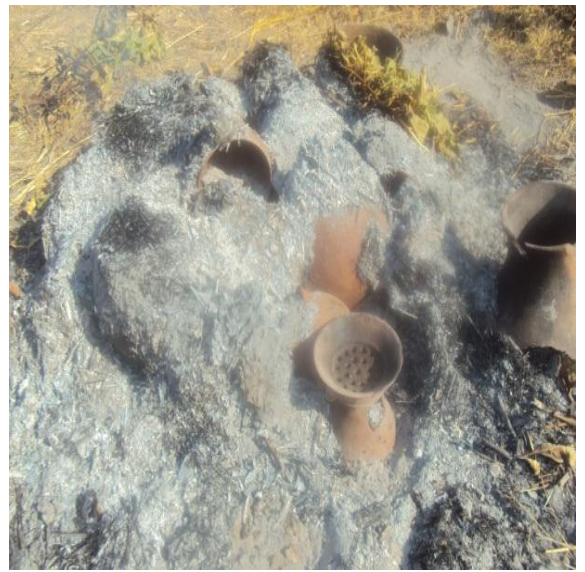
አመዳቸው ያልተራገፉ ቁሶች