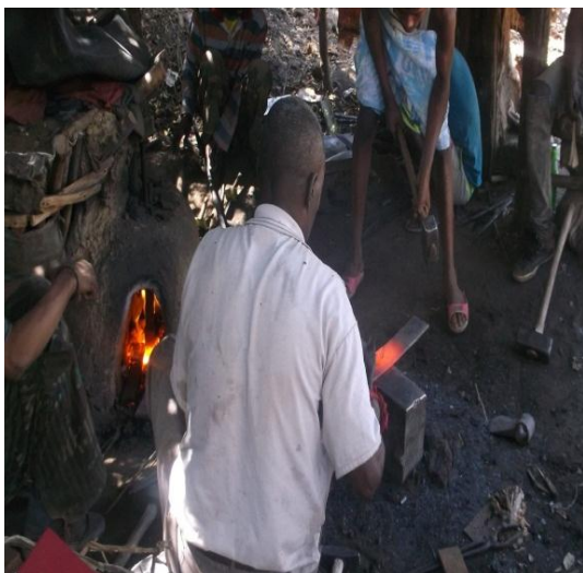
አንጥረኛ ባለሙያዎች በስራ ላይ