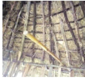
Suura.7.Iddoo ol ka'aa Shimala Agarsiisu.