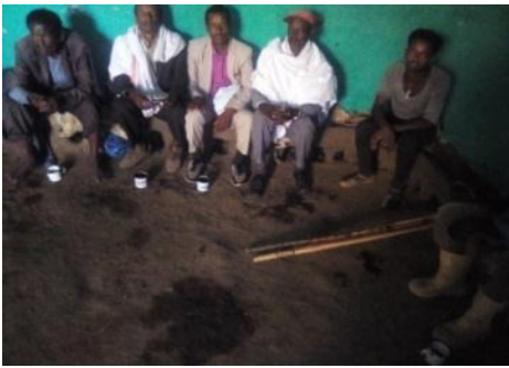
Suura,3.Namoota Odeeffannoo kennuuf filataman