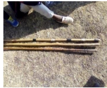
Suura.4.Fakkii Shimalaa Agarsiisu