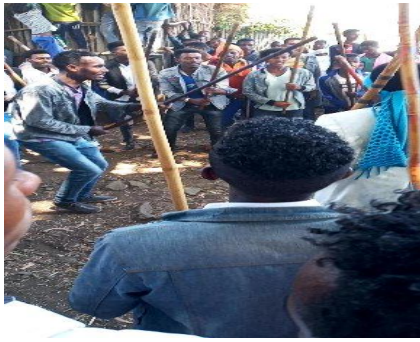
Suura.6.Haala Rukkuttaaa Shimalaa Agarsiisu