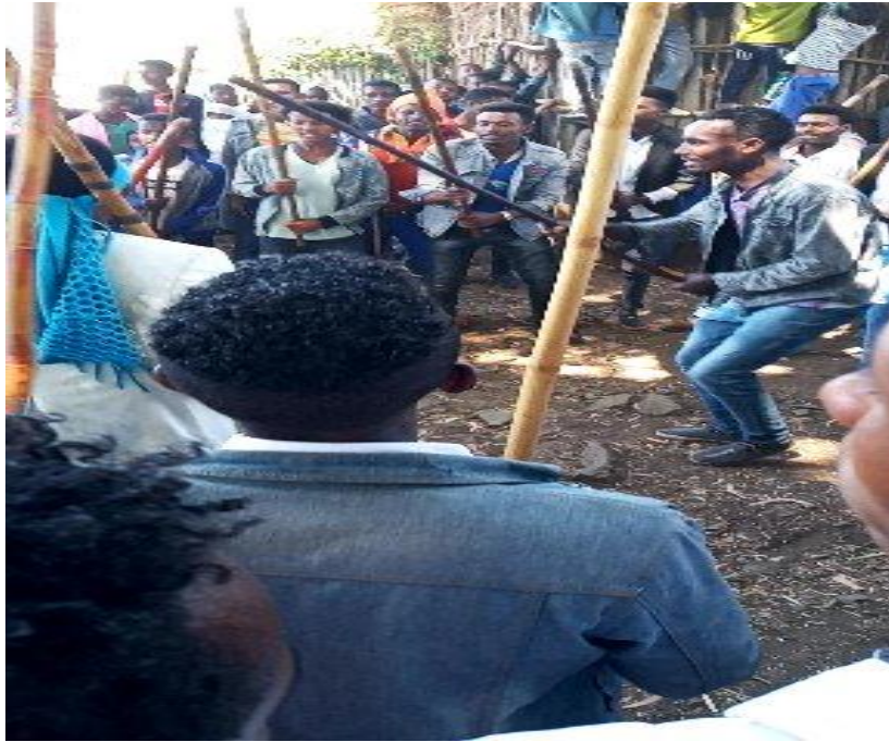
Suura.3.Yeroo shaayiin gara gidduu dhiichisa seenu, haala qabannaa shimalaa,magaala Tulluu milkii/12/05/2013/ kafame

Walumaagalatti akka yaanni afgaaffii, marii gareefi daawwannaa irra argame hubachiisutti akkuma Oromoon yeroo mammaaku“Waa malee manni hin haaru jedhu.”dhiichisa keessatti rukuttaan shimalaa akkasumaan kan adeemsiffamu osoo hin taane sababa adda addaa irra kan ka'e ta'uu isaati.Sababawwan kunniinis dhiichisni yoo si'aan qabamuu baate,haalli dhaabbii hirmaattotaa yoo sirrii ta'uu baate,dhiichisa cabsaan ala yoo walharkaa fuudhuuf yaalan kan gaggeeffamuudha.