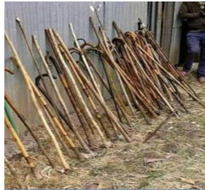
suura,9. Ulee Shimalli Bakka Bu'aa Dhufe Agarsiisu