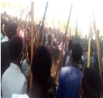
suura.8.Dhiichisni Haala Geengoottin RaawwatamuuAgarsiisu.