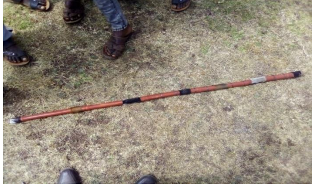
Suura .5.Shimala shiboofi toleen irra marama agarsiisu