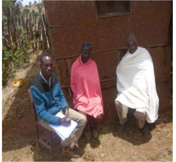
Odkennaa Obbo Nagassaa Dhugumaa kan Harma Hosiiseefi Obbo Tasyaayee Taaffaree Kan HarmaHodhe.