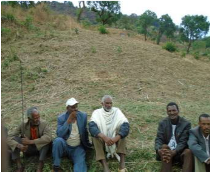
Namoota MGA irratti gaafa 19/08/2011ti Ganda Haroo gudinaa hirmaatan.