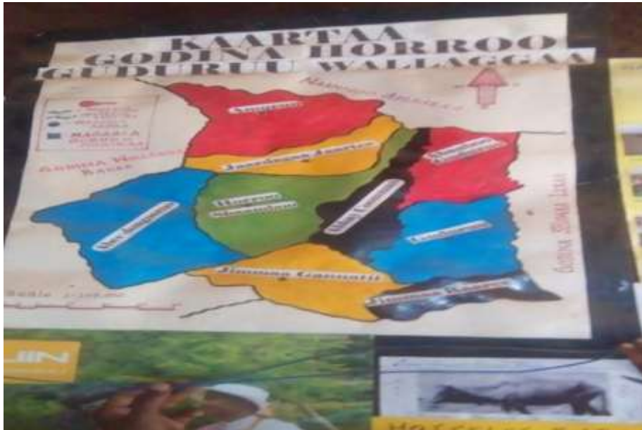
Fakkii 1. Kaartaa Godina Horroo Guduruu Wallaggaa Waajiira Aadaafi Turizimii Aanaa Amuruu Irraa Gaafa Guyyaa (20-08-2011) Fudhatame 1 .

Aanaa Amuruu Naannoo Oromiyaa Godina Horroo Guduruu Wallaggaa keessaatti arganti. Aanaan kun Aanoota Godina Horroo Guduruu Wallaggaa keessaa tokko taatee bara 1911tti akka aanaati of dandeessee kan hundoofedha. Aanaan Amuruu magaalaa gudditti Oromiyaa Finfinneerra Kiiloo meetira 410 (km 410) gara Dhiyaatti faggatee kan argamtu yoo taatu magaalaa gudditti Godinaa Shaambuu irraa immo, kiiloometira 68 (KM 68). Aanaan kun kallattii sadiidhaan Aanoota naannoo Oromiyaaa keessa jiranii kan daangeeffamtu yoo taatu isaanis: Kallattii Bahaan Aanaa Jaardagaa Jaartee, Dhihaan Aanaa Kiramuu, Kibbaan Aanaa Abee Goongoroo fi Aanaa Jaardagaa Jaarteen daangeeffamti. Kallattii Kaabaan immoo naannoo Amaaraan daangeeffamti.