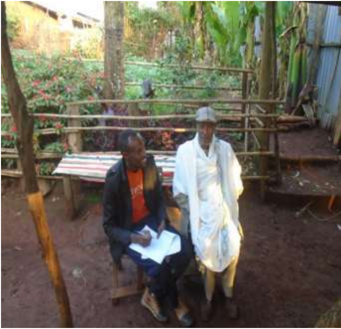
Obbo Takkalaa Bakaree Jaarsa Biyyaa odeeffannoo kan kennaan