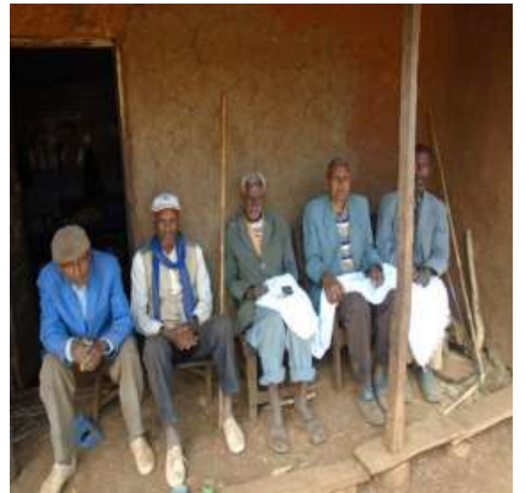
Namoota MGB Irratti gaafa 26/08/2011tti Ganda Xombee Dangaab hirmaatan.