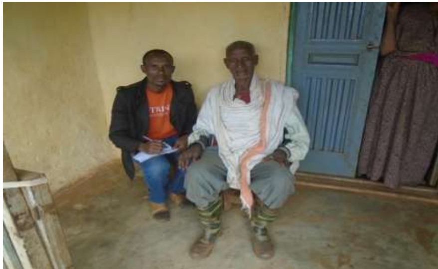
Odkennaa Obbo Balaay Zallaqaa Kan Harma Hosiise