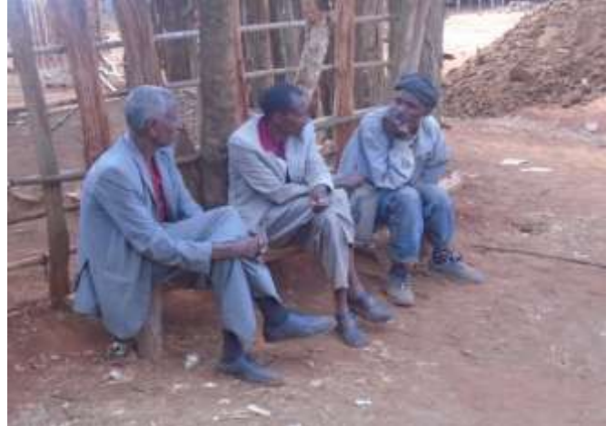
Namoota af-gaaffiif gaafa guyyaa 23/07/2011 Ganda X/Dangaabitti taasifame.