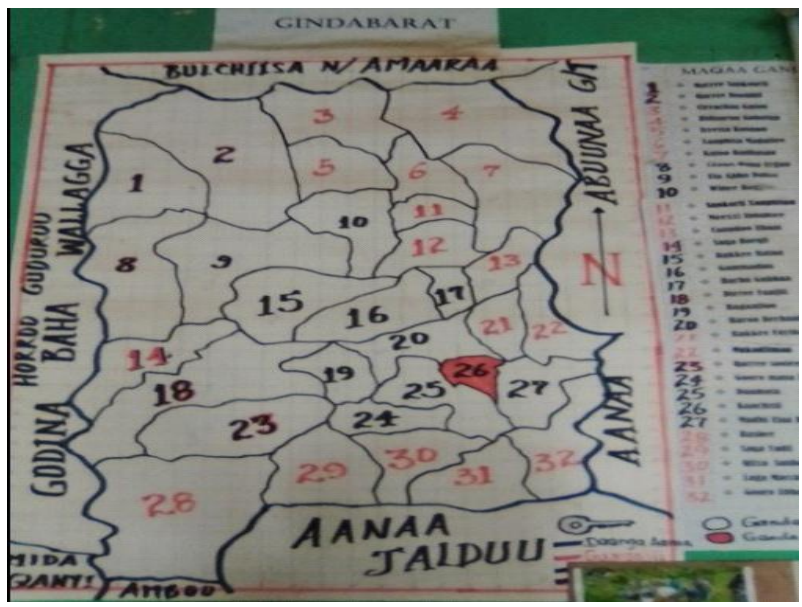
Suura 1: kaartaa aanaa Gindabarat