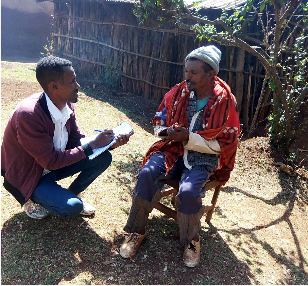
Fakkii:maanguddoo gaafa guyyaa 5/7/2012 ergaa jechoota safuu irratti yaada kennan