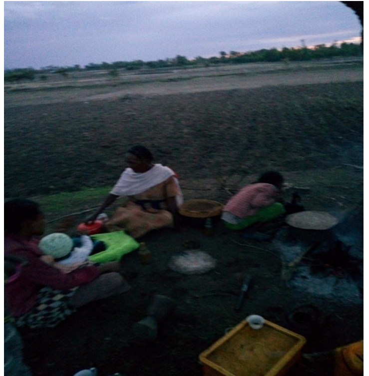
Fakkii 6 ffaa Sirna kennaa Abdaarii jalatti Buna dhaabbatan yeroo arfaaa suurri kun sababa gurracha'eef yoomessi isaa galgala waan ta'eef (1/9/2011)

Akkasumas, jiini seenee gaafa guyyaa tokkoo muka abdaarii jalatti shuummoo yookaan mulluu affeeluun maatiin hundinuu buna dhaabbatanii mijuu dhiyeeffatanii dhuguun abdaarii isaanii kadhatu. Kuns kaayyoon isaa: arfaasaan haala gaariin akka roobuuf, dukkana ganna nagana akka bahan, horiin, qotiyyoon waanjoo keessattii akka nagaa ta'an, dhaltii jalatti waatiin akka