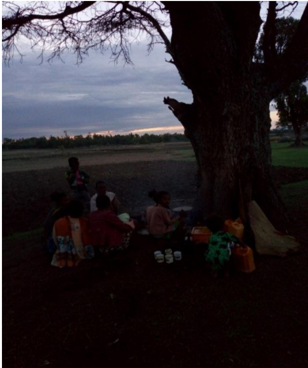
Fakkii 5 ffaa yeroo abdaarii jalatti buna dhaabbatan kan ji'a Ebilaa

yeroon lama kabajama. Innis, yeroo birraan bari'u namoota naannoo sana jiraatan irraa qarshii walitti qabuun korma bituun bakka abdaarii waliigalaa naannoo irraa qabaniitti maanguddootaan qalama. Kunis, sababiin qalamuuf, Abdaarii isaanii galateeffatu, kan dukkana gannaa keessaa booqaa birratti nu baafte, sa'aa namaan yaa abdaarii galanni siif haata'u jechuun dhiiga korma qalamee sana abdaariitti naquun foon korma sana immoo achumattii waadaniis nyaachuun, mijuu fidan sanas achumatti qicuun dhuganii wal eebbisanii kan fuula duraas maal akka gochuu qaban maanguddoonni ni qajeelchu. Inni lammataa immoo yeroo arfaasaa yookiin yeroo soomii hiikaa ayyaana faasikaa hoolaa yookiin re'ee bifa hinqabne jechuun kan namatti hin tollle bifa cocorree, gurraachafi kkf qaluun sirna kennaa abdaarii isaani haala ho'aa ta'een kan kabajataniidha.