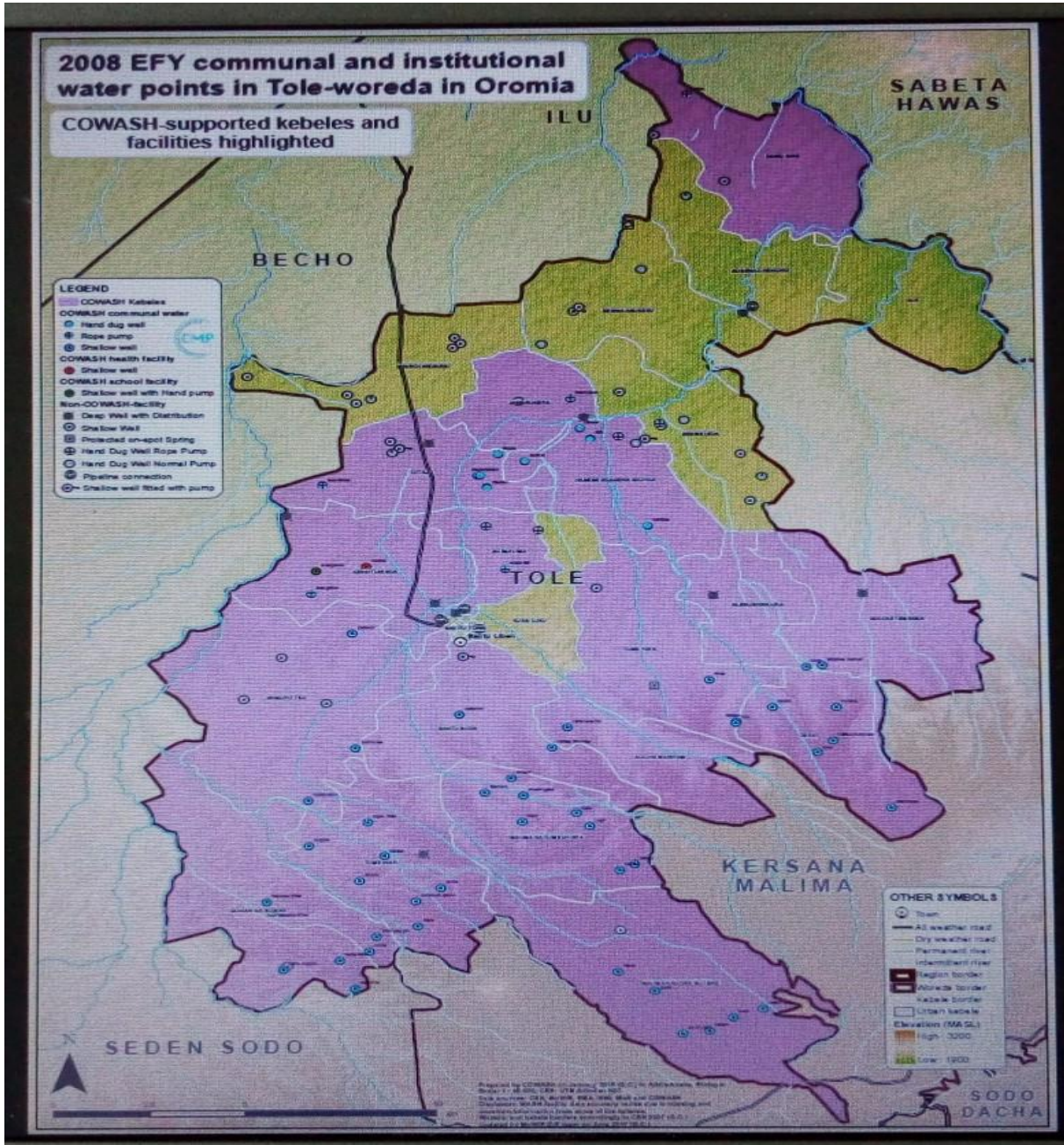
Fakkii 1 ff aa Kartaa Aanaa Tolee

aanittiif carraa guddaadha. Amantiiwwaan uummata Aanichatiin hordofaman Waqeffannaa, Ortodoksii, musliimafi Pirotistaantii kan jiruudha.