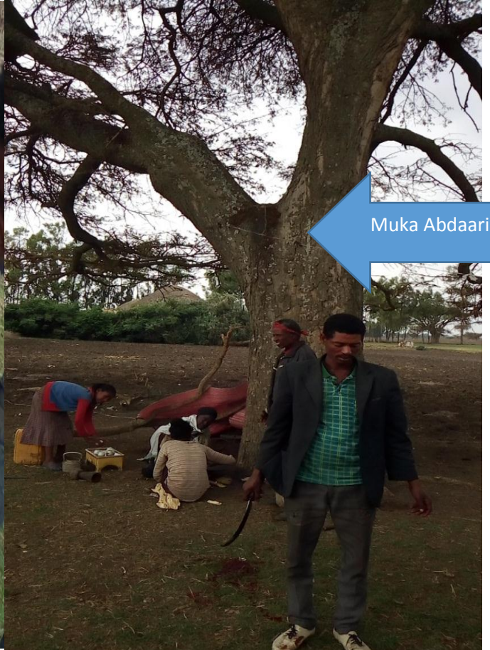
Fakki 4 ffaa Yeroo Sirna Abdaariif qopii taassan (12/3/2011)

Haata'u malee, Kan isaan asitti qalaniif, bakka abdaariitti yoo qalle rakkoo keenya waaqni battalumatti nuuf dhaga'a waan jedhaniif amananiifi. Erga qalanii immoo dhiiga horii sanaa mukaa abdaariitti facaasu. Sababiin isaa dhiinni sun nageenya, jabeenya waan ta'eef maatii hundaatti addatti dibu. Akkasumas, foon horii sanarraa jifuu iddoo hundaarraa muruudhaan ibidda keessaatti guggubu. Sababiin isaas kan gubate kun waaqa bira deemee nuuf araarsa jedhu. yeroo kadhatu, yaa abdaarii maatii koo nagaa naaf godhi, horiin koo nagaa naa godhi, midhaan faca'e kanatti rooba gahaa nuuf roobe, biyya keenya nagaa nuuf godhi, dhukkuba hamaa irraa nuu eegdeefi kkf jechuun abdaarii isaanitti wareeggatu. Kan kennaan kunniins Hoolaafi Re'ee keessaafi akkaataama qabeenya isaaniin buna dhaabbaachuu, shuummoo(mulluu), daabboofi mijuu siif kenna jechuun abdaariif wareeggatu. Yoomessi sirna kenna abdaarii waggaa