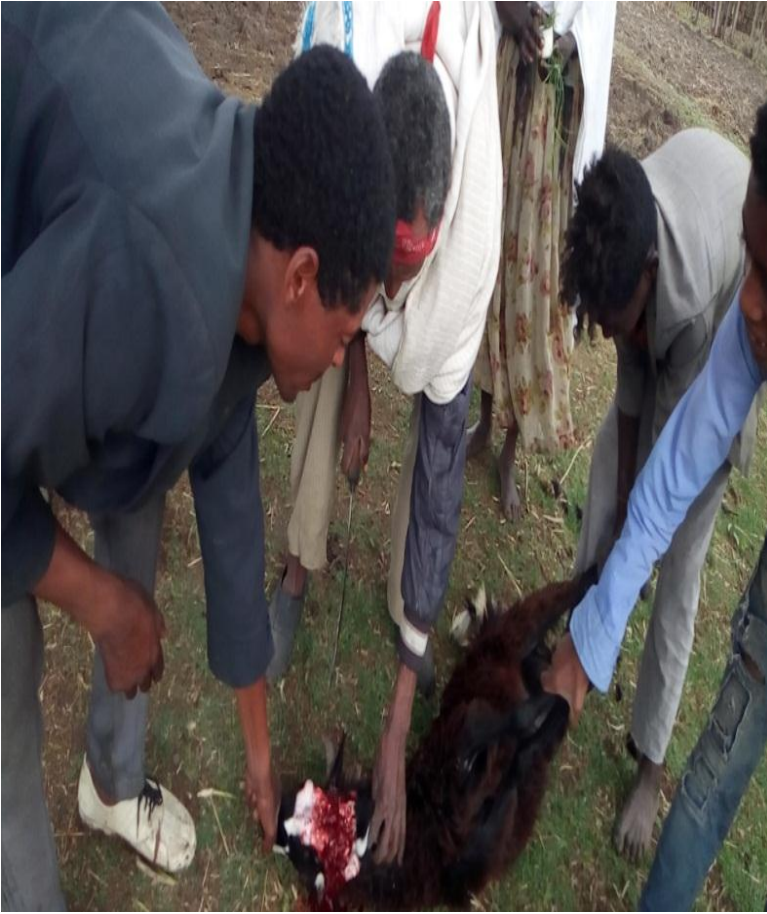
Fakkii 3 ffaa yeroo sina kenna abdaariitiif hoolaqalan kan ji'a Sadaasaa