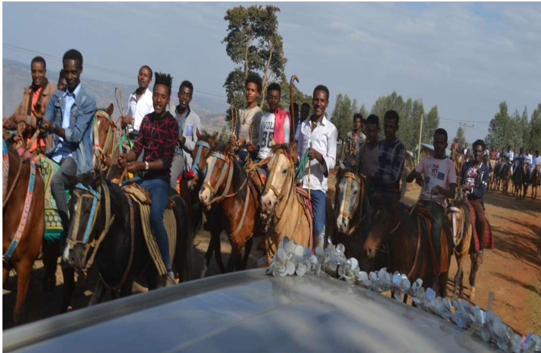
Suura Hamaamotaa Intala Fuudha Deemani.Gaafa 14/9/2012.