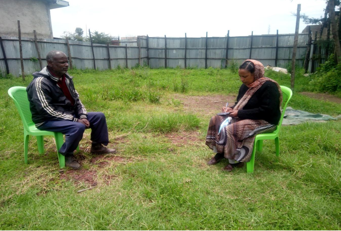
Aanaa Ejereetti Af-gaaffii Ganda Gorba Keessatti Gaafa 10/06/2012 Doobbitti gaggeeffame.