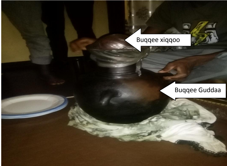
Suura.7. buqqee burqumsaa guddaafi buqqee xiqqaa tokko qabatte gaafa guyyaa 17/10/11 sirna qulfoo irratti argamuun qorataan kaase