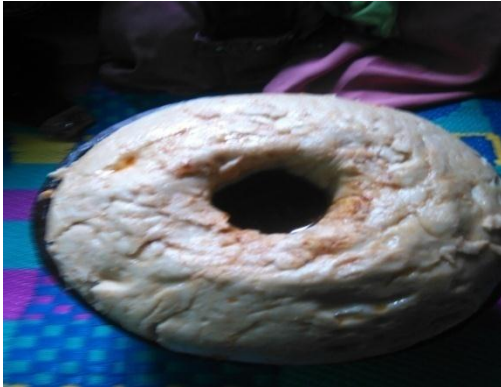
Suura.8. Gaafa guyyaa 21/10/11 sirna qulfoo Abduu Aliyyii kan gaafa qayya geessaa qophaa'e irratti argamuun qorataan kaase.