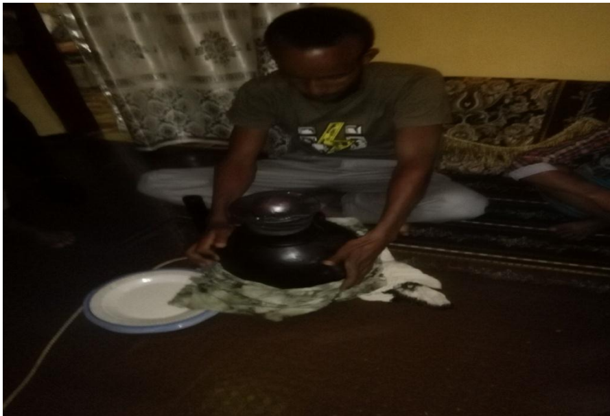
Suura.6. Guyyaa gaafa 17/10/11Sirna qulfoo keessatti yeroo obboleessi Immeete buqqee burqumsaa banu kaase

Kunis kan agarsiisu sirna kana irratti nyaanni aadaa hawaasa sana biratti beekamu kan dhiyaatuufi kabajaaf maatiin intalaa illee irratti argamuun kandabarsanidha.