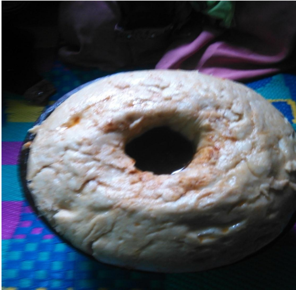
Suura.8. Gaafa guyyaa 21/10/11 sirna qulfoo Abduu Aliyyii kan gaafa qayya geessaa qophaa'e irratti argamuun qorataan kaase.

Kanaaf namoonni hunduu gara laga miiccaa deemu. Warreen mana qulfoo keessa turanii gara miiccaa deemaan yeroo isaan deebi'an marqi qophaa'ee isaan eega. Isaanis hanga ooshaan ga'uutti marqa kana nyaatu.