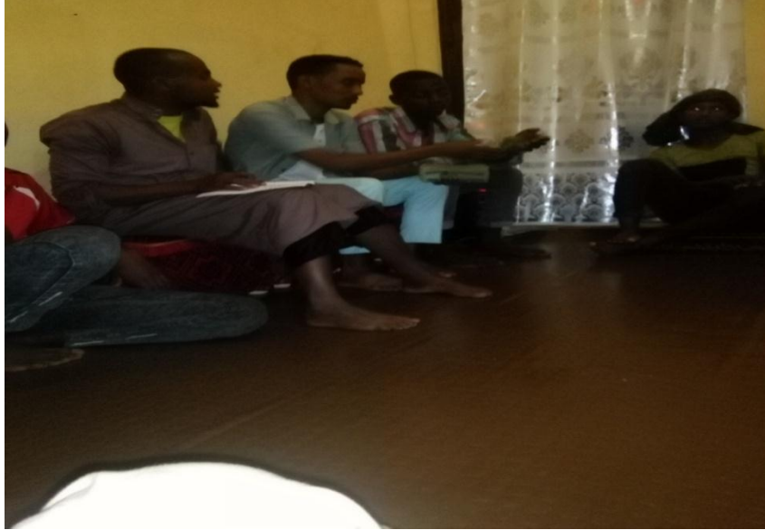
Suura.2.Gaafa guyyaa 10/10/11 Sirna qulfoo Ahmad Mahammud irratti argamuun kanin kaafadhe