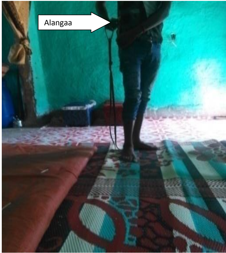
Suura.13. Alangaa kan gaafa guyyaa 21/10/11tti qorataan yeroo aggafaariin qabatee dhaabbatu kaase