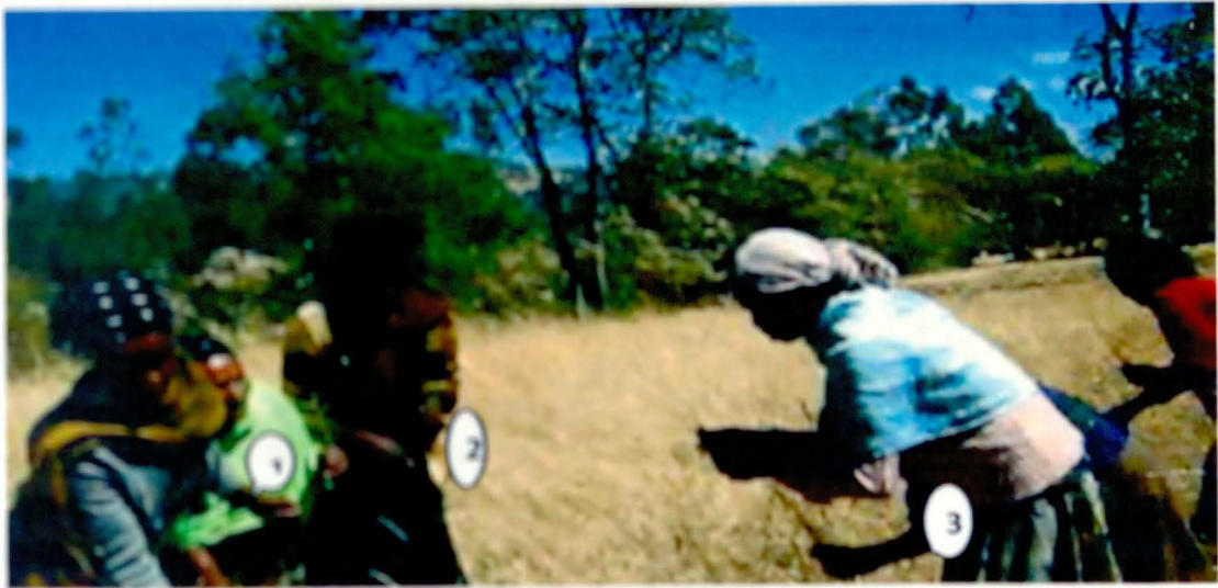
1. መረጠች ስዩም 2. ብርቱካን ሰለጥን 3. ሙሉ ኪሊሚሶ እና ሌሎችም ስንደዶ እየለተሙ ማክሰኞ የካቲት 6/2004.