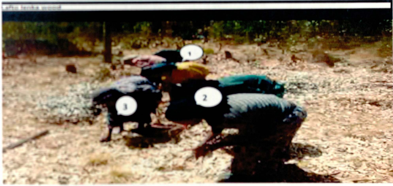
1. ፈላላ ለግን 2. እምሪያ አብይላ 3. ራውዳ ወረቲቾ እና ሌሎችም ለማገዶ የሚሆንን እንጨት እየለተሙ ፅሁፍ 18/06/2004.