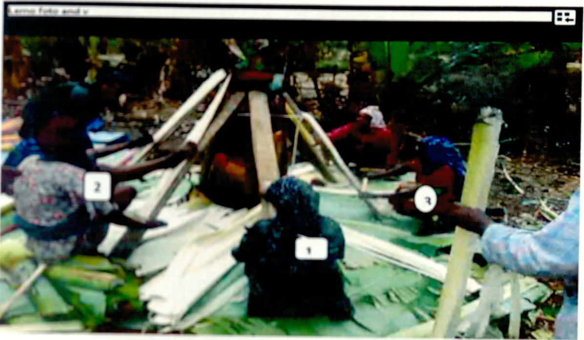
1.አላግብቱ ከበደ 2 ሉምብሊ ኢርሲዶ 3. አንሾ ፉቲ እና ሌሎችም እንስት እየፋቁ የወደፊት ምግባቸውን እያዘጋጁ (ግዝሰኛ 20/06/2004)

በእንስት መፋት አወድ በሀድያ የገጠሩ ክፍል በሰሜን በሚገኘው ሌም ወረዳ በ አሺ ቀበሌ ነዋሪ በሆኑት በወ/ር አላግብቱ ከበደ መኖሪያ ገቢ ውስጥ ሲሆን የእንስት ፍቀት የተካሄደው ከተለያዩ መንገዶች በመጡ ስምንት ሴቶች ነው።