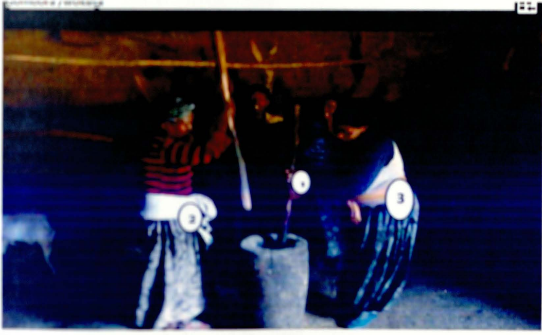
1.ዘቧ ደለቦ 2. አየለች ዱብ ለላ 3. ትእግስት ኦርፕ እና ሌላዋ ለገንፎ የሚሆን ገብስ እየወተጠ ትግላዊ የካቲት 29/2004.