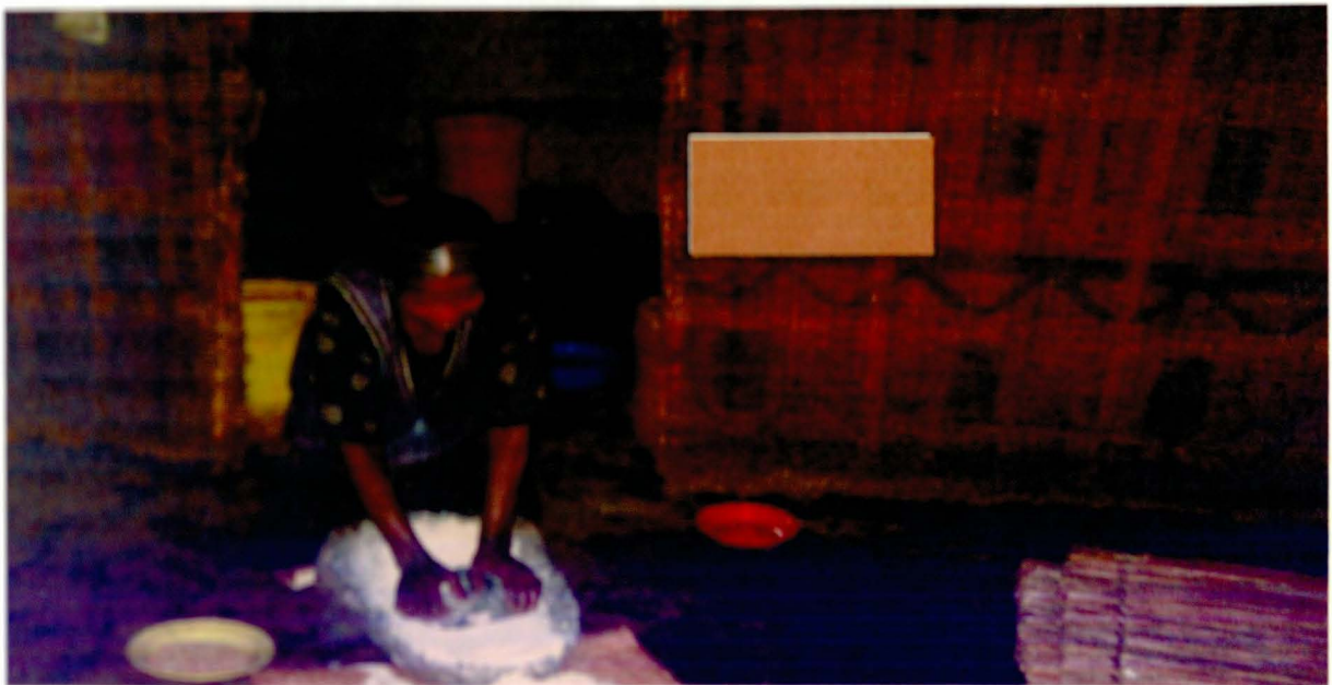
1. ወ/ሮ ሲቦ አርመኮ ለምገባነት የሚሆነውን ገብስ እየፈጨ የካቲት 5/2004

ከመረጃ አተገባዥ መካከል ወ/ሮ ሲቦ አርመኮ በዚህ ወረዳ ዘመናዊ የእህል መፍጫ ቢኖርም በእጃቸው የመፍጨት ልግዳን አልተውነውም። ምክንያቱም በዘመናዊ ወፍራም የተፈጨ እህል አይባረክትም፣ እህሉ ጣዕም ያጣል ። በዘመናዊ ወፍራም በተፈጨ ዱቄት የሚጋገረው