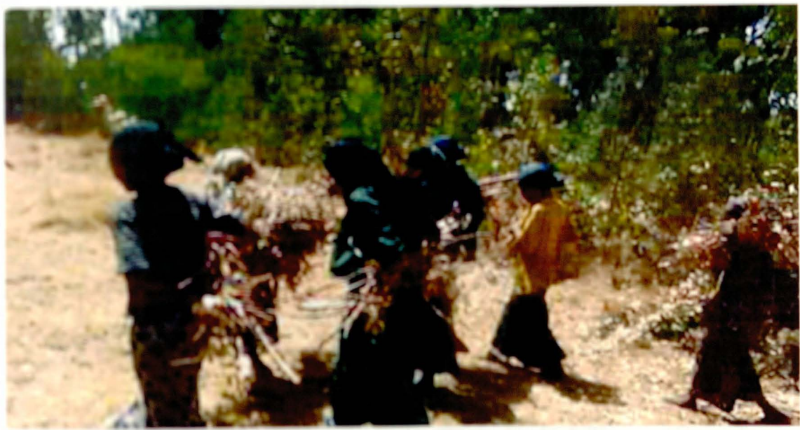
የለተመትን እንጨትና ጭራሮ ተሽከመው እየዘረኑ ወደ ቤታቸው ሲሂዱ