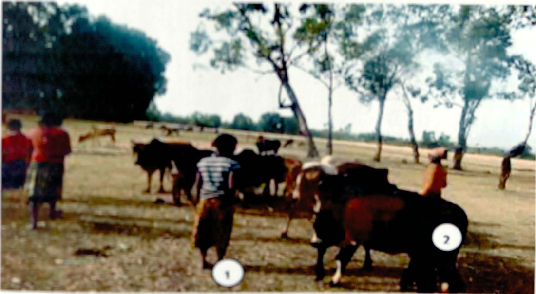
1. ጹባለች ፍቅሬ ፣ ከጠባባባ ጋራ ስራ ለሁለት ከብቶችን ወደቤታቸው ሲመልሷቸው 29/06/2004.