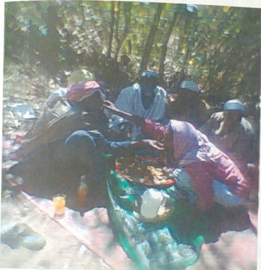
ሙስሊሞች ከእርቅ በኋላ ሲጎራረሱ