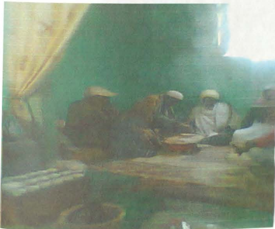
ሙስሊሞች ከእርቅ በኋላ በቤት ውስጥ የሚያደርጉት የቡና ስነ-ሥርዓት