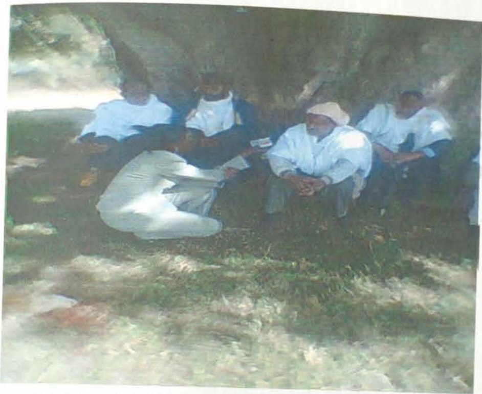
በኦርቶዶክሶች በእርቅ ላይ ቃለመጠይቅ ሲደረግ