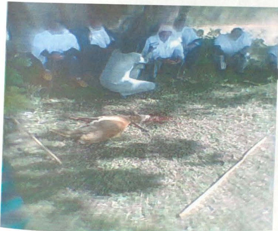
በኦርቶዶክሶች ለደም ማድረቂያ የታረደ በግ