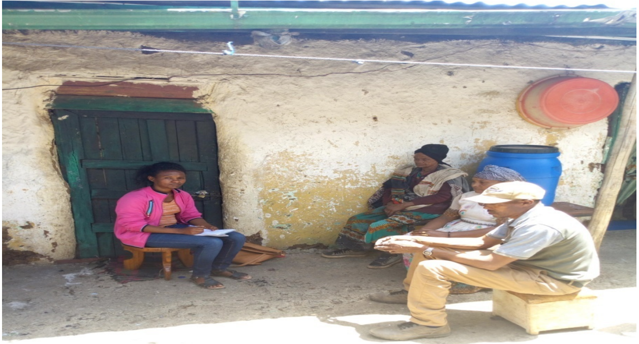
Figure 16: Dawwannaafiaffaaffii obboo Bottuu Taaddasaa waliin taasifame

jirani. Lafa keenya saamaatii jiru, amma asuma keessatti lafa naannoo kanaa duwwaa jiru irratti illee nugurmeessaatii hojjenneet nyaana jennee yoo gaafannu, hiyyeessi dubbatee hin dhageessifatu, nuun namni nu dhagahu hin jiru; sooressatu fagoo irraa dhufee irratti dahachuu barbaada malee nuun lafuma keenya qe'ee keenya ture sana irrattillee hojjennee akka hin nyaanneirraa nu ar'u.