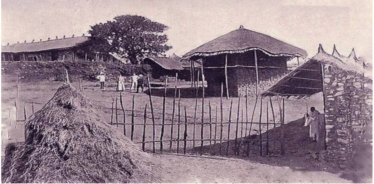
Fakkii 4: Naannoo Tulluu Daalattii / Daalattii/ ykn Arat Kiiloo bara 1907tti

6. Tulluu Daalattii – Bakki kun iddoo amma Masaraan Mootummaa Ministira Muummee, Mana amantaa Gabreelii, buufata Poolisii 6ffaafi mana amantaa Bahiitaad kan dabalatudha.