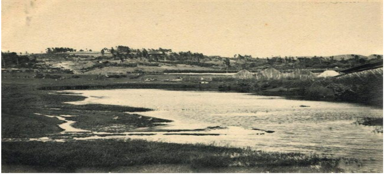
Fakkii 3: Naannoo Hora Finfinnee bara 1892 (The Hot Spring now named Filwuha in 1892)