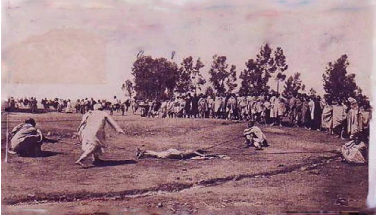
Fakkii9: Adabbii Oromoota Irraan Gahaa Turame – 1890