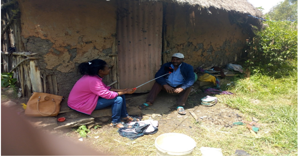
Fakkii 20: Dawwannaafi Afgaaffii Obboo Addisuu Nugusuu waliin taasifame

Ittuma fufuunis, Jireenyi duri malee amma jireenya maaltu jira, Dur yeroo qe'ee keenya irra jirru qe'ee bal'aa keessa lafa bal'insa qabu qotannee jiraanna, horii horsiifanna, yeroo sana qe'ee hundi guute; qe'ee guutuu keessa jiraanna ture. Erguma Aqaaqii Maaddinii irraa as gallee illee akka achii ta'uu baatus lafa muraasa wan qbnuu horii ni horsiifanna lafa irraan gadee gamoon irra jiru kanarra baargamoo qabna turre. yoo qarshii rakkannee baargamoodhuma sanrraa jigsinee falaxnee yoo gabaa baasne waan barbaanne ittiin bitanneet galla amma maltu jira lafa qabnu hunda kaffaltii beenyaa tokko malee nurra fudhatani kunoo amma gamootu irra dhaabata, waanuma manallee ittiin suphannu dhanbeet mana akkasii keessatti dhimpuun rakkanna; Rakkina guddaa keessa jirra.