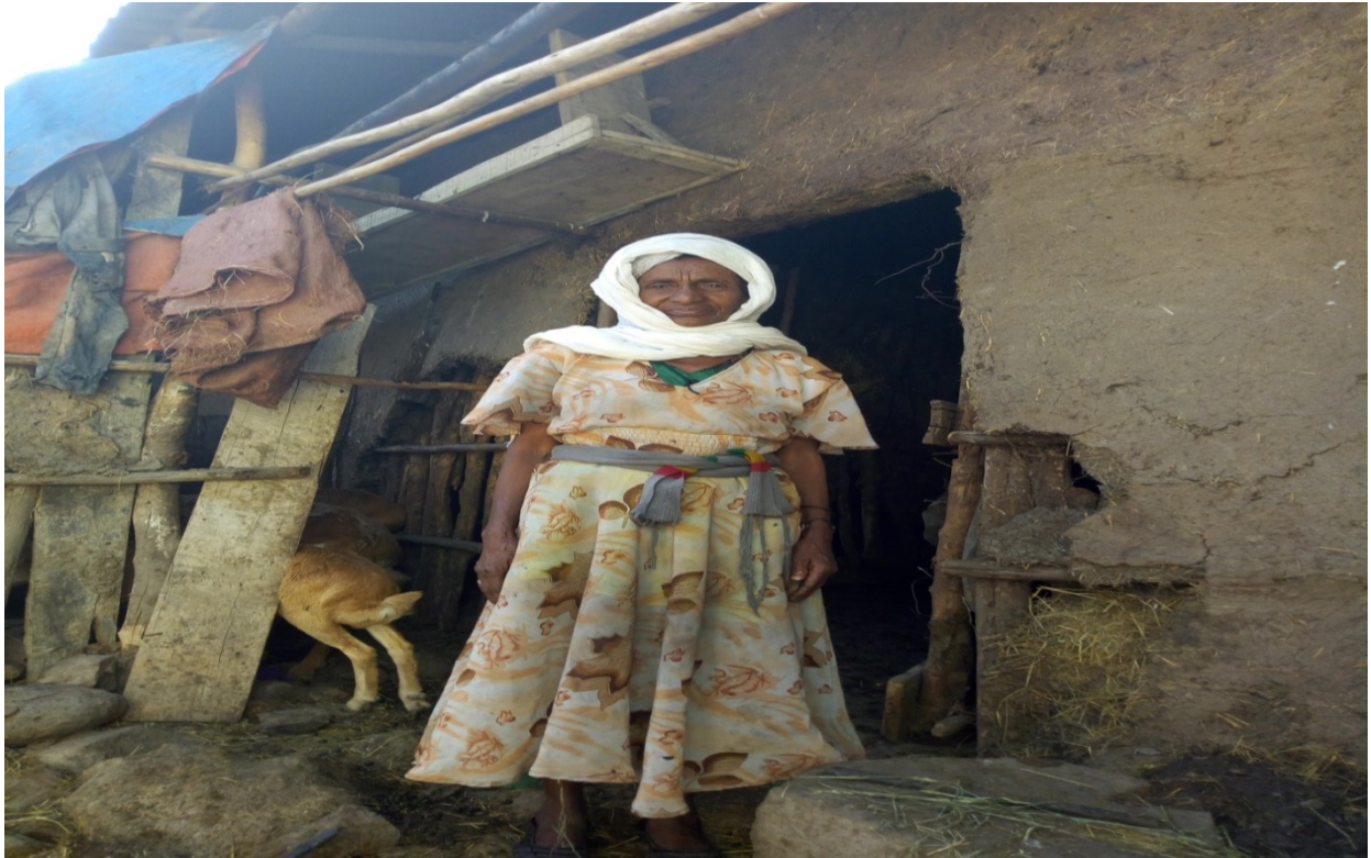
Figure 17: Dawwannaafi afgaffii Aadde Laaqechi Sabbooqaa

durii asuma gubbaa sana ture, otoo lafti keenya nurraa hin fudhatamiin dura lafa qonnaa bal'aa qabna turre, yeroo sana qotannee midhaan galfannee akka barbaannetti nyaannee hamma barbaanu irraa gugurannee, horiin guuttee ammeessa elmannee aannan keenya gurguree, dhadhaa keenya gurguree waan barbaannu bitannee jiranna turre. Amma maaltu jira amma waan haxaawwannuyyuu dhabne. Jireenya ammaa kana uu, uuu, uuu... kuni jireenya maaliiti, lafa nurraa fudhatanii gamoo itti ijaarani, qarshii isaan naaf kennaniin mana kana ijaarradhee fixe amma dumbulloo tokko hin qabu, qonni hafe loon bakka oolchinuufi bakka bulchinu dhabnee gurguree fixne. Kunoo akkuma agartu kana hoolota hiineet oolchina malee bakka itti gadi baasnu hin qabnu, [ hoolota walitti qabamanii gola dhiphoo balbala isaanii dura jirtu keessa dhaabatan harkaan na agarsiisaa dubbatu.] Amma ijoollee kootu hojii humnaa hojjetee nagargaara. Yeroon rakkadhu immoo hoolotuma kana keessaa gurguree qusadheen ittiin buna bitadha. Jaarsi kiyya waardiyyaadha; fooqii kana eega miindaan inni argatu xiqqoodha. Nuti ijoollee afur qabna qe'ee akkamii keessaa nu baasanii lafa bal'aa nurraa fudhatanii ijoolleen koos homaa hin arganne hundi keenya bakkuma tokkotti bakka kanatti 'ashagamnee' jirra. Maalan sitti hima jiruun ammaa jireenya miti.