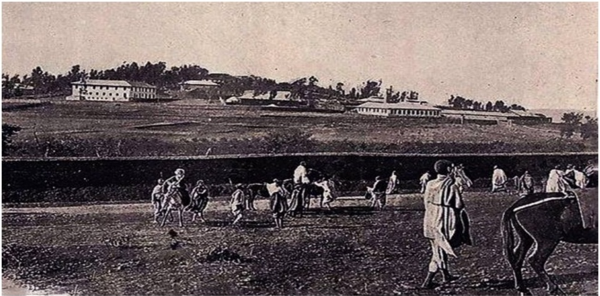
Fakkii 5: Naannoo Daalattii Hundeeffama magalaatiin booda (now the Arat Kilo Palace)