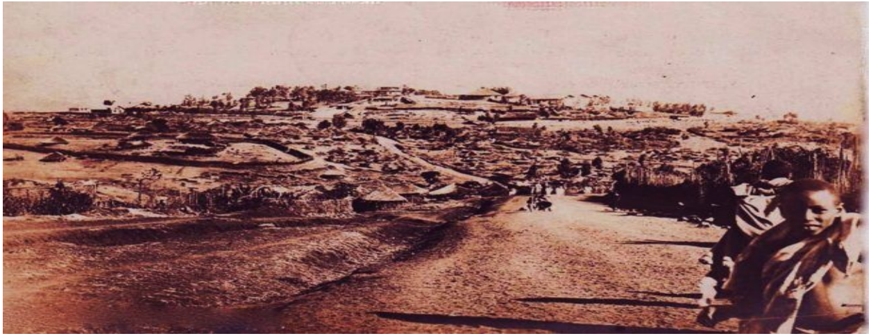
Fakkii 6: Naannoo Birbirsa bara 1897tti (named Arada or Piazza in 1897)

14. Birbirsa Gooroo – Bakki dur Birbirsa Yaa’ii Gooroo jedhamuun beekamu; bakka amma Piyaassaafi naannoo Araadaa Goorgiis bakka Charchar Godaanaa jedhamuun waamamu yoo ta’u, lafa yaa’iin Gullallee itti taa’amu ture. Lafa kaloofi bosonaas ture. Bara jalqaba Minilikiifi gargaartonna isaa Gaara Xuuxxoo/ Dildila/ irraa gadi bu’anii naannoo Hora Finfinnee qabatan sanattis loon qalmaaf qophaahan bakka kana tursiifatu turani; lafa gabaas akka ture himama.