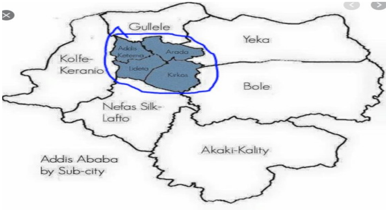
Fakkii 1: Kaartaa daangaa magaalaa Finfinnee yeroo dura hundoofteefi erga babal'attee