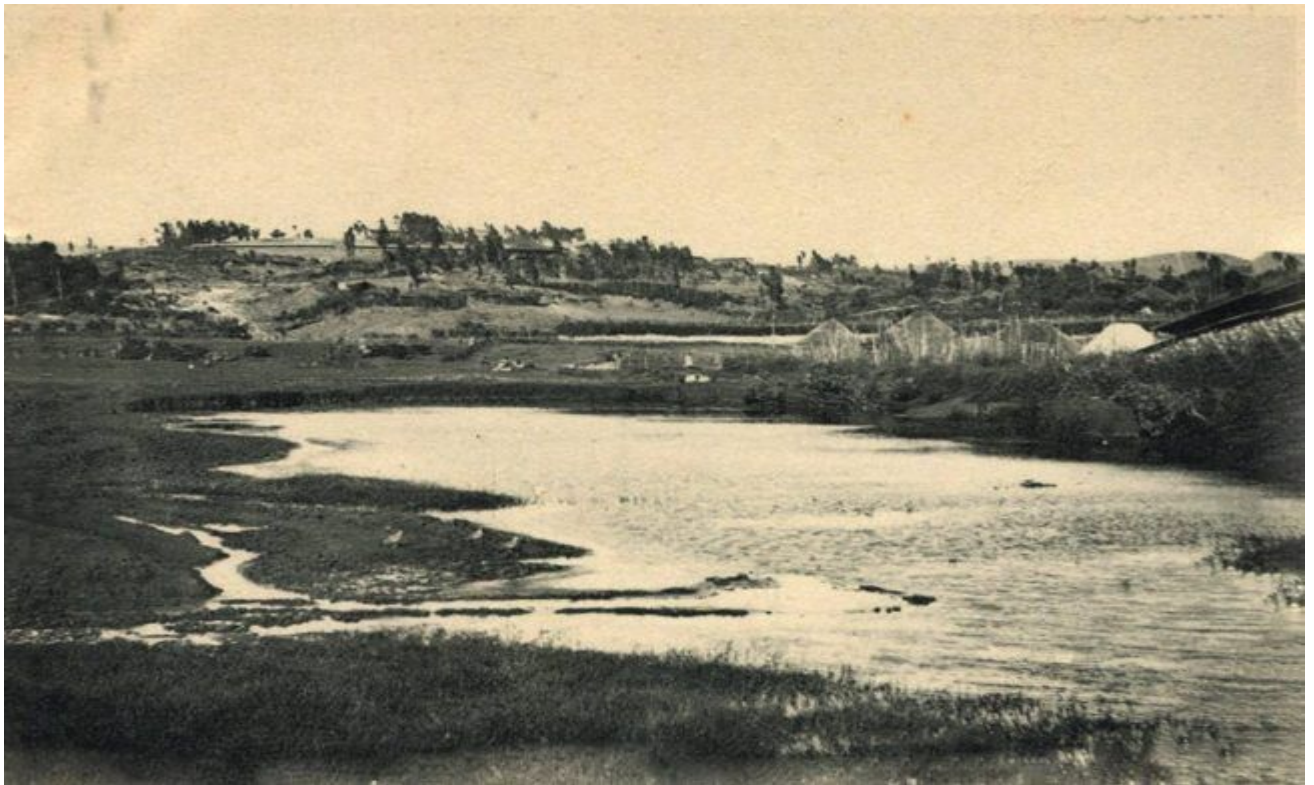
Fakkii 2: Naannoo Hora Finfinnee bara 1892 (The Hot Spring now named Filwuha in 1892) Maddi Toora Marsariitii

Horri kun bakka walgeettiifi qabiyyee ilmaan Tuulamaati.