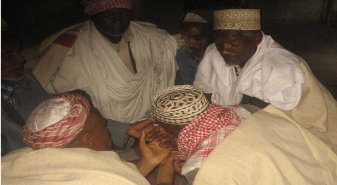
በእርቁ ስርዓት ላይ የሚች አባት ከገዳይ እጅ ሲበሉ