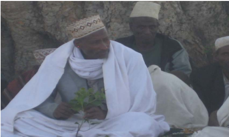
ፎቶ 3: የሃላባ አገቴ መሪ «ወማ»