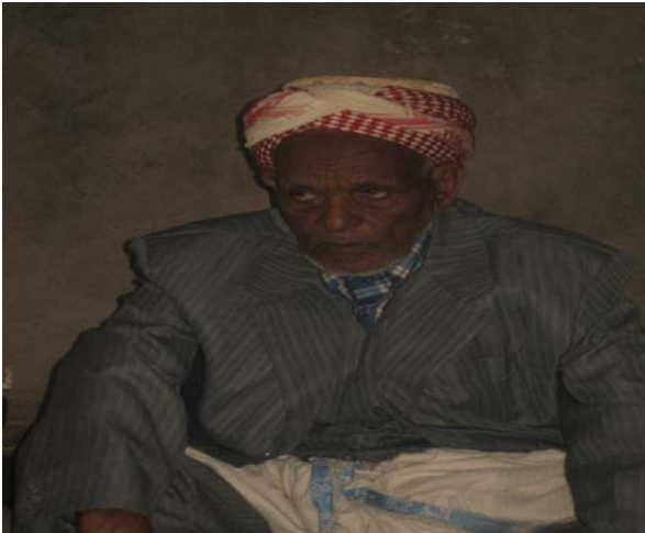
እማም ሂርጳ ዎጩሶ የሴራ ሽማግሌ