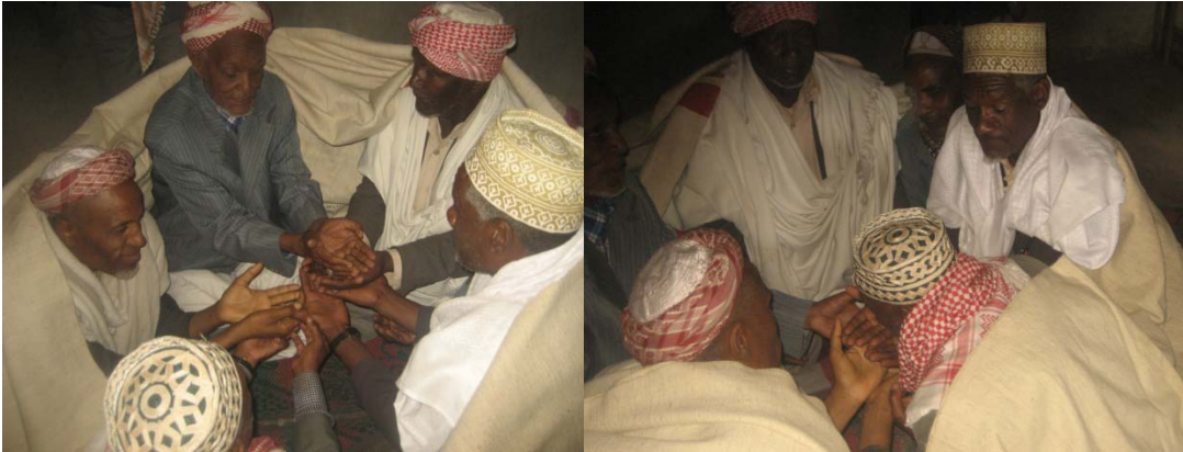
ፎቶ ፡4 የሚችና የገዳይ ቤተሰቦች እርቅ ሰነ ስርዓት ላይ ገዳይ ከሚች አባት እጅ ሲበላ የሚያመለክት

እንደሚኖሩ የሚያሳይ አንድምታ አለው። የታረደውም እንስሳ ሥጋ በክትፎ መልክ ይዘጋጅና ወይም ደግሞ ከገብስ የሚሰራ እንደ ጭኮ ያለ ባህላዊ ምግብ ይቀርብና በገዳይ መዳፍ ላይ በማኖር ቀድሞ ለሚችሉ ቤተሰብ ተወካይ ከመዳፉ እንደያቀምስ ይደርጋል። ይህም ሥርዓት ከዚህ በኋላ ሁለቱም ቤተሰብ ከቂም በቀል ነፃ መሆናቸውንና ዕርቅና ሰላም መውረዱን ያሳያል(እማም ሂርጳ ፣ጥር ፣30፣2006 ዓ.ም. ፣ስክርብ ፣40)።