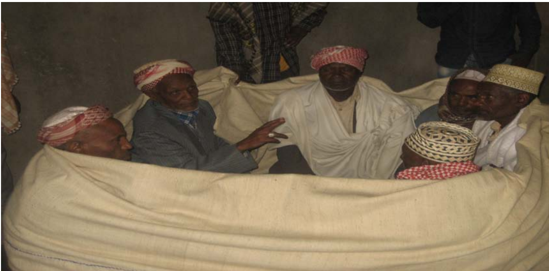
በሀላባ ኦገቱ ባህል ለጉዳ እርቅ ስርዓት የተዘጋጁ የታራቂዎቹ አካላት