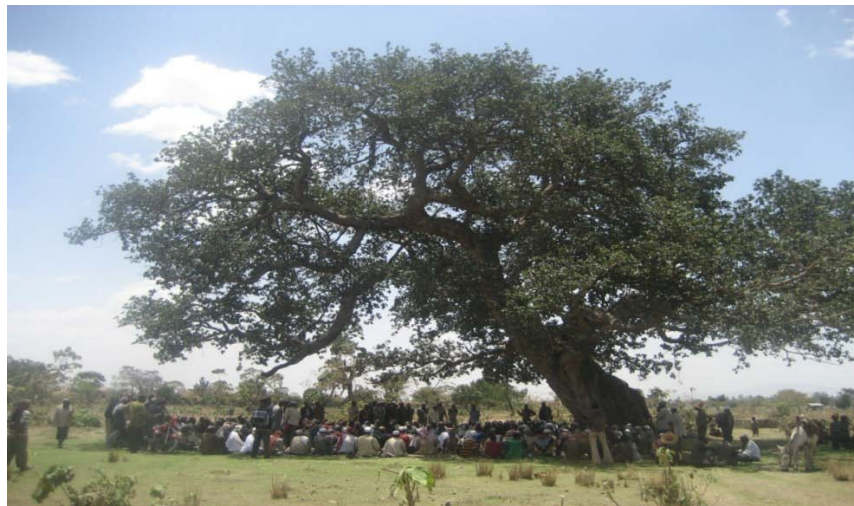
ፎቶ .1 የሀላባ ኦጋቴ ስብሰባ

ኦጋቴ የአላባ ብሔረሰብ ባሕላዊ ሸንጎ ሲሆን በባሕሉ መሠረት በአብዛኛው ወንዶች የሚሳተፉበት ሆኖ በተወሰነ ጊዜ ወይም አስቸኳይ ሁኔታ ካጋጠመም ከመደበኛ ጊዜ ውጭ እየተሰበሰቡ ስለብሄረሰቡ አጠቃላይ ጉዳዮች ላይ በመወያየት ውሳኔ የሚተላልፍበት ባህላዊ ተቁዋም ነው። ስብሰባው የሚካሄድበት ቦታ ቋሚ አይደለም። በአብዛኛው የሚካሄደው በየአስራአምስት ቀኑ አካባቢን /ቦታን/ በመቀየር በተረኛው ቀበሌ ሊሆን ይችላል። ኦጋቴ የሚሰበሰብበት ቀበሌ ሰዎች የጥላውን ስር የማጽዳት፣ ወማው የሚያርፍበትን ምንጣፍ የማንጠፍ፣ ለተሰብሳቢዎች የሚያስፈልገውን ወጪና መስተንግዶ የመሸፈን ሃላፊነት አለባቸው። ባህላዊ የፍትህ መፍቻው ስርዓት (አገቴ) የሚካሄደው አካባቢን /ቦታን/ በመቀየር ቢሆንም የመሰብሰቢያ አውዱ በትልቅ ዋርካ ጥላ ስር ነው(አቶ ሀቢብ ፣የካቲት 2006 ዓ.ም. ስክርብ ፣43)።