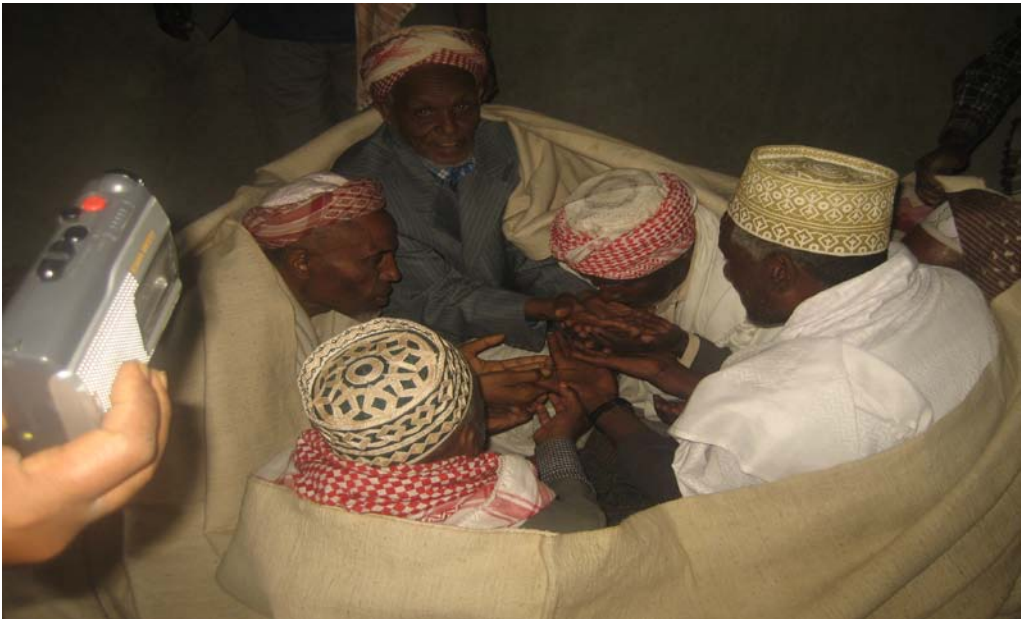
በእርቁ ስርዓት ላይ የገዳይ አባት ከሚች አባት እጅ ሲበሉ