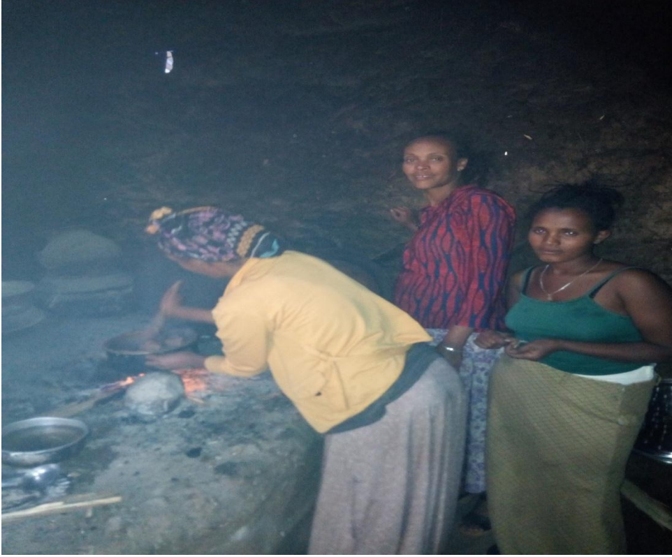
Suuraa (15/08/2011) kaafame. Yeroo marqaan marqamu

Qaama deessuu sanaas erga dhiqanii booda dubartoota ollaa hunda waamanii marqaa nyaachuutti ce’u. Marqaan dhihaatu gosa lama kan midhaan gosa gara garaarraa qophaa’eefi marqaa xaafii diimaati. Midhaan gosa garagaraarraa inni qophaa’u faayidaa hedduu qaba jedhamee amanama jedhu. Midhaan inni irraa qophaa’us: qamadii, garbuu, ajjaa, baaqilaa, bishingaa, boqqolloo, shumburaa, samareetaafi garbuu gurraacharraatii qophaa’a. Marqaan nyaata aadaa Oromoo yeroo sirna garagaraa dhihaatu akka ta’es beekkamaadha. Ittoon marqaa kanaammoo baaduu qimxoo (furdaa)fi dhadhaan mi’eessituun adda addaa qocqocaan baaduu furdaatti dabalamee, ‘mimmixa’ dhadhaa baqetti godhaniit haalan qophaa’a. Dubartoonni garee gareen ta’uun marqaa qophaa’e kana nyaatu.