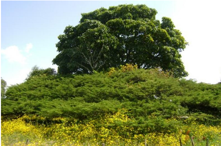
Laaftoo seenaa (Garbaa) Aadaafi tuurizimii aanicharra (12/09/2011)

Ardaan jilaa Goodaa Qunnii Ulaa abbaa Daadhiitti kan argamuus iddoo hawata tuurizimii isabiraati