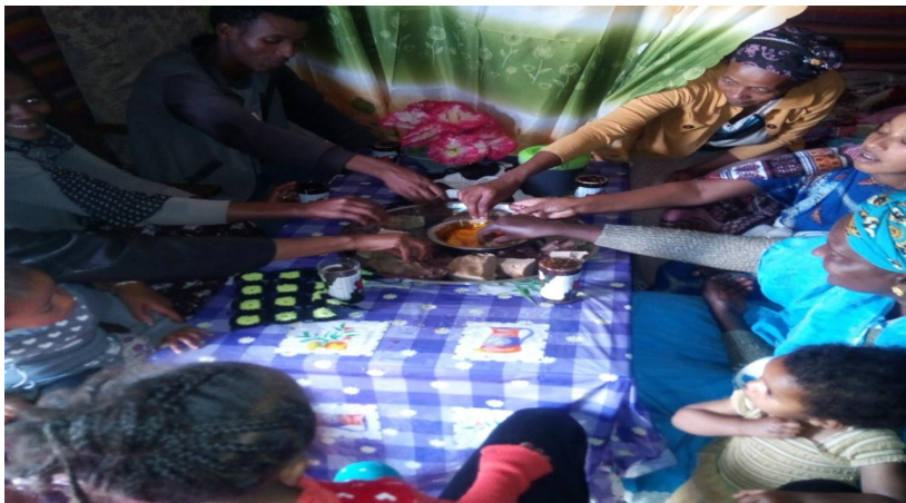
Suuraa (15/08/2011) yeroo marqaan nyaatamu kaafame