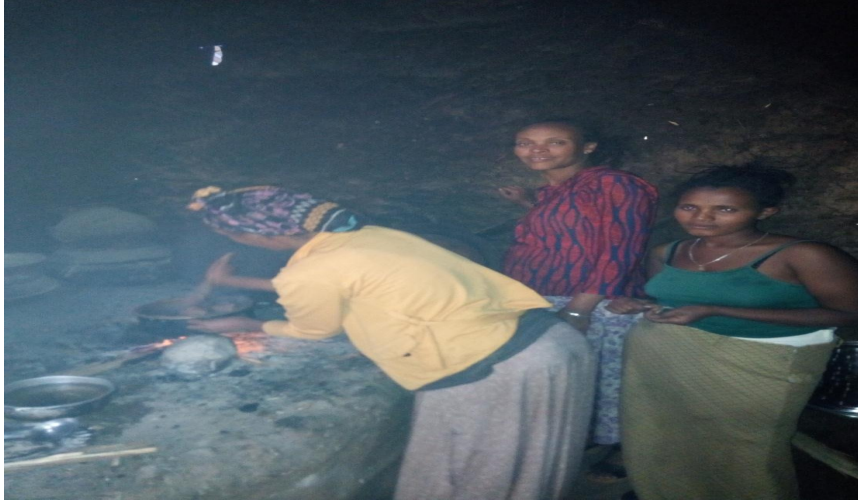
Suuraa yeroo marqaan sirna shanan deessumaarqamu (15/08/2011) kaafame