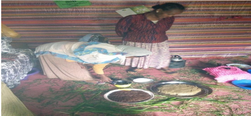
Suuraa (15/08/2011) maarqaan nyaataaf yeroo qophaau kaafame