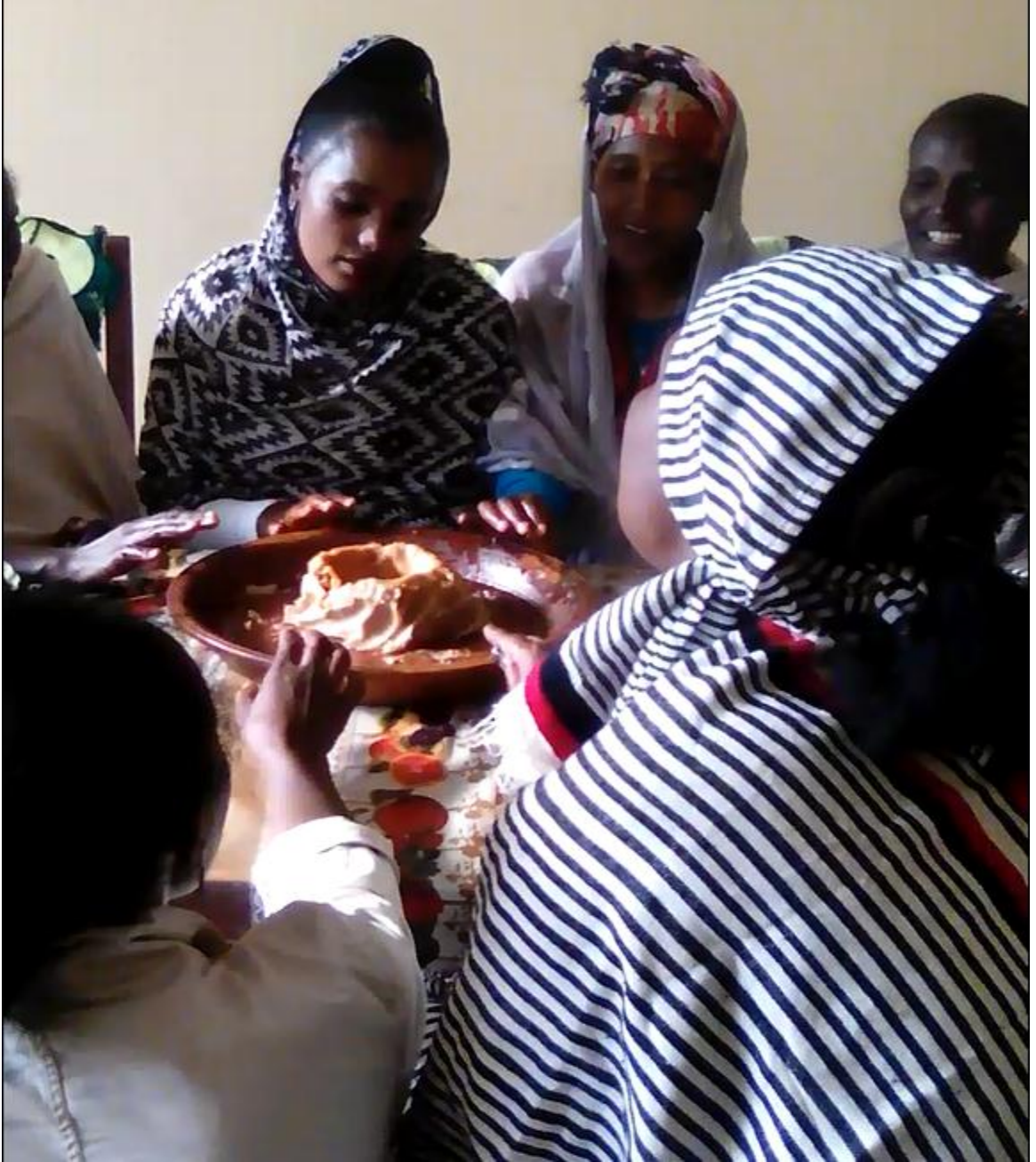
Suura 1. Guyyaa nafa dhiqaa deessuu (23/06/2011) ganda Incinniitti, hawaasa gandichaattiin.