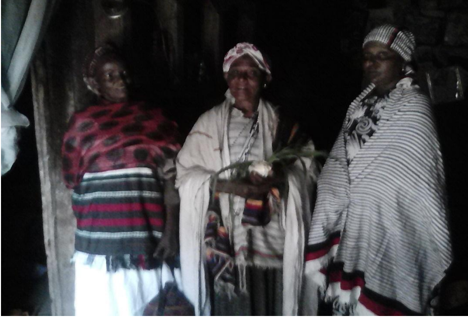
Suuraa 3: kabajan ayyaana loonii Ganda Bishaan Diimootti madda kana daawwwadheera.

Ateetiyyoo yaa ateetiyyoo Ateetiyyoo yaa haadha loonii Halaalatti naa bahii Si waammadhu naa nahii Loon gallaan galte yaa aayyoo