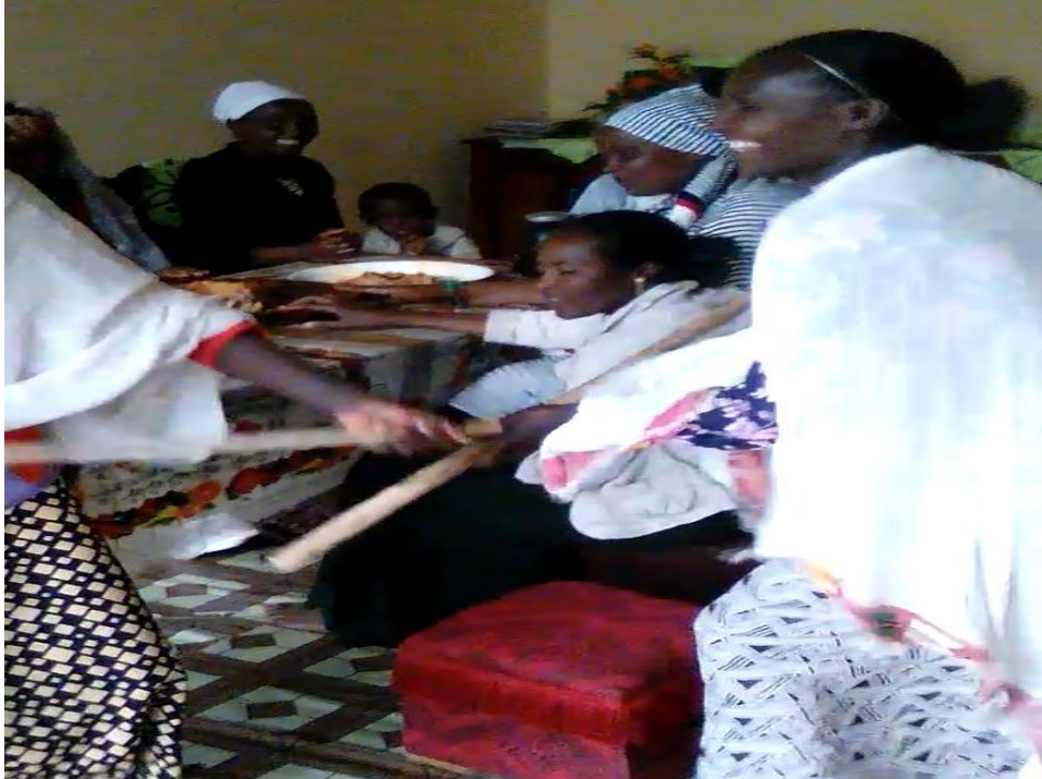
Suuraa 2: Dubartoota hoobisheefi coorishee sirban/fdaarsan, ganda Incinnii

Gareen hoboofi gareen cooraa hiikaan isaanii: hoboo jechuun kanneen guura tokko ta’an yookiin qomoo firummaa warra qaban, hidda latiinsaan kan wal ga’an yoo ta’an, coora jechuun ammoo guura garee kan biraan tokko kan ta’an yoo ta’u, garee hoboof ammoo warra alagaa ta’an ta’uu agarsiisa. Haaluma kanaan haadhooliin dabaree dabareen wal arrabsaa dalagu. Yookiin wal qeequ. Arrabsoon kun garuu akka aadaatti wal gorsuufi wal barsiissuuf malee kan lola dhugaa miti. Faaruun kunis akka armaan gadiitti dhiyaata.