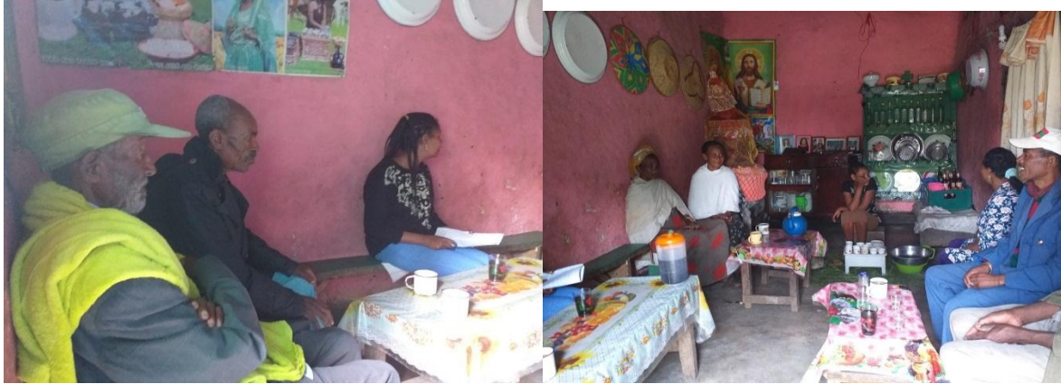
Suuraa 4: daboo irratti haadha manaa faarsan, ganda Reejjii Mokodaati hawaasa gandichaatiin

Noor yaa buddeena..... Noor yaa buddeena Buddeenaaf waaqa saganna Noor yaa buddeena Buddeen yaa warqiikoo..... Noor yaa buddeena Farsoo yaa xajjiikoo.....Noor yaa buddeena Sumaaf lafa deema lubbuunkoo..... Noor yaa buddeena buddeenaaf