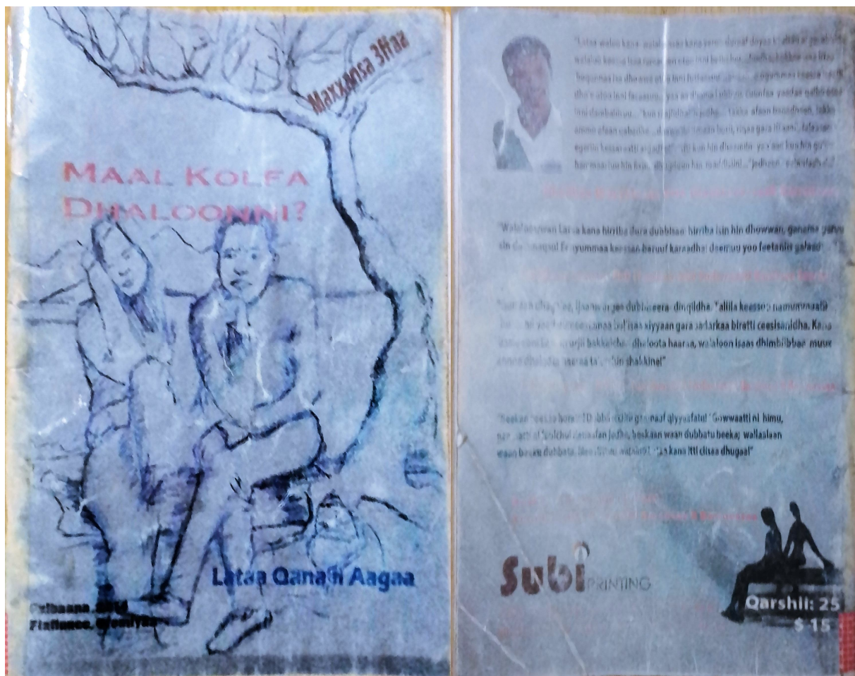
Fakkii 2: Kitaaba “ Maal Kolfa Dhaloonni? ” uwwisa fuulduraafi duubaa agarsiisu

Kitaabni walaloo ‘ Maal Kolfa Dhaloonni? ’ waloo Lataa Qana’ii Aagaatiin bara 2014 akka lakkoofsa Awurooppaatti kan maxxanfamedha. Kitaabni kunis, maxxansa 3ffaa yoo ta’u, matadureewwan walaloo adda addaa 70 ta’aniifi fuula 75 kan qabudha. Hiikni mataduree guddicha kitaaba kanaa yommuu ibsamu, dhaloonni sodaafi yaaddoon guutamee waan jiruuf, wanti nama gammachiisu hinjiru. Kana jechuun dhaloonni kolfoo jibbee osoo hintaane wanti kolfan akka hinjirre fakkiin qola kitaabichaa fuulduraan jiru kan ragaa bahudha. Kitaabni kunis, walaloo hedduu kan ergaa garaagaraa gama siyaasaatiin, gama hawaasummaatiin, gama diinagdeetiin, ilaalchaan, falaasamaan, duudhaa, afaan, dhimmoota hawaasa keessatti calaqqisiifaman bu’uura godhachuun kan haala jiruufi jireenyaa uummata Oromoo barsiisuufi ergaa bal’aa dabarsuu danda’u ofkeessatti hammatee xiinxalamuun qaaceffameera.