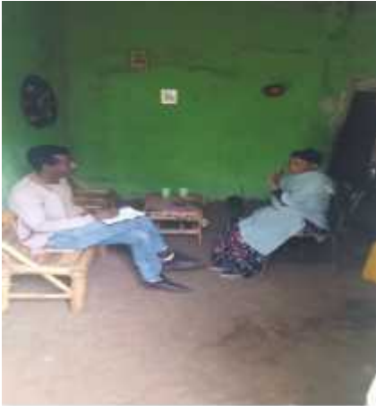
Suuraa 4: Afgaaffii Ogeettii Qoricha Simbiraa