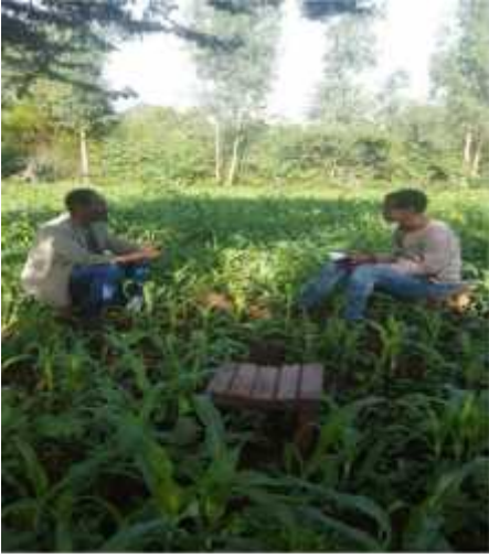
Suuraa 3: Afgaaffii Ogeessa Qoricha Ijaa