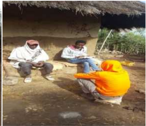
Suuraa2:Afgaaffiifi daawwanna qoricha dhiqaa