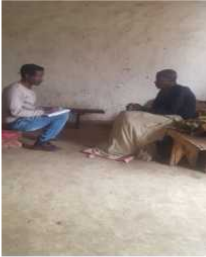
Suuraa 1: Afgaaffii nama qoricha

Suuraawwan Ragaaleen Qorannichaa Daaawwannaafi Afgaaffiin Funaannaman Agarsiisan