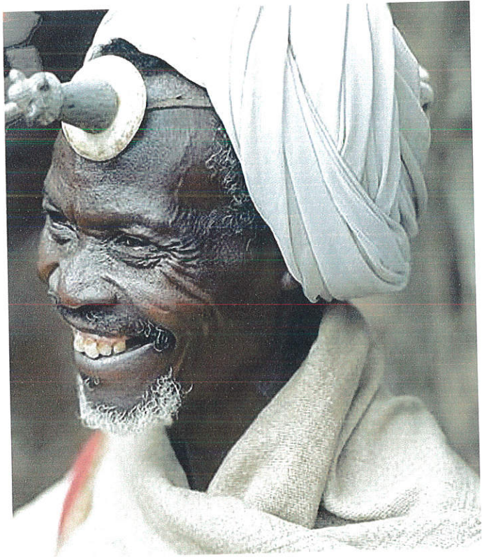
ምስል 11: ሃላሻን ያደረጉ የጎሳ መሪ

ከነዚህ ባህላዊ ጌጦች በተጨማሪ በኮንሶ ማህበረሰብ ዘንድ ማህበራዊ ደረጃን ከሚጠቁሙ ጌጦች መካከል አንዱ ነው። “ሃላሻ”። “ሃላሻ” ግንባር ላይ የሚደረግ የጌጥ አይነት ነው። ይህ ጌጥ በጎሳ መሪው ብቻ የሚደረግ እና በተለይ የተለያዩ መንፈሳዊ ጉዳዮች በሚፈጸሙበት ጊዜ የሚደረግ ሲሆን ይህም በሚፈጸመው ስነስርዓት ላይ መሪነቱን የሚያሳይ ነው። ከዚህ በተጨማሪም አድራጊው በማህበረሰቡ ውስጥ ያለውን ክፍ ያለ የስልጣን ደረጃ የሚያመለክት ነው። በምዕራፍ አራት ላይ እንደተገለጸው ሃላሻ ከወንድ ልጅ የመራቢያ አካል ጋር የተያያዘና ይህም የአድራጊውን ሃያልነት ጀግንነት ለመግለፅ የሚያገለግል መሆኑን መገንዘብ ይቻላል።