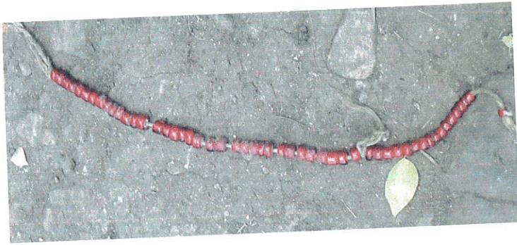
ምስል 6: ያጋታቲማ