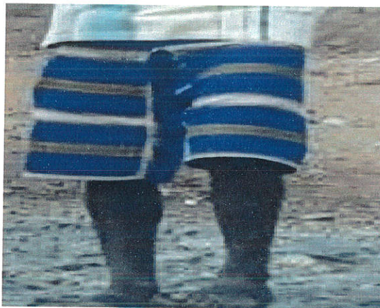
ምስል 3: ኮንፋ

ኮንፋ ከጥጥ ወይም ከክር የሚሰራ የልብስ አይነት ነው። ይህ የወንዶች ልብስ በአብዛኛው በሰማያዊ ክር የሚሰራ እና ከጉልበት ከፍ የሚል የልብስ አይነት ነው። አቶ ገልገሎ ሰንሳጎ እንደሚሉት “ወጣቶች የሚያደርጉት ኮንፍ መሃሉ ላይ ሻሎታ የሚባል ነገር አለ ከጥጥ የሚሰራ እሱ ይገባበታል”(ሚያዚያ 26፣2003)። ይህም እንደባትሌት የሚገባ ጨርቅ ነው።