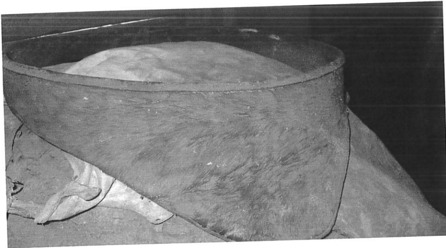
ምስል 2: ኮራ