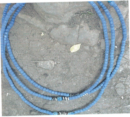
ምስል 9: ጭርዋና

ጭርዋና በከንሶ ማህበረሰብ ካሉ የአንገት ጌጥ ውስጥ በጣም ውድ ከሚባሉት የሚመደብ ነው። ይህ ጌጥ ከውሃ ሰማያዊ ደቃዎችና ችጉርጉር ከሆኑ ደቃዎች የሚዘጋጅ ነው። ልክ እንደሌሎች የአንገት ጌጦች ሁሉ የዚህ የአንገት ጌጥ ደቃዎችም በሽቦ ወይም ሽቦ መሰል ነገር በማያያዝ የሚሰራ ሲሆን ሶስት ድርብ ተደርጎ ይደረጋል። ይህን የአንገት ጌጥ የሚያደርጉት የጎሳ መሪ ሚስቶች ወይም ደግሞ ባለፀጋ የሆኑ ሴቶች ብቻ ናቸው። በመሆኑም ይህ ጌጥ ውበትን ከማጎናፀፉ በተጨማሪ ማህበራዊ ደረጃን አመልካችነቱ የጎላ ነው።