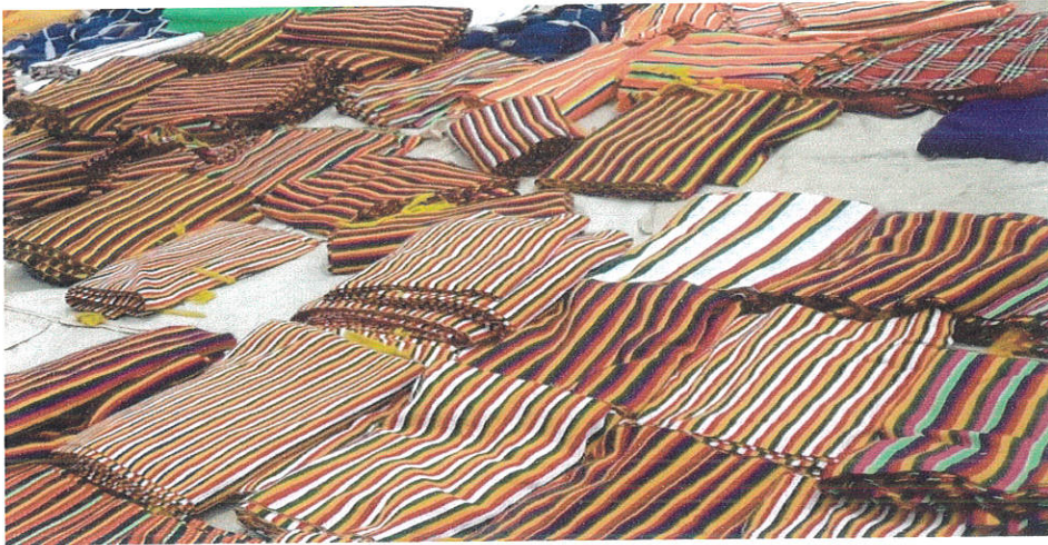
ምስል 1: ለኩዋ መስሪያነት የተዘጋጁ ከክር የተሰሩ ብትን ጨርቆች

ደምቆ ለመታየት ሲሆን በሌላ በኩል ደግሞ በቀላሉ ለቆሻሻ የማይጋለጥ በመሆኑ ለስራ አመቺ ነው።