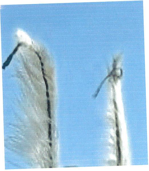
ምስል 5: ፓላ

ይህ ጌጥ ከሰጎን ላባ የሚዘጋጅና ወንዶች በራሳቸው ላይ የሚደርጉት ነው። የላባው የቁጥር ብዛት (አንድ ወይም ሁለት) መሆን እንደአድራጊው ጀግንነት ይወሰናል። አድራጊው ገዳይ ከሆነ ድርቡን ሲያደርግ ሌሎች ማለትም በማህበረሰቡ ዘንድ ገዳይ የሚያስብሉ እንስሳትን ያልገደሉ ነጠላውን ያደርጋሉ። በኮንሶ ማህበረሰብ ገዳይ ለመባል የሚያበቁ እንስሳት አንበሳ፣ ጎሽ እና ዝሆን ናቸው። እነዚህ እንስሳት በአሁኑ ሰዓት በአካባቢው ባለመኖራቸው ገዳይ ለመሆን የወይጦ በረሃን አቋርጦ ለብዙ ሰዓት መጓዝ ይጠበቅባቸዋል። ይህን ተቋቁሞና አልፎ ግድያውን ጥሎ ለተመለሰ ጀግና በአካባቢው የሚደረግለት ራሱን የቻለ ዝግጅት የሚኖረው ሲሆን ለመለያው ይሆን ዘንድ ድርብ የሰጎን ላባ ወይም “ፓላ” በማድረግ ጀግንነቱን ለህዝብ ያውጅበታል። ገዳይ ለመሆን በመንገድ ላይ ያሉ ለጊዜው ግን ያልገደሉ ወንዶች ደግሞ ነጠላውን ያደርጋሉ። ይህም ወደፊት እኔም ገዳይ በመሆን ጀግንነቴን ለማሳየት በዝግጅት ላይ ነኝ የሚለውን መልዕክት የሚያስተላልፍ ነው። በመሆኑም በኮንሶ ማህበረሰብ ድርብ ፓላ ያደረገ ወንድ ገዳይ መሆኑ የሚታወቅ ሲሆን ነጠላውን ያደረገ ደግሞ ገና ያልገደለ ወደፊት ግን ገዳይ የሚሆን መሆኑን የሚያመለክት ነው።