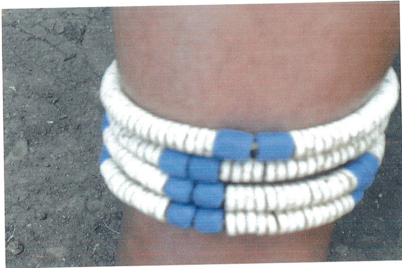
ምስል 12: ወንድና ሴት ልጆች ያሏት እናት የምታደርገው ሄሮዳ

“ስራ” ወይም “ሚኛ” የሚባለው የግንባር ጌጥ ሌላው እናትነትን የሚያመለክት ነው። ይህ ጌጥ የሚደረገው ያገቡ ሴቶች ወልደው ከአራስ ቤት ሲወጡ ሲሆን የበለጠ ለመዋብ የሚጠቀሙበት ነው። በመሆኑም ይህን አድርጋ የምትታይ ሴት በቅርቡ የተገላገለች የልጅ እናት እንደሆነች ይታወቃል።