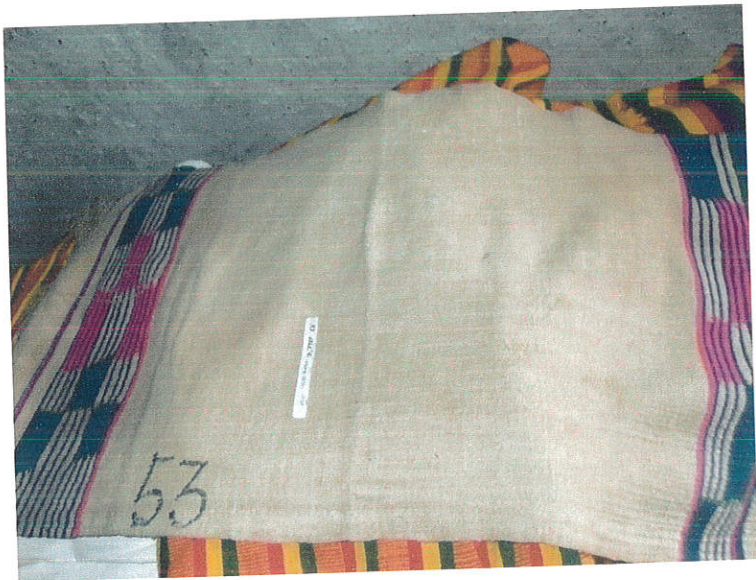
ምስል 4: ጨርፍ

ጨርፍ የሚባለው የልብስ አይነት ከጥጥ የሚሰራ ነው። ይህ ልብስ ብትን ጨርቅ ሆኖ ዙሪያ የሚያለብስ (የሚጠመጠም) እንደ ሽርጥ ያለ ነው። አቶ ኮራ ካራ ስለዚህ ልብስ ሲናገሩ “ይህ ልብስ በተለይ በዱሮ ጊዜ በወንዶች የሚደረግ በአሁኑ ሰዓት ልክ ሐመሮች እንደሚያገርጉት አይነት ነው ይህ በፊት ነበር የሚደረገው”(ሚያዚያ 26፣ 2003)። ባራቴታ ከጥጥ (ክር) የሚሰራ ሽማግሌዎች ወይም የጎሳ መሪዎች ራሳቸው ላይ የሚያደርጉት ጨርቅ ነው። ይህም የሽማግሌዎች የክብር መገለጫ ሆኖ ይወሰዳል። ከነዚህ የወንድ አልባሳት በተጨማሪ ጋቢ በማህበረሰቡ ሽማግሌዎች ይለበሳል። ጋቢ ከጥጥ እና ሃር ክር የሚሰራ ነው ። ይህን የልብስ አይነት ሽማግሌዎች በክብር ሰዓት ማለትም ለእርቅ ሲሄዱ ወይም በሌሎች ተመሳሳይ ጉዳዮች ያደርጉታል።