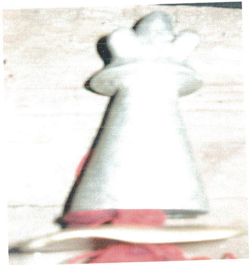
ምስል 8: ሃላሻ

ሃላሻ ከዚህ ትርጓሜው በተጨማሪ ለክብረ በዓላት ጊዜ ሲደረግ መዳረጉ የክፉ መንፈስን ሃይል የማጥፋት ሚናውን የሚያሳይ ነው። ይህም በተለይ የሃላሻው ሁለተኛ ክፍል ካለው ቀለም አንፃር ነው። ይህ ክፍል ነጭ መሆኑ የነጭ ቀለም ክፉ መንፈስን ከማባረር አንፃር ያለውን ቁርኝት ጋር የሚያያዝ በመሆኑ በክብረ በዓላት ላይ መሪው ማድረጋቸው ይህን ተግባር ለማስፈፀም የሚያገለግል ነው። (Hallpike; 150 )