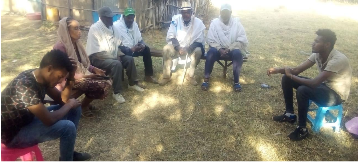
Suura 3 Yemmuu Araari Taasifamaa Jiru

araarsaniiru. Sirna araaraa xumuuruufis eebbaan saaqumsa akkuma taasisan eebbaan xumuran. kanas maanguddoonni dhaabatani, Isa hangafaa teessisanii quxusuu jilba dhangachiisuun, hangafni barruu quxusuutti tuttufee akka garaa itti hiikkatuuf bifa kanaan eebbisaniiiru. Haala kanas suuraa armaan gadittiin hubatamuu danda'a.