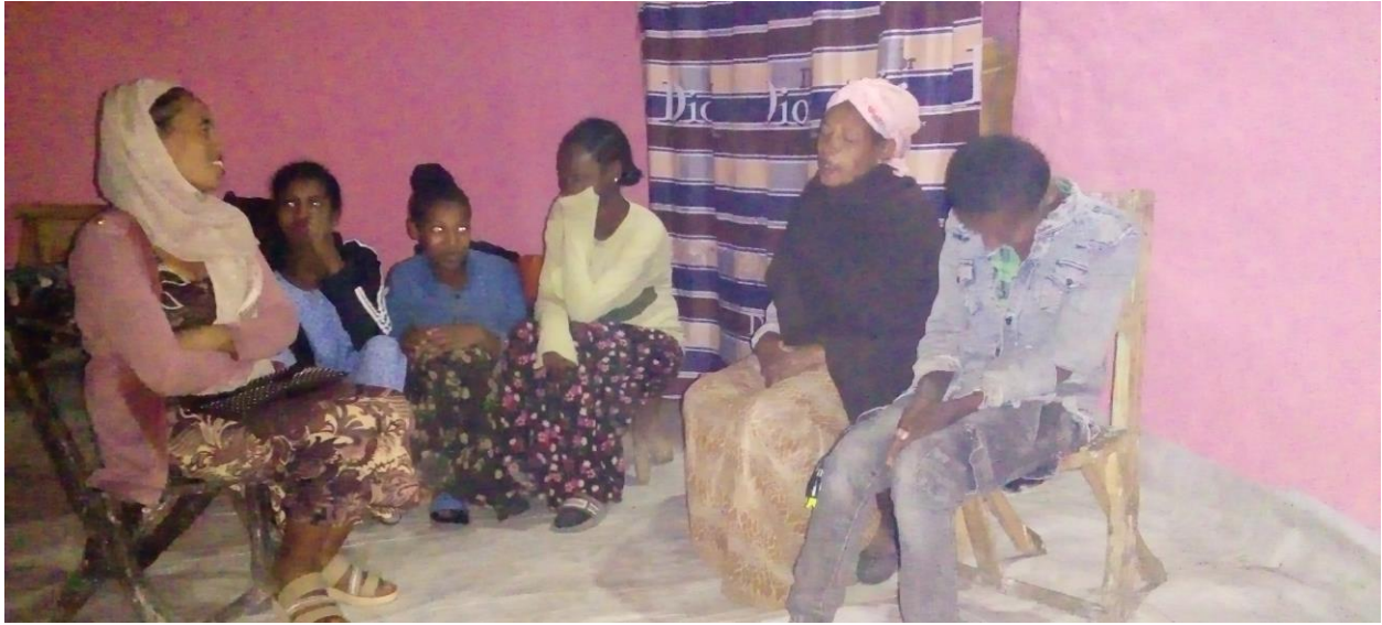
Suura 6 Mana Addee Sobbooqee Galaalchaatti yemmuu Durdurii maatii isaaniitti himan (02/05/2013)

ijoolleerraa maanguddoof gaaffiin ka'ettis, "Sareen foon qaltee hunda olkeessee onnee keessaa "laqam" gootee,..yaadni durduricha keessatti jedhu yemmuu raawwii dubbatameetiin ilaalamu, sareenis kan raawwadhu jedhamte seeran osoo hinraawwatiin dhiistee harree qaltee onnee ishee keessaa nyaattee eeguun isheefis dubbichi du'uma kan ture ta'uudha.. Sareen malaan harreen onnee hinqabdu jechuun jalaa baate malee kan ishees sanumature. Jechi"laqam goote" jedhu haala dubbii himiinsa durduriichaa kan miidhagseefi ijoollee kofalchisuun kan barsiisu ta'uufi sareen abshaalummaan akka du'a jala baate kan hubachiisuudha..