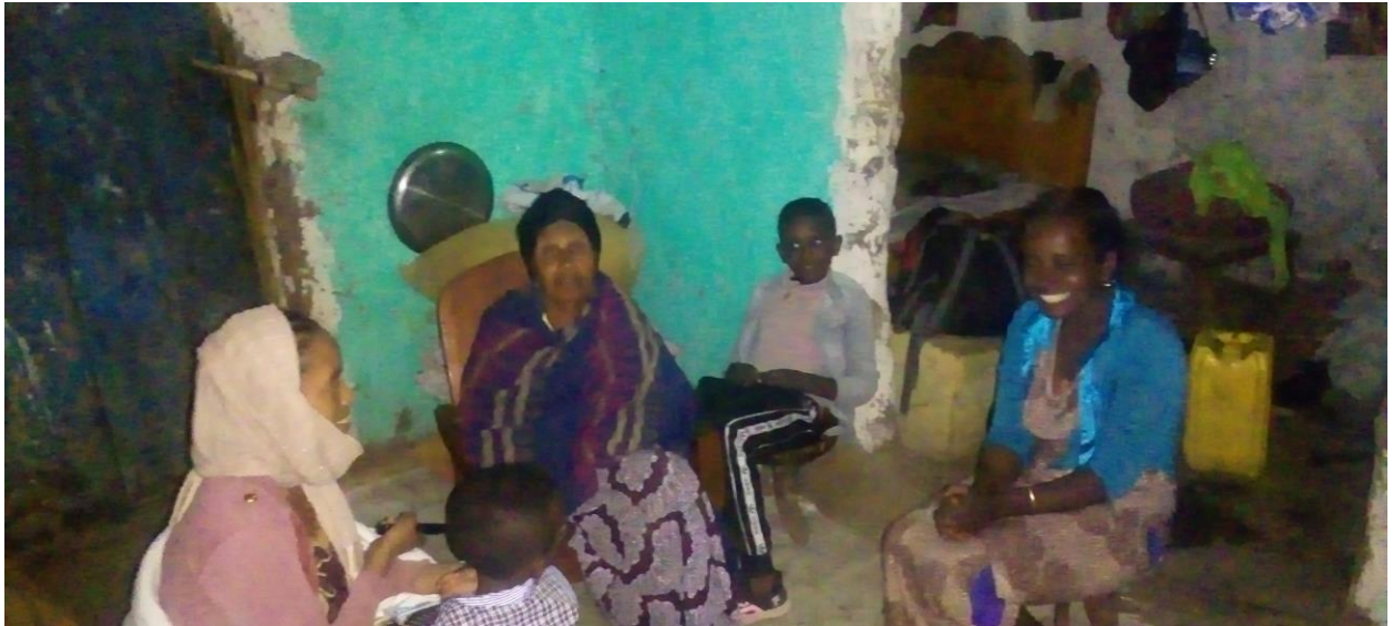
Suuraa 7 Mana Aadde Xiggee Abarraatti galgala maatii isaanitti yemmuu durdurii itti himan (11/05/2013)

maanguddoon deebi'eefiira. Ergaan durdurii kanarraa hubatamus yeroo malee deemuun rakkoof akka nama saaxilu. Qotee bulaan qotiyyoo tiksuu yeroo malee ka'ee halkan deemuun gaarii akka hintaane, haati Awwadaay yookaan seexanni niitii daakuu daakaa keessaa osoo hinmul'atin haadha manaa yookaan niitii daakuu daaktu jalaa hattee muroo naqattee gattee deemuun carraan hatuu harkaa bu'ee seexanni ijaan hinmul'anne rifaatuun ijaan mul'atte. Kuni immoo hatuun akka carraa nama harkaa buusu namatti akeekkachiisa. Akkasumas, dhokatani hatan karaa biraan waa biraa dhabuun akka jiru nama hubachiisa. Walumaagalatti haalli raawwii durdurii kanaa, jalqabarra yaada hubannoof ta'u, Ka'aniiti kaa....bara duriiti kaa... duratti, tureyyu, Namichatu halkaniin ka'ee...., “ jechuun xiyyeefannoon akka raawwii durdurichaa hodofan taasiseera. Durdurii yeroo himanis, maqaaleen maqaa biroo bakka bu'uun yaada namaa harkisan fayyadamuun jiraachuufi xumura durduriichaa irrattis,” jedhamakaa “ yoo jedhani dubbatan, kunis, akkas ta'e , raawwatameera, yaada jedhu hubachiisuuf yaada durdurichaa sammuu namaa keessa ka'uun bifa durdurichi itti xumurametu mul'ata. Suuraarmaan gadiitiin raawwii kana hubachuun ni danda'ama.