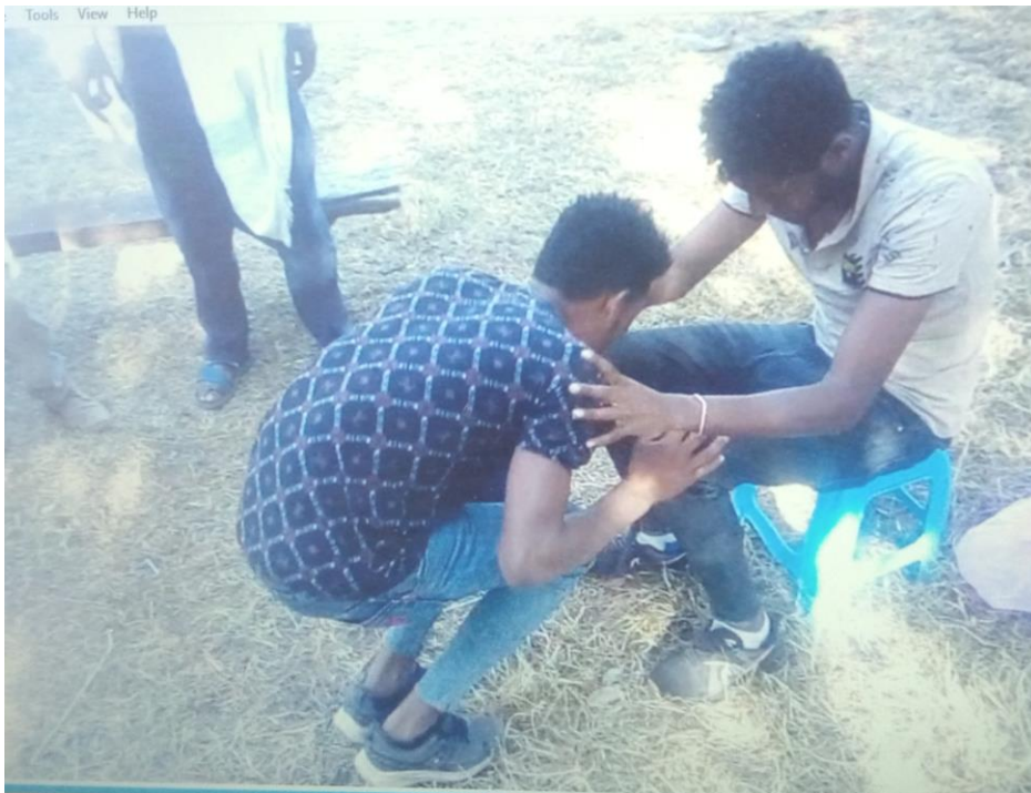
Suura 4 Yemmuu Araara Xumuranii Ebbisuun Waldhungachiisan