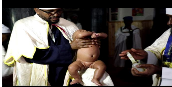
ፎቶ 14 መሪው ካህን የሕፃኗን የተለያዩ የአካል ክፍሎች ሜሮን ሲቀጧት በከፊል

መጽሐፈ ክርስትናው ላይ በግዕዝ ማንበብ ጀመሩ። “የንባቡ ይዘትም በመንፈስ ቅዱስ በረከት የተሞላችሁ ሁኑ፤ በኢየሱስ ክርስቶስ ስም የእግዚአብሔር ንጹሕ ሀብት ኹሉ የሚል ነበር።”