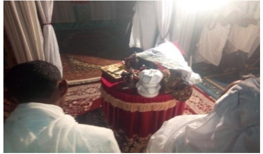
ሰተክሊል ሥርዓተ ክዋኔ የቀረቡ ቁሶች በከፊል