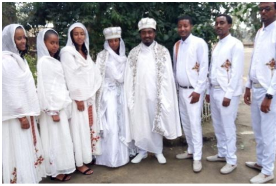
ሙሽሮች ከሚዜዎቻቸው ጋር