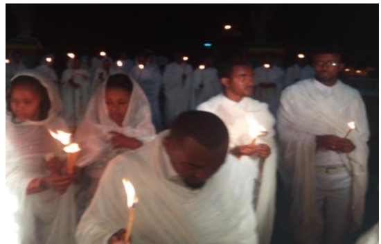
ሙሽሮች ጧፍ እያበሩ ወደ ቤተ ክርስቲያን ሲገቡ በከፊል የሚያሳይ