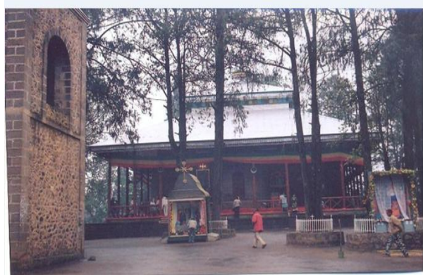
እንጦጦ ሐመረ ኖኅ ኪዳነ ምህረት ገዳም ቤተ ክርስቲያን