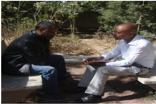
አጥኚው በቃለ መጠይቅ ወቅት