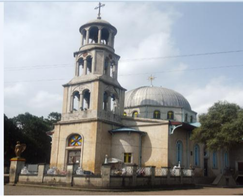
የመንበረ ፓትርያርክ ቅድስተ ቅዱሳን ማርያም ገዳም ቤተ ክርስቲያን