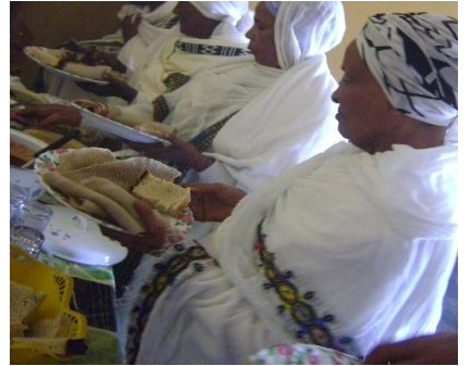
በክርስትና ወቅት የተጠሩ ሰዎች እና አቋቋሚዎች በመመገብ ላይ