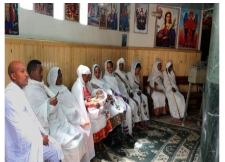
አፕሪል 19 ቀን በምልክታ ወቅት በደብረ ሊባኖስ ገዳም በከፊል