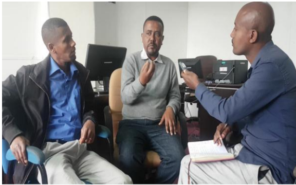
አጥኚው በመረጃ ሰጪዎች ቢሮ መረጃዎችን ሲሰበስብ