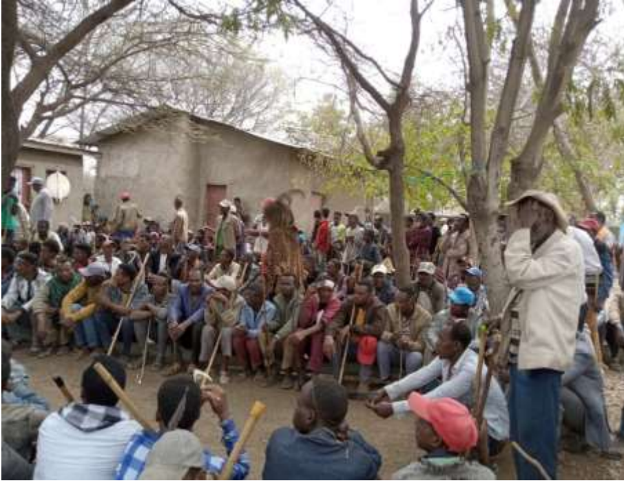
Marii Foollee Roobalee dhimma hawaasummaa(Guraandhala,2014)