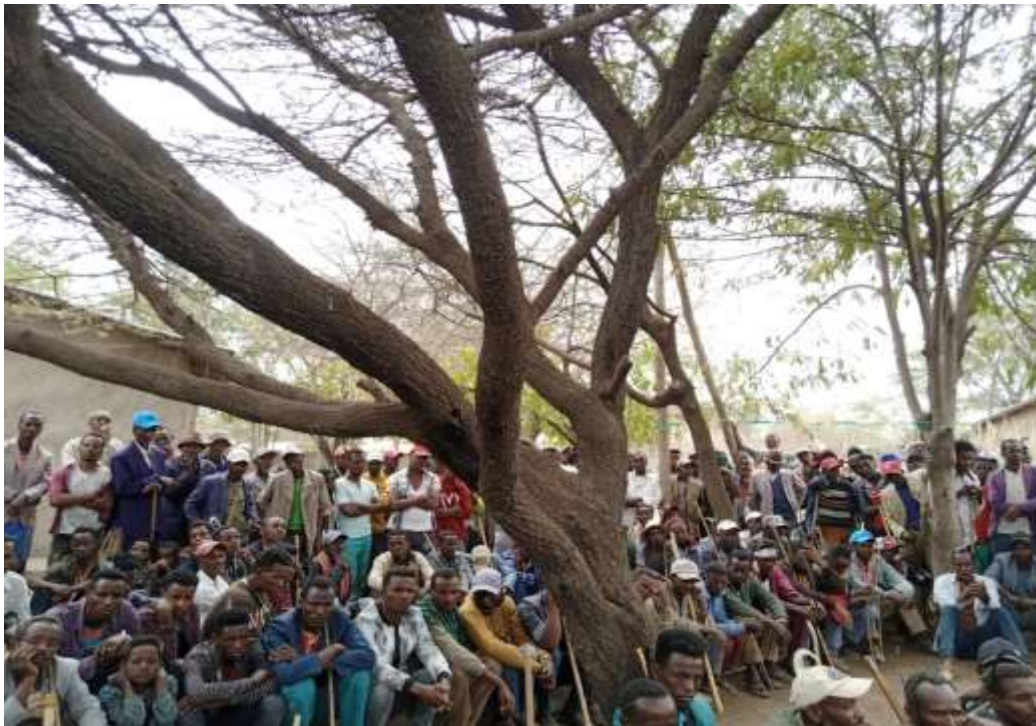
Fakkii . Warri Gadaafi gareen Baabsaa dhimmoota daangaafi kanmneen biroorratti yeroo mari'atan