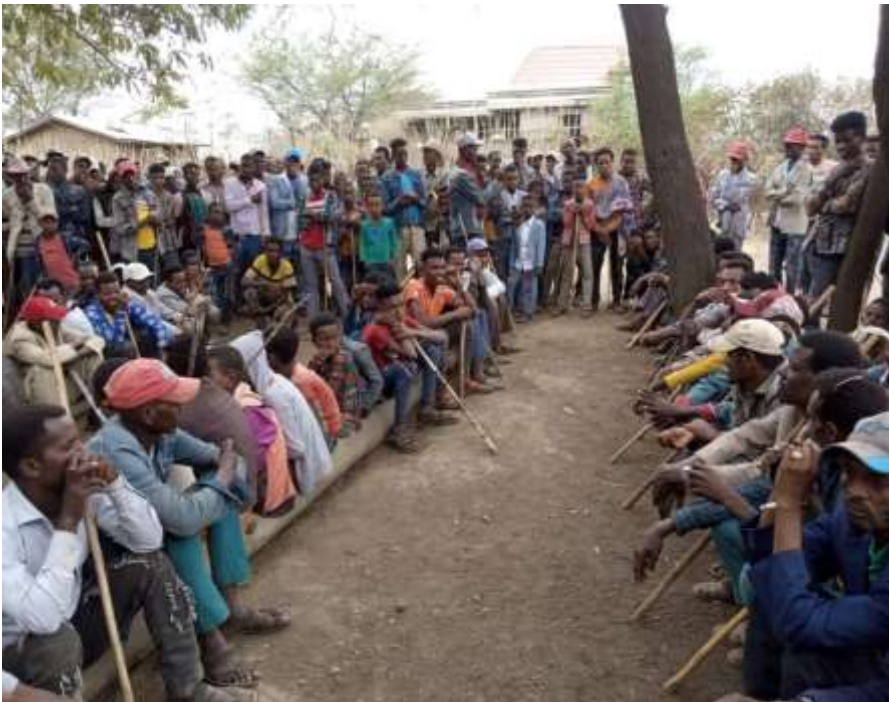
Yeroo walga'ii Qixxee Gosaa (Abbootaafi Ijoollotaa, Bitootessa,2014)