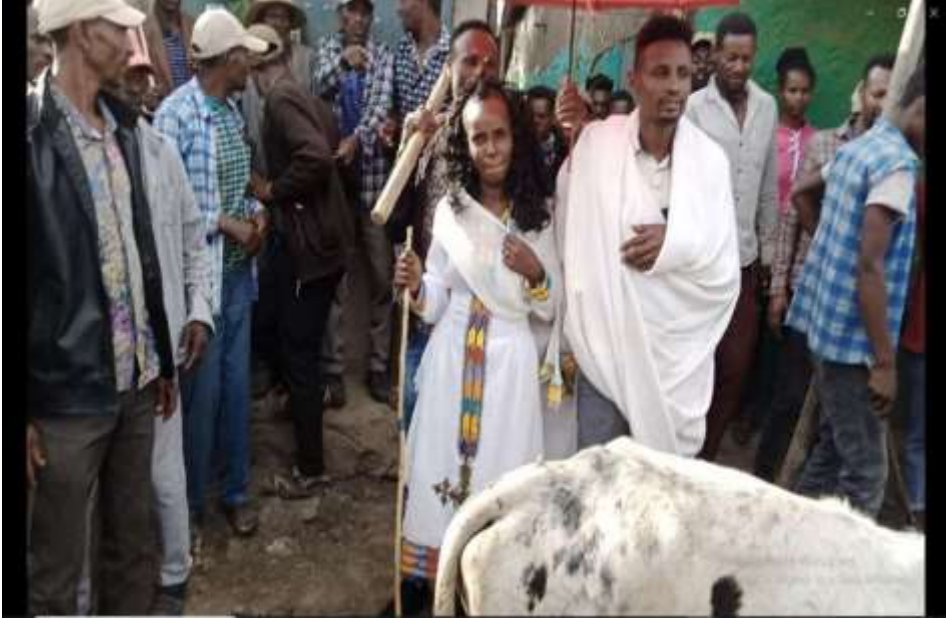
Foollee Roobalee yeroo Sigabaa muran