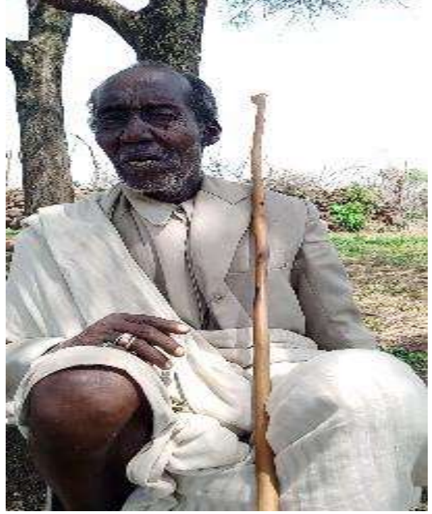
Warra ayyaantuu Qumbii Roobaa naannoo Ujuba Boosat Luumeetti(Onkoloolessa 2014 )