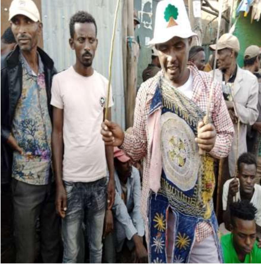
Walga'ii Qixxee Firaarratti Ilma Abbaatti yakke yeroo adabanii sirreessan (Sadaasa,2013)