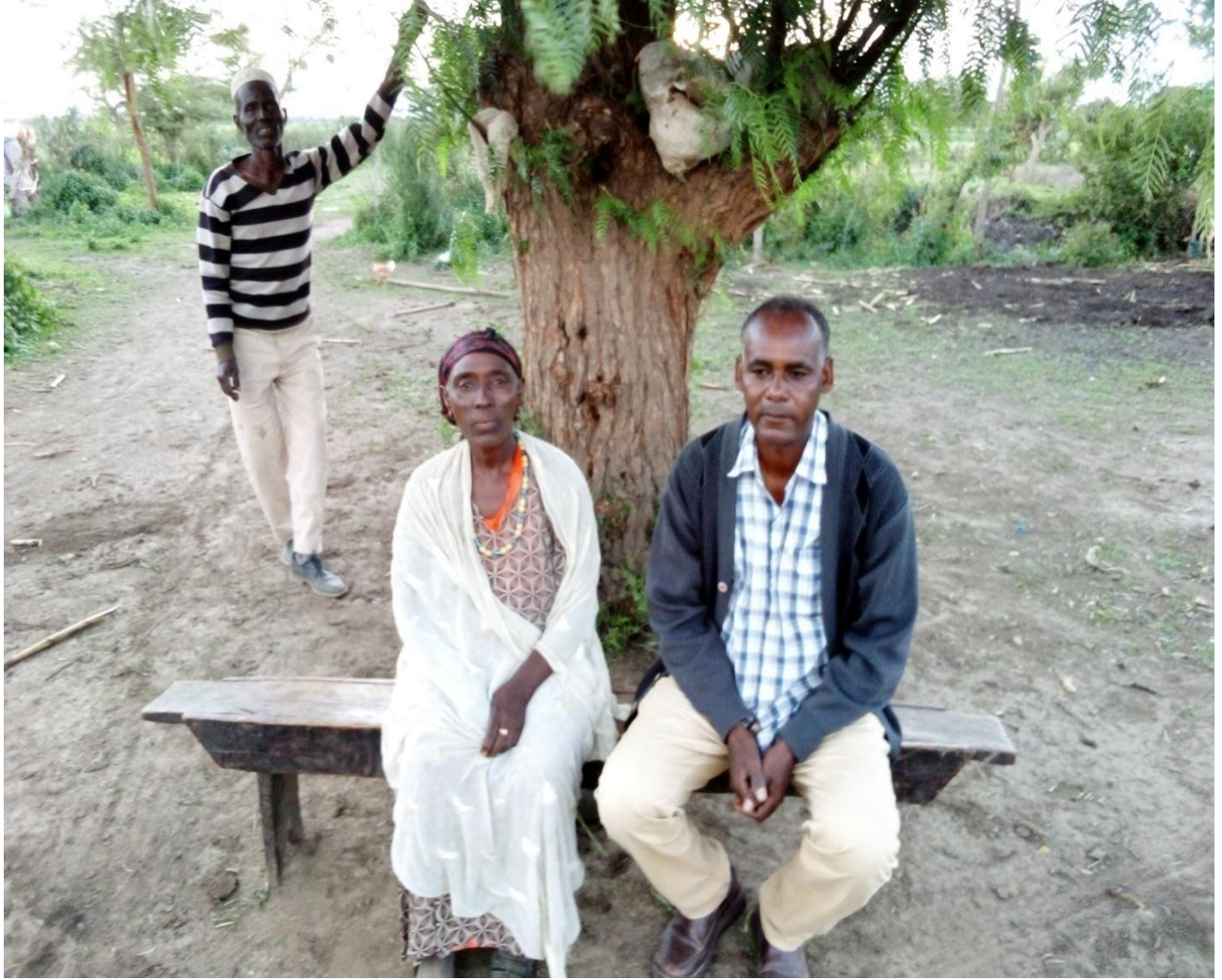
Adde.Tuullaa Watagoo---odeef kennituu/07/08/2013