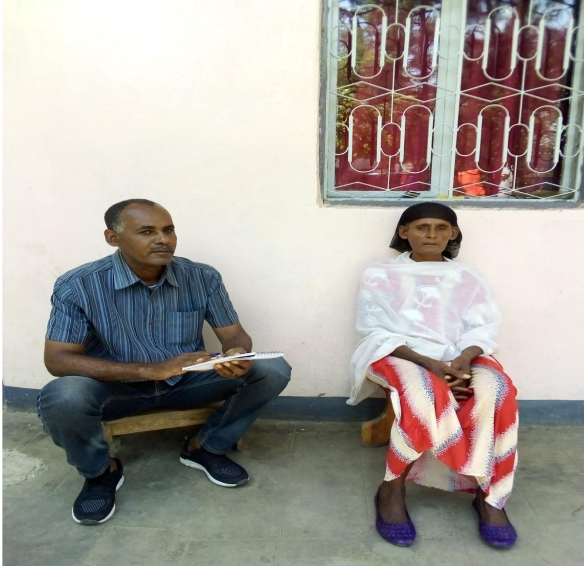
Aaddee Shukkaaree Jaldoo—odeef kennituu