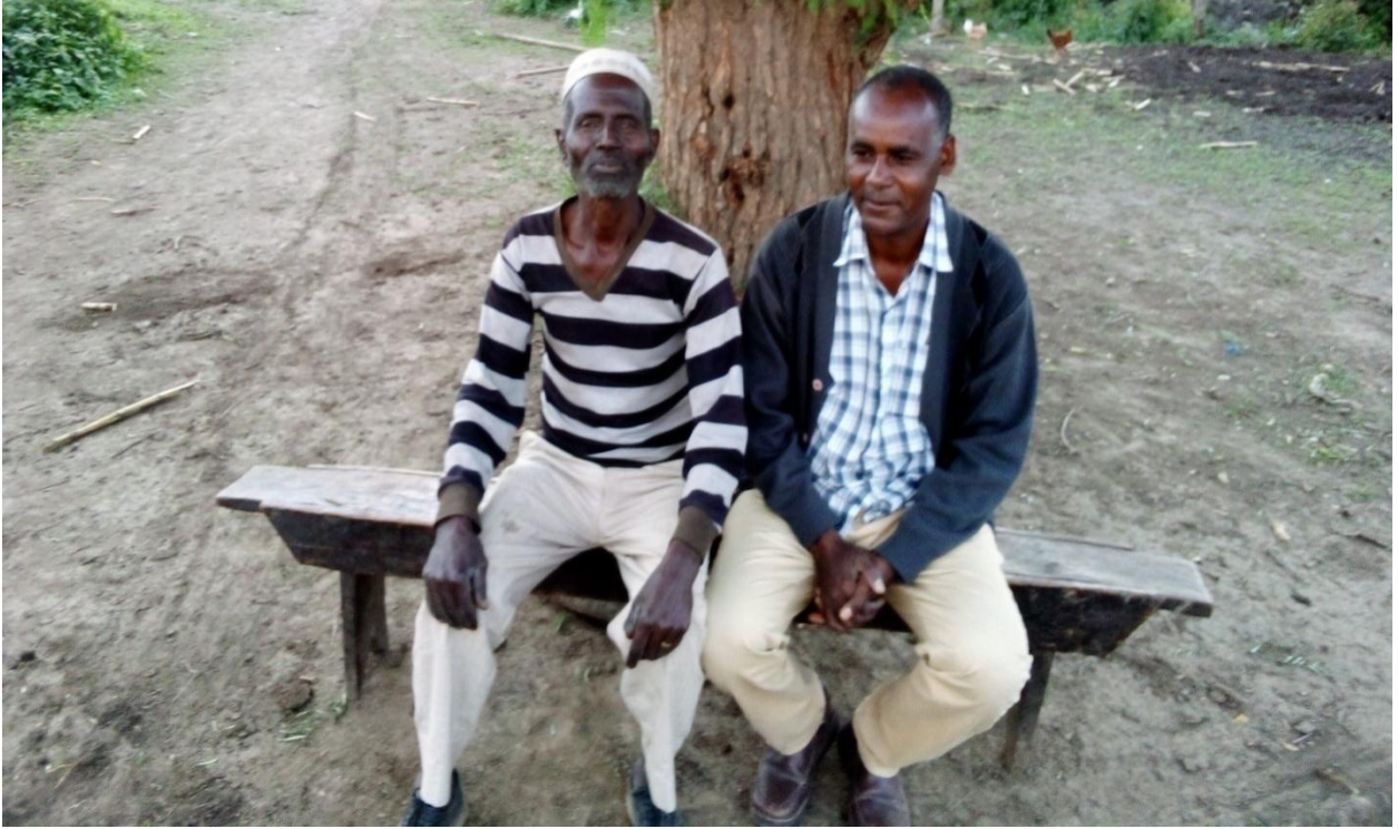
Ob.Gannaa Teessiso----odeef kennaa/07/08/2013