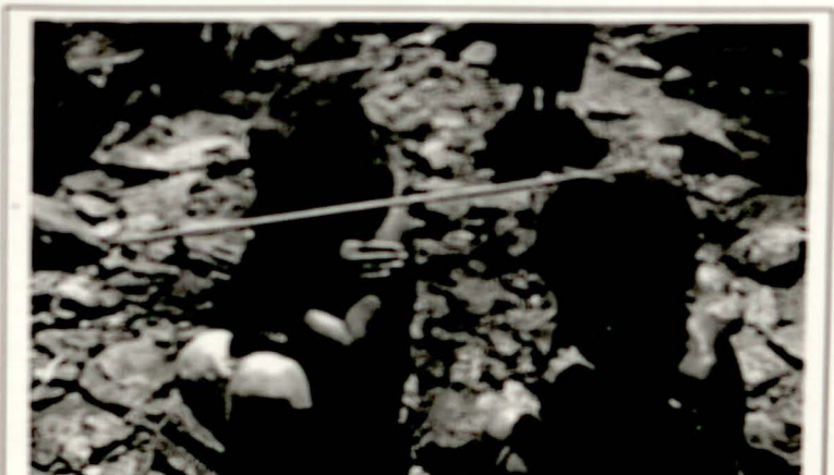
ሐይማኖታዊ የቡዳ ጥቃት (ልቦናን የመመለስ) ስርዓት