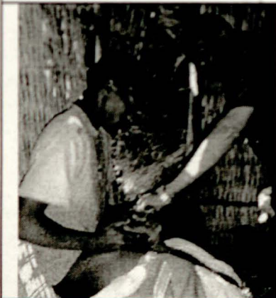
መድሃኒት ማጠጣትና የቡዳውን ማንነት መለየት