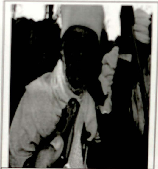
ቴስ መልክ ሰነድ ገጽ ገጽ