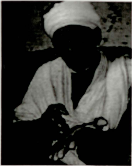
መርገታ ለግብርና ሰነድ ገጽ ገጽ