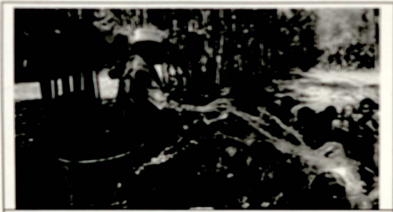
የጸበል እርጭት ስርዓት በቆላይባ ከተማ ትዳስ ሚካኤል ቤተ ክርስቲያን