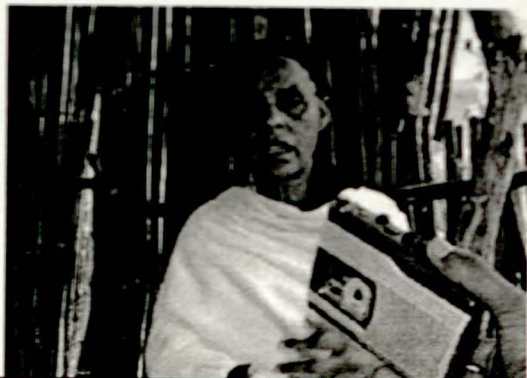
ወይዘሮ ለሁሽ ገጽ