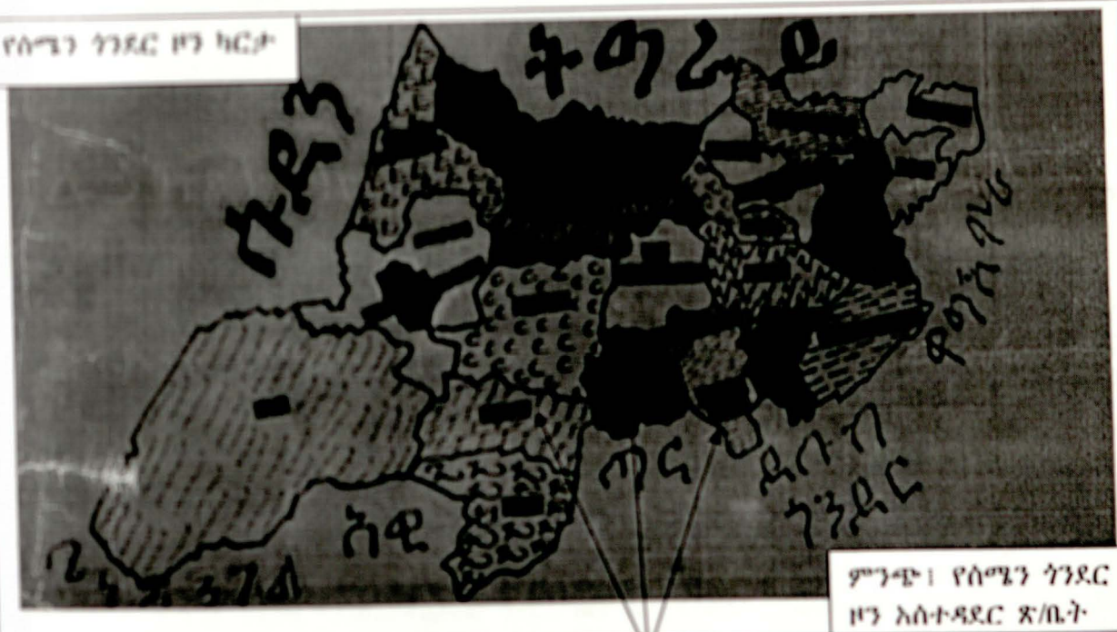
ጥናቱ ያተኮረባቸው ወረዳዎች