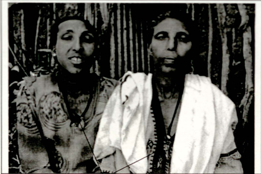
ንቅሳት፣ ብረትና የቡዳ መድሃኒት