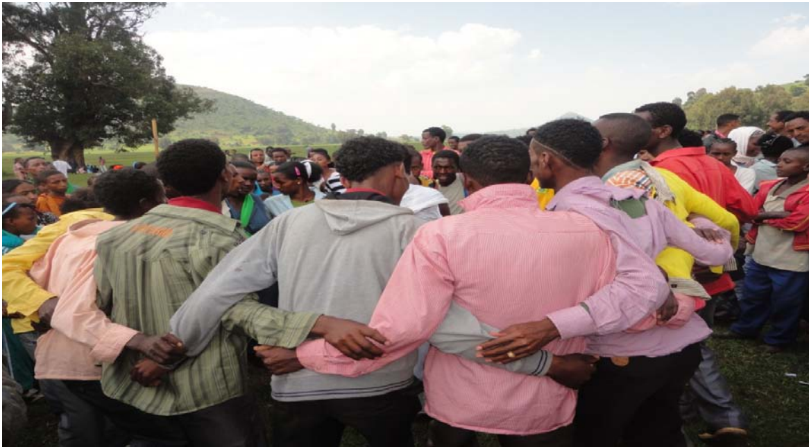
Aanaa Jimmaa Gannatii ganda Caaroo Goobanootti dargaggoonni yommuu sirba masqalaa sirban (2011)