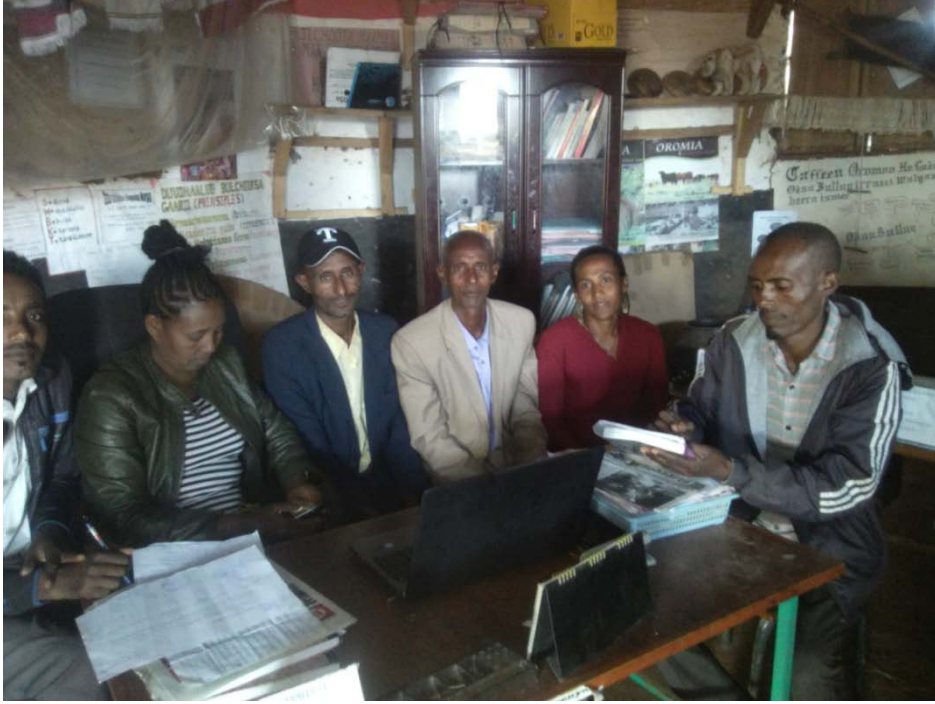
suuraa Afgaaffii maree garee Waajira Aadaafi Tuurizimii Aanaa Jimmaa Gannatiitti