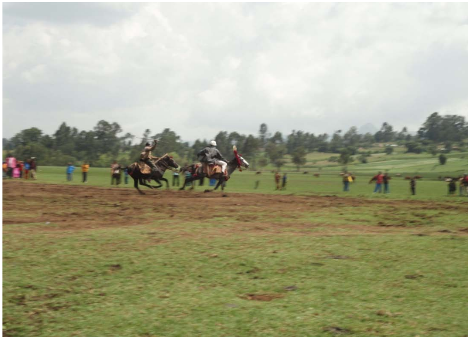
Gaggeeffame kan ibsu.