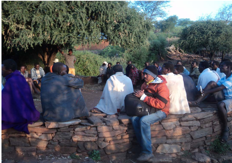
ፎቶ 12 በቀጠና ዘጠኝ ሞራ የነበረን ፍትህ ሃይት በመመልከት ለይ