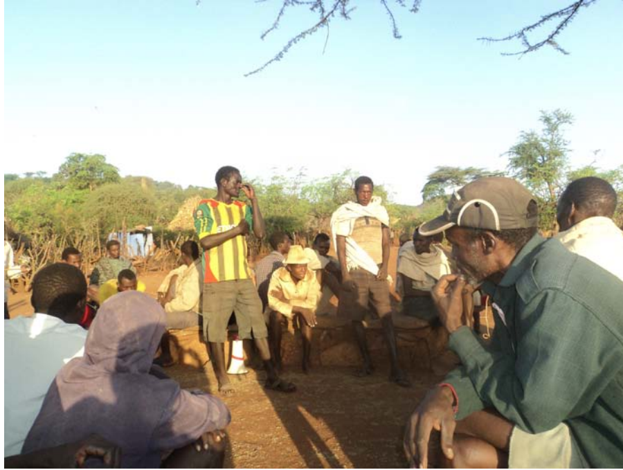
ፎቶ 6 በዳይና ተበዳይ በሞራው መሃል ከአባዳባው ፊት ሲሟገቱ