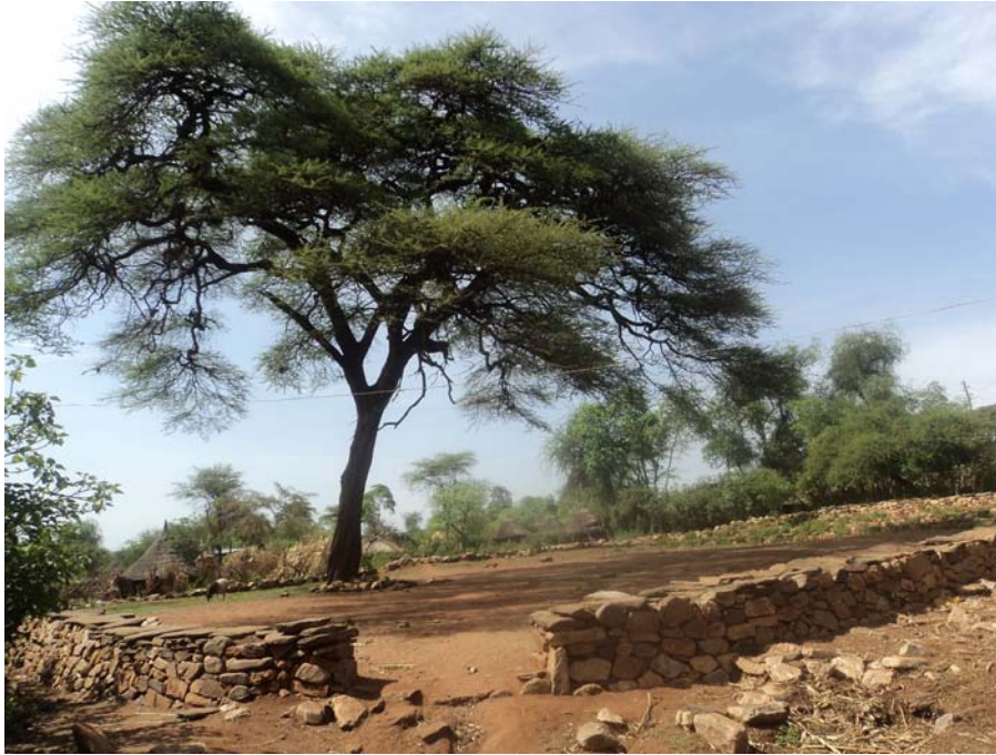
ፎቶ 4 በዋናው አባዳባ የሚታዩ የቀበሌው ህዝብ ሁሉ የሚሳተፍባቸው ጉዳዮች የሚታዩበት ዋነኛው ሞራ(ቆራኦኛ)