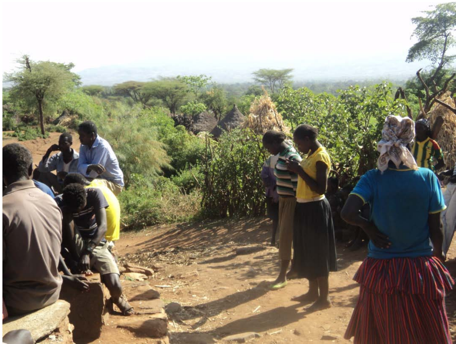
ፎቶ 7 ሴቶች ከሞራው ውጭ በመሆን ሲሟገቱ