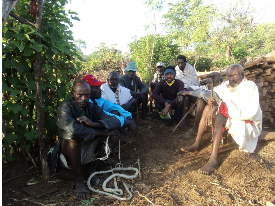
ፎቶ 11 ከስምንቱም ጎሳ መሪዎች ጋር በባህላዊ የእርቅ ስነስርዓቱ ውስጥ ስለነበራቸው ማና ውይይት ሲደረግ