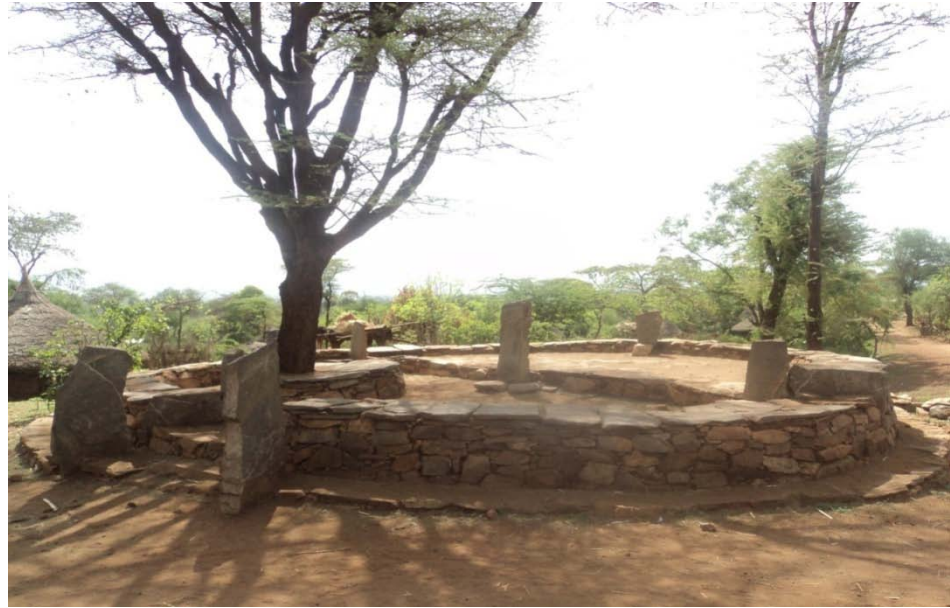
ፎቶ 1:- በአንድ መንደር ውስጥ ያለ ሞራ ምስል።

ሞራ(መሸንጎያ):- ሞራ ማለት በቀጥታ ወደ አማርኛ ሲመለስ መሸንጎያ ወይም የፍርድ አደባባይ ማለት ነው። በየቀጠናው እና በየጎጡ ይገኛል። ዙሪያውን በድንጋይ የተካበ ሲሆን መሃሉ ላይ እንደጥላ የሚያገለግል ዛፍ አለ። ከዕርቅ ስነስርዓት ውጭ ጎልማሶችና ሽማግሌዎች ገበጣ ይጫወቱበታል። ሙሉ ሁኔታውን ከታችየቀረበውምስልያስረዳል።