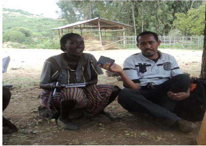
ፎቶ 12 ከካፒና ሉዳይዳ ጋር ሴቶች በባህላዊ የእርቅ ስነስርዓቱ የሚሰጣቸውን ቦታ በተመለከተ የተደረገ ቃለ ምልልስ