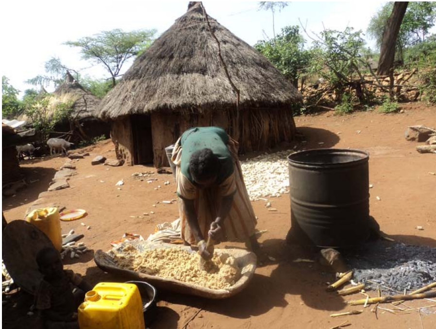
ፎቶ 5 በእርቅ ስነስርዓት ውስጥ ከእርድ ቀጥሎ መታረቅን ከሚያበስሩ ባህላዊ መጠጦች አንዱ ጨቃ ሲዘጋጅ በከፊል